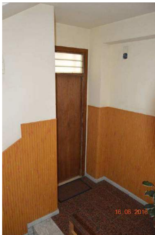
Foto 07 – Stabile condominiale di via Libertà n.33: pianerottolo piano secondo