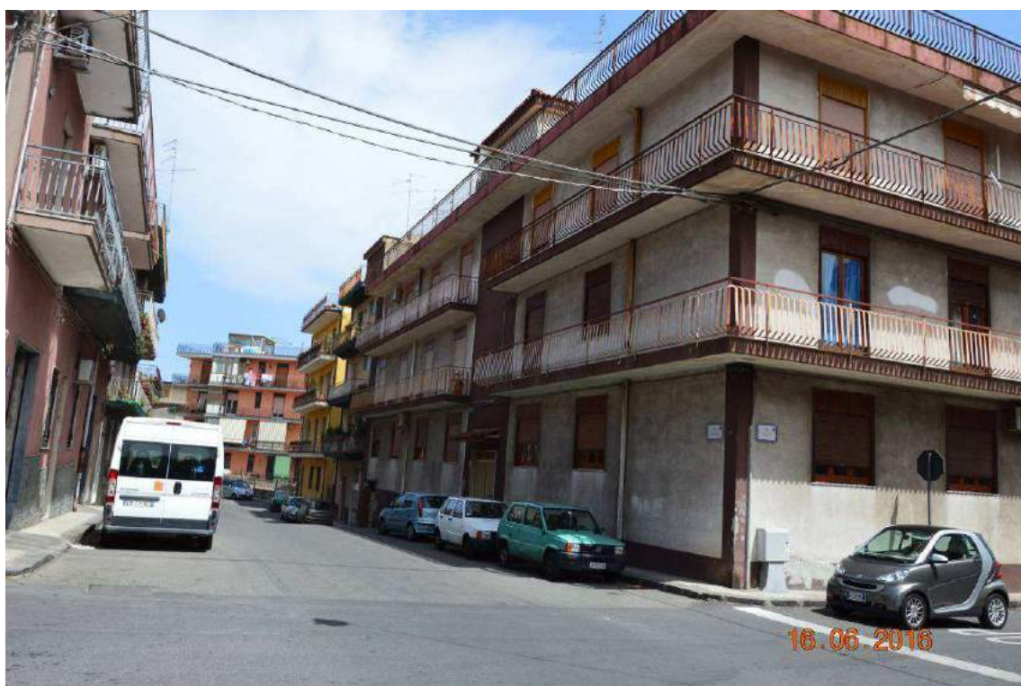
Foto 03 – Stabile condominiale di via Libertà n.33: prospetto nord - ovest