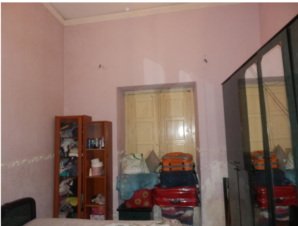
Fig. 7: camera da letto