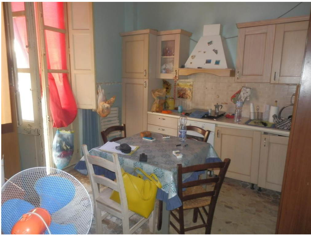
Fig. 9: Cucina