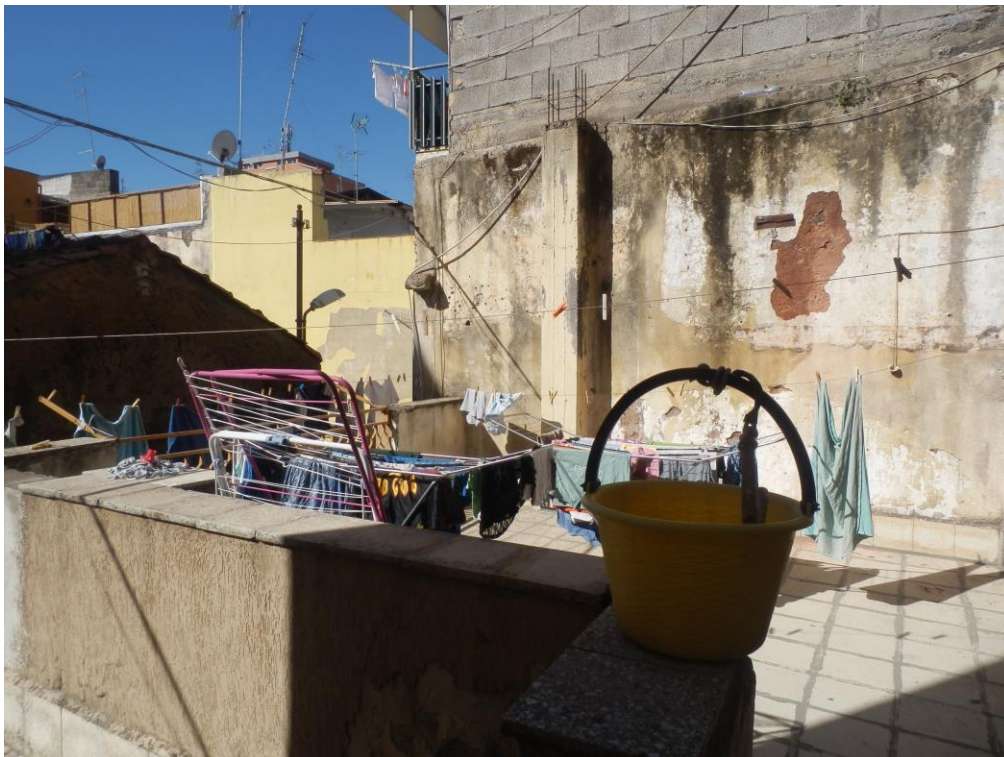
Fig. 13: terrazzo