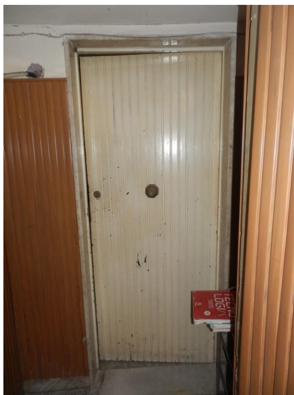
Fig. 4: porta d'ingresso