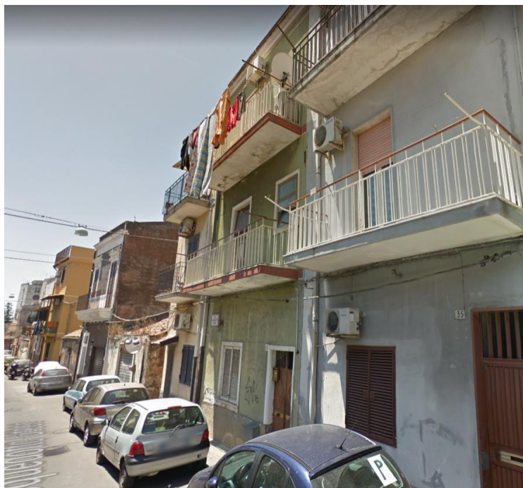
Fig. 1: prospetto su Via Acquedotto Greco