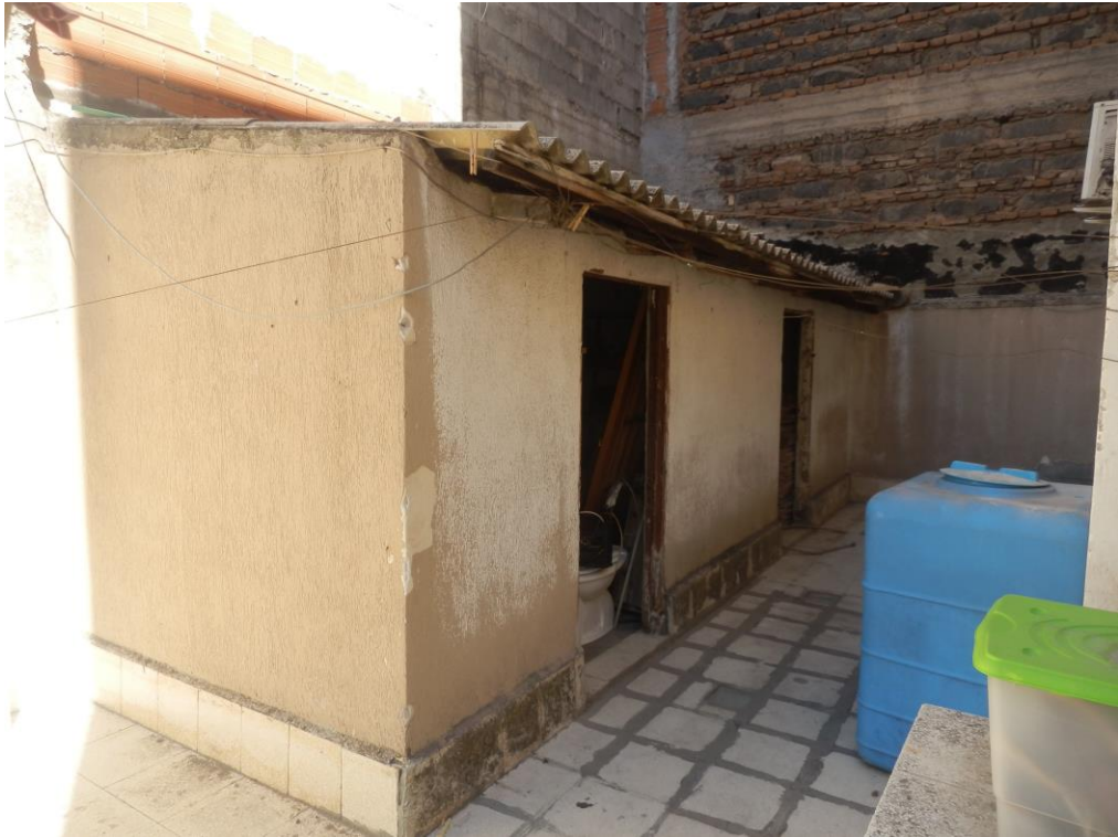
Fig. 15: ripostiglio esterno