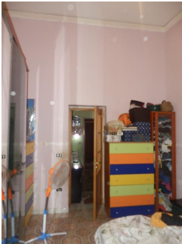
Fig. 8: camera da letto