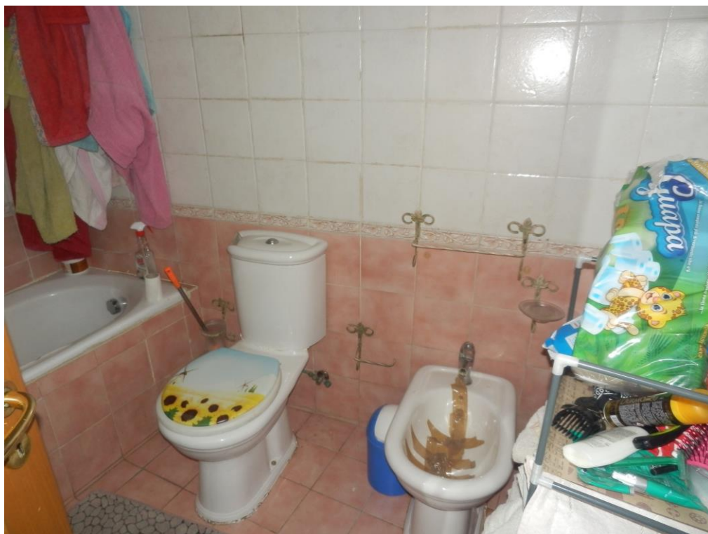
Fig. 11: bagno