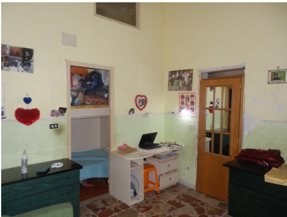
Fig. 5: soggiorno