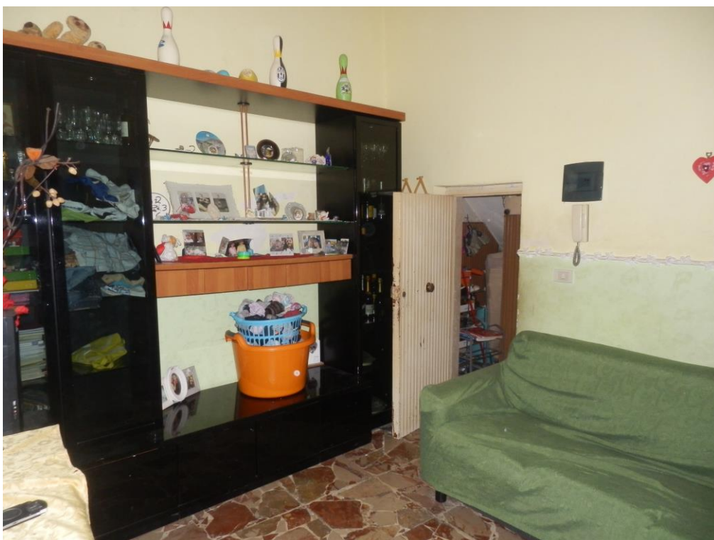
Fig. 6: soggiorno