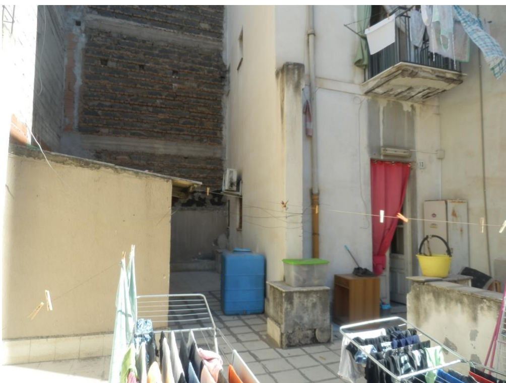
Fig. 14: terrazzo