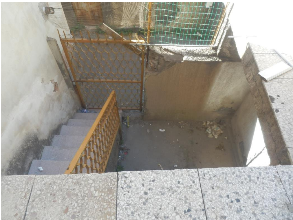
Fig. 16: ingresso secondario