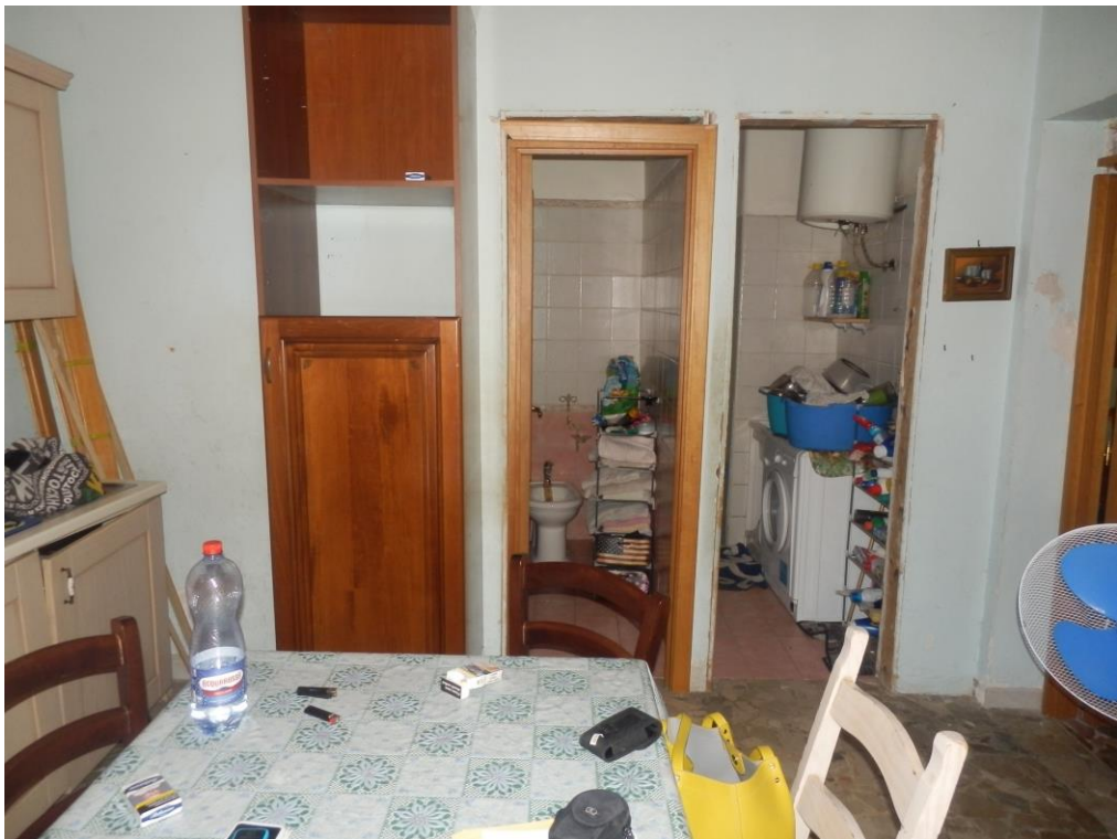
Fig. 10: Cucina