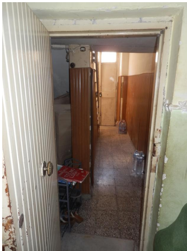
Fig. 3: androne comune