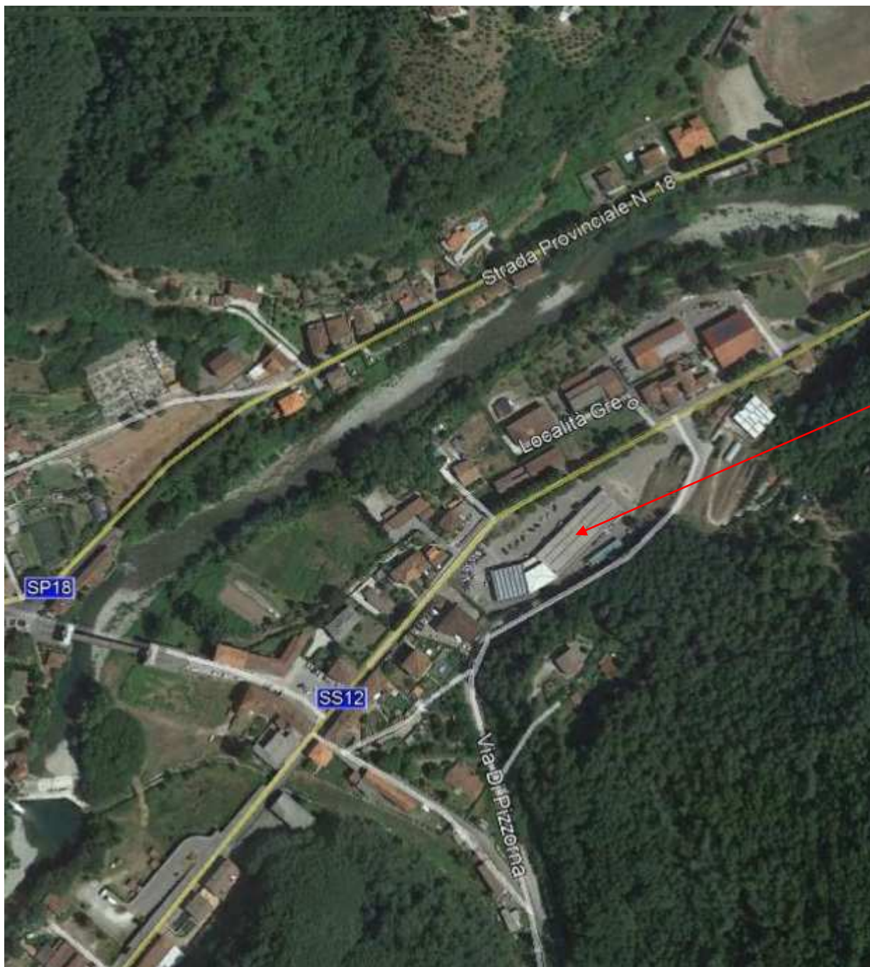
Ripresa satellitare “A”

Complesso immobiliare in Borgo a Mozzano (Lu), frazione Chifenti, S.S.12 del Brennero snc