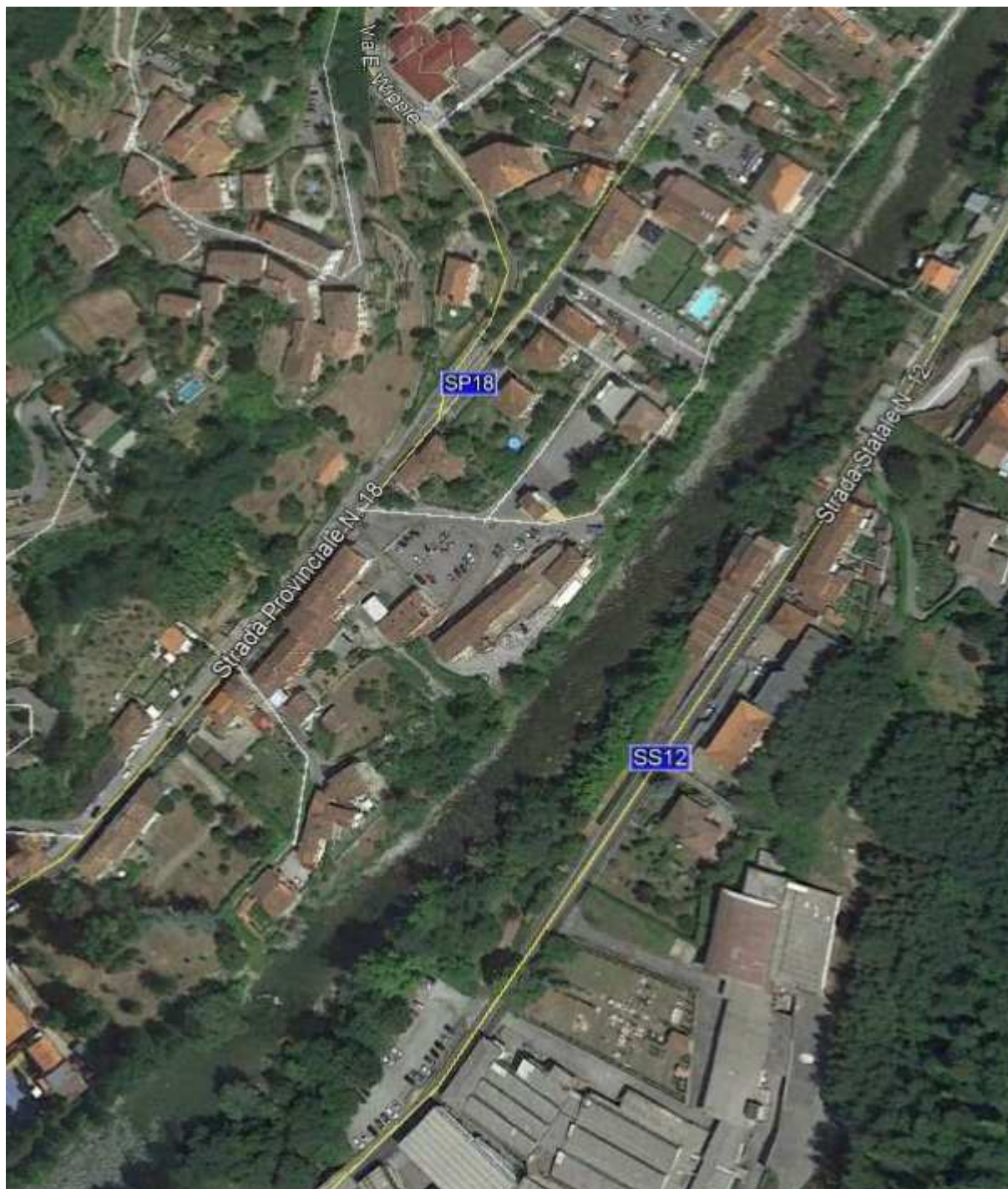
Ripresa satellitare "B"