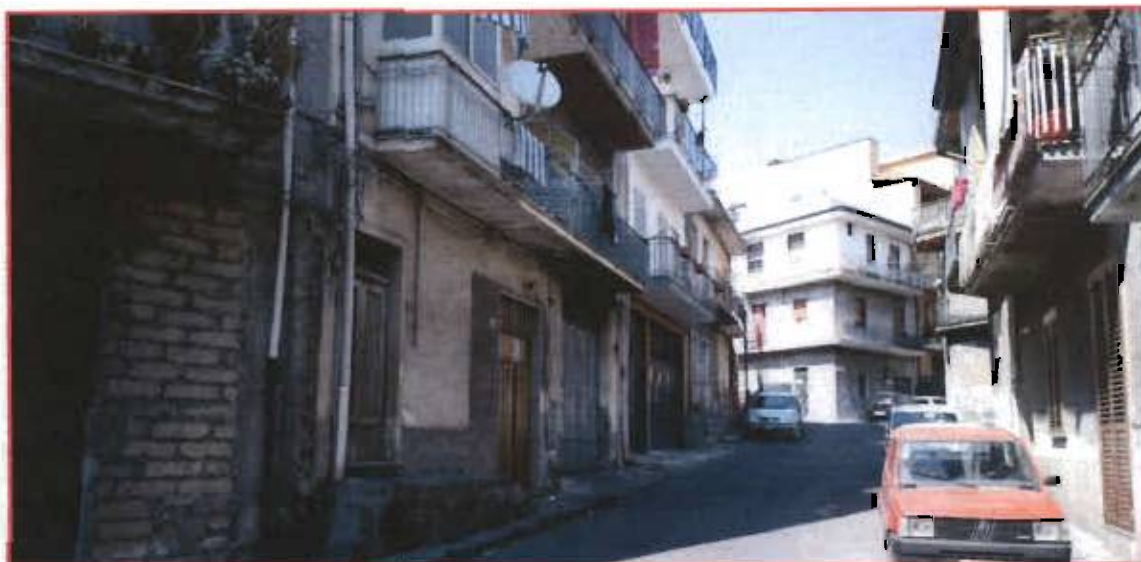
Foto 1: Scorcio della via Vesuvio con vista della palazzina in esame posta sulla sinistra