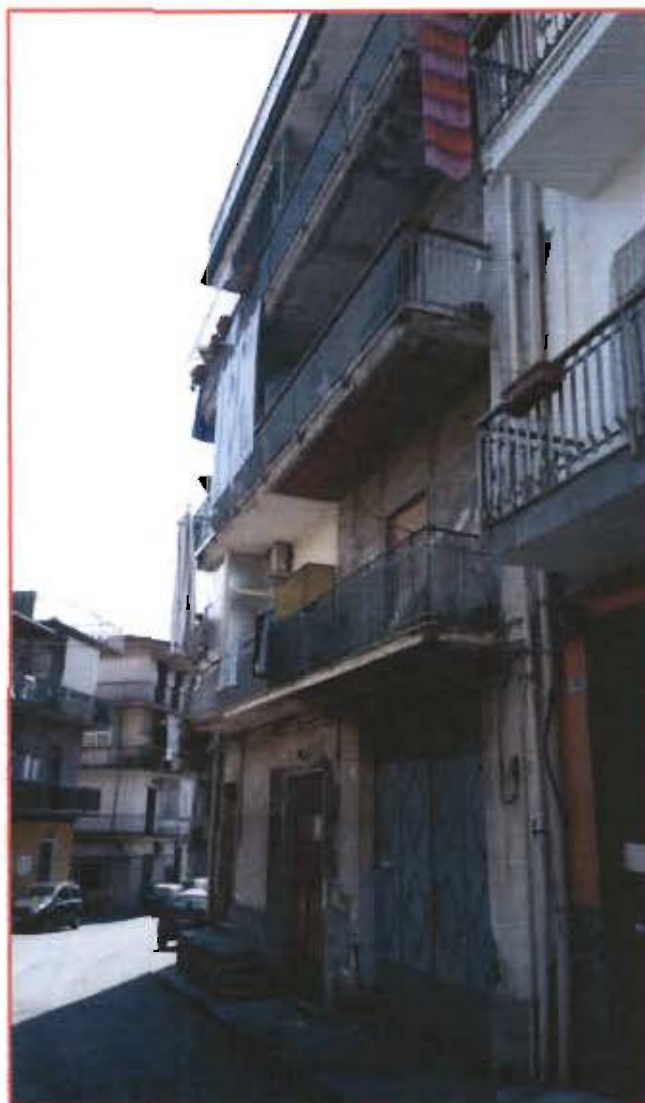
Foto 2: Prospetto lato sud della palazzina ove ha sede l'immobile posto al primo piano.