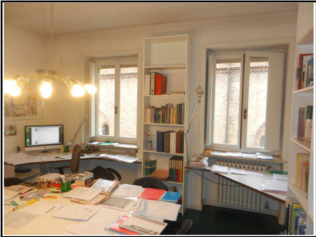
Foto 9 Ufficio