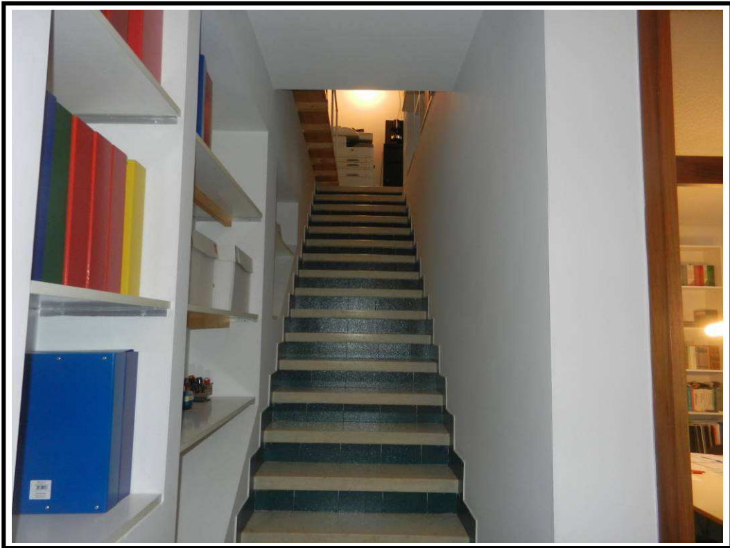
Foto 11 Vano scala interno