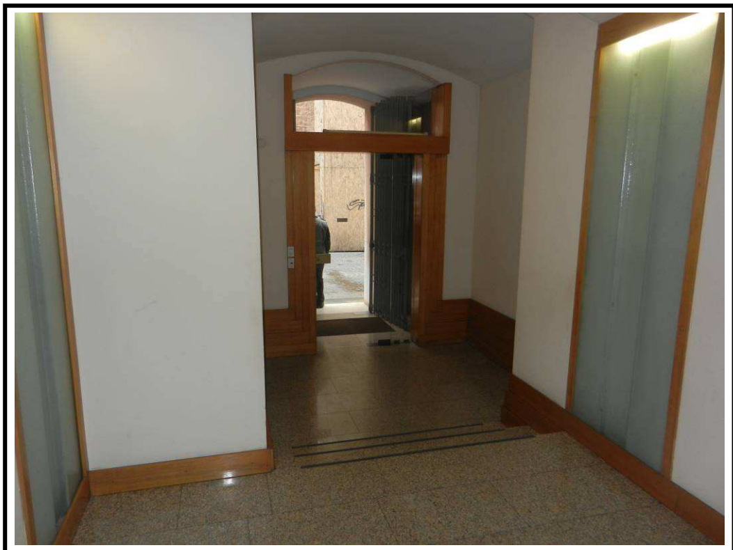
Foto 2 Ingresso condominiale