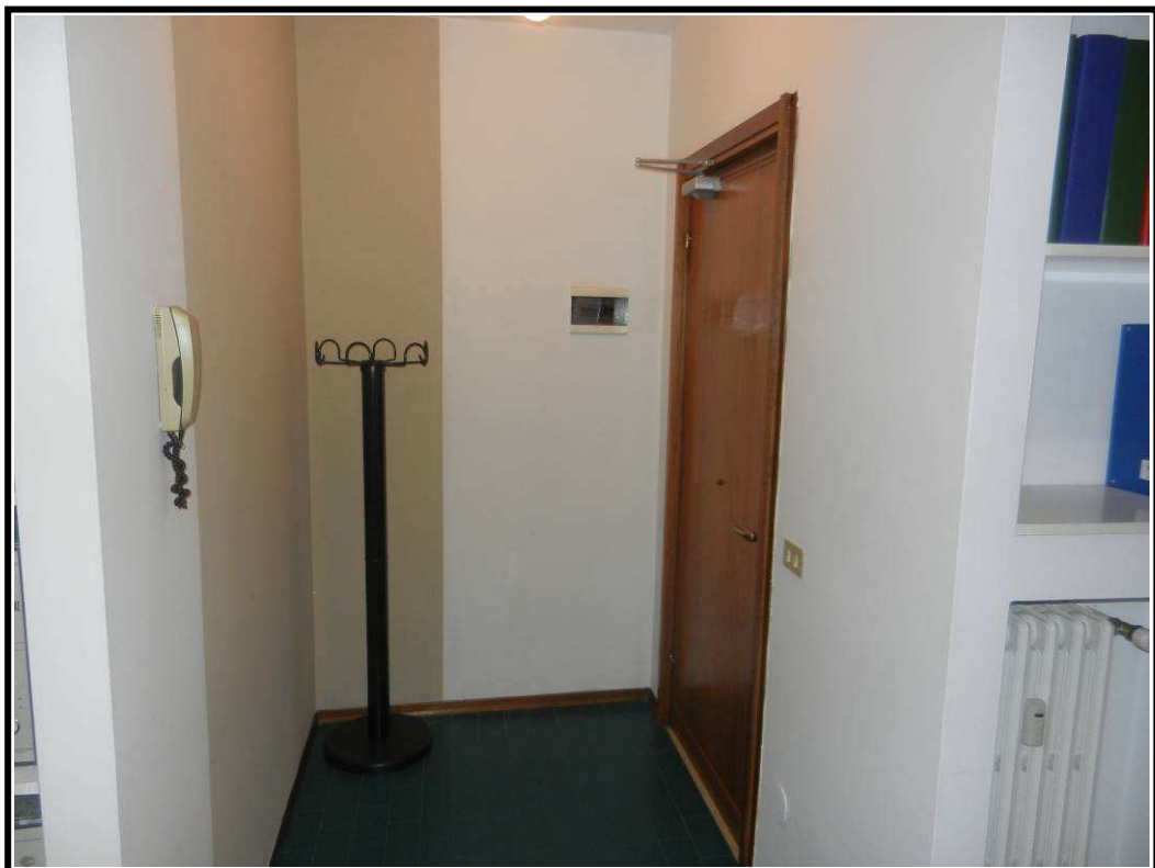
Foto 8 Ingresso Sub 306