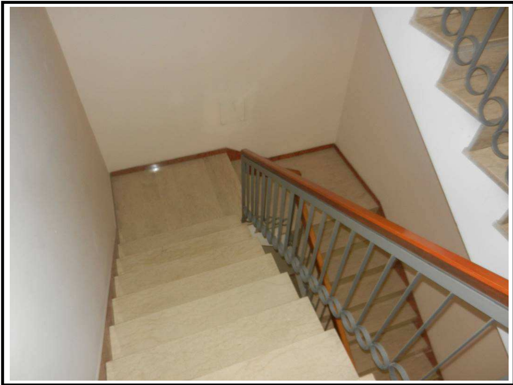
Foto 7 Vano scala comune