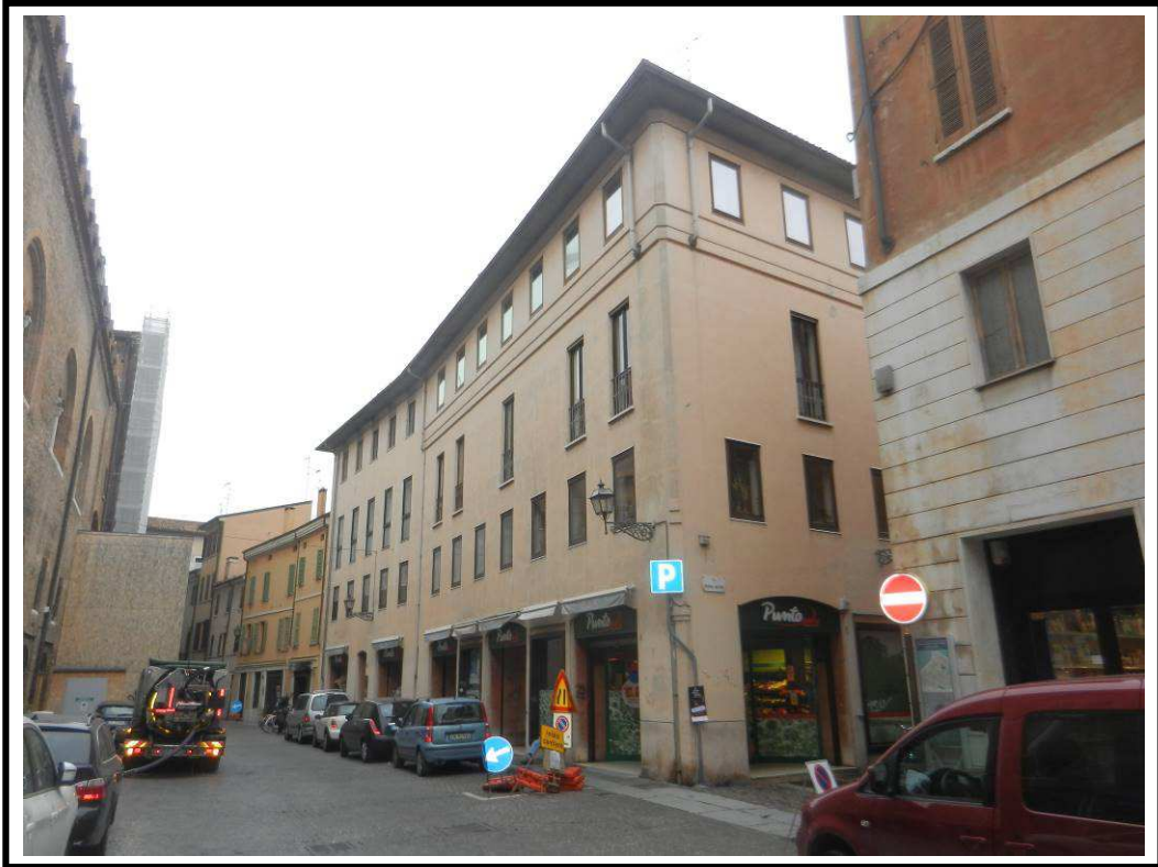
Foto 1 Prospetto dalla Via Giustizati