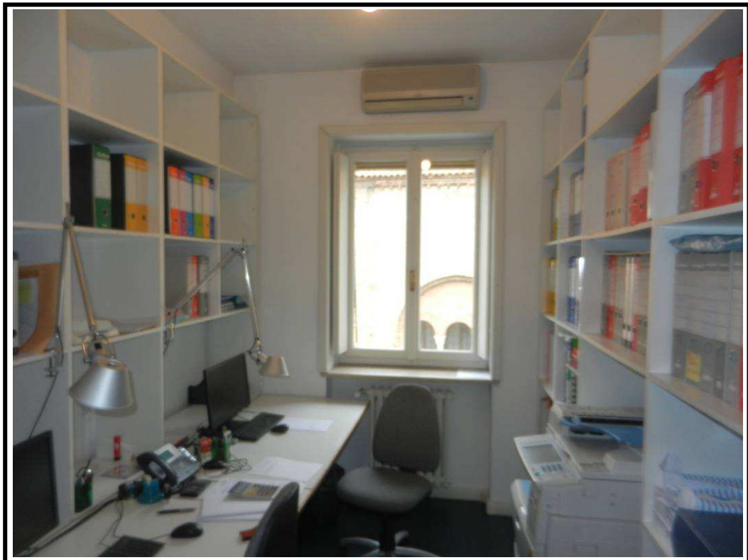
Foto 10 Ufficio