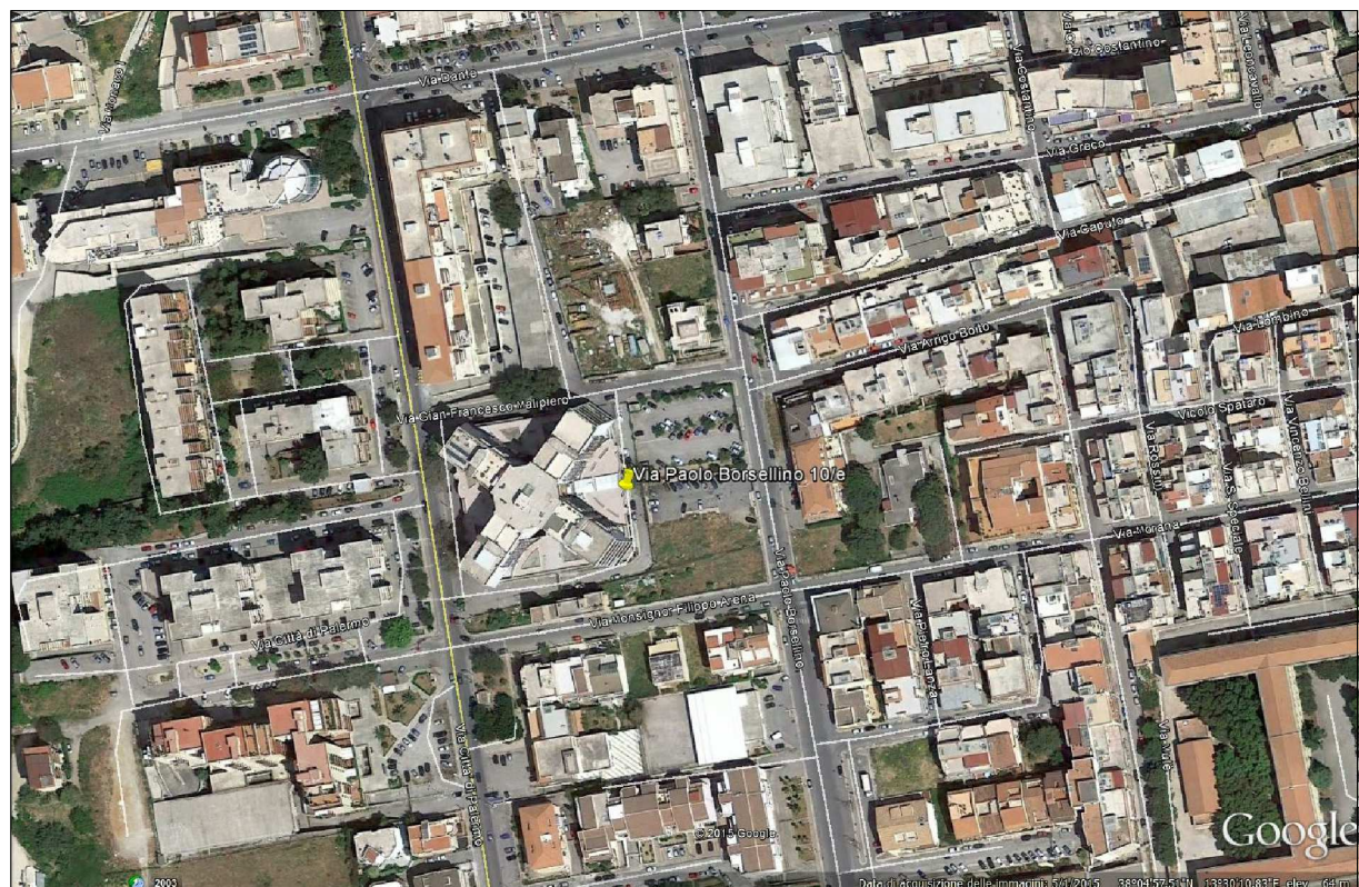
Foto 2 - Particolare della zona con evidenziato l'edificio