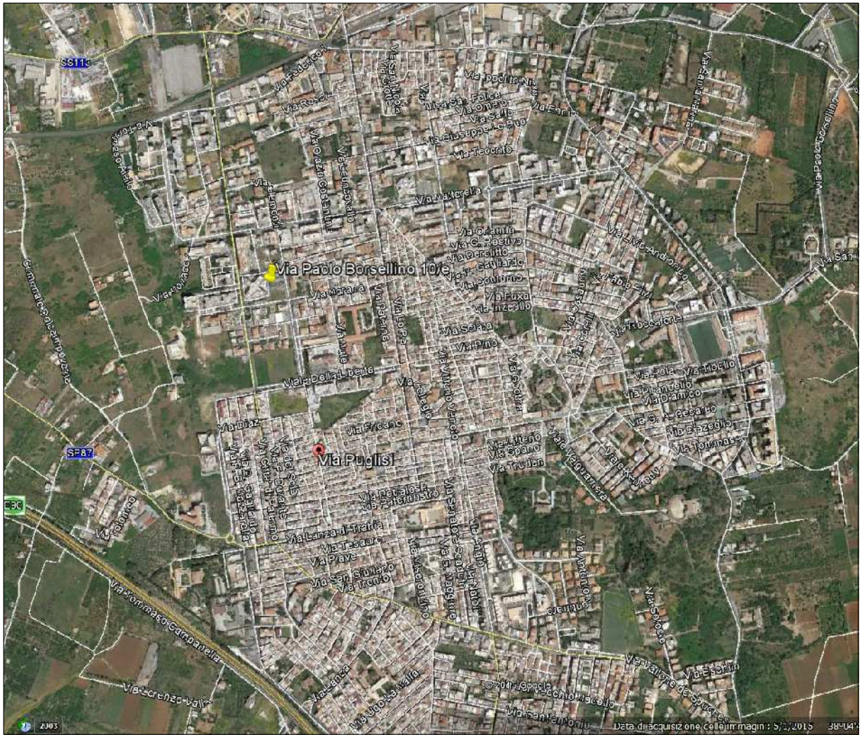
Foto 1 - Individuazione della zona dov'è ubicato l'edificio rispetto al centro abitato di Bagheria