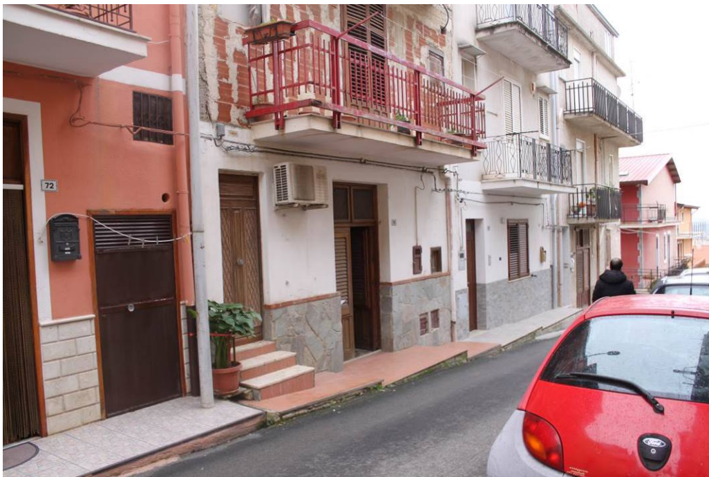
03 - 02