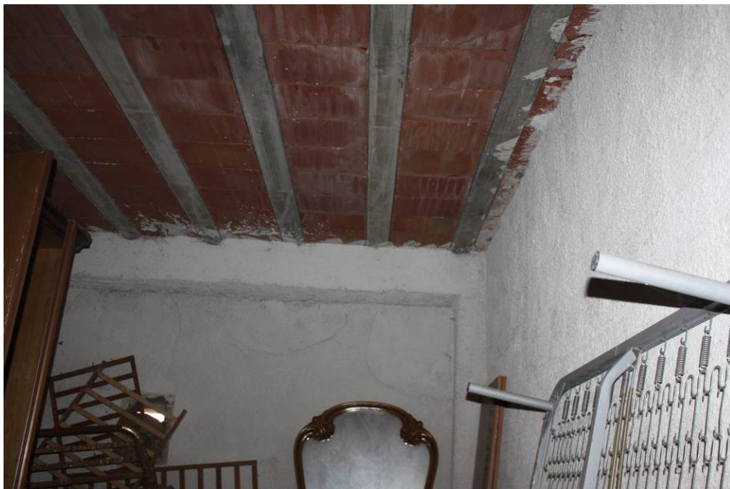
03 - 30