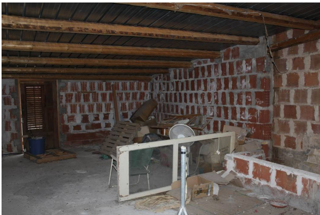
03 - 36