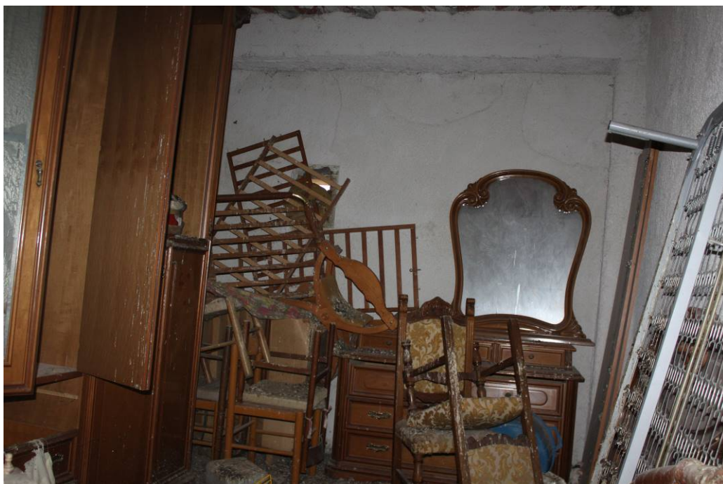
03 - 31