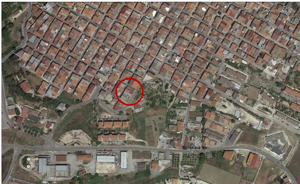
Localizzazione del fabbricato