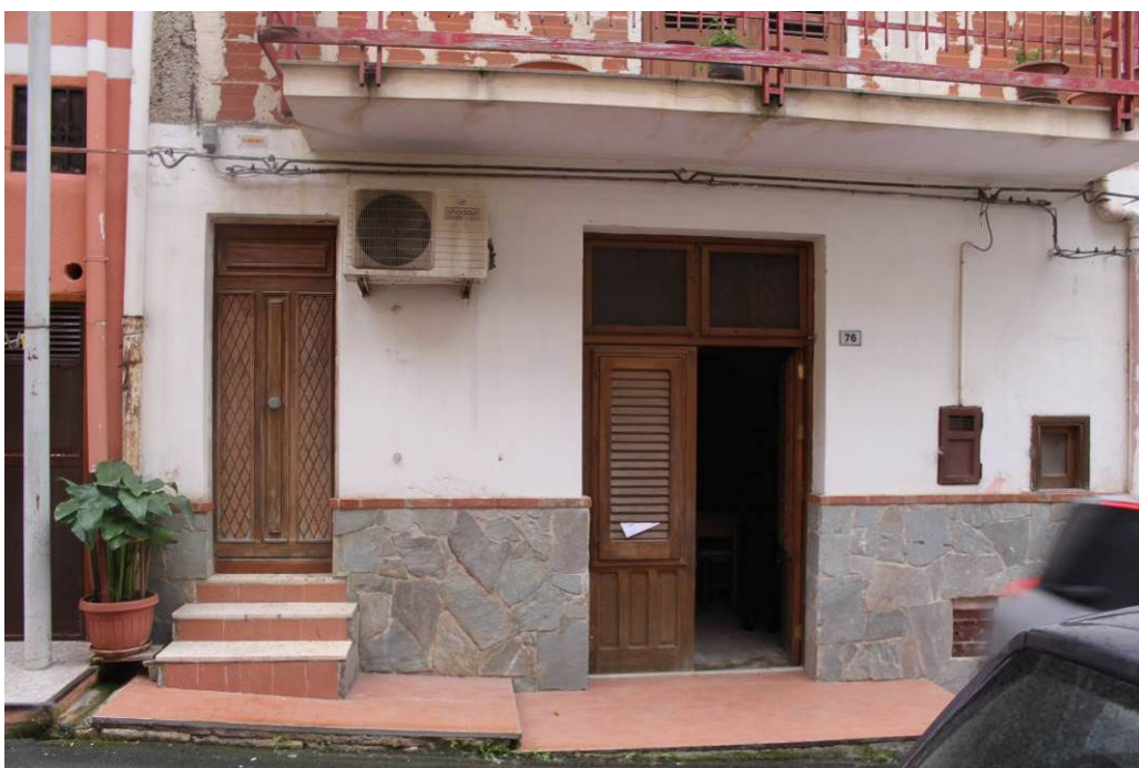
03 - 05