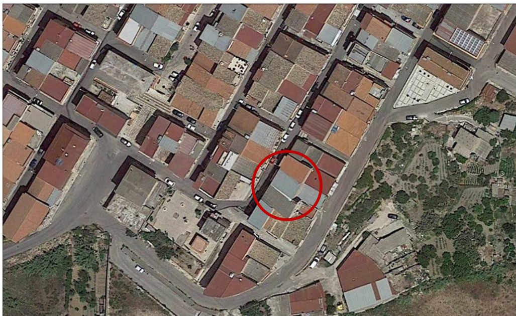
Localizzazione del fabbricato