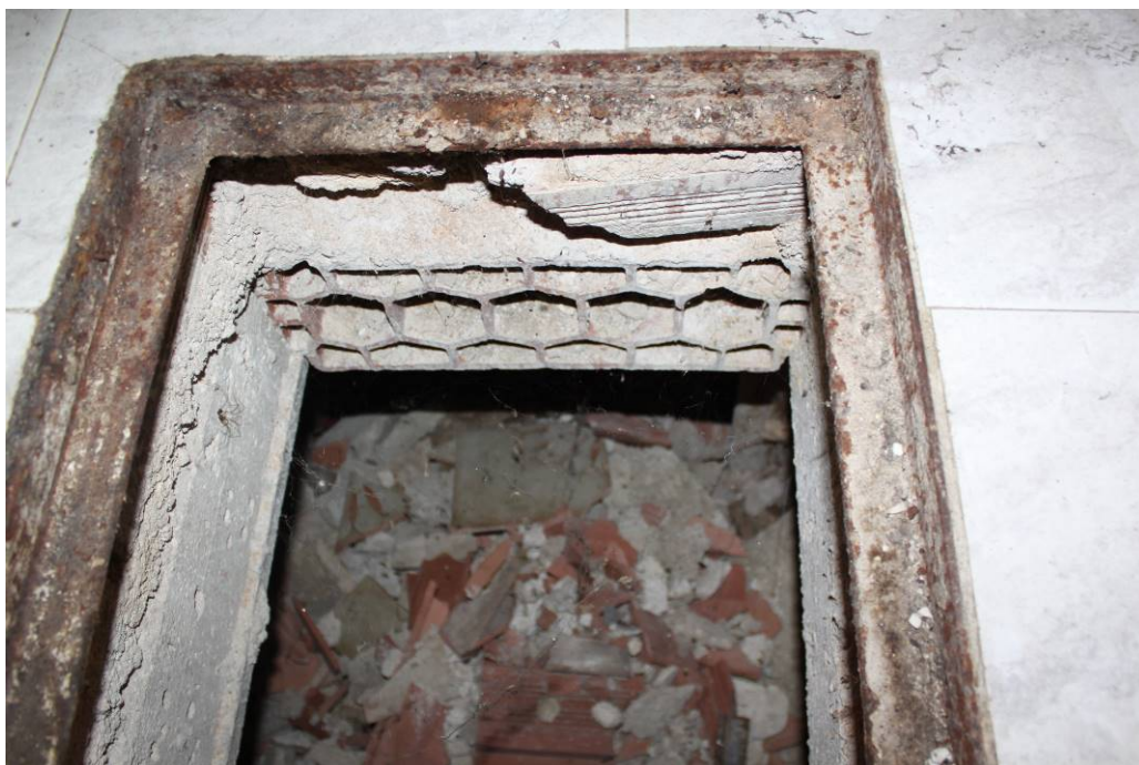
03 - 47