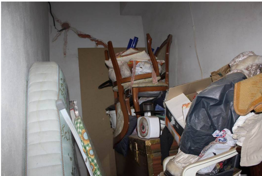
03 - 15