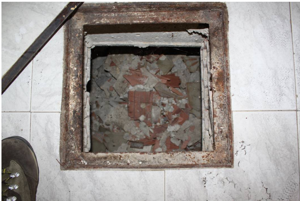
03 - 46