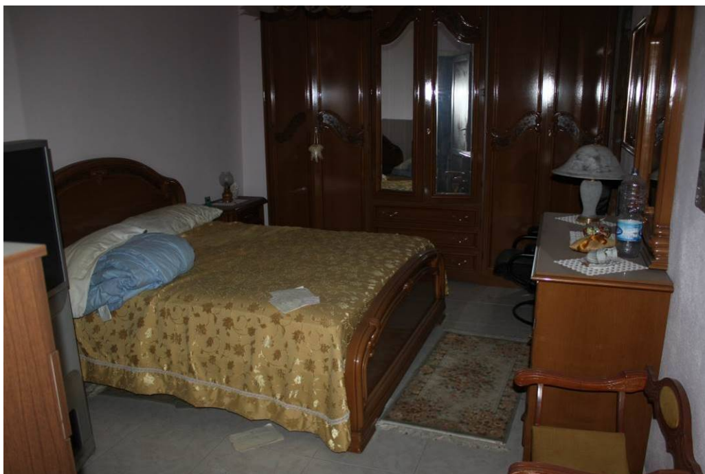
03 - 16