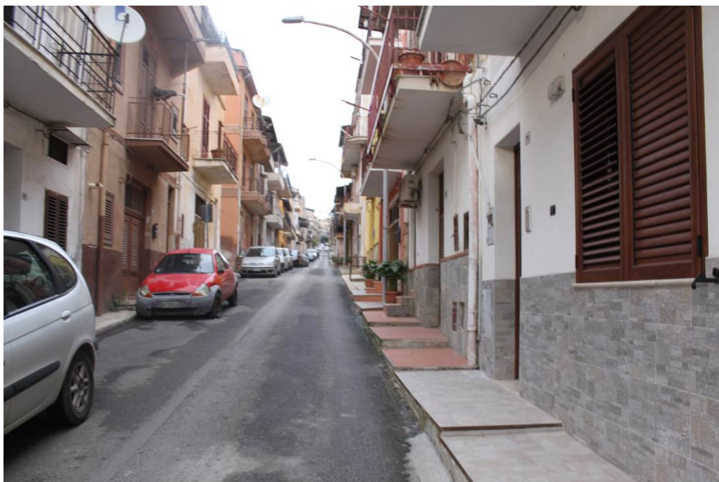
03 - 03