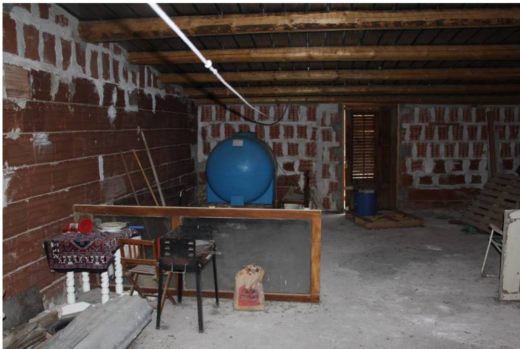
03 - 35