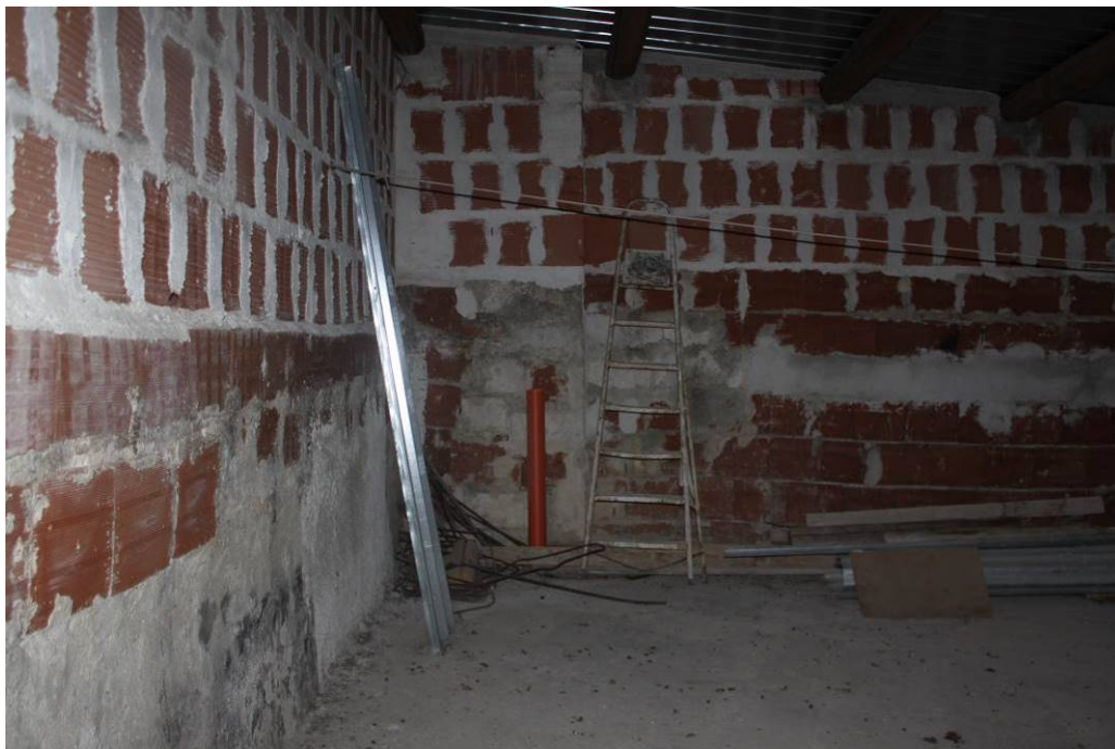
03 - 33