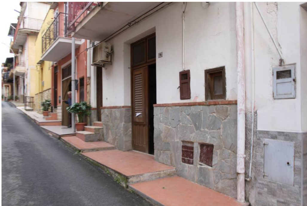
03 - 04