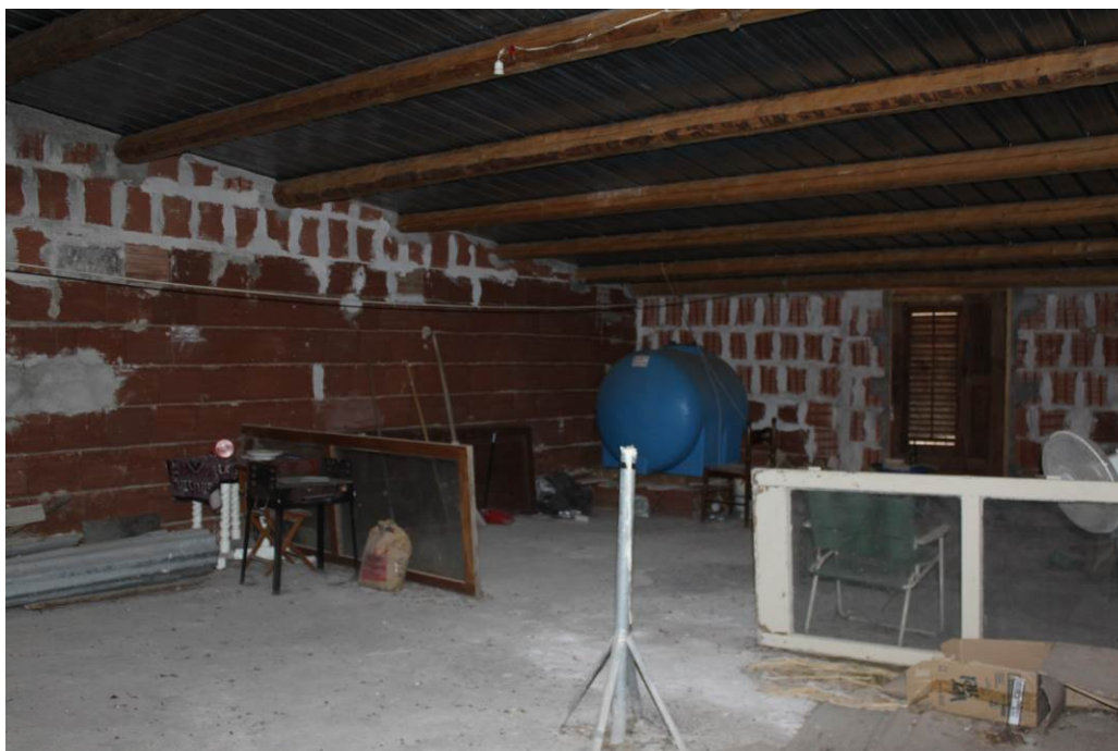
03 - 34