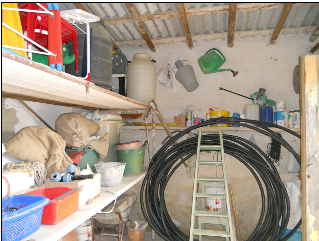
FOTO 28 – Interno del fabbricato a nord-ovest del patio scoperto (particella 1125)