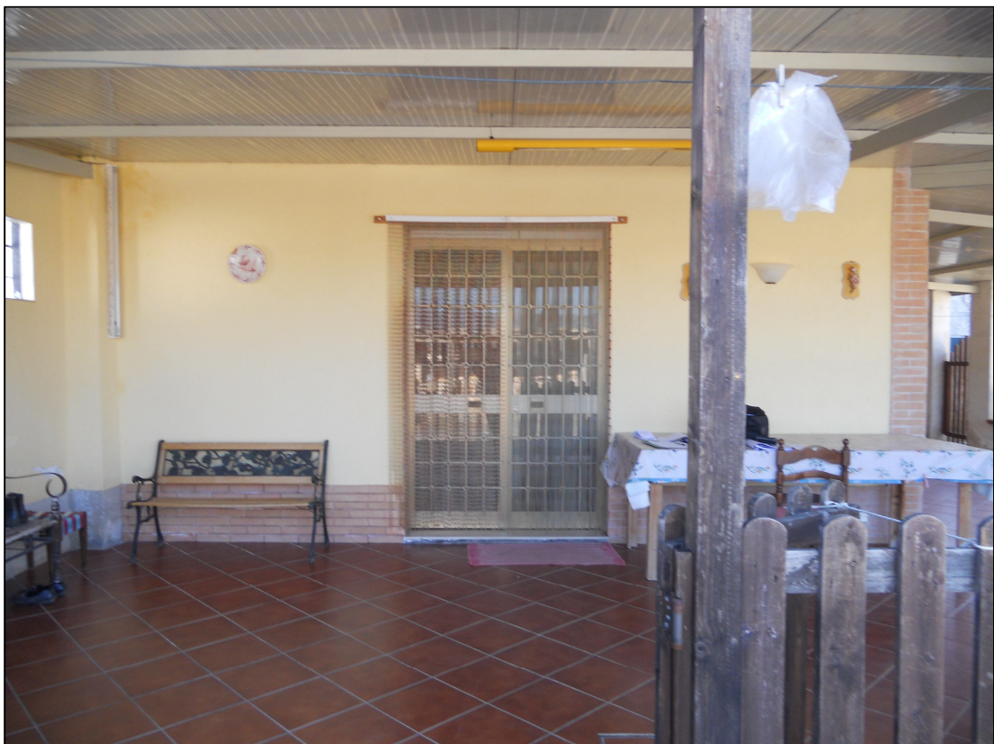
FOTO 12 – Ingresso all'abitazione sul lato est del patio porticato