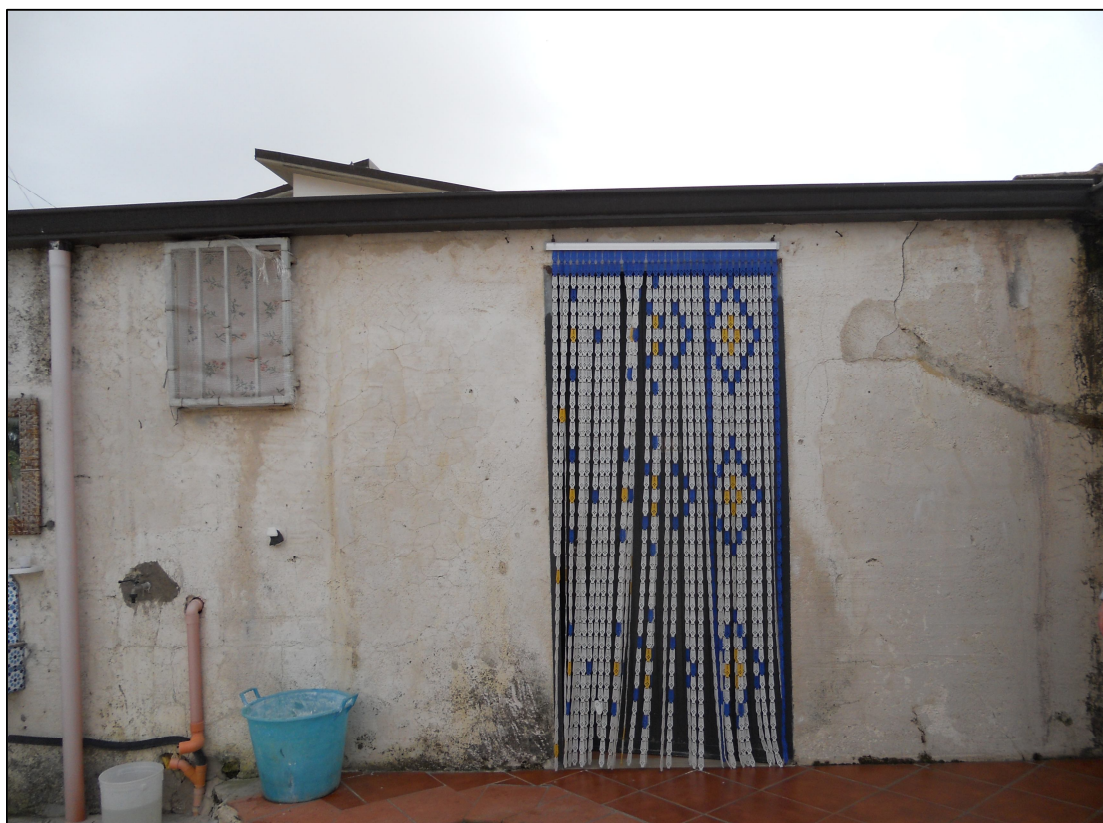
FOTO 30 – Fabbricato sud – Ingresso della cucina (particella 1130)