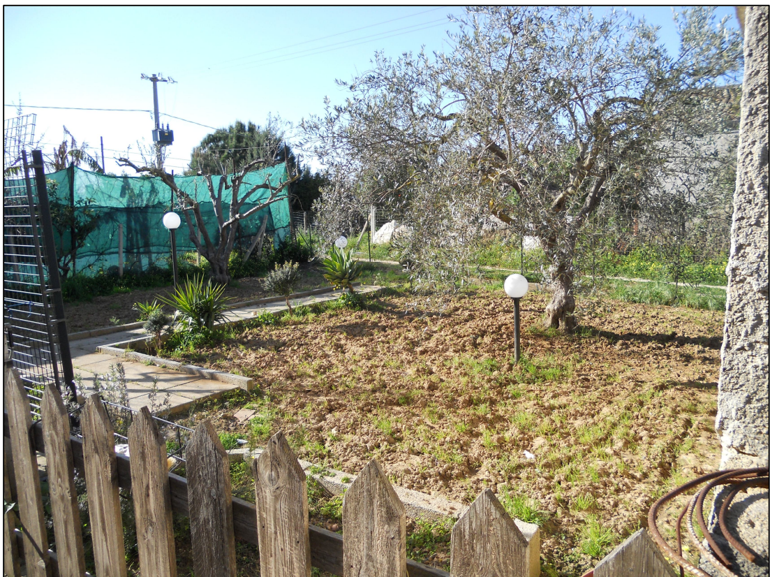
FOTO 08 – Giardino sul lato nord del fabbricato per civile abitazione