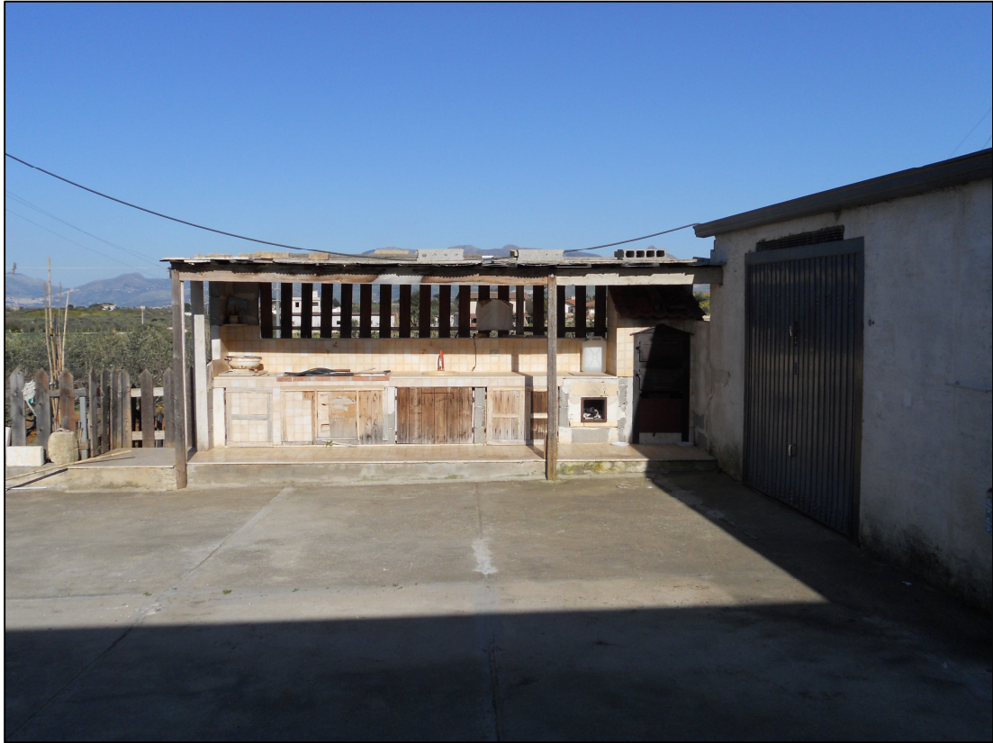
FOTO 07 – Tettoia con cucina in muratura sul lato est del patio scoperto