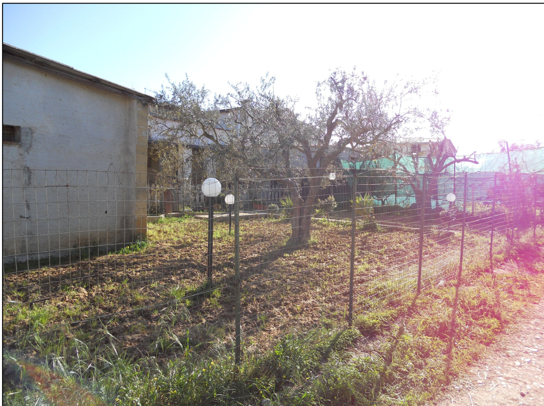
FOTO 02 – Confine nord lungo la stradella privata di accesso agli immobili