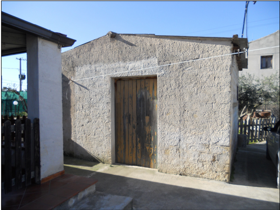
FOTO 05 – Fabbricato a nord-ovest del patio scoperto (Foglio 95, particella 1125)