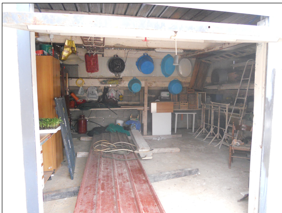
FOTO 29 – Fabbricato sud – interno dell'autorimessa-magazzino (particella 1130)