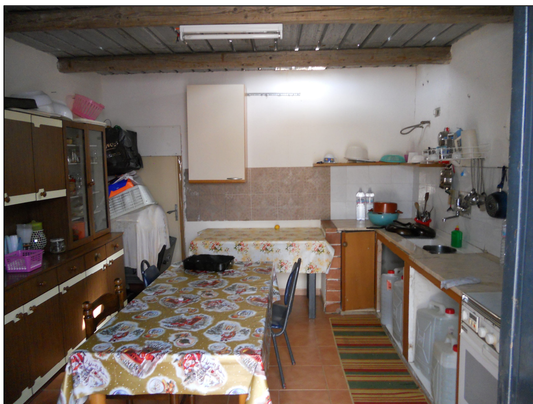
FOTO 31 – Fabbricato sud – Interno della cucina (particella 1130)