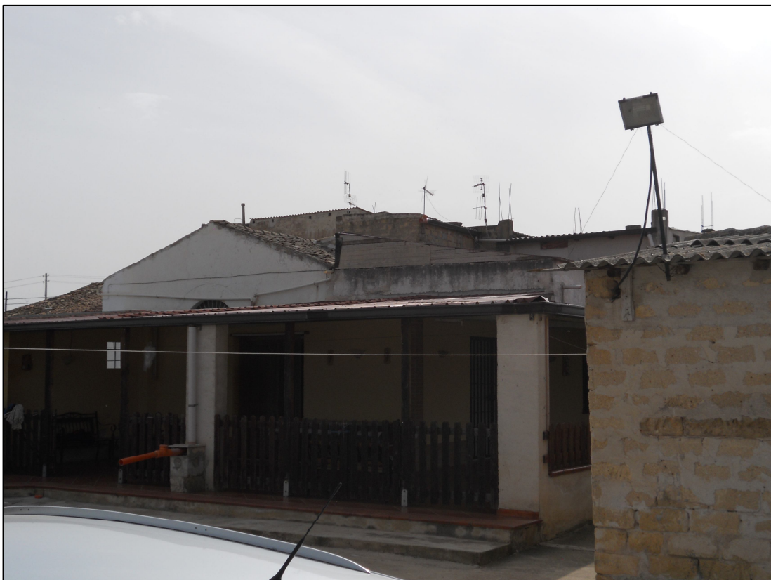
FOTO 04 – Fabbricato di civile abitazione sul lato ovest del patio scoperto