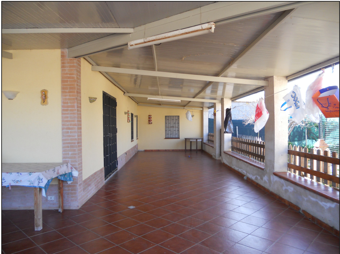
FOTO 11 – Lato nord del patio porticato adiacente il fabbricato di civile abitazione