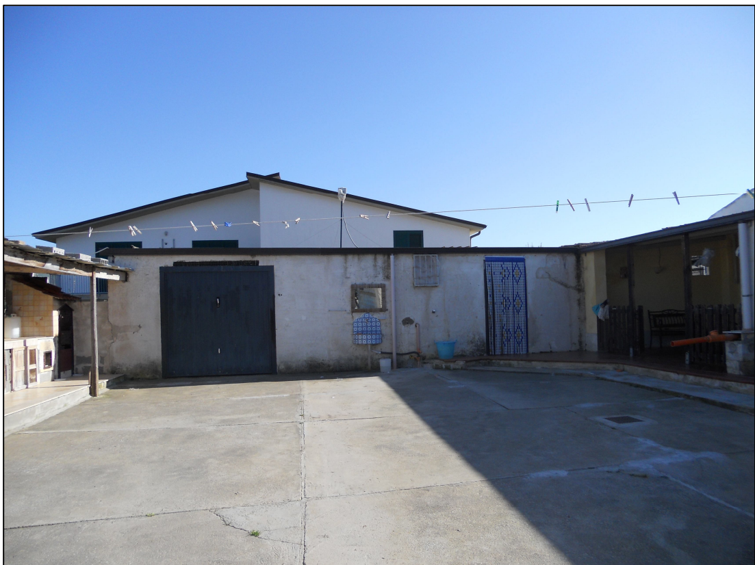
FOTO 06 – Patio esterno scoperto – Fabbricato sud (Foglio 95, particella 1130)