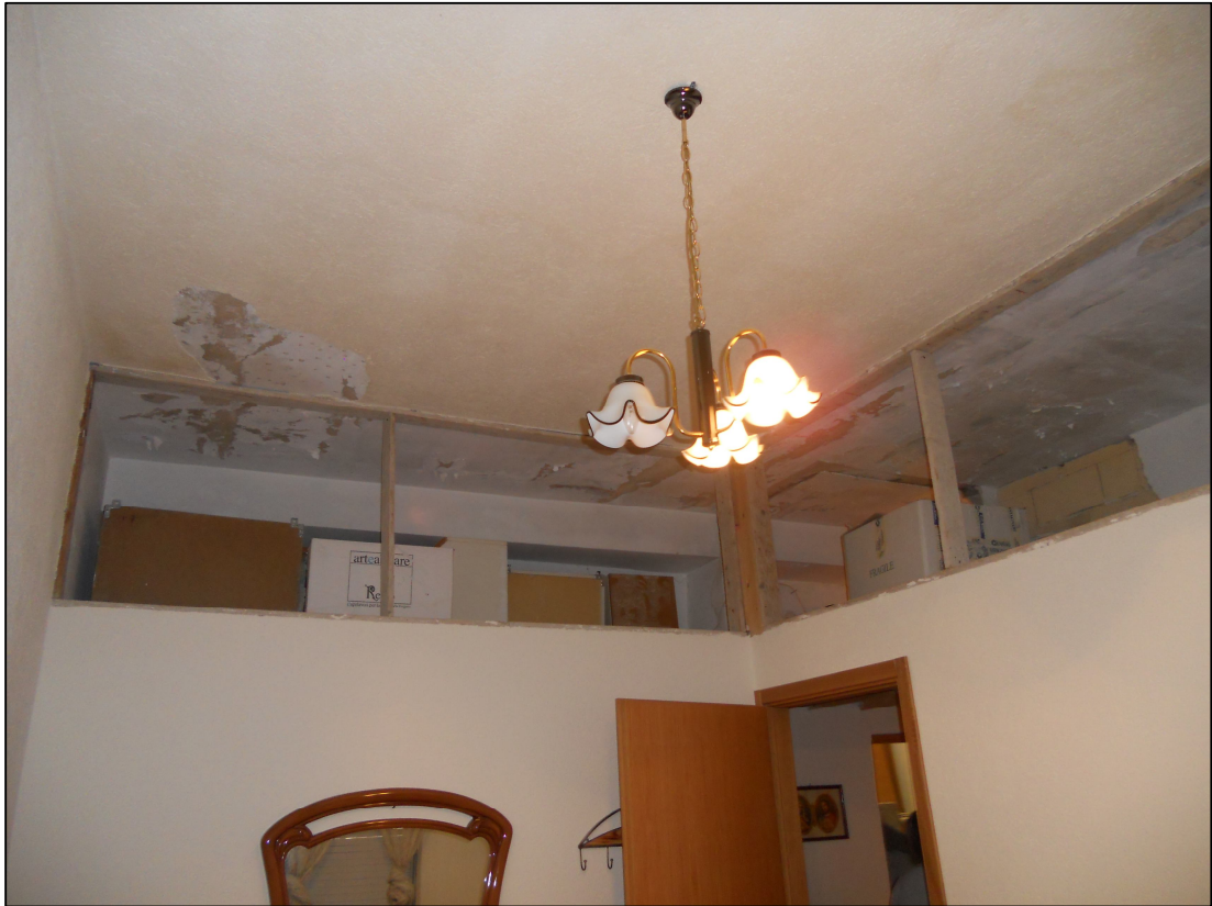
FOTO 17 – Abitazione – Soppalco al di sopra di corridoio e servizio igienico