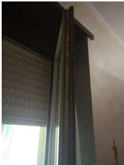
Figura 12. Dettaglio infissi