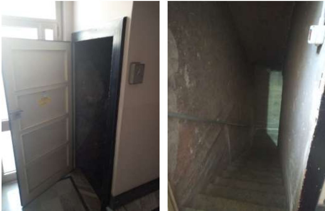
Figura 13. Accesso locale cantina