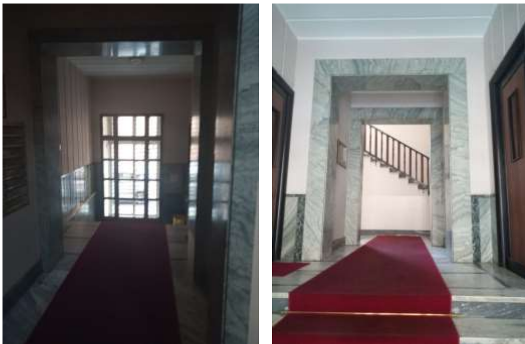
Figura 2. Ingresso e vano scale palazzo