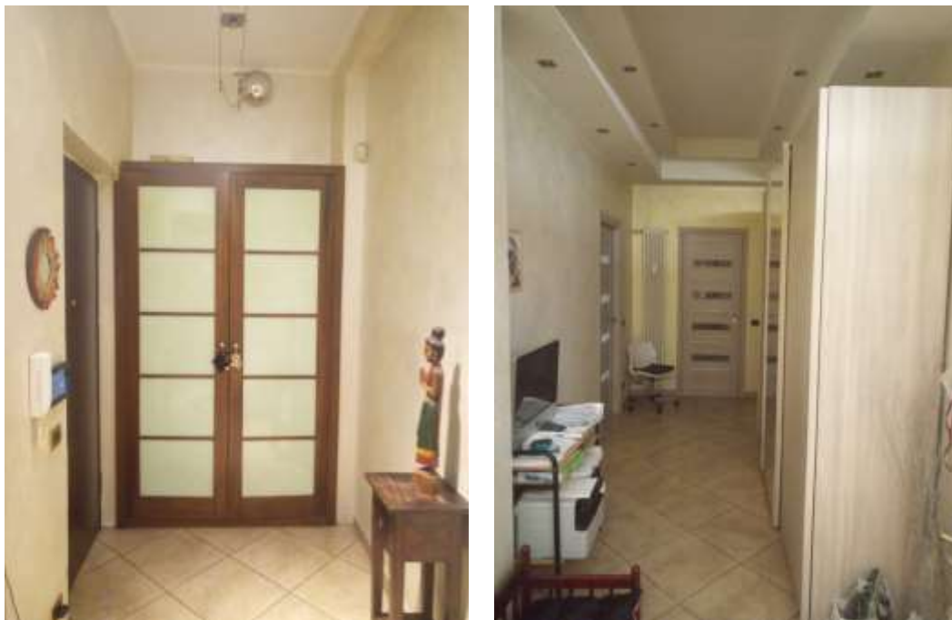
Figura 4. Ingresso e corridoio appartamento