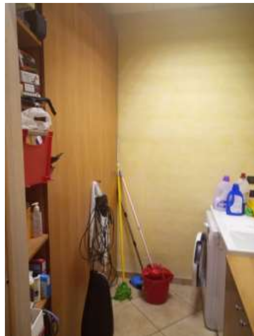
Figura 10. Lavanderia