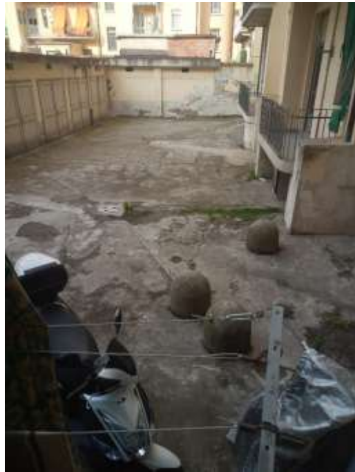
Figura 11. Poggiolo su cortile interno