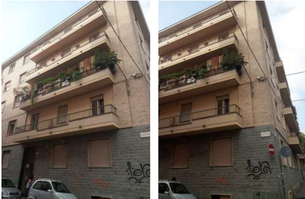
Figura 1. Facciata palazzo