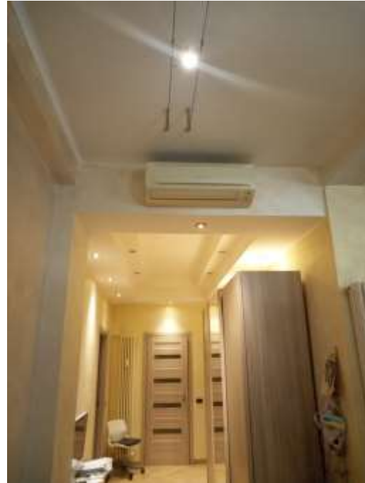
Figura 5. Dettagli impianto di riscaldamento e raffrescamento