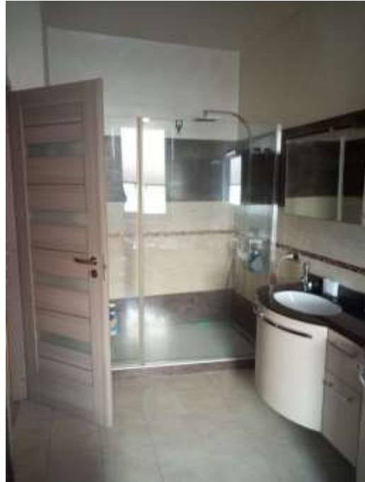
Figura 9. Bagno