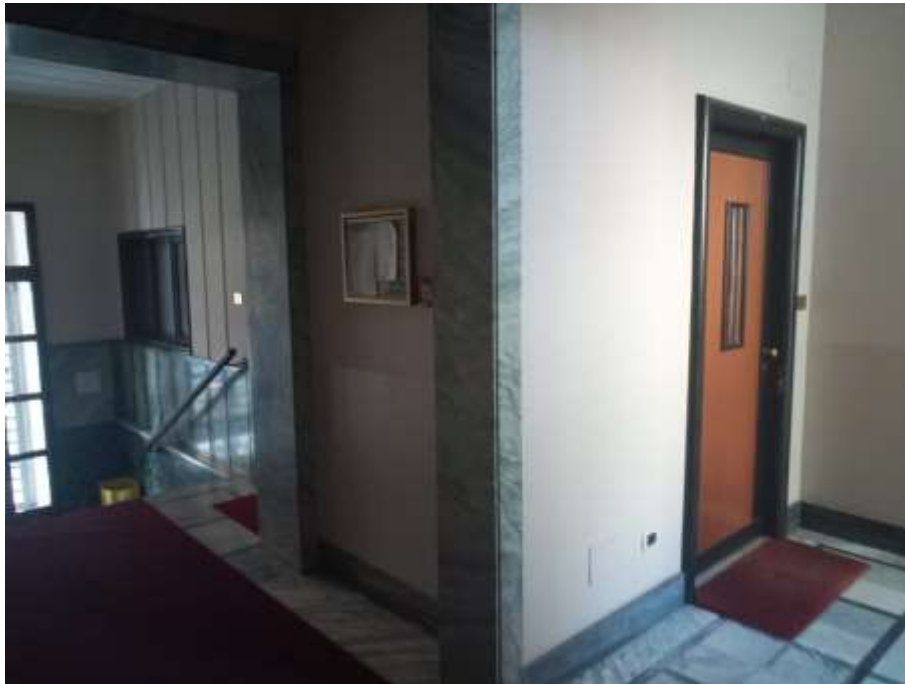
Figura 3. Portone di ingresso appartamento