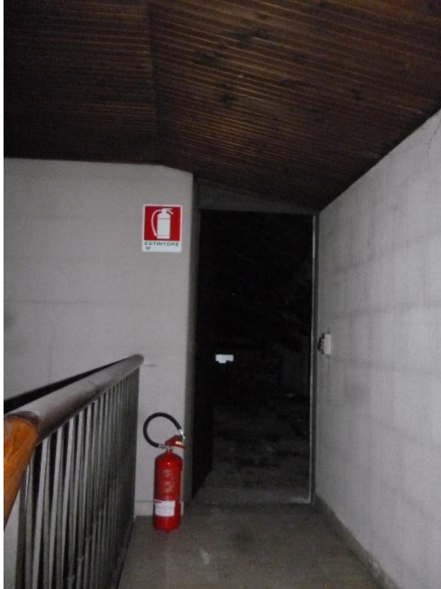
FOTO 9 – Sottotetto Sub. 10: porta di accesso al terzo ed ultimo piano