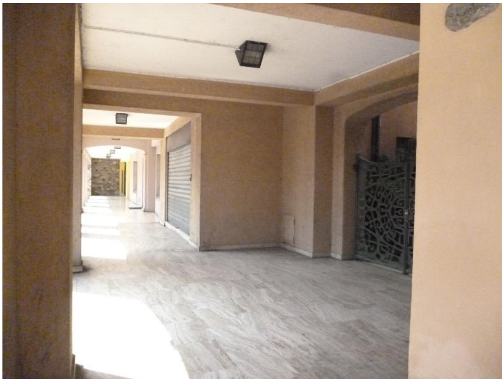
FOTO 2 – Sotto il porticato lato Via Garibaldi: cancello di accesso all'area cortilizia e saracinesca negozio Sub. 7

Giudice: Dott. Filippo D'Aquino Custode: Perito: Arch. Laura Nicoletta Bartoli