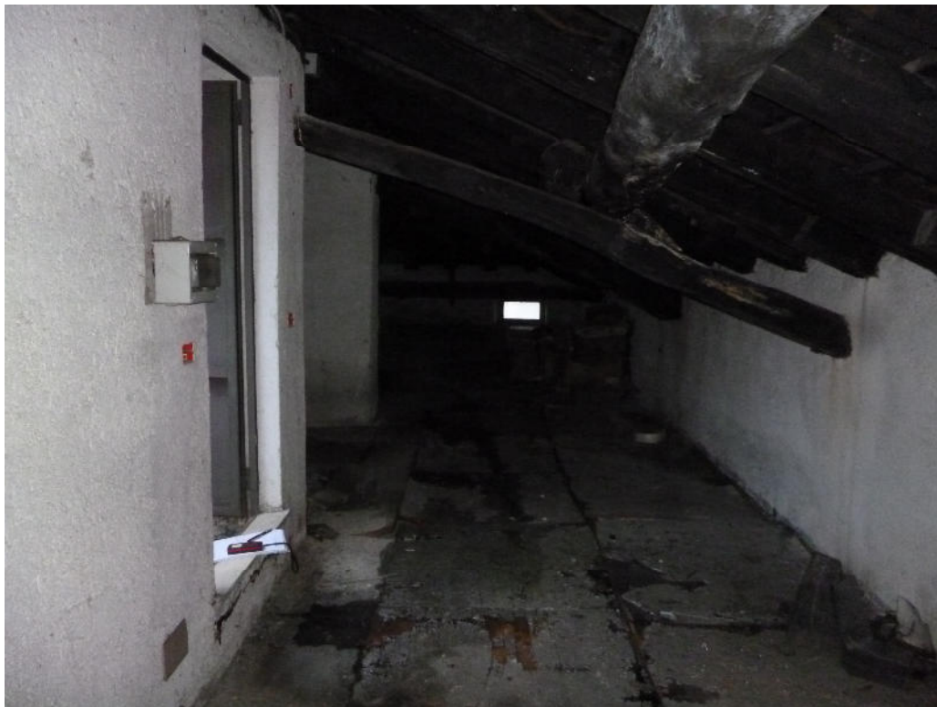
FOTO 10 – Sottotetto Sub. 10: interno, a sinistra porta di accesso al terrazzo