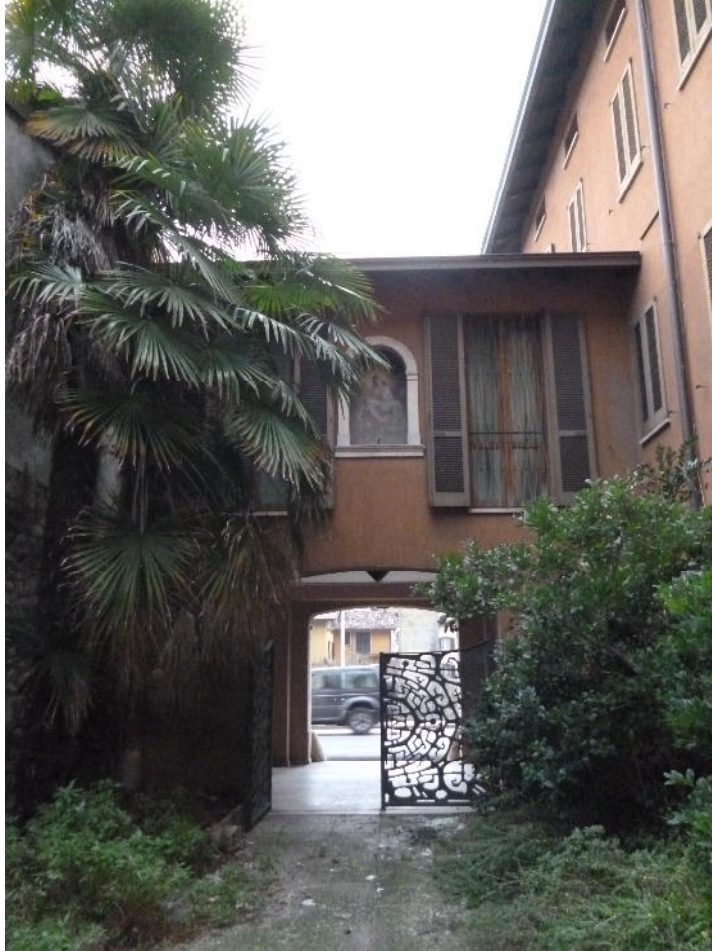
FOTO 5 – Area cortilizia da cui si accede al Box Sub. 6 ed al vano scale comune