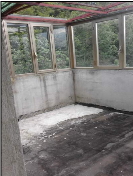
Foto 20 veranda