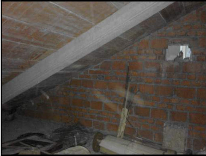
Foto 18 sottotetto non abitabile - soffitta