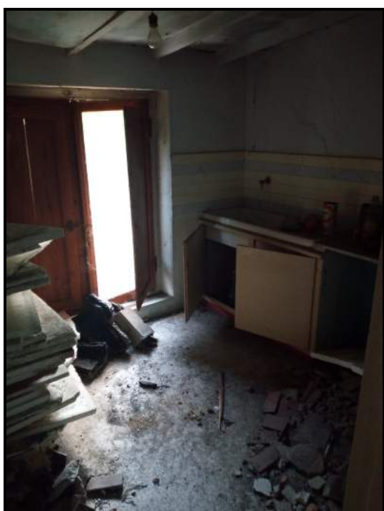
Foto 12 bagno