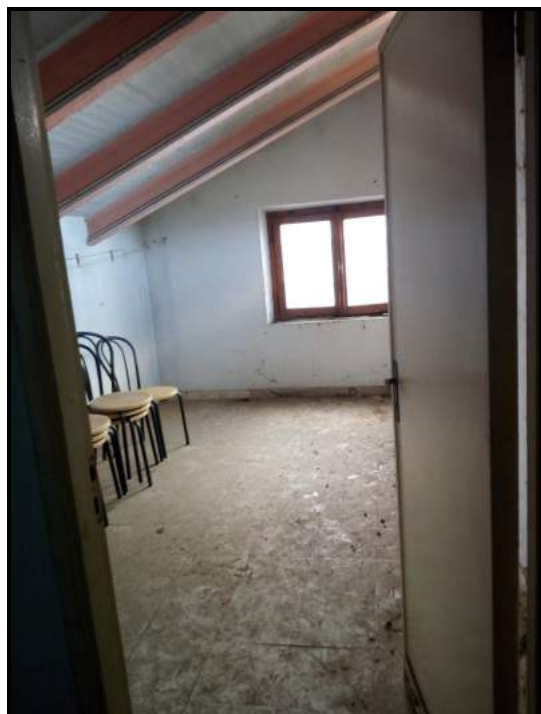
Foto 16 sottotetto non abitabile - soffitta