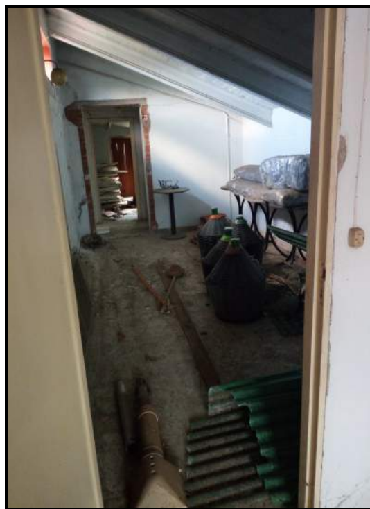
Foto 15 sottotetto abitabile