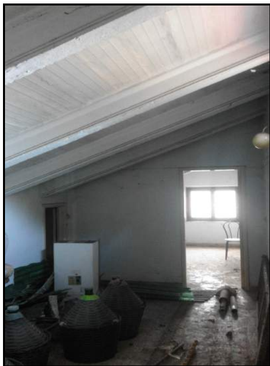
Foto 14 sottotetto abitabile