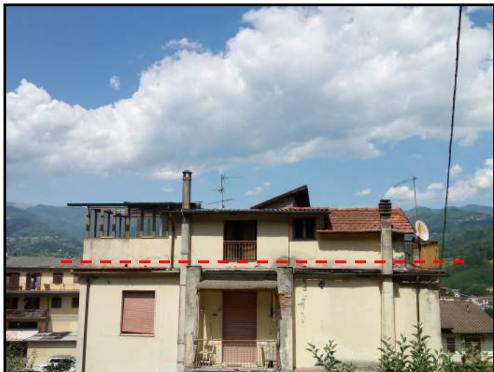
Foto 6 lato nord immobile