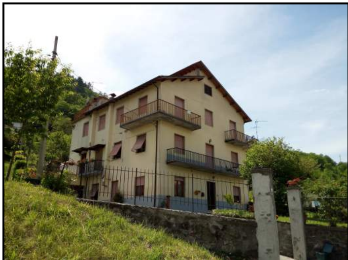
Foto 2 fabbricato lato nord