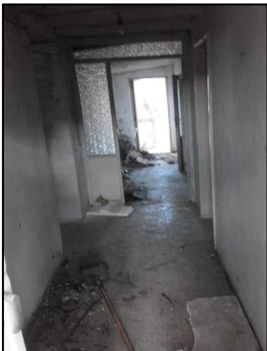
Foto 10 disimpegno