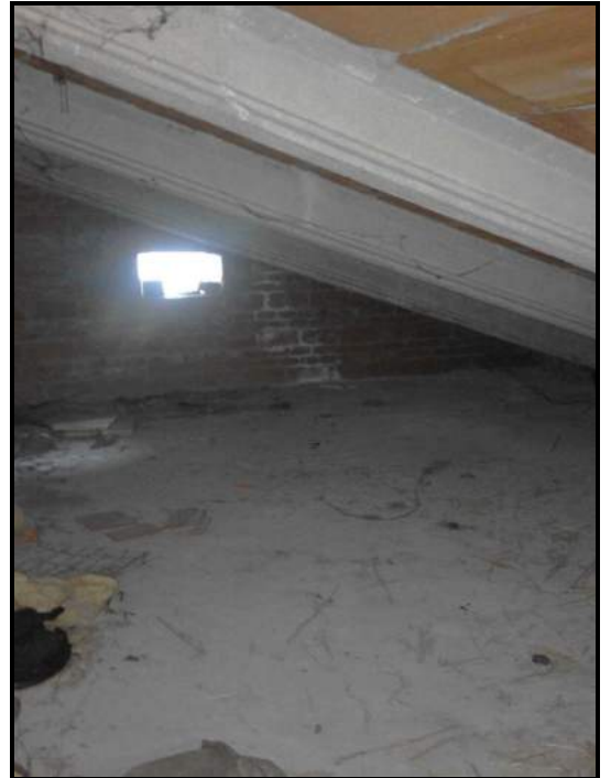
Foto 19 veranda