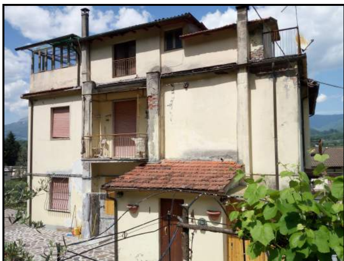
Foto 4 lato sud immobile