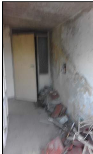
Foto 8 disimpegno