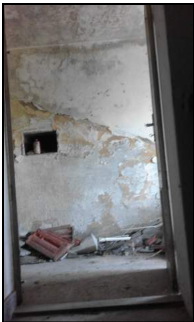
Foto 7 ingresso