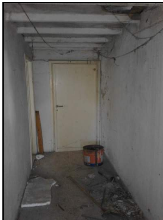
Foto 11 cucina