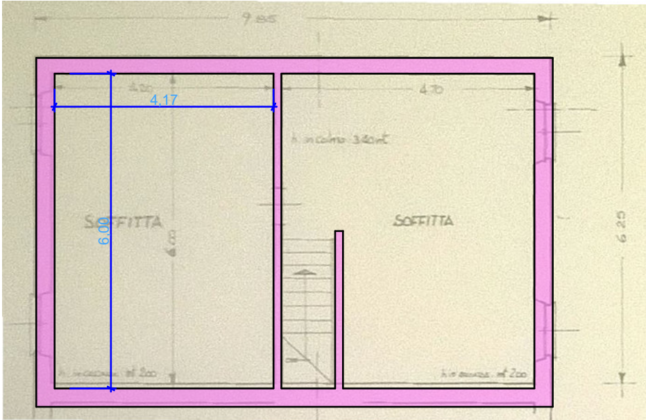
2. soffitta 1:100

stato rilasciato sovrapposto ai grafici derivanti dalle misure indicate nel progetto