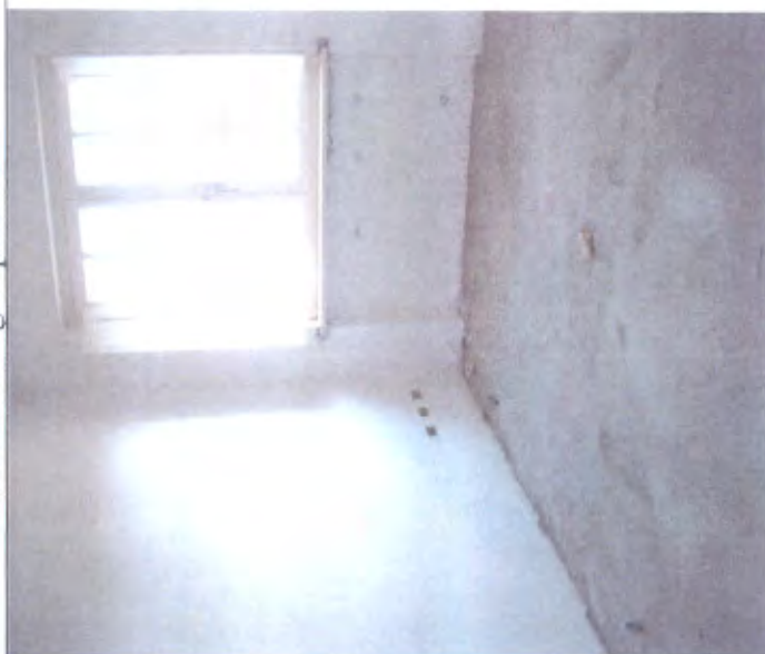
Villetta N camera piano I