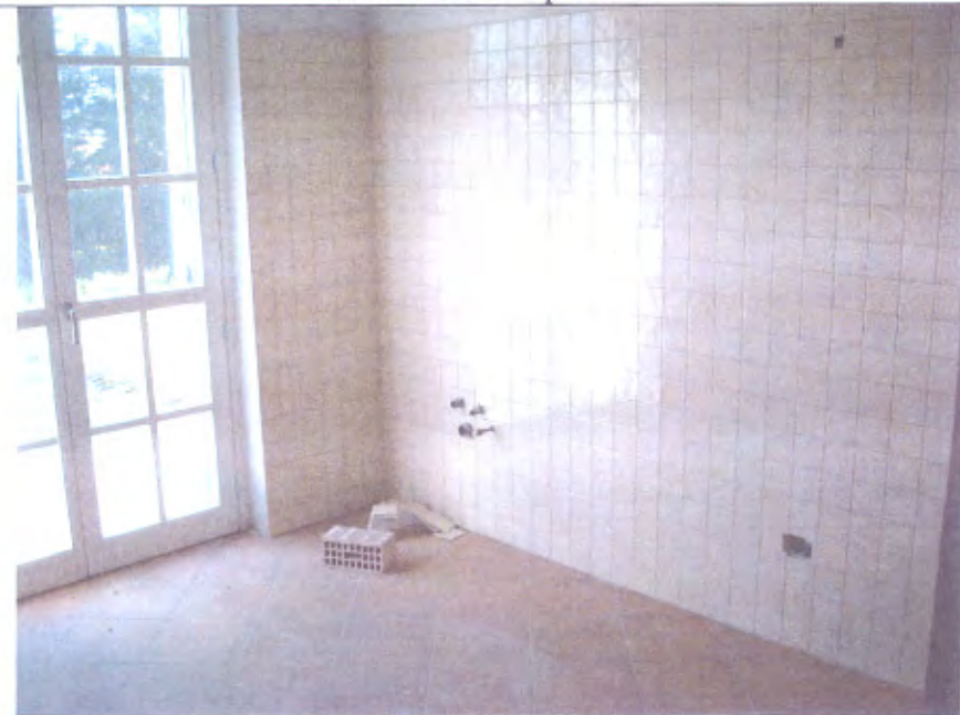
Villetta N cucina piano T