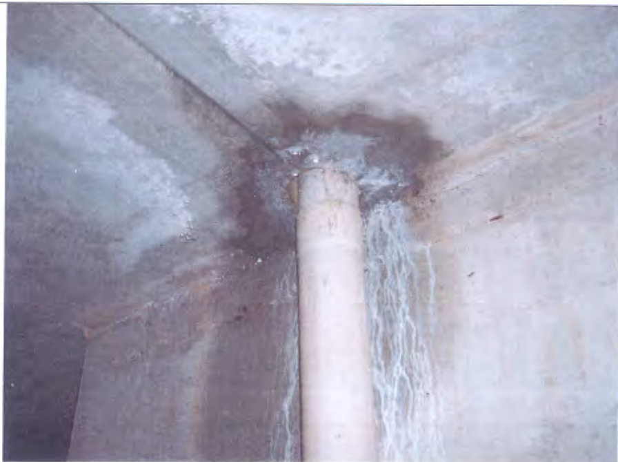
LOTTO E-F pluviale corsello