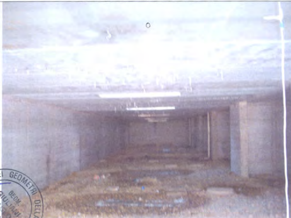
LOTTO E-F Stato corsello box