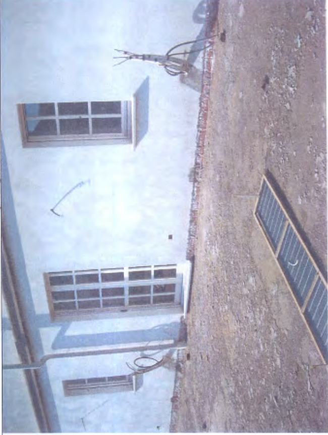
Villetta H area esterna piano T