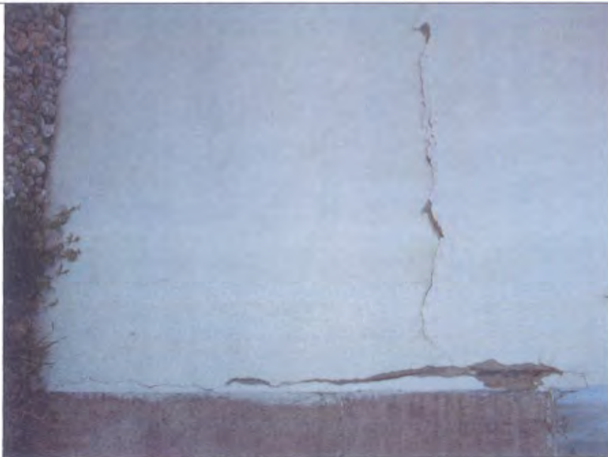
LOTTO E-F Facciata fessurazione