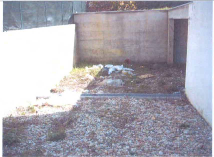
LOTTO E-F scivolo corsello box