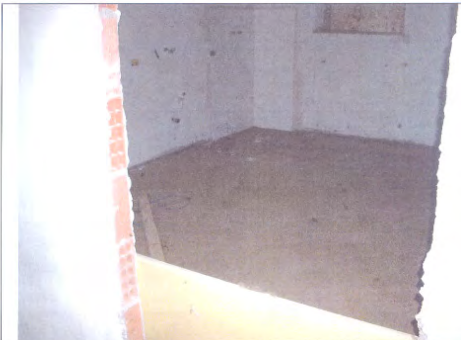
Villetta L lavanderia piano S1