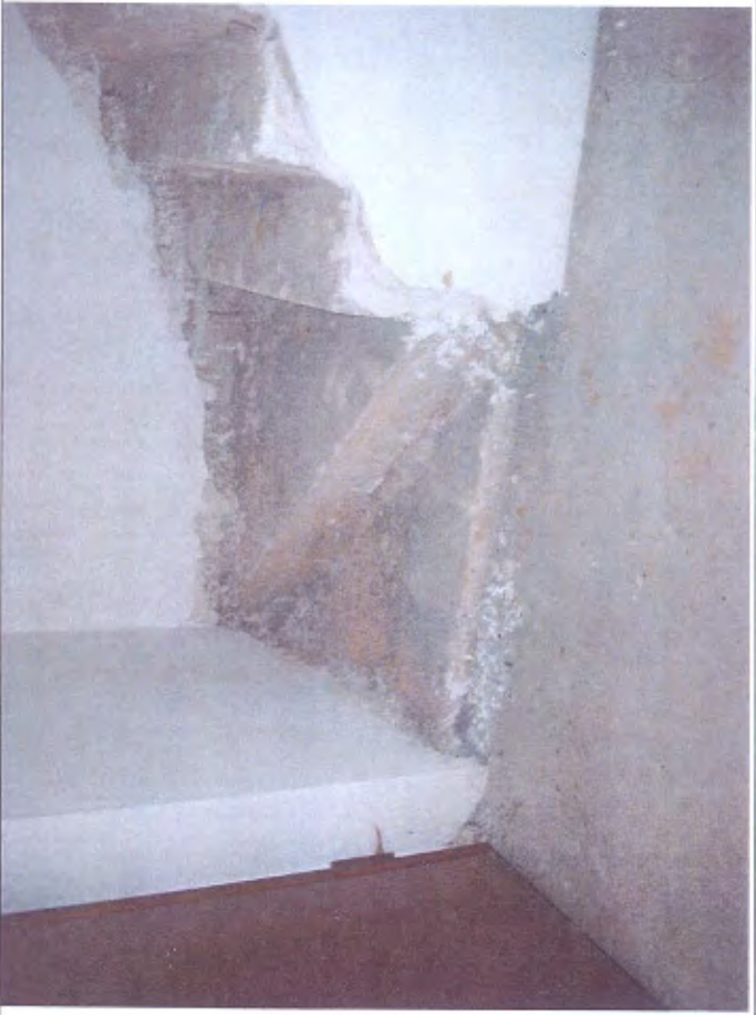
Villetta H scala piano T