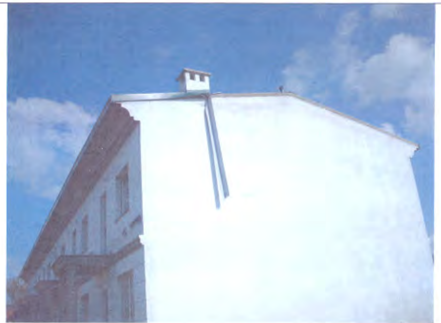
LOTTO E-F facciata scossalina divelta e penzolante