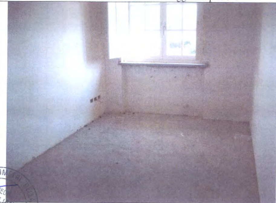
Villetta L camera piano I