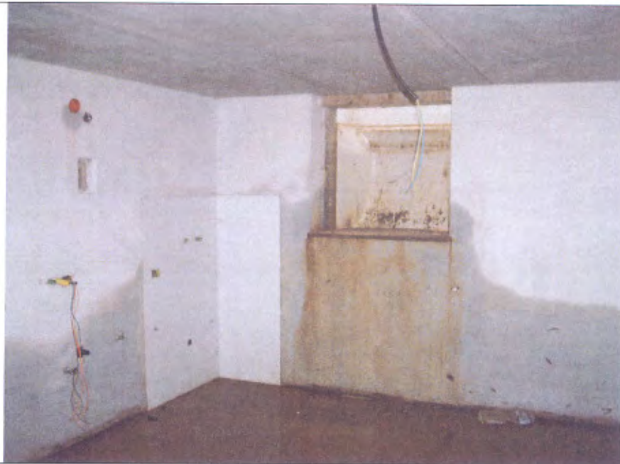
Villetta I lavanderia piano S1 allagata