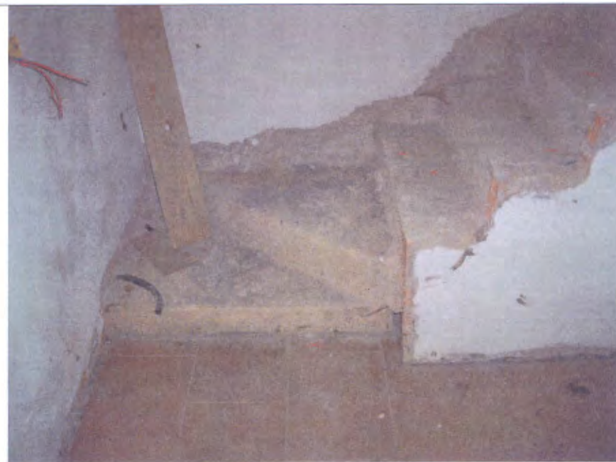
Villetta N scala piano S1