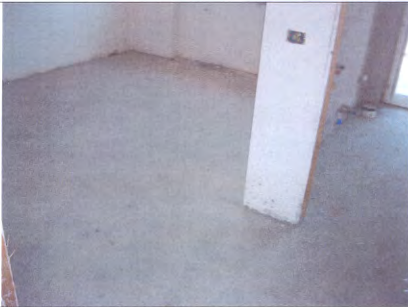
Villetta G Camera piano 1