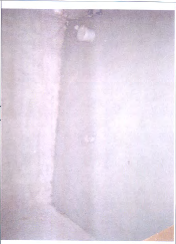
Villetta H bagnetto piano I