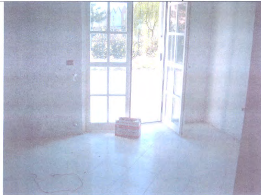
Villetta G CUCINA PIANO T