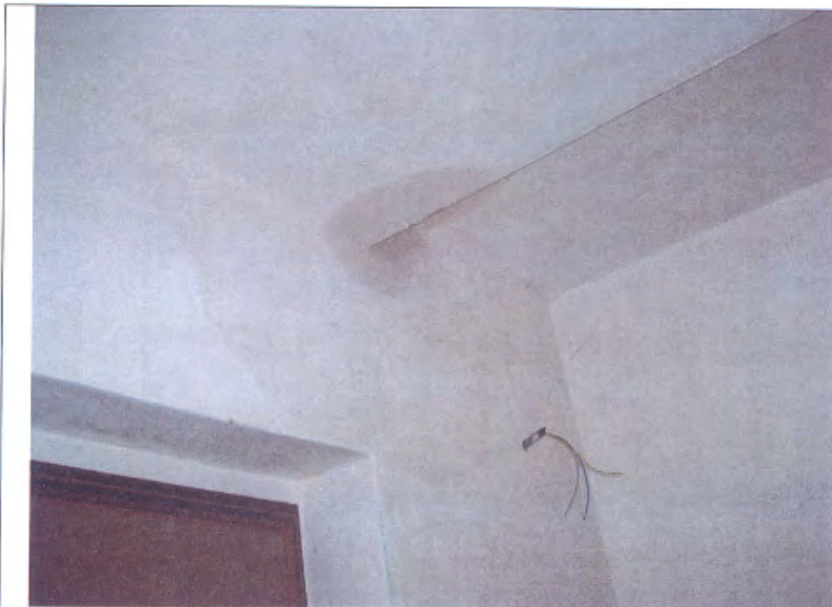
Villetta L traccia infiltrazione soggiorno piano T