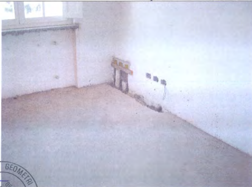
Villetta G Camera piano 1