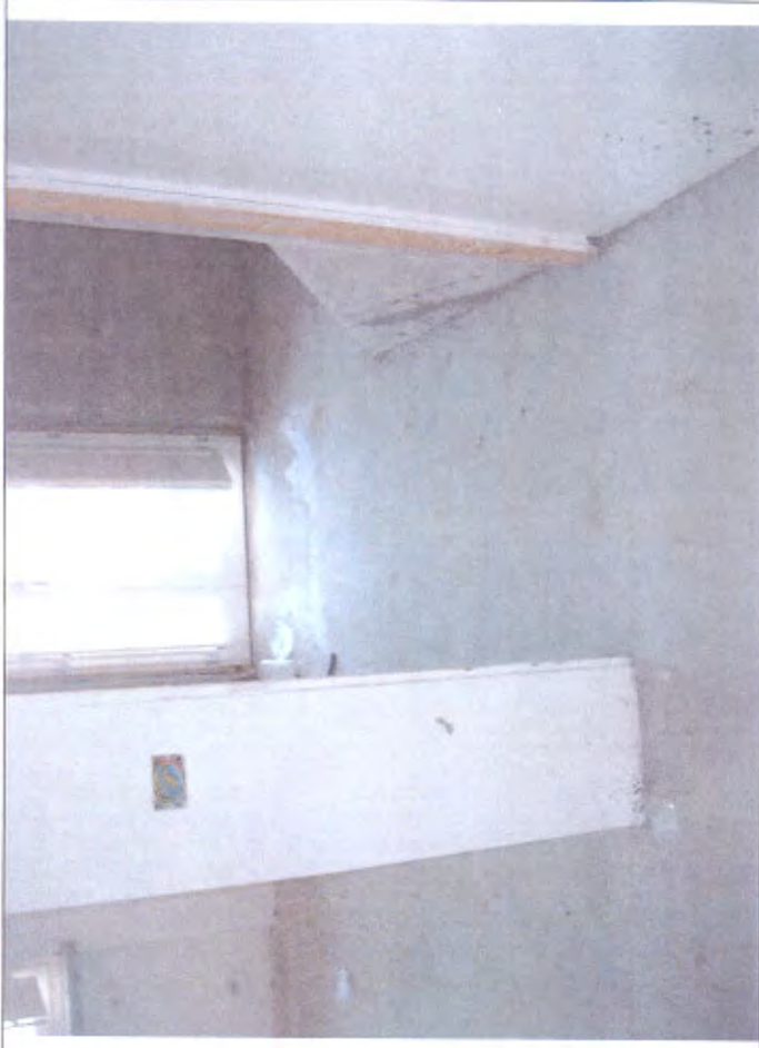
Villetta H bagno piano I