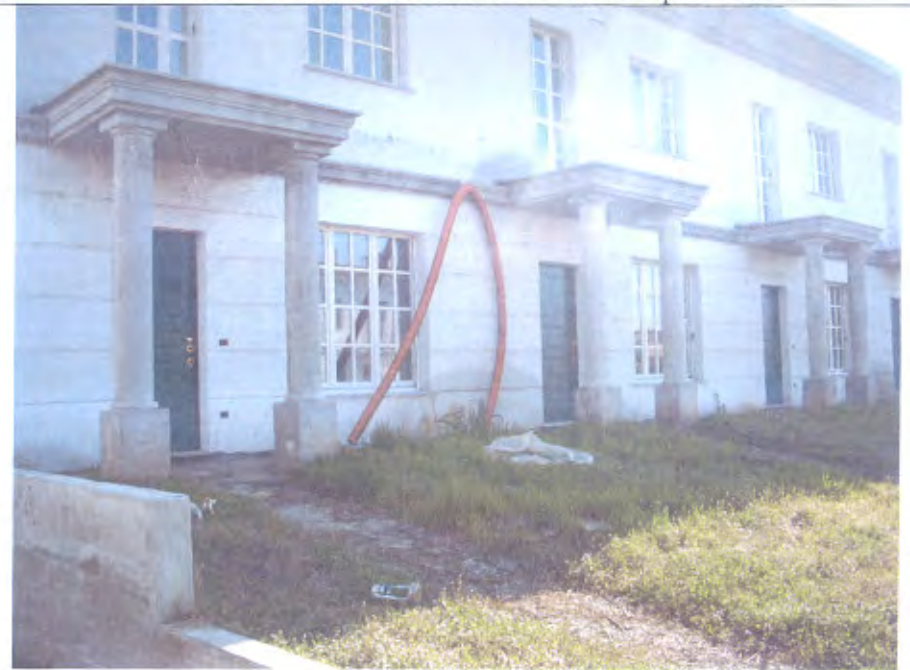
LOTTO E-F vista facciata su strada