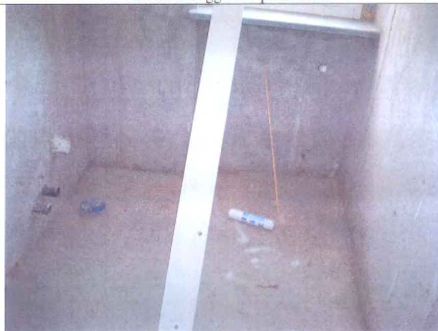
Villetta L bagno piano terra