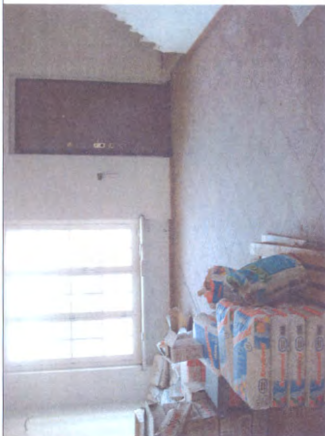
Villetta N soggiorno piano T