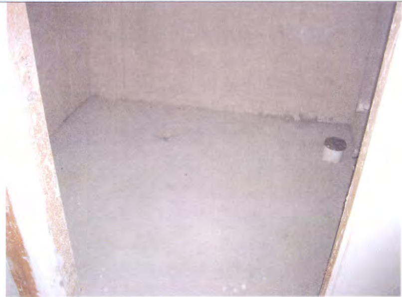
Villetta G bagnetto piano 1