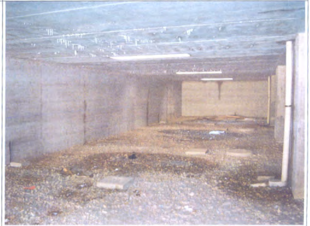
LOTTO E-F corsello box