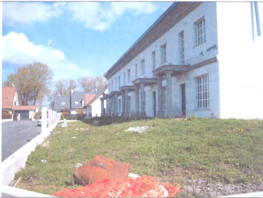
LOTTO E-F vista da strada