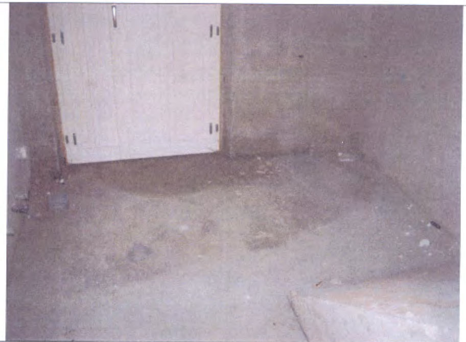
Villetta L bagno piano I