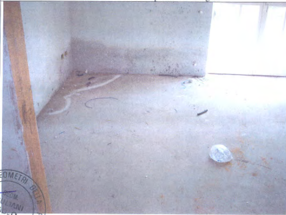
Villetta I cucina piano T tracce umidità a parete