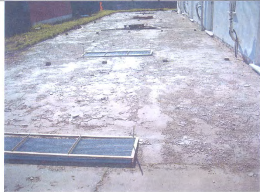
Villetta G area esterna retro