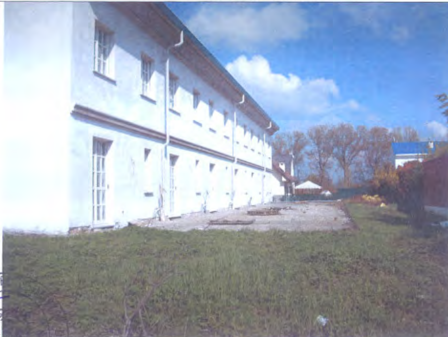
LOTTO E-F vista facciata retro