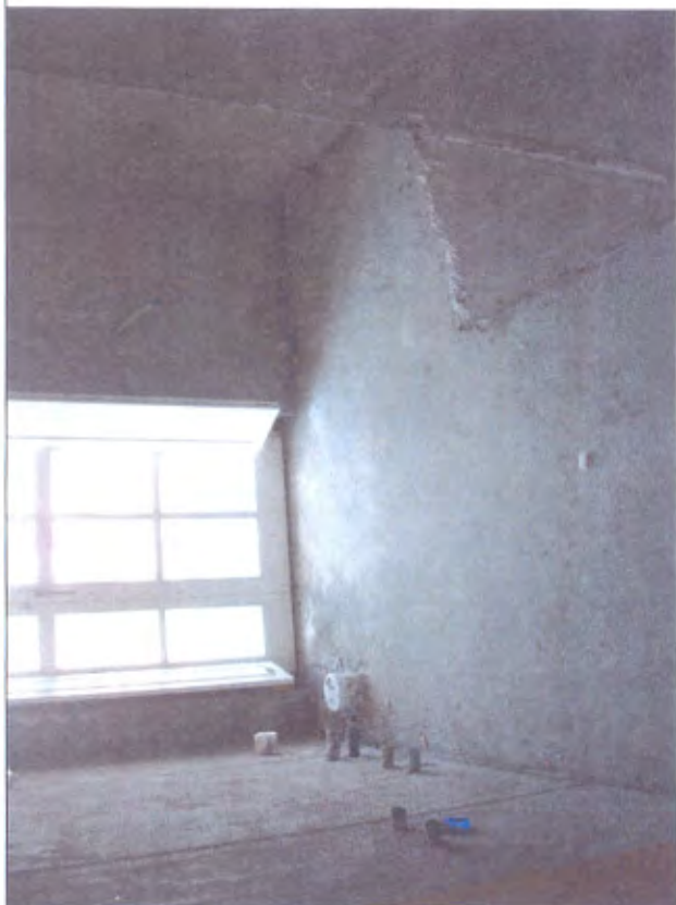
Villetta N bagno piano I°