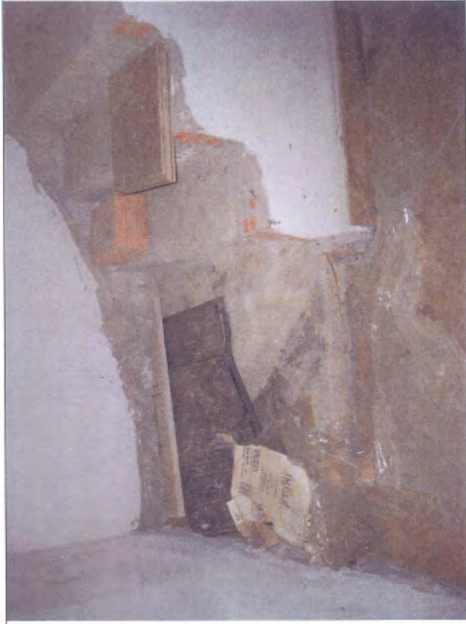
Villetta H scala lavanderia piano S1