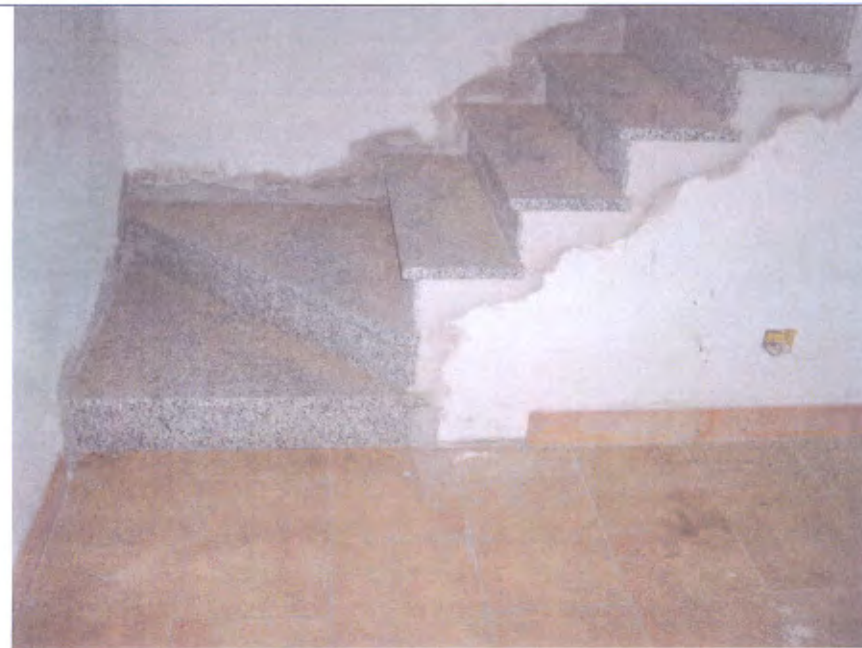
Villetta G lavanderia e vano scala piano S1