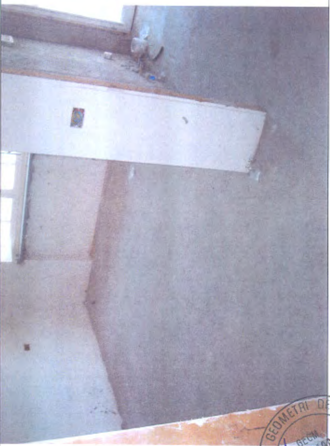
Villetta H camera piano I