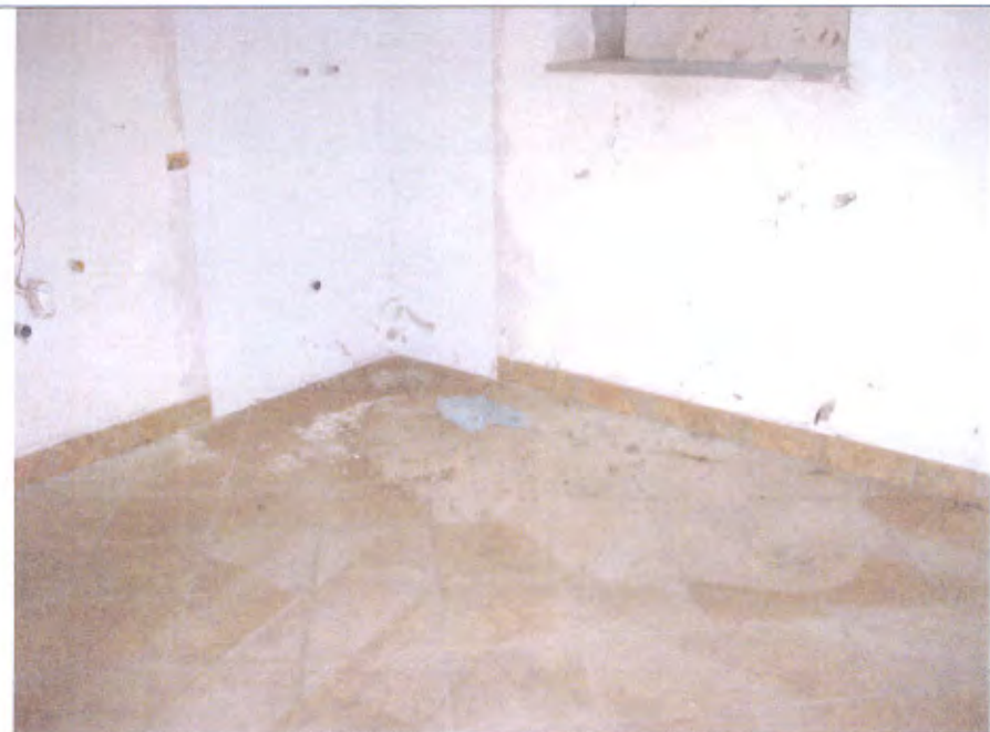
Villetta G lavanderia piano S1