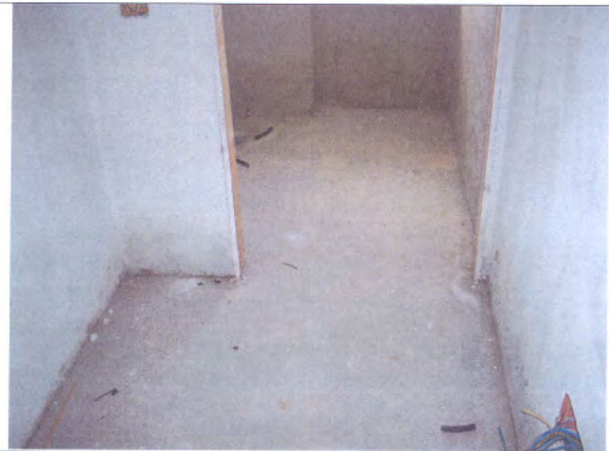
Villetta I bagno piano T