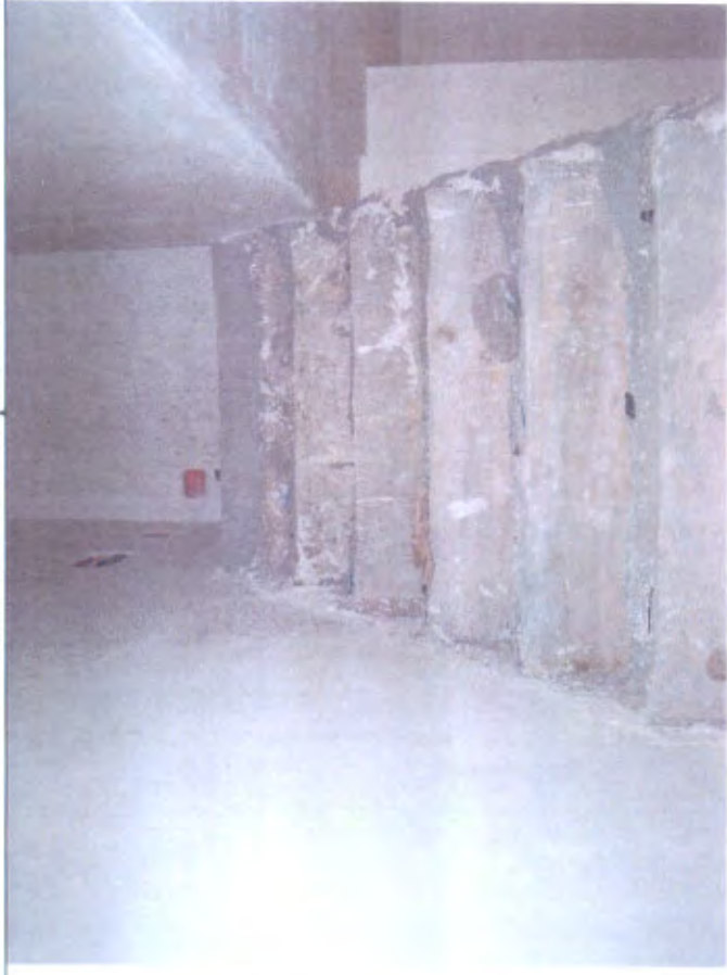
Villetta I Scala piano terra - primo