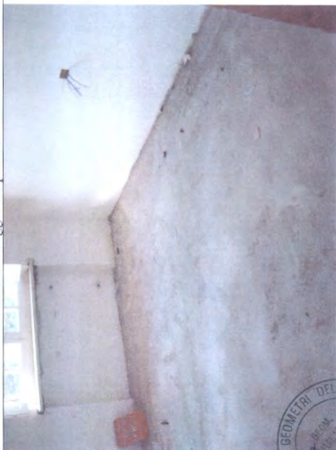
Villetta N camera piano I

GIUDIZIO DEL GEOMETRI DELLA PROVINCIA DI PIACENZA N. 7820 M. BIANCO