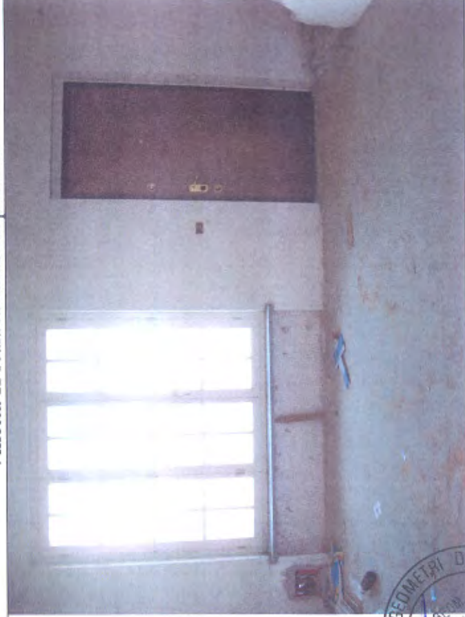
Villetta H soggiorno piano T