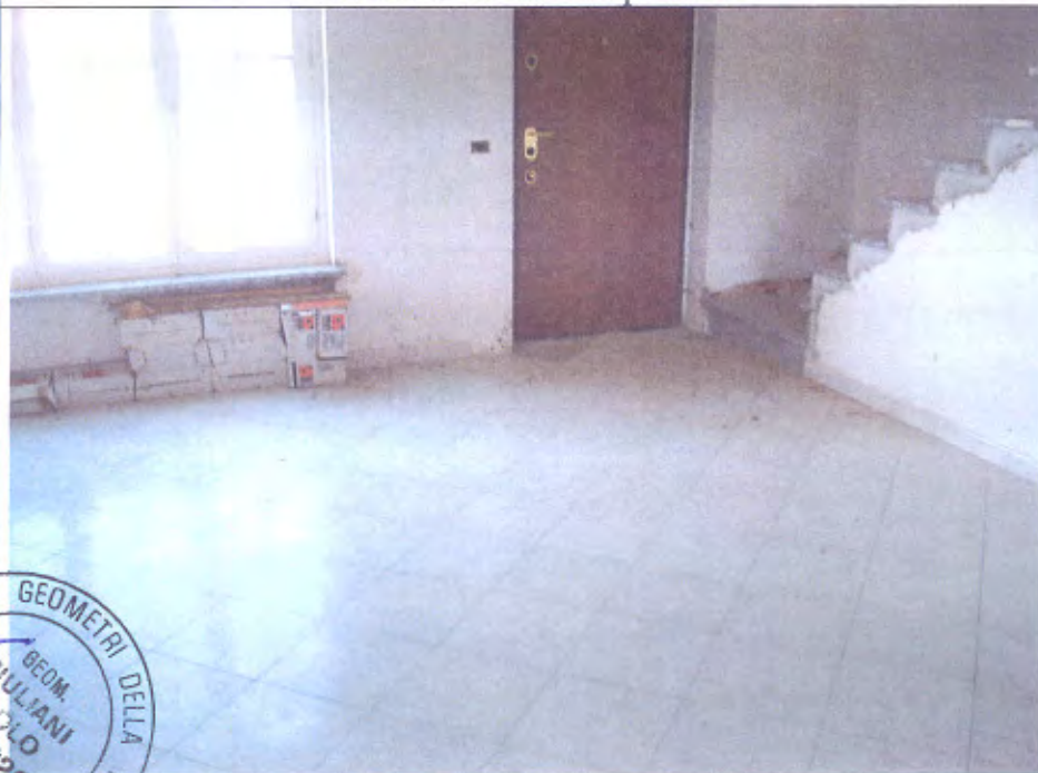
Villetta G SOGGIORNO INGRESSO PIANO T