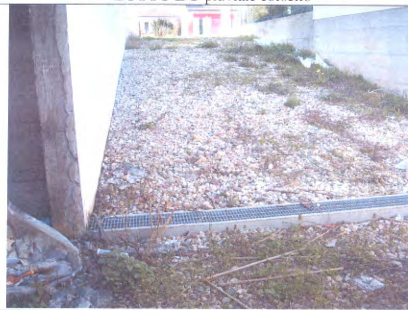
LOTTO E-F scivolo corsello box