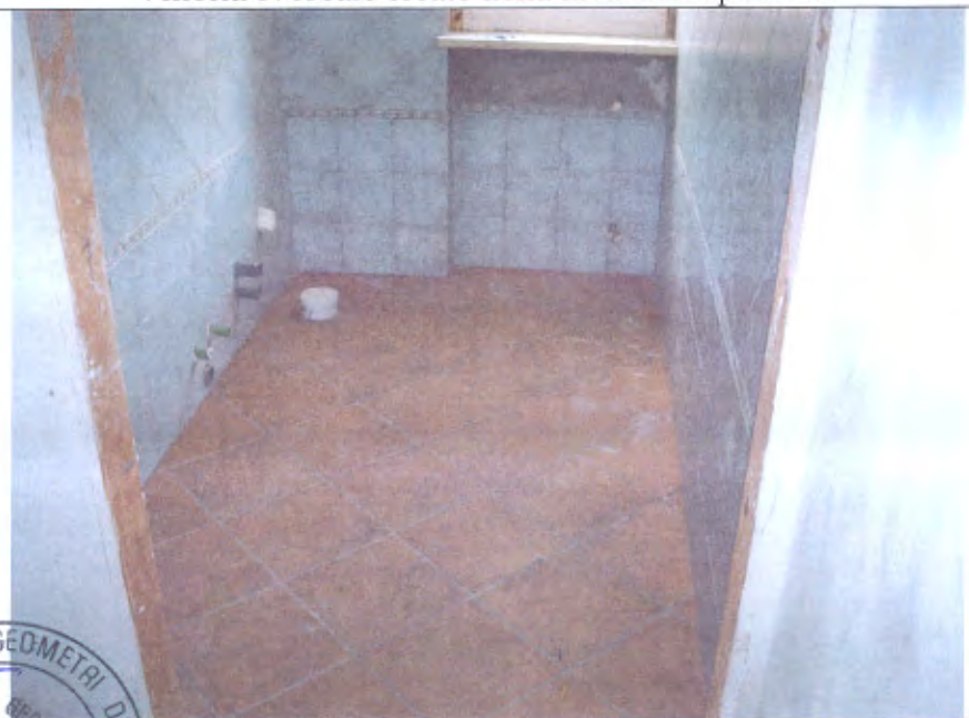
Villetta N bagno piano T