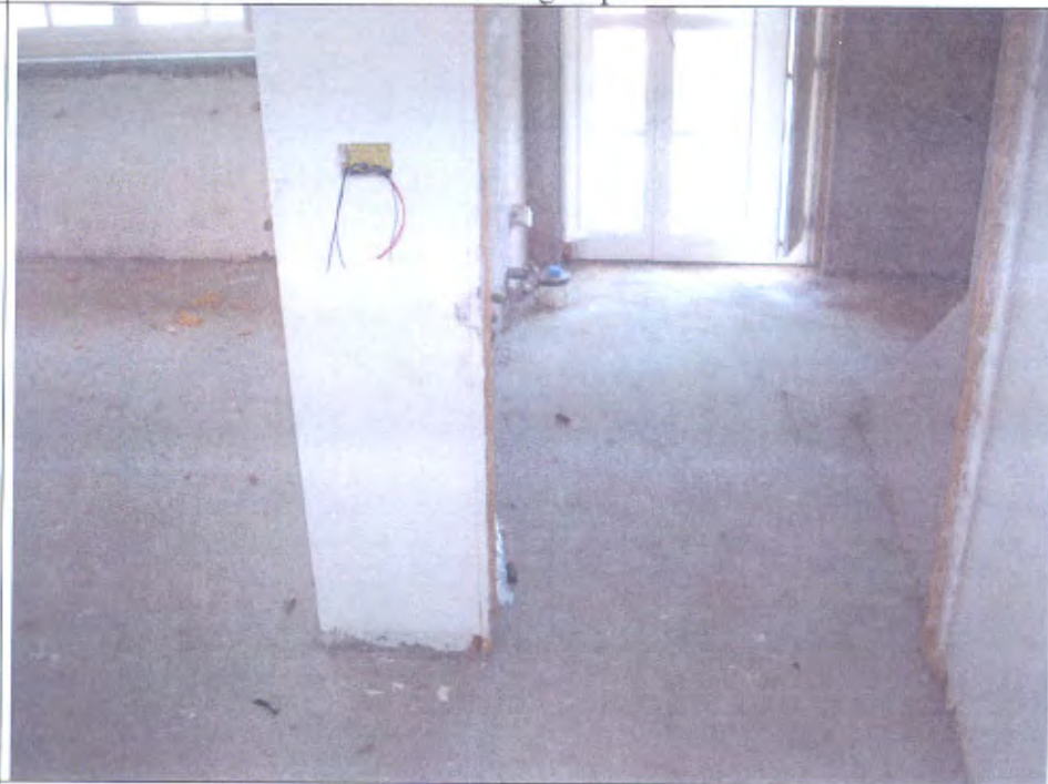
Villetta I bagno piano primo