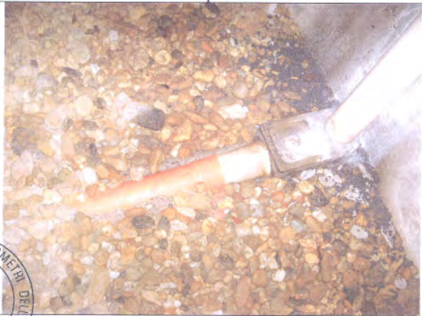
LOTTO E-F pozzetto pluviale corsello