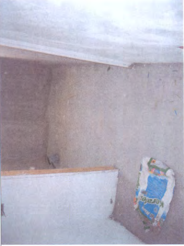
Villetta H bagno piano T