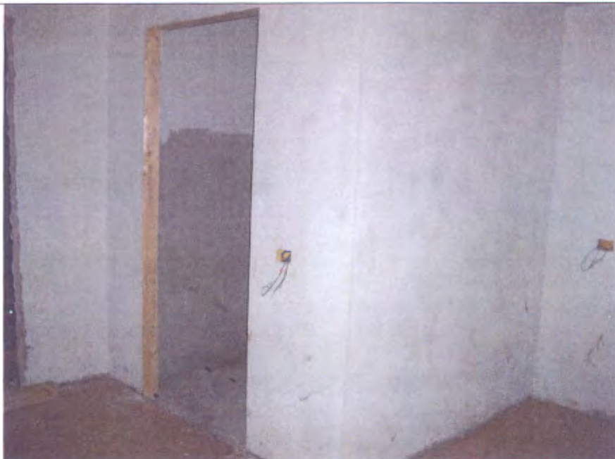
Villetta N locale creato nella lavanderia piano S1