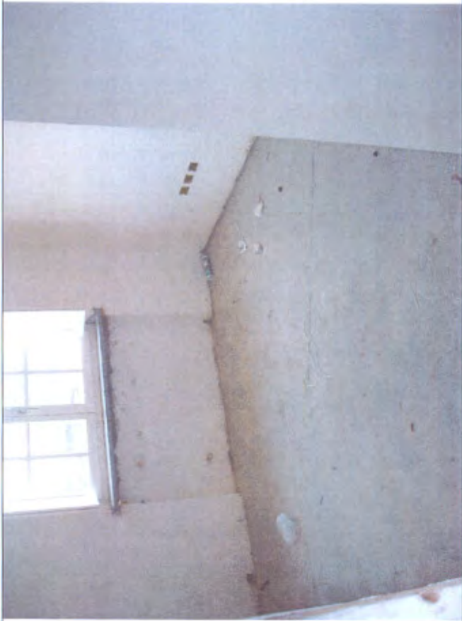
Villetta I camera piano 1°