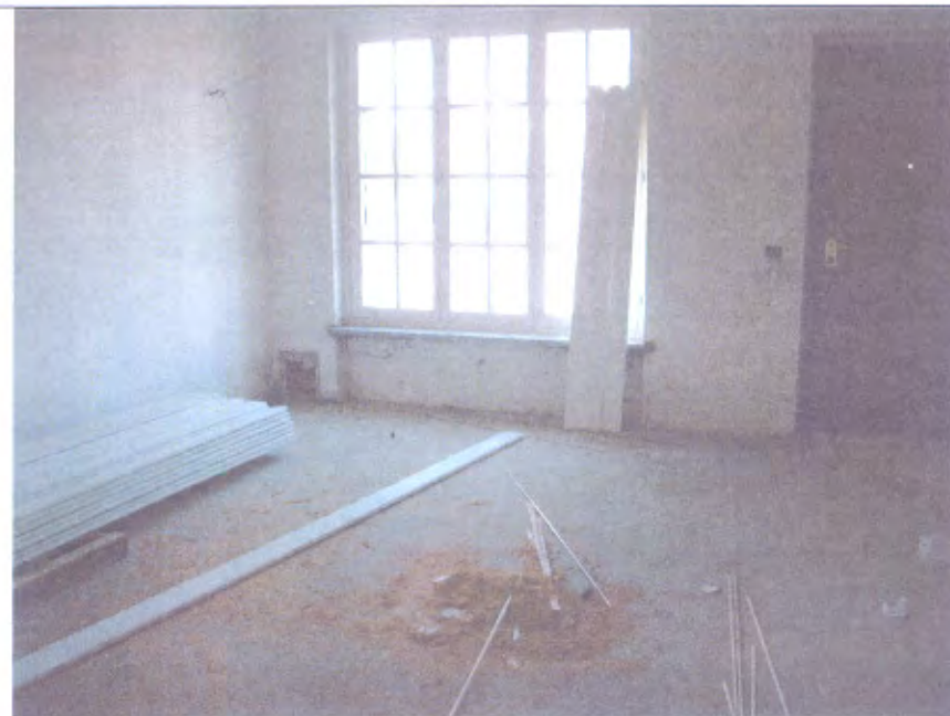
Villetta L soggiorno piano terra