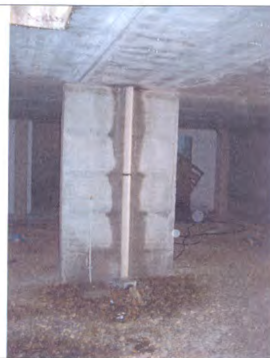
LOTTO E-F pluviale corsello