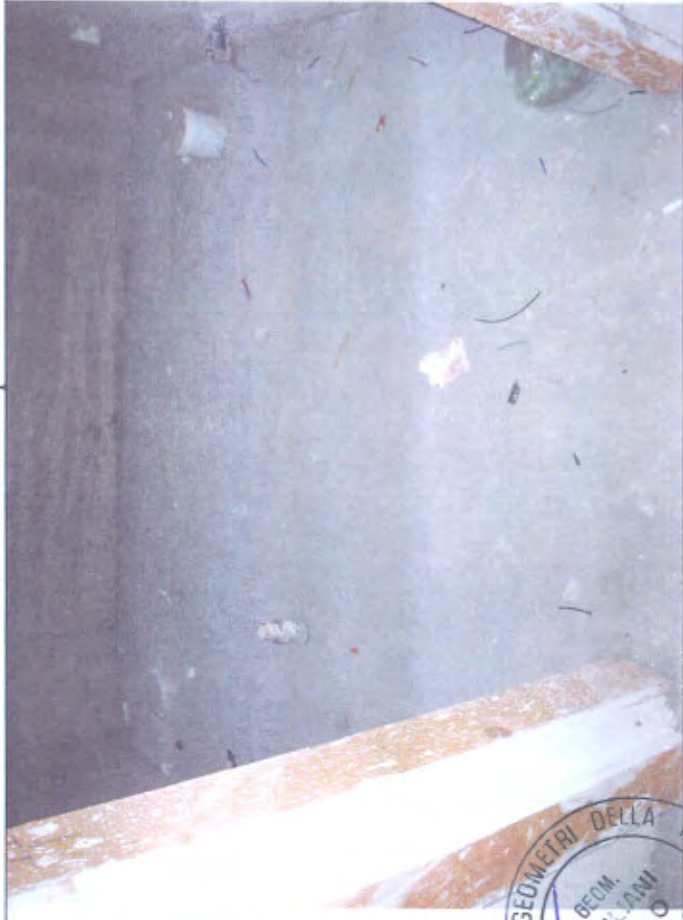
Villetta I bagno piano 1°