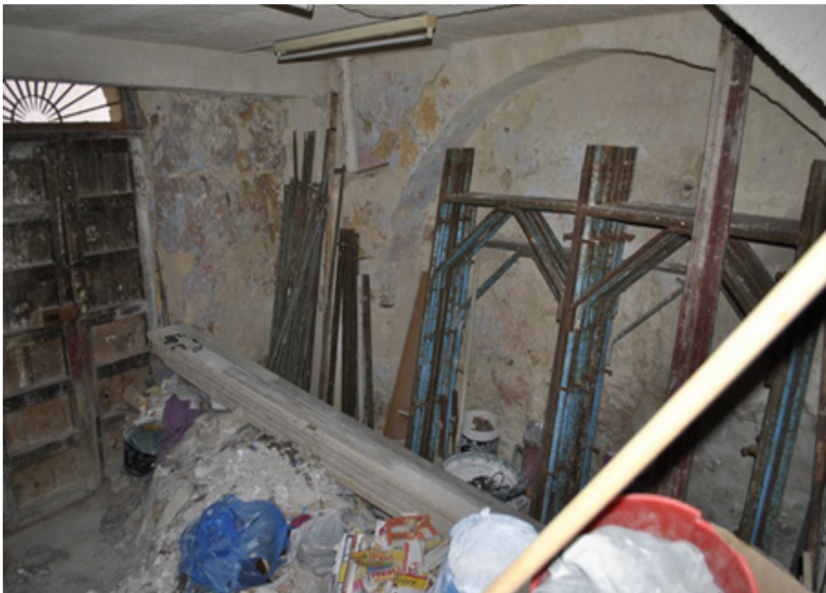
VANODISPONIBILE AL PIANO TERRA CON ACCESSO DAL CORTILE LAURANA