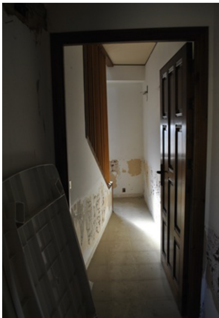
DISIMPEGNO / VANO SCALA PIANO PRIMO.