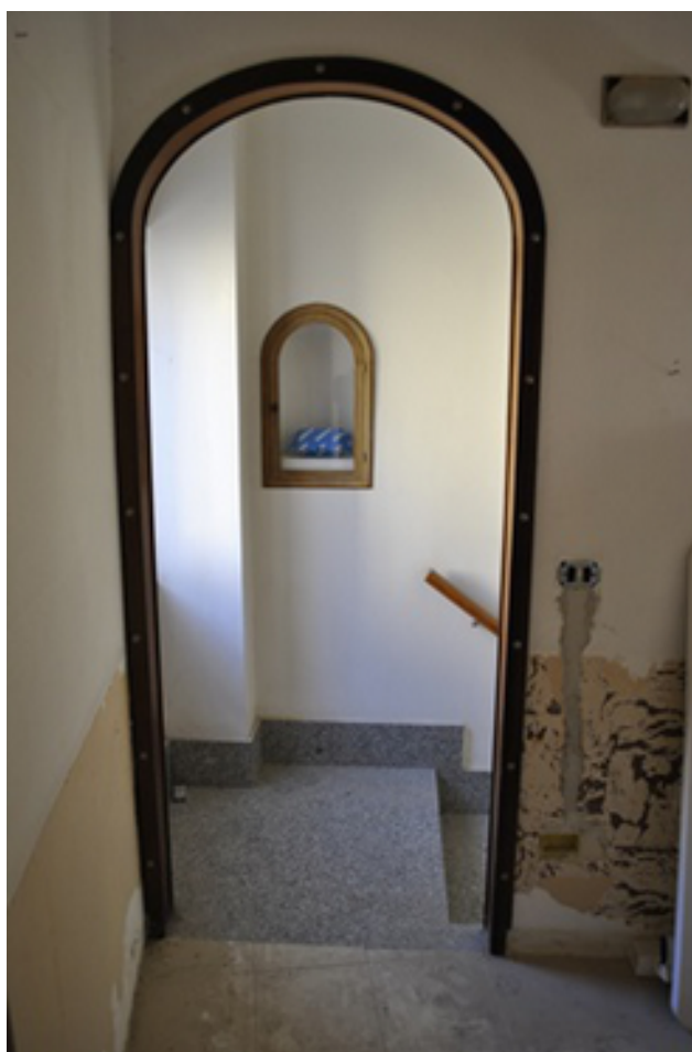
INGRESSO PIANO PRIMO.