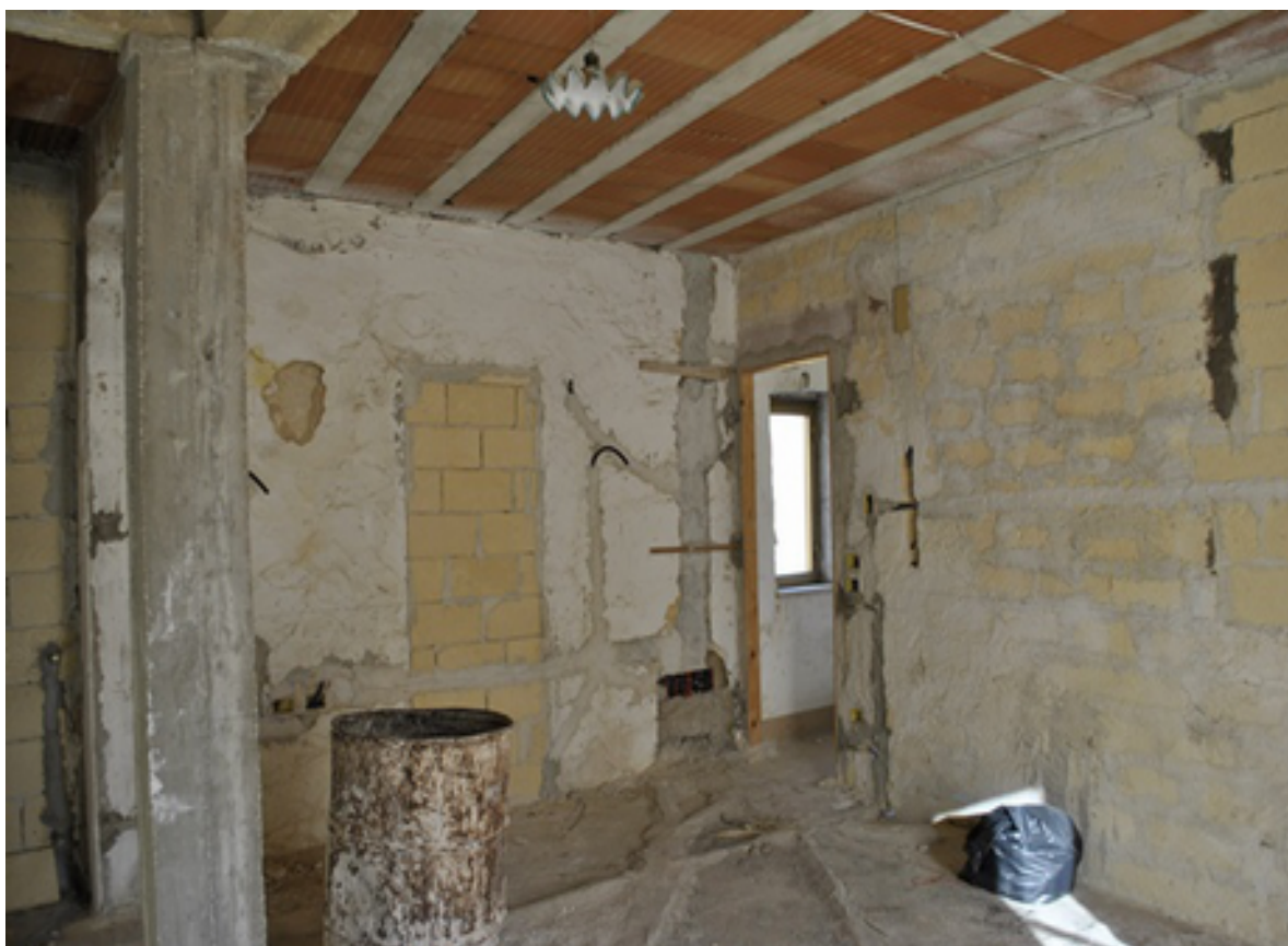
27 VANO UNICO AL GREZZO DEL PIANO SECONDO