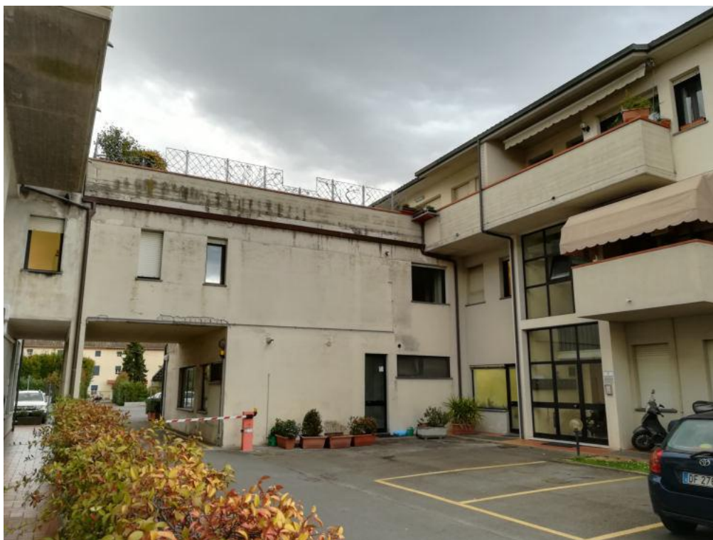
prospetto lato sud