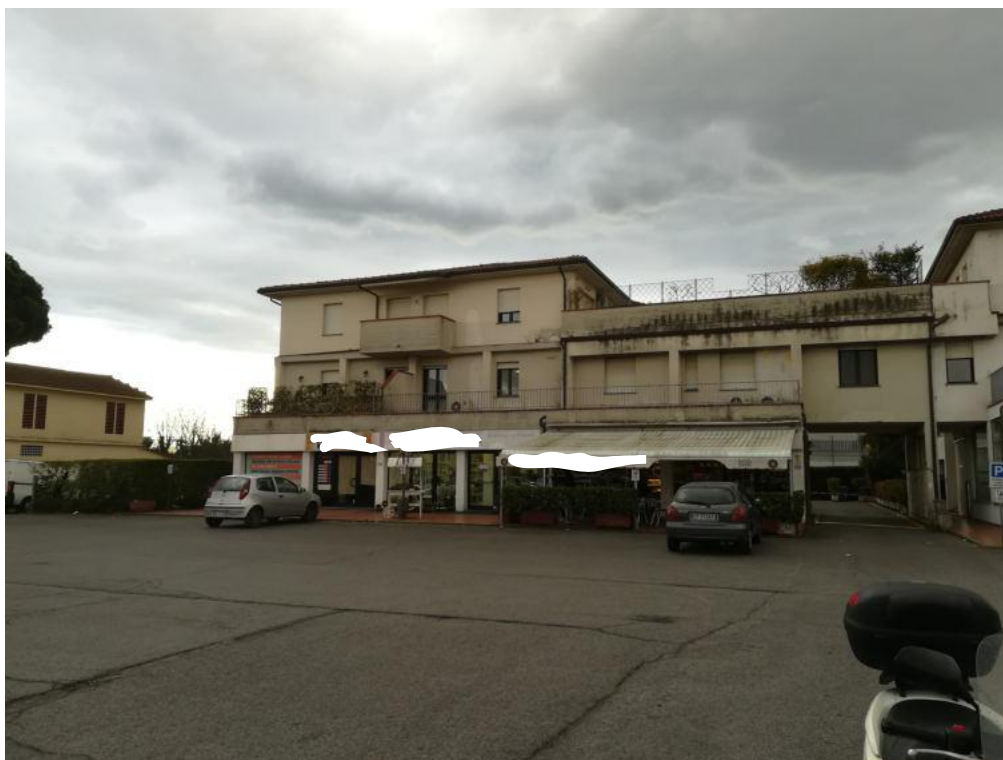
prospetto lato nord