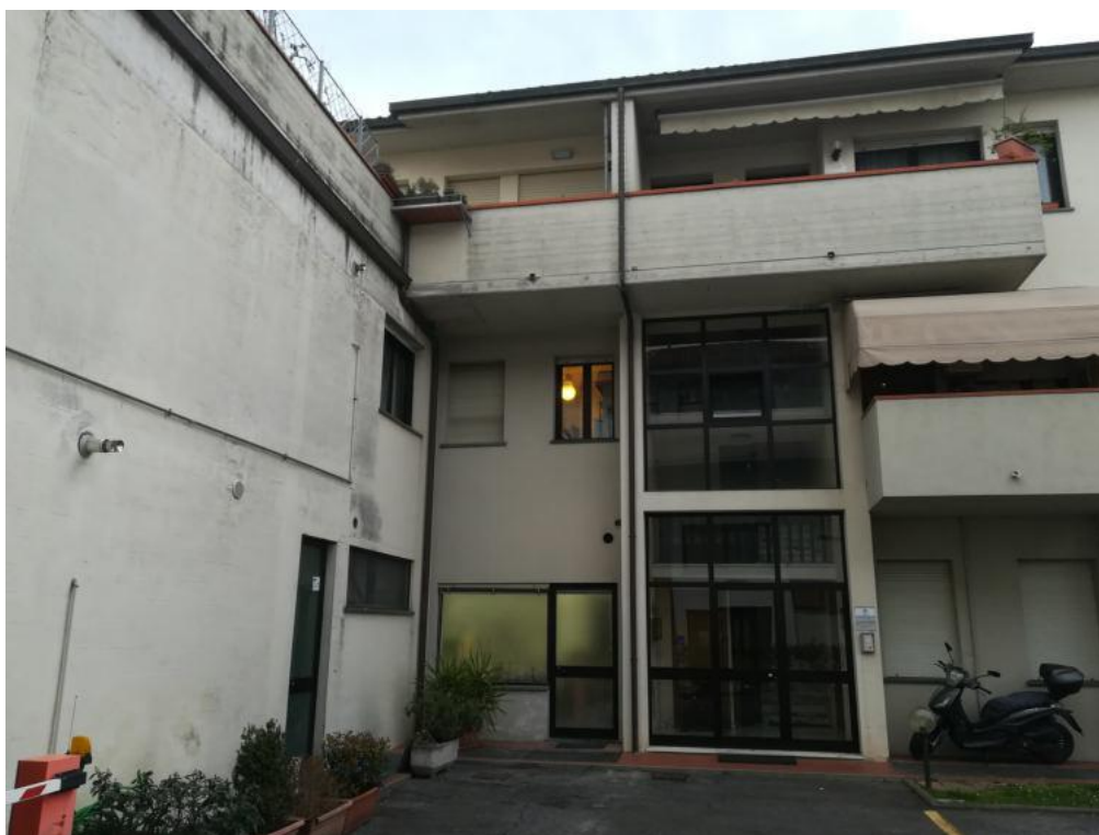
accesso vano scale