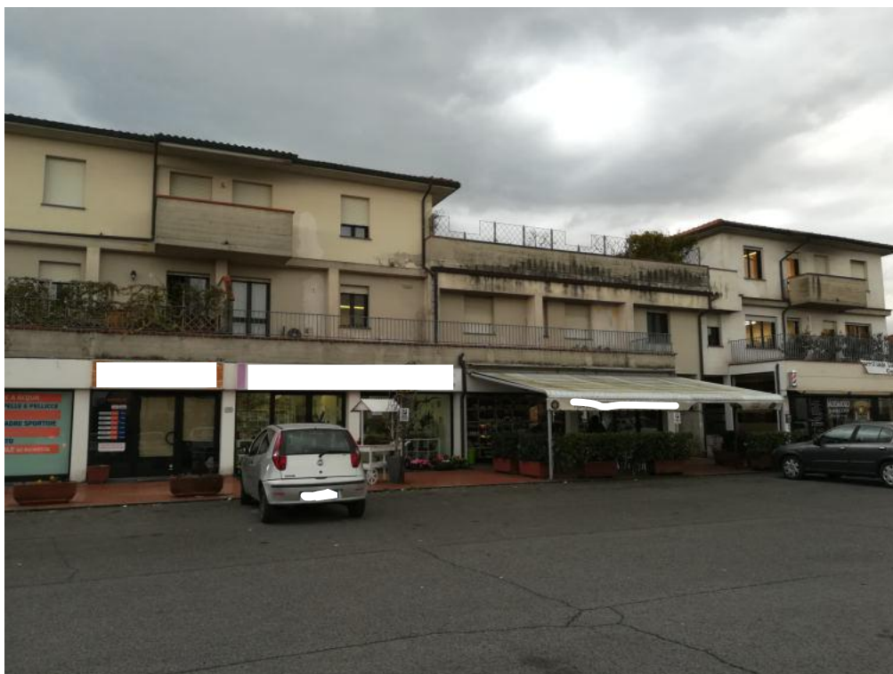
prospetto lato nord

prato, via ferrucci n°95/d tel. e fax 057425071 lucca, via degli asili, n°16 tel. e fax 0583175951