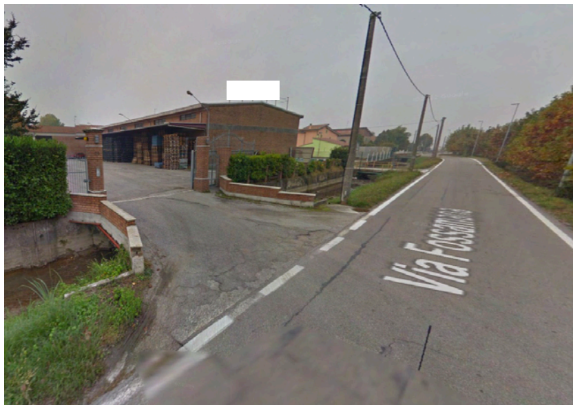
Foto n° 2: vista dell'ingresso carraio dalla pubblica Via Fossamana