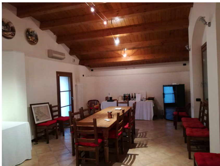
Foto n° 23: vista interna del locale di rappresentanza al piano primo