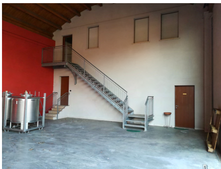
Foto n° 6: vista del portico ed ingresso zona servizi e locali al piano primo