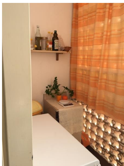
21. Veranda (vista 1)