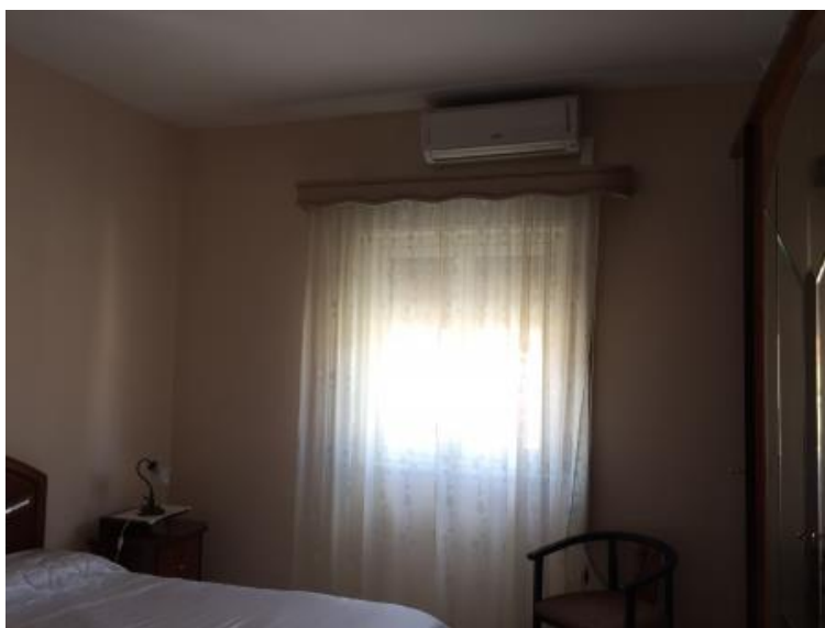
17. Camera matrimoniale