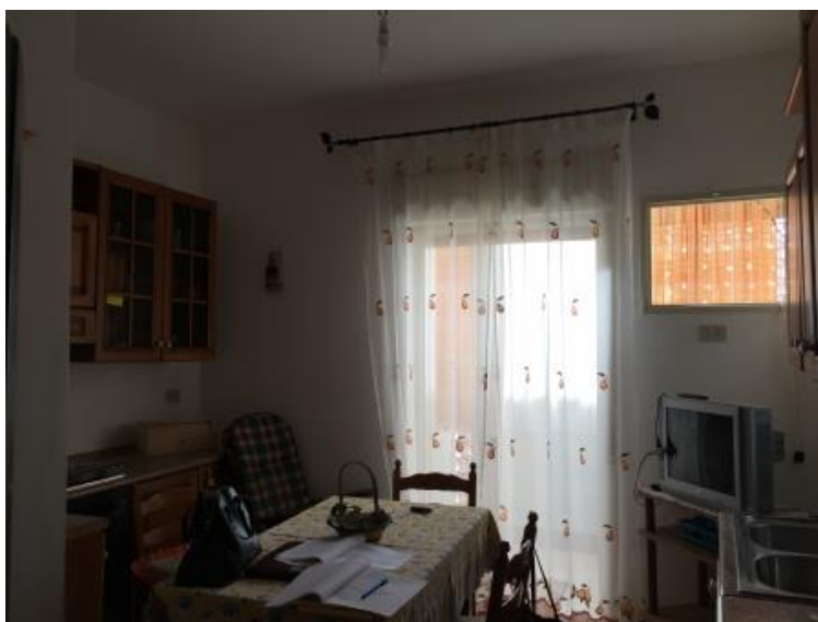
20. Cucina – (vista 2)