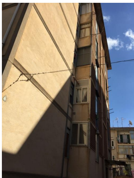
5. Prospetto su cortile interno ( vista 2)