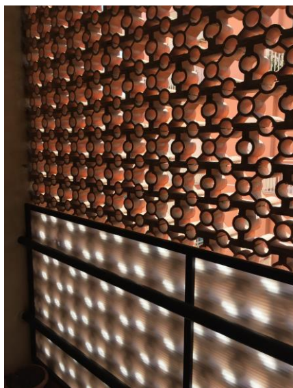
8. Ringhiera scala edificio