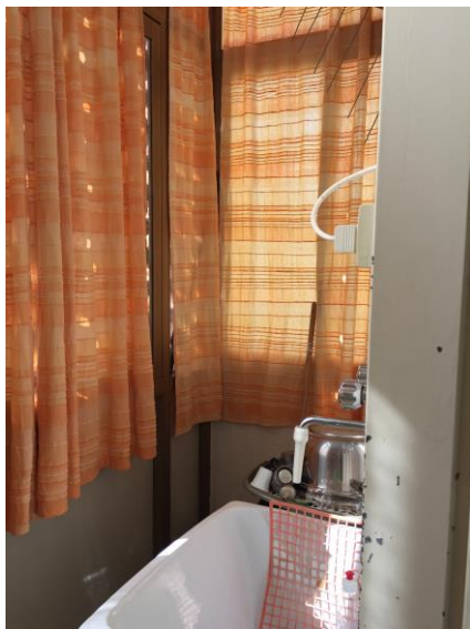
22. Veranda (vista 2)