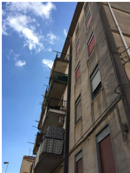
1. Vista dell'immobile da via Ajutamicristo (foto 1)