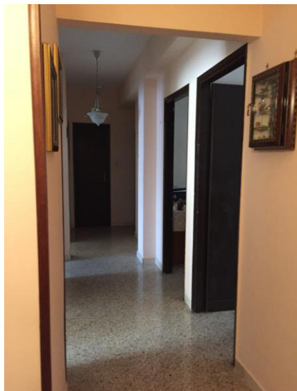
10. Ingresso e corridoio