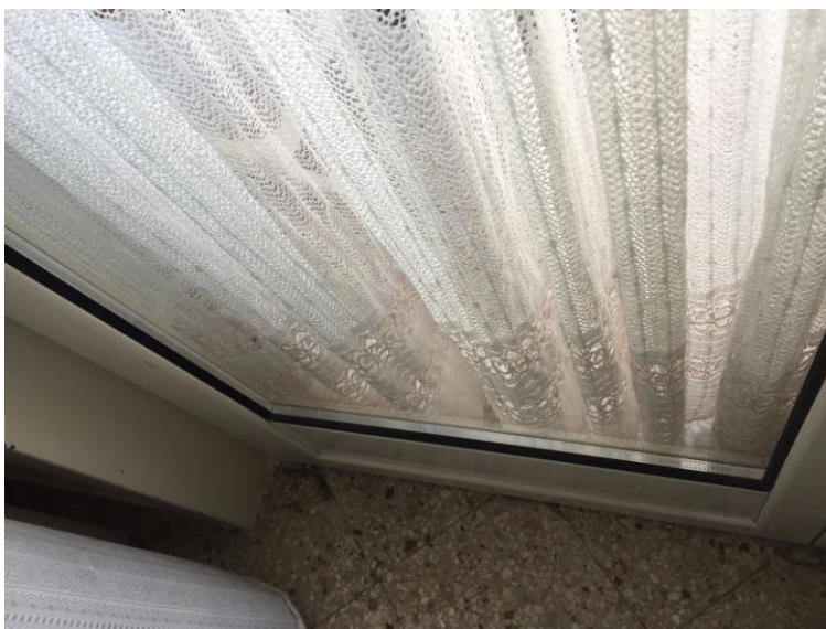
12. Particolare infisso esterno salotto