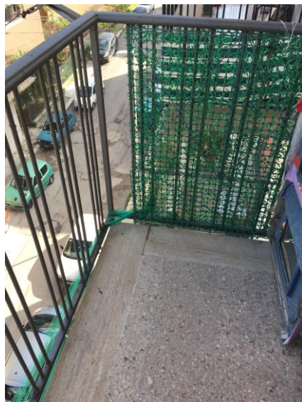
13. Balcone salotto