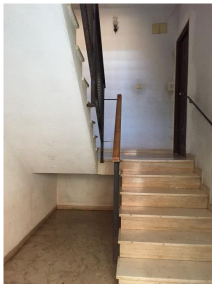
6. Scala interna edificio