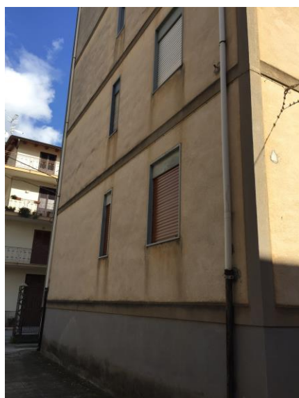
3. Vista laterale dell'immobile