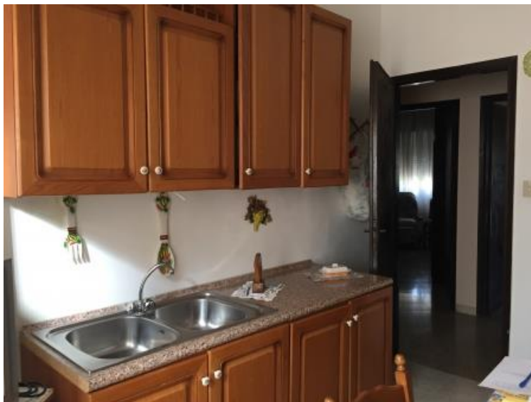
19. Cucina (vista 1)