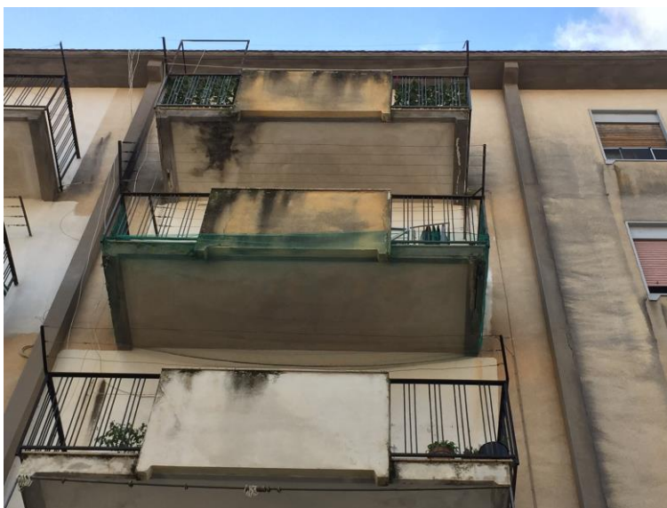
14. Particolare balcone salotto (vista esterna)