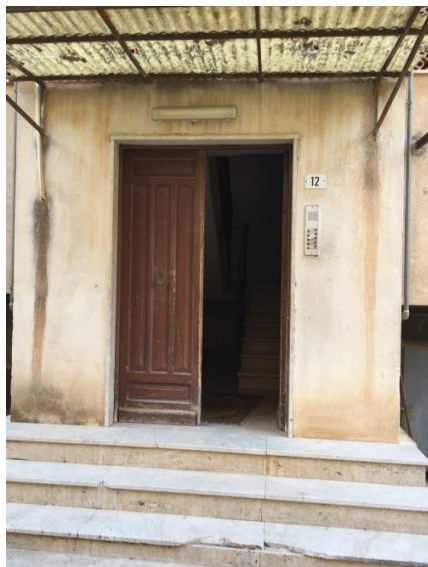
7. Portone d'ingresso