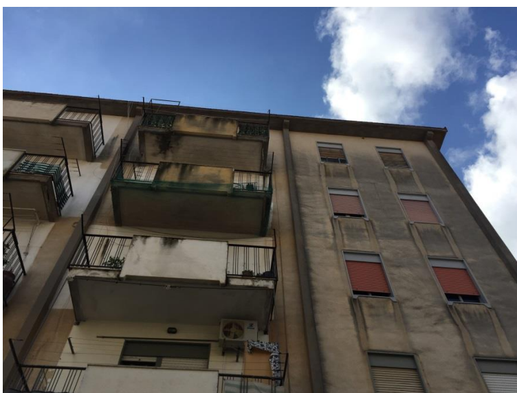
2. Vista dell'immobile da via Ajutamicristo (foto 2)