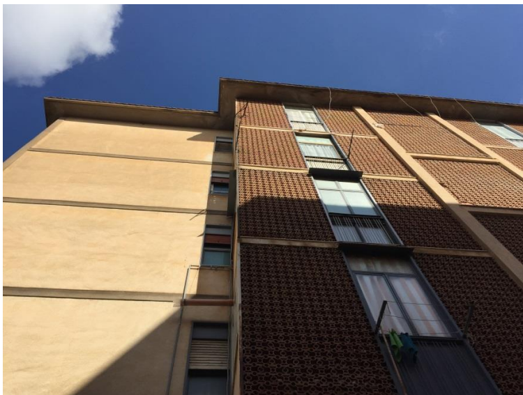
4. Prospetto su cortile interno (vista 1 )