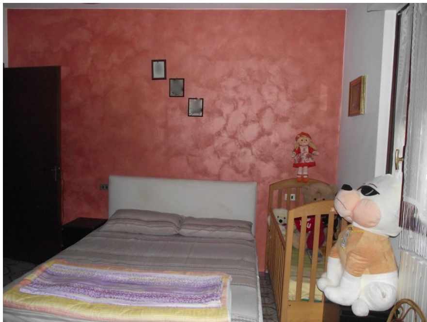
13 Camera da letto