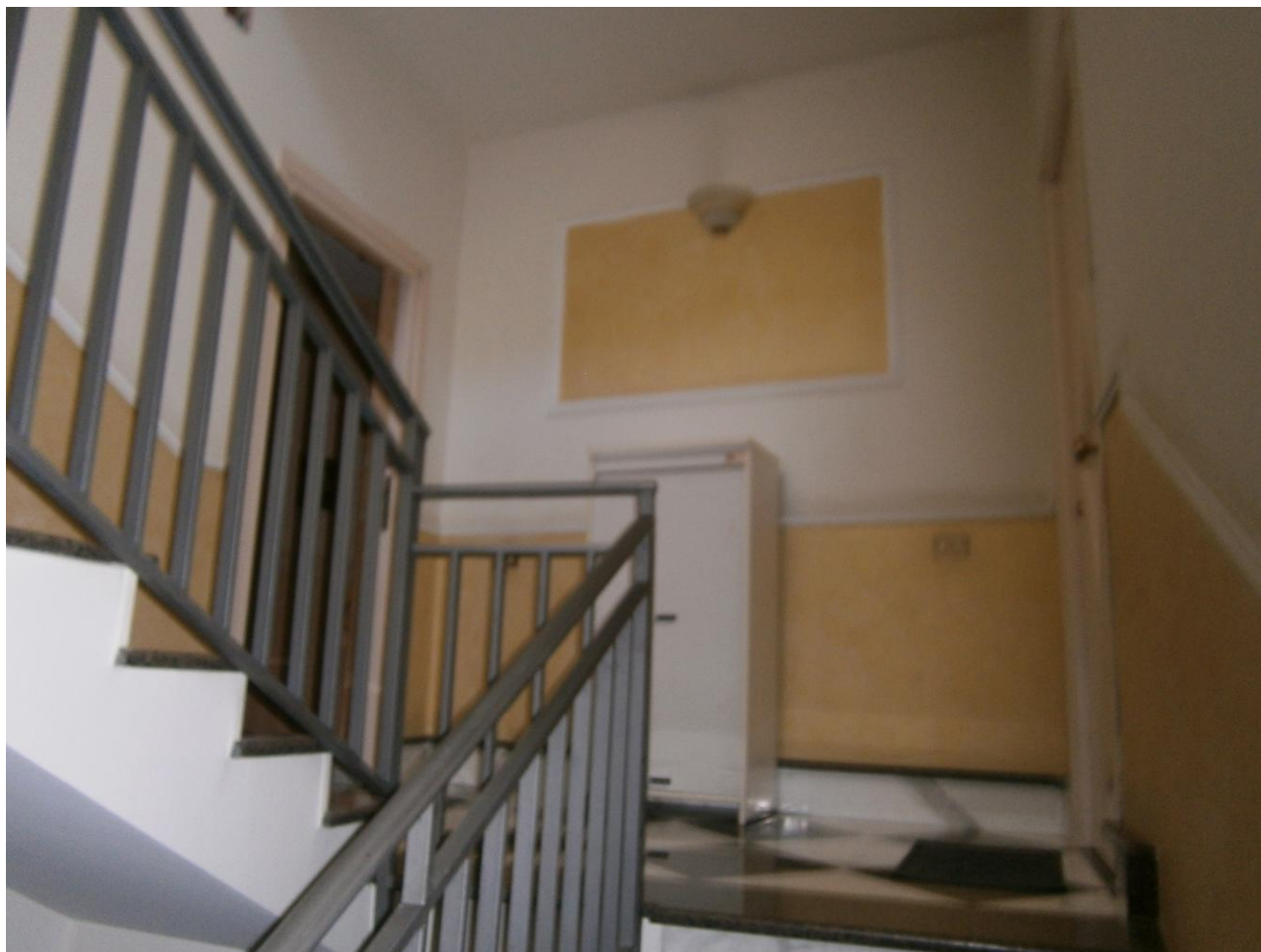
- foto n.5: (interno fabbricato): porta d'ingresso all'u.i. pignorata -