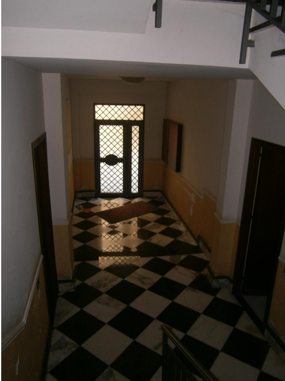
- foto n.4: (interno fabbricato); ingresso/vano scala condominiale (a livello di piano terra) del fabbricato comprendente l'u.i. pignorata -