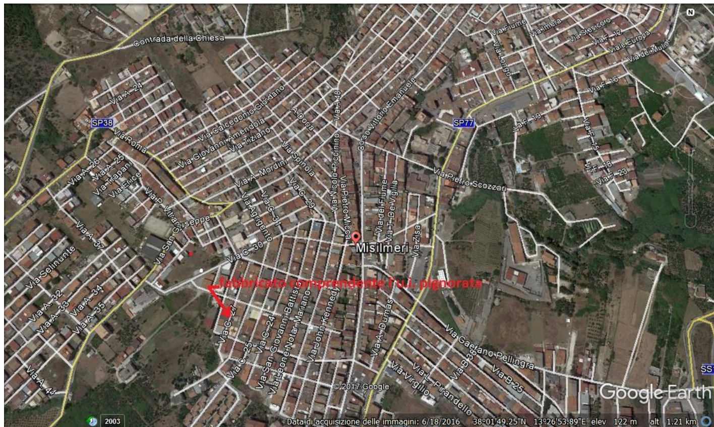
Vista satellitare del centro urbano di Misilmeri con indicazione dell'ubicazione del fabbricato comprendente l'u.i. oggetto del pignoramento