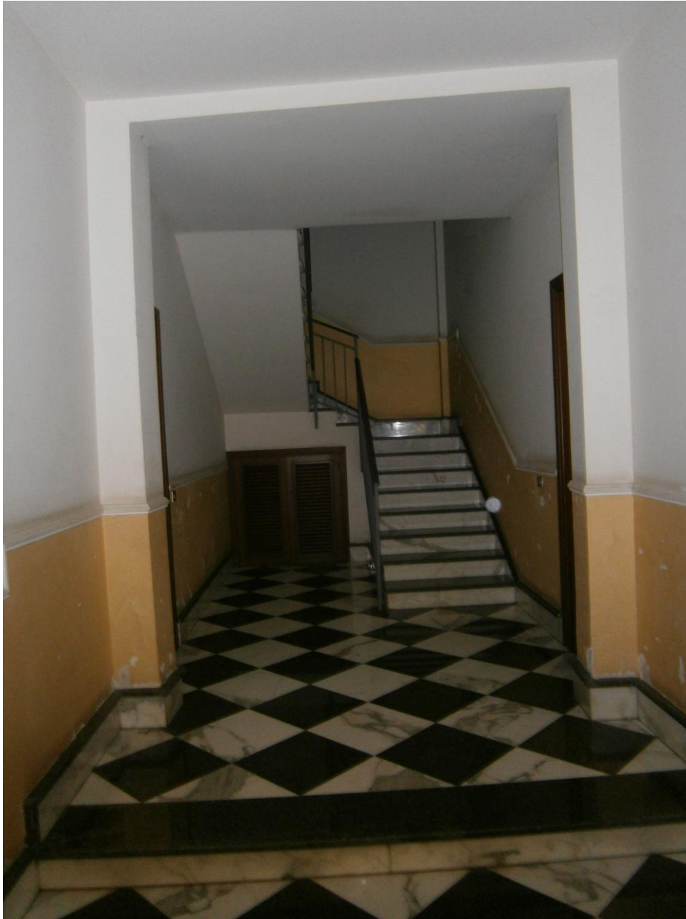
- foto n.3: (interno fabbricato): ingresso/vano scala condominiale (a livello di piano terra) del fabbricato comprendente l'u.i. pignorata -