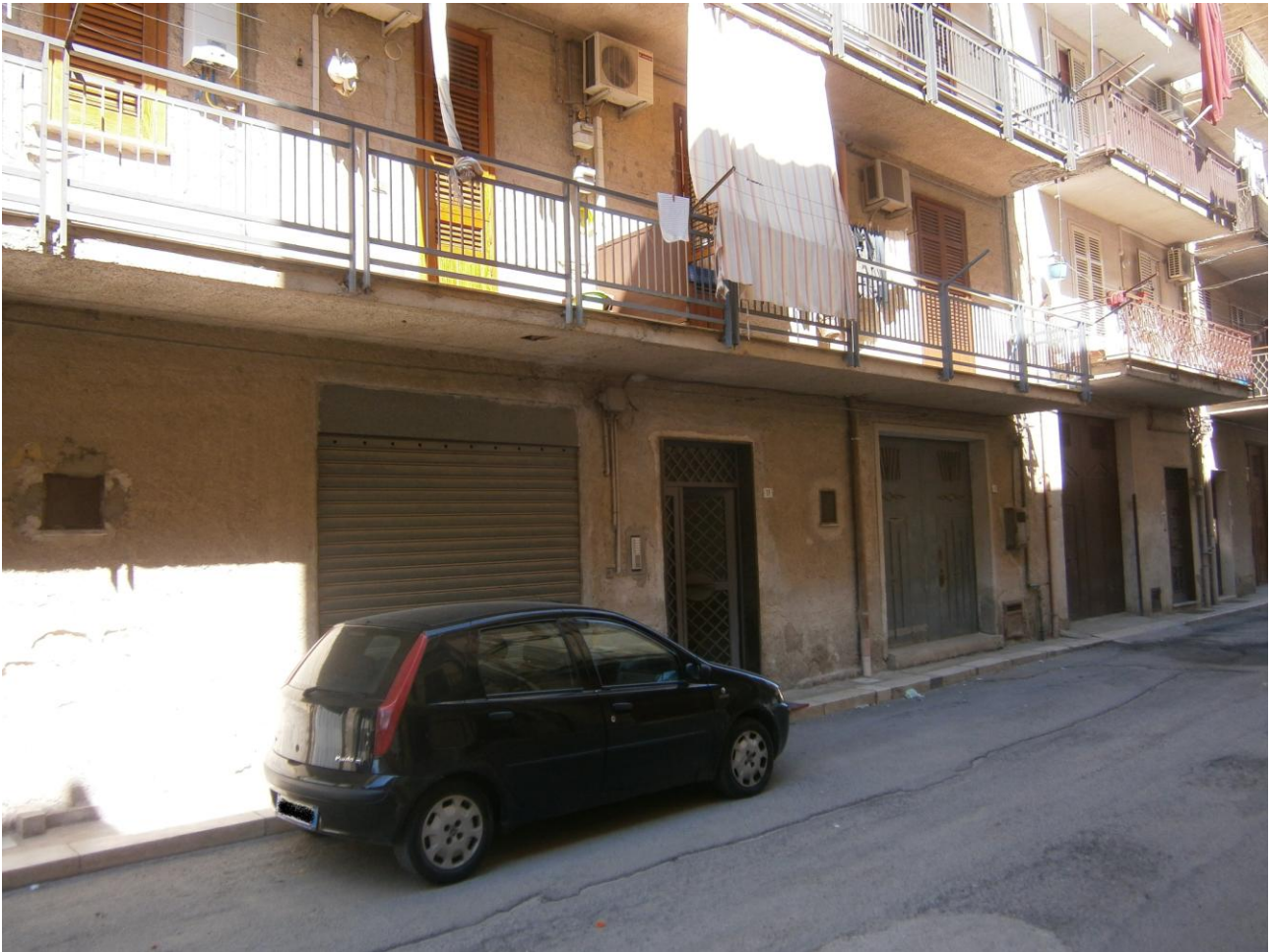
- foto n.2: (esterno fabbricato): portoncino d'ingresso prospetto (sulla via Mariano De Caro) del fabbricato comprendente l'u.i. pignorata -