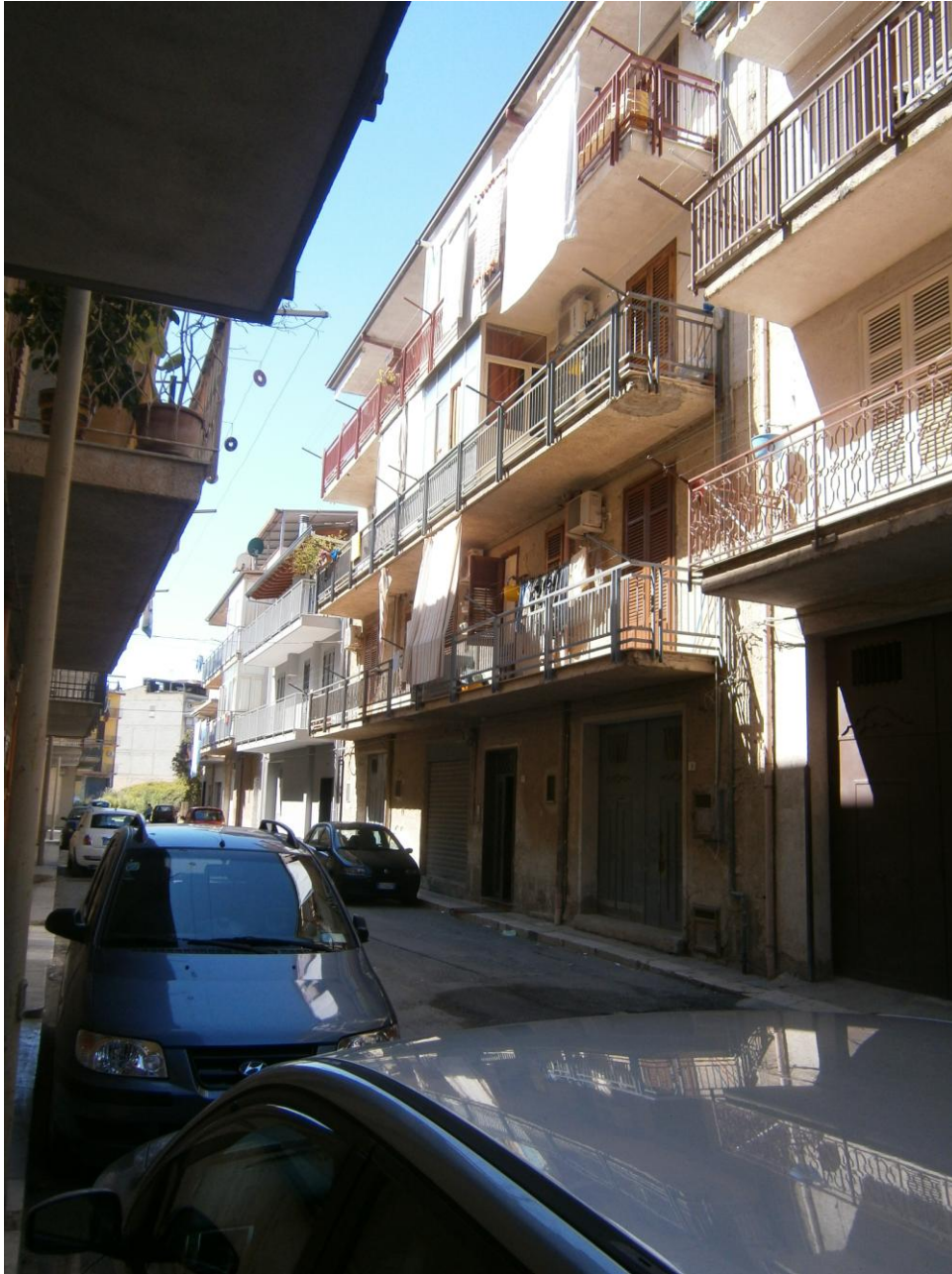
- foto n.1: (esterno fabbricato): prospetto lato Sud/Sud-Est (sulla via Mariano De Caro) del fabbricato comprendente l'u.i. pignorata -

APPARTAMENTO PER CIVILE ABITAZ. SITO IN MISILMERI, VIA MARIANO DE CARO N.11