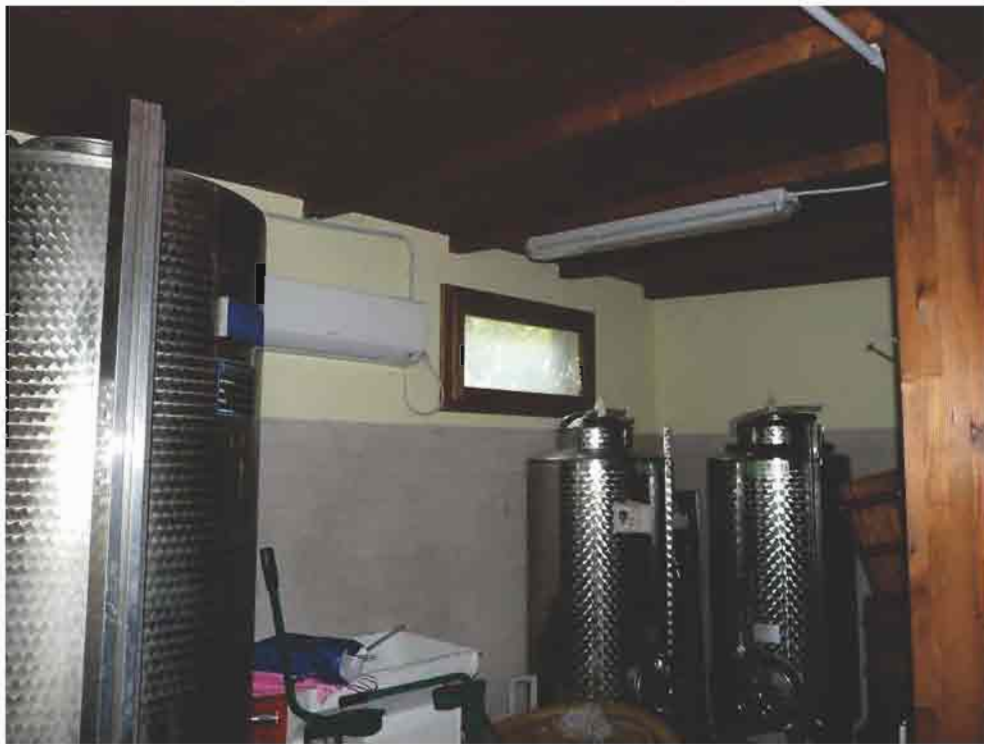
↑ Foto N. 17: Interno manufatto In legno con contenitori Inx per v Ino