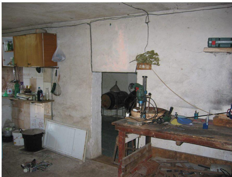
INGRESSO LOCALE DEPOSITO