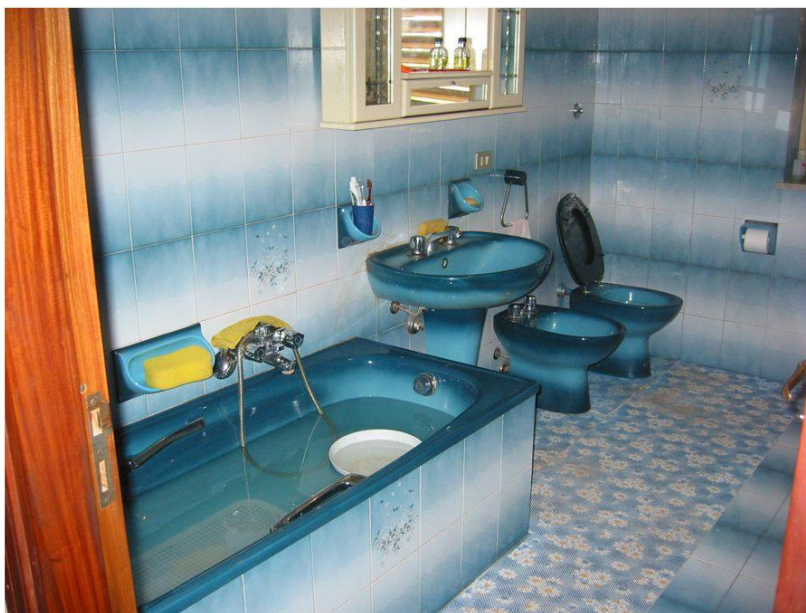
PIANO SEMINTERRATO SUB - 3