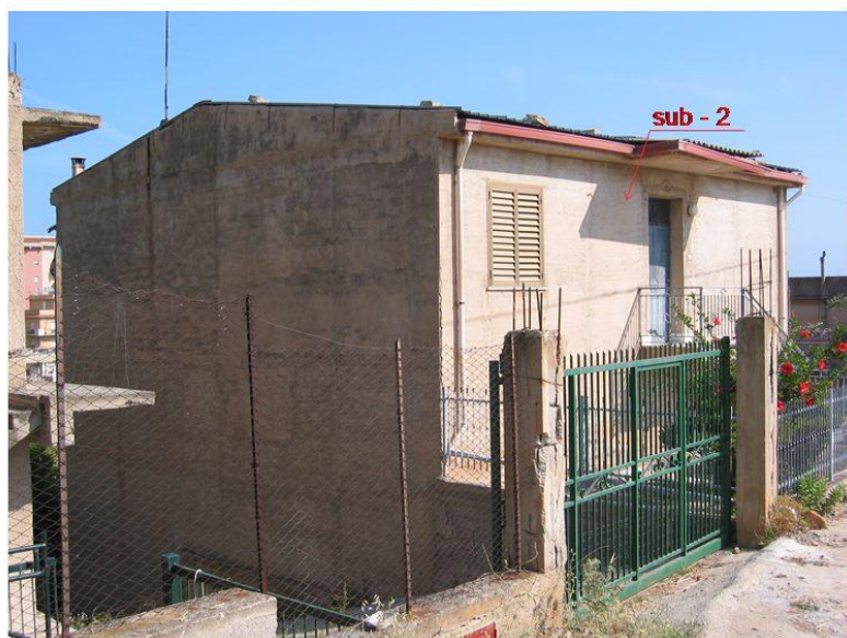
PROSPETTO S - O