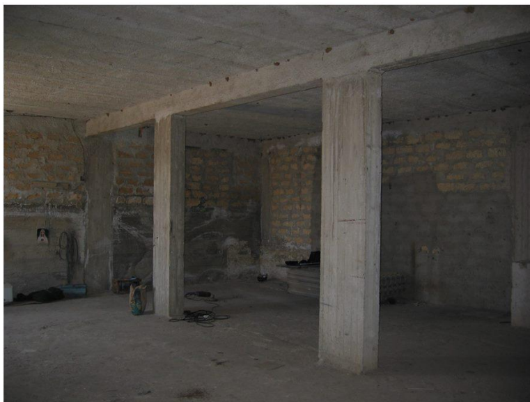
VISTA PARETI SOTTOSTRADA