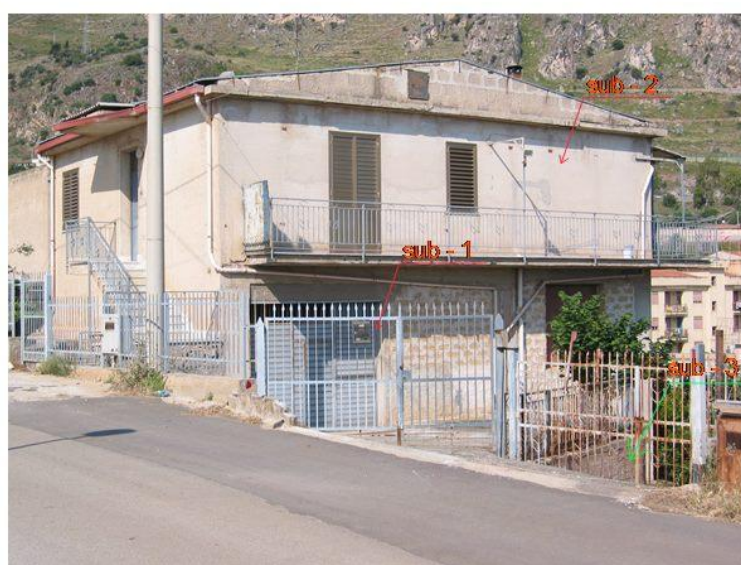
PROSPETTO N - E