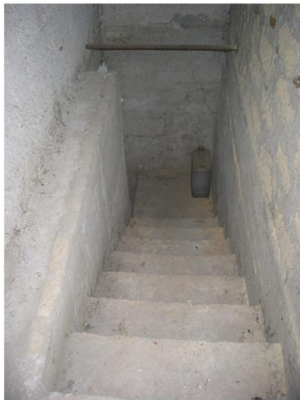
CORPO SCALA AL PIANO SEMINTERRATO