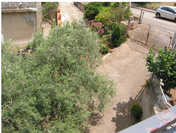
VISTA TERRENO VERSO RECINZIONE CANCELLO P.LLA 487 F. 5