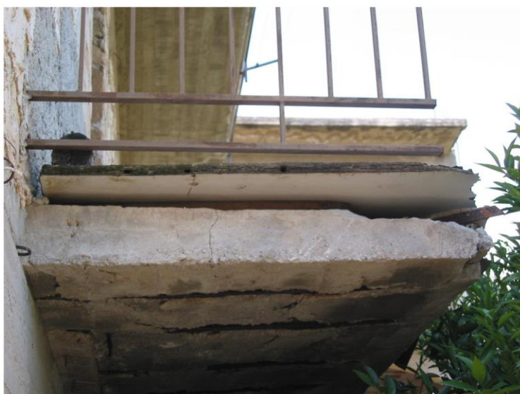
DETTAGLIO BALCONE SUB - 1