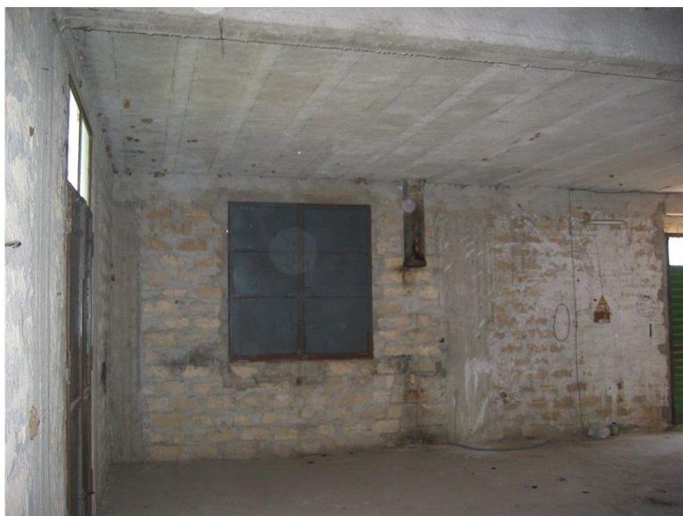
VISTA PARETE INGRESSO