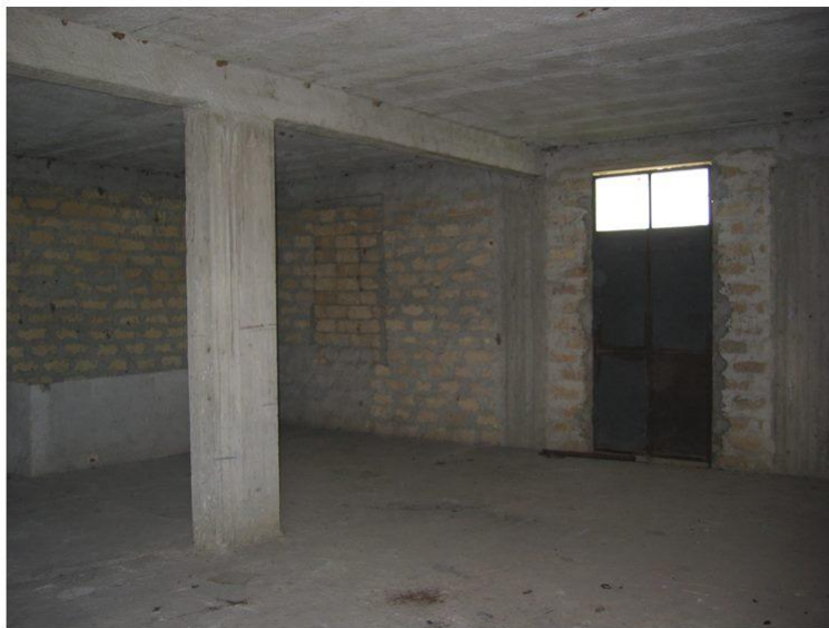
VISTA DA INGRESSO