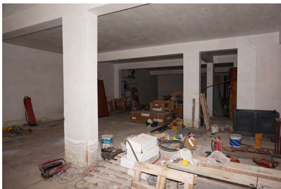
foto 30 - vista ambiente interno