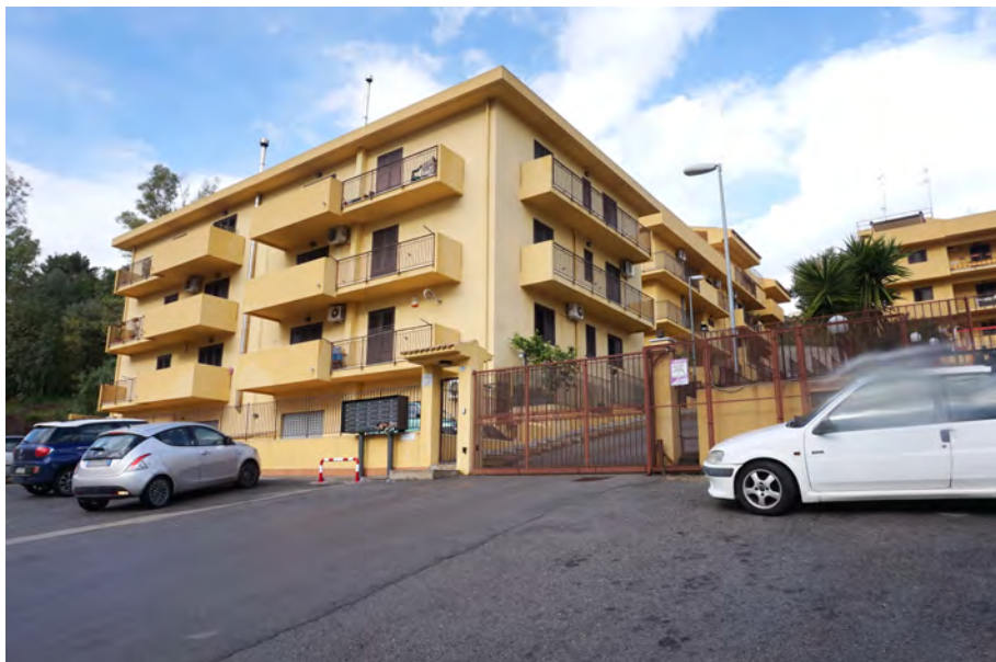
foto 1 - ingresso all'area condominiale su strada