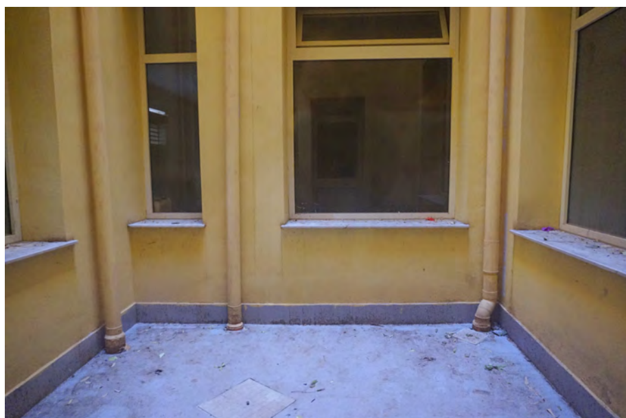
foto 29 - pozzo luce condominiale