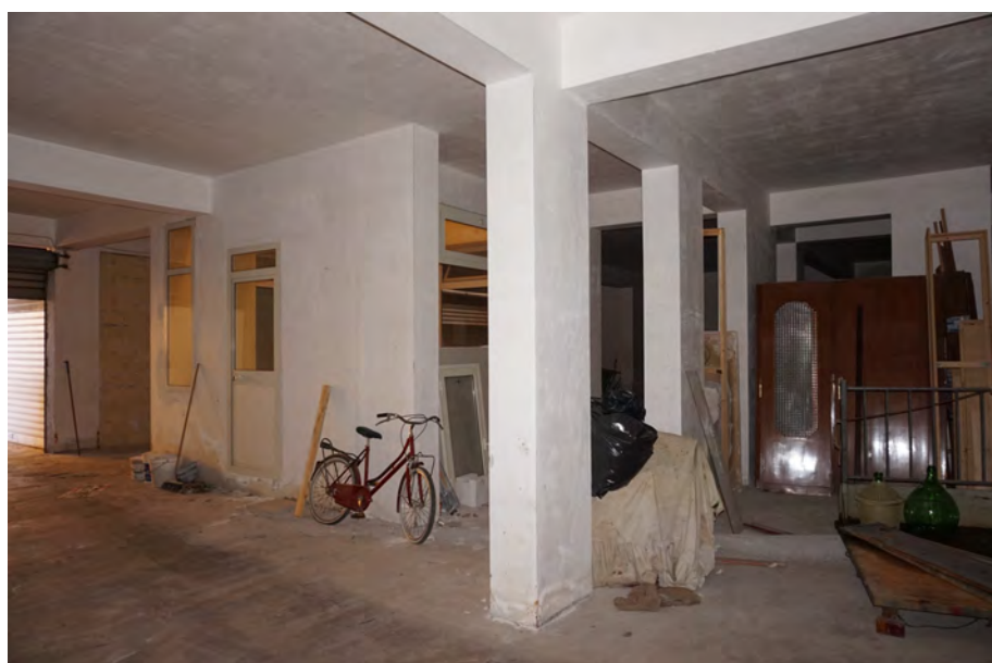
foto 27 - ambiente interno