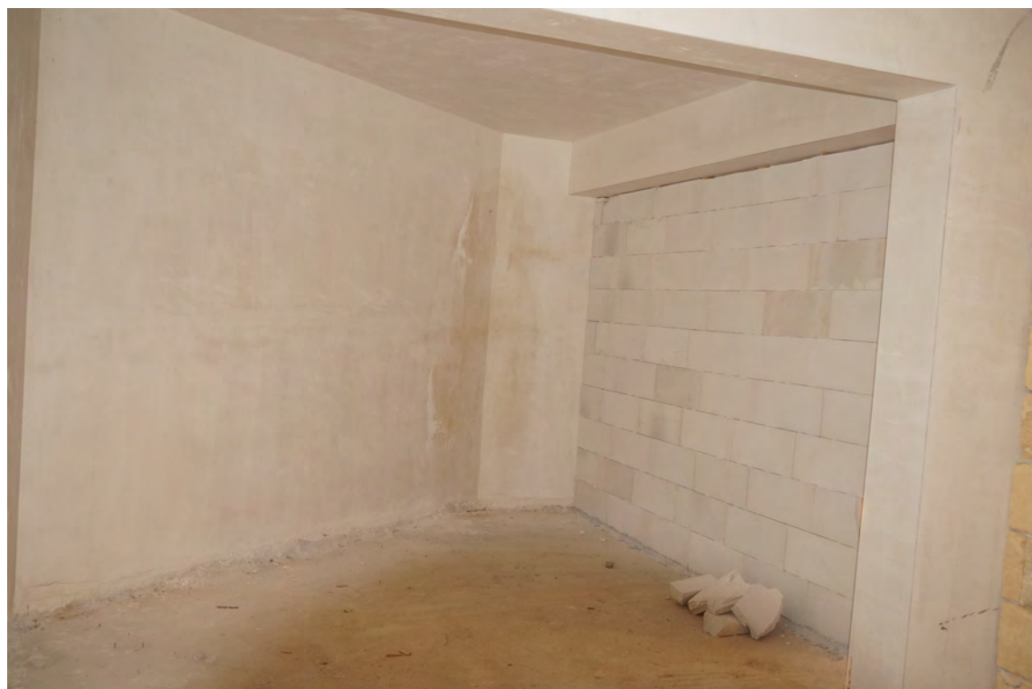
foto 18 - ambienti interni