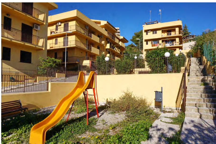
foto 2 - giardino pubblico