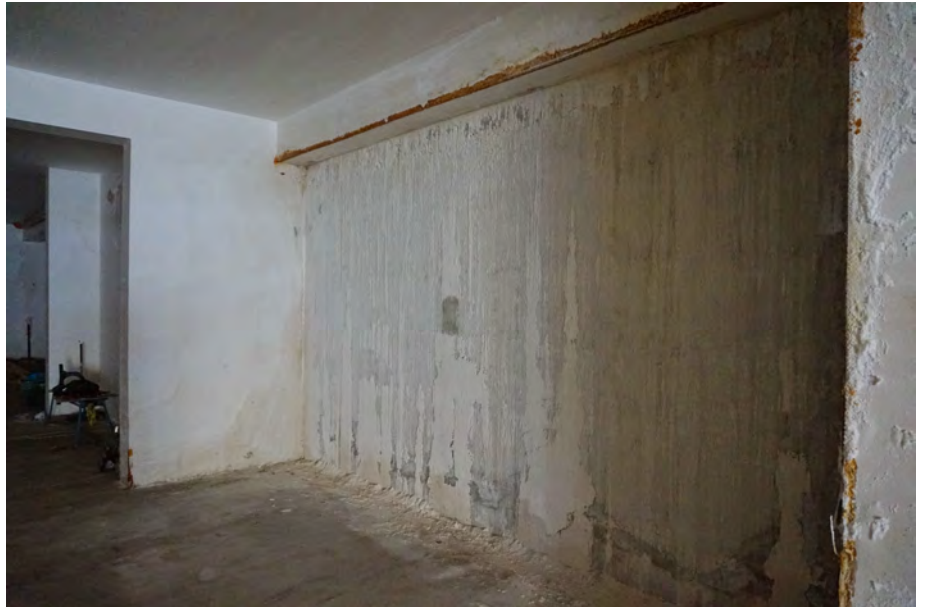
foto 34 - vista del muro ad est dopo l'infiltrazione d'acqua