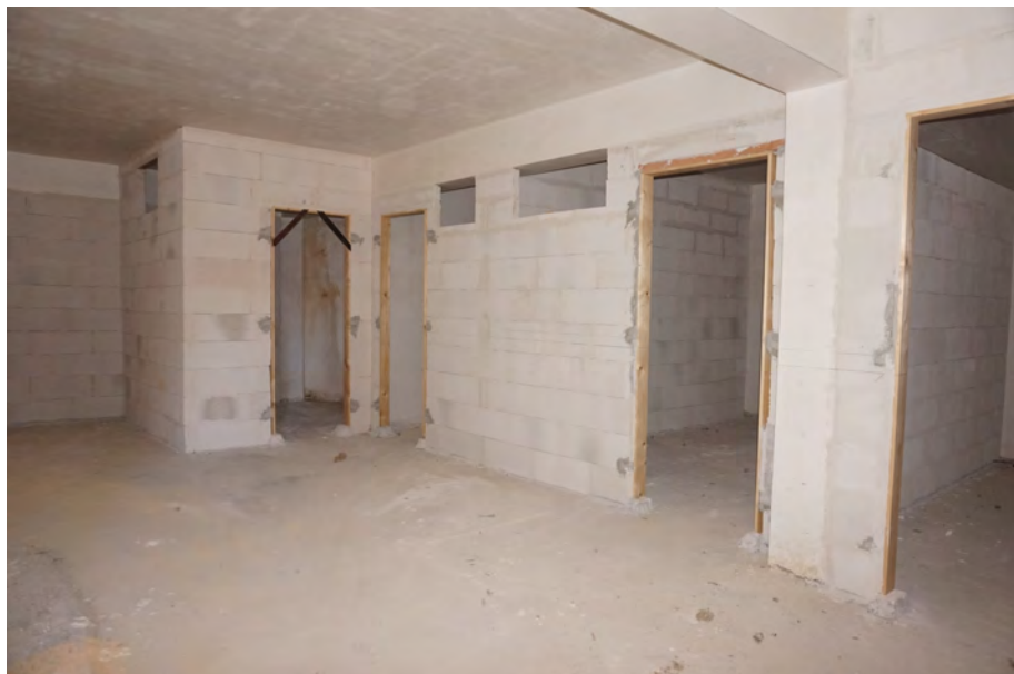
foto 10 - ambienti interni