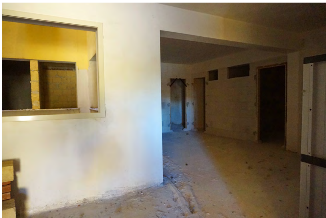
foto 9 - ingresso dal area condominiale esterna