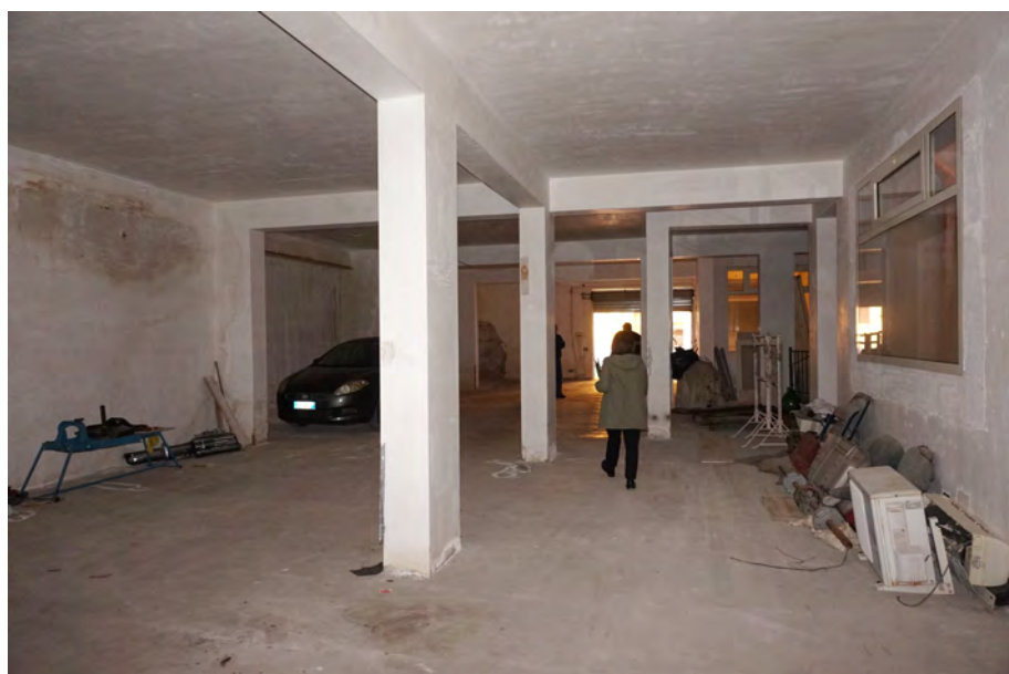
foto 32 - vista ambiente interno