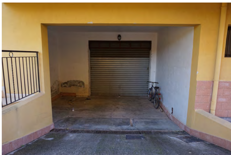
foto 20 - Ingresso Ovest al magazzino del piano S2