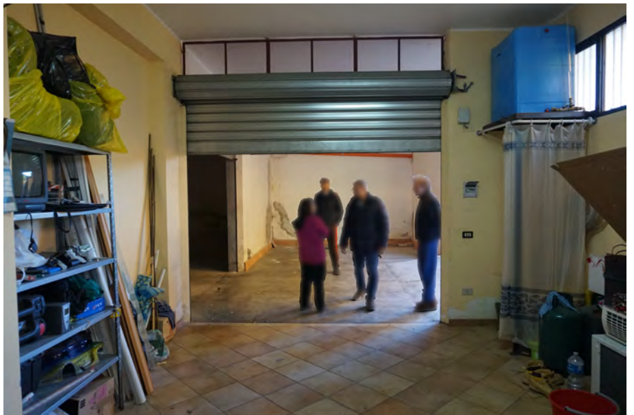
foto 23 - vista della porzione di magazzino resa indipendente