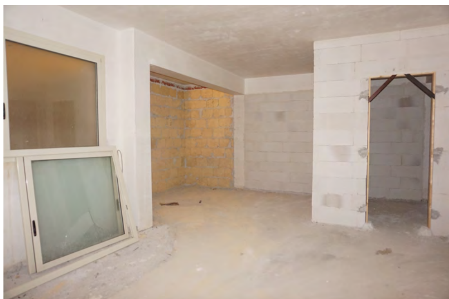
foto 11 - ambienti interni