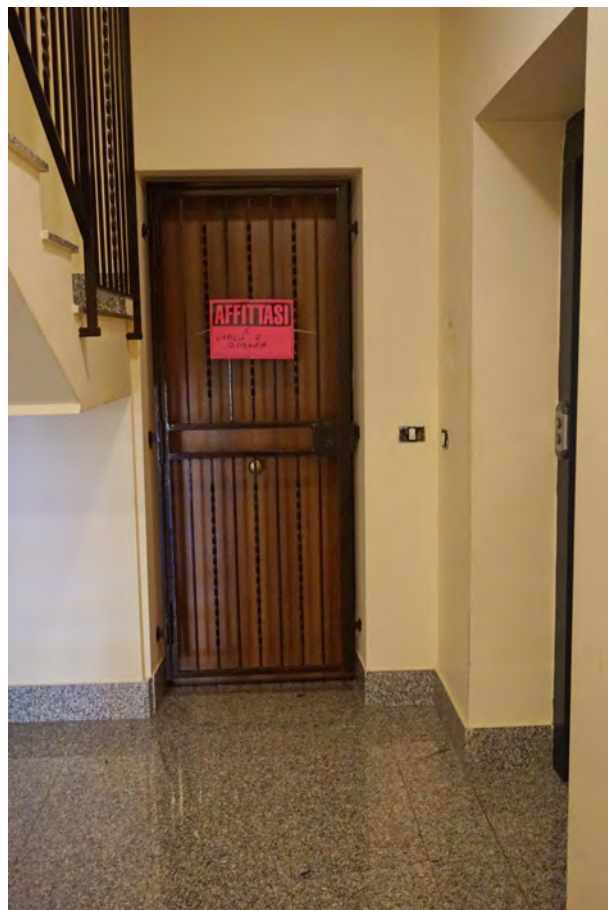
foto 8 - ingresso da androne