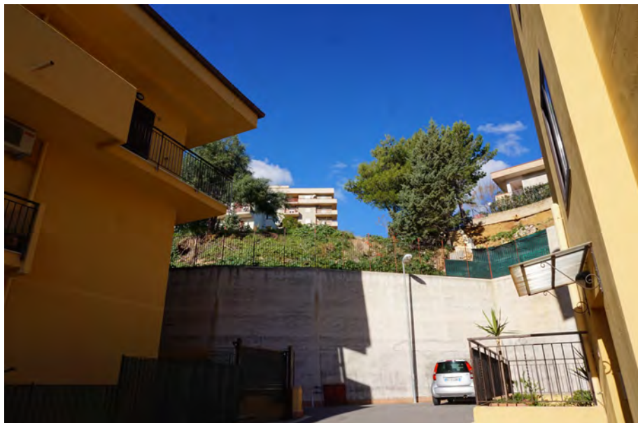
foto 37 - foto del muro di contenimento del terreno