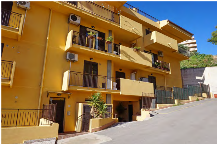
foto 4 - Ingresso al magazzino di piano S1