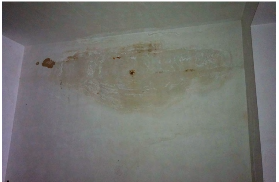
foto 35 - vista del muro ad Est dopo l'infiltrazione d'acqua