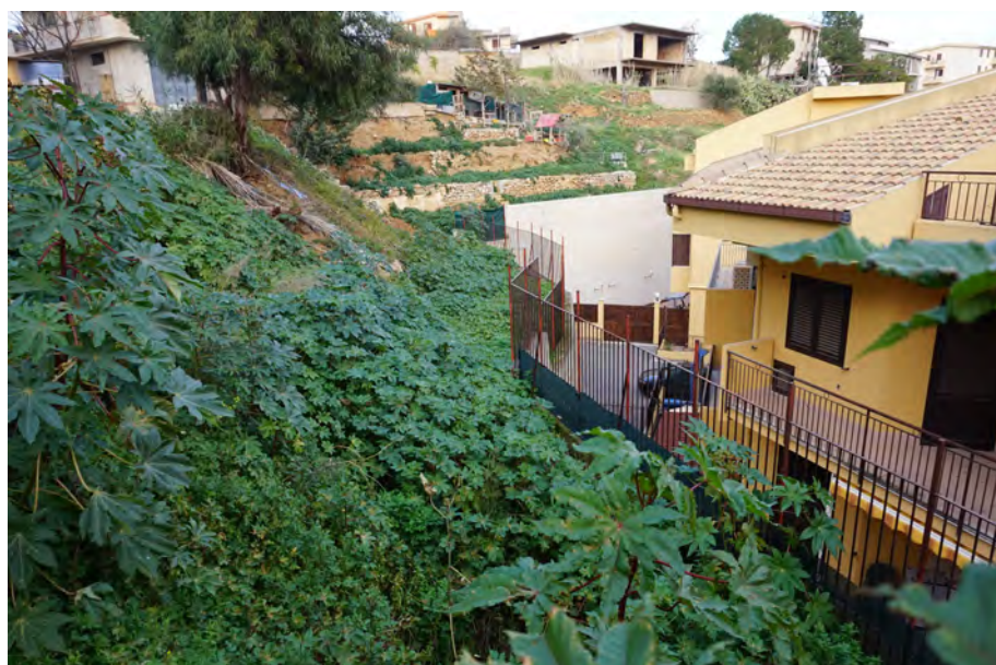
foto 38 - vista del terreno dalla sommità