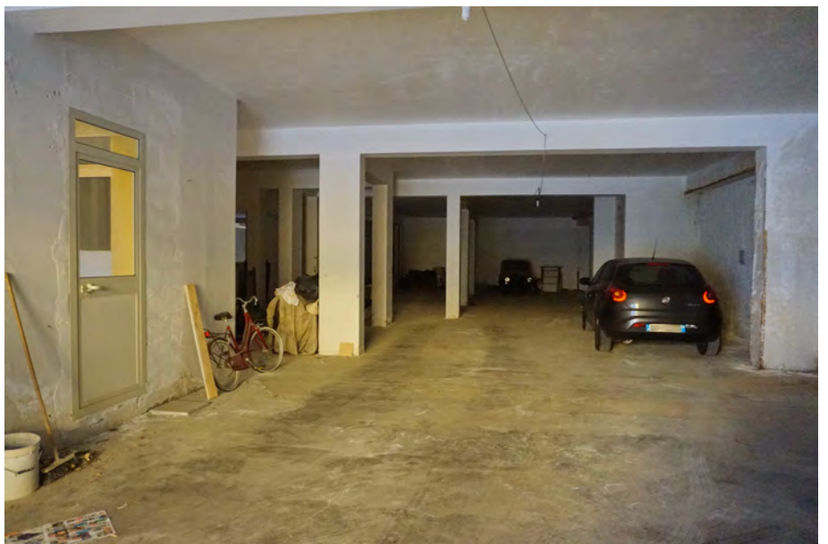
foto 24 - ambienti interni