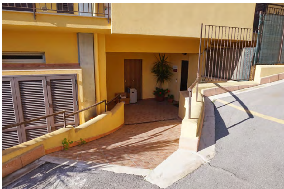
foto 5 - Ingresso al magazzino di piano S1