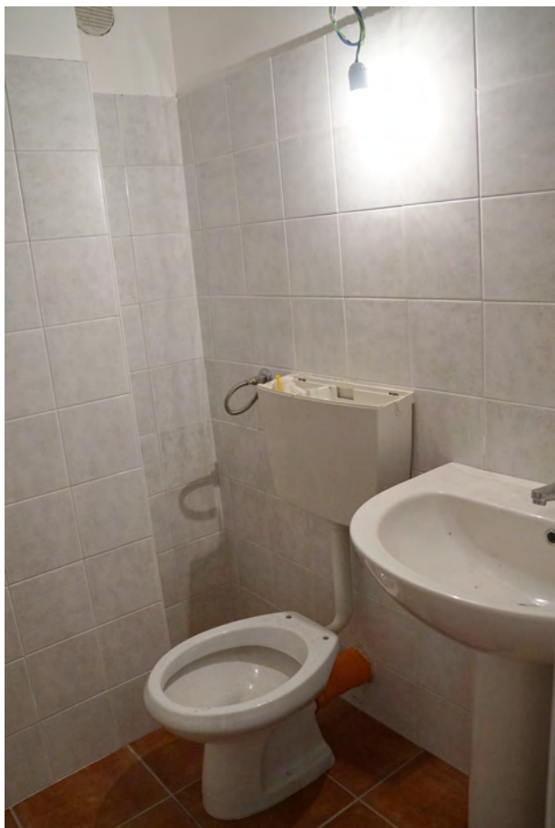
foto 16 - bagno