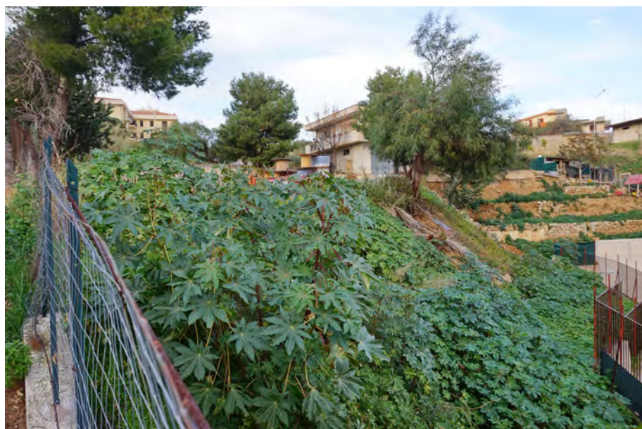
foto 39 - vista del terreno dalla sommità