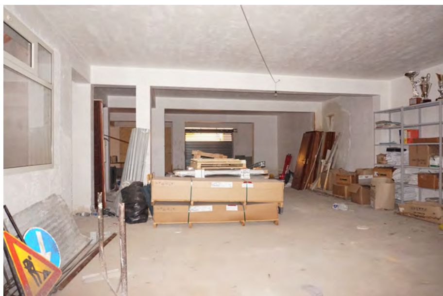
foto 26 - ambiente interno