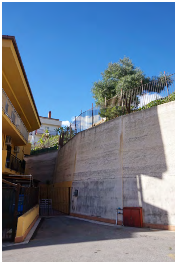
foto 41 - vista dell'area condominiale dal basso