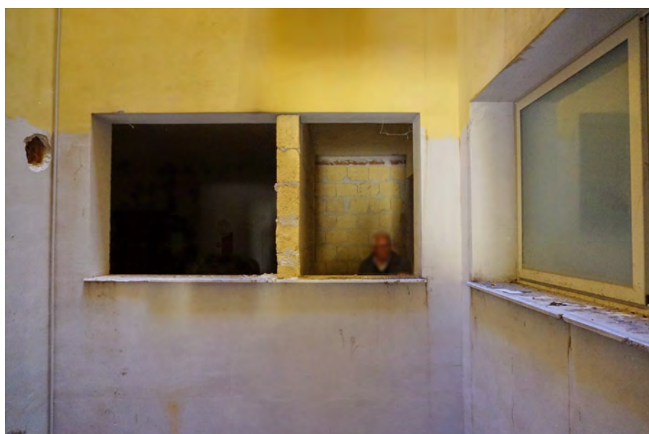
foto 12 - pozzo luce