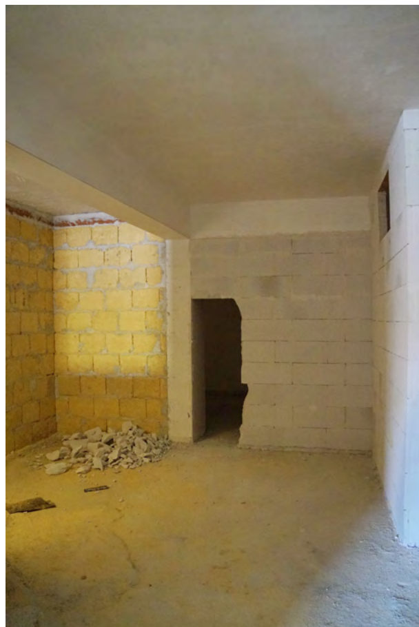
foto 17 - ambienti interni