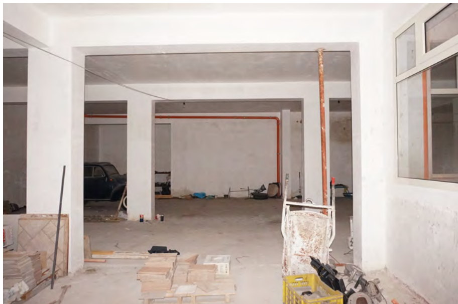
foto 31 - vista ambiente interno