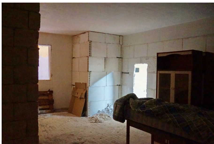
foto 15 - ambienti interni