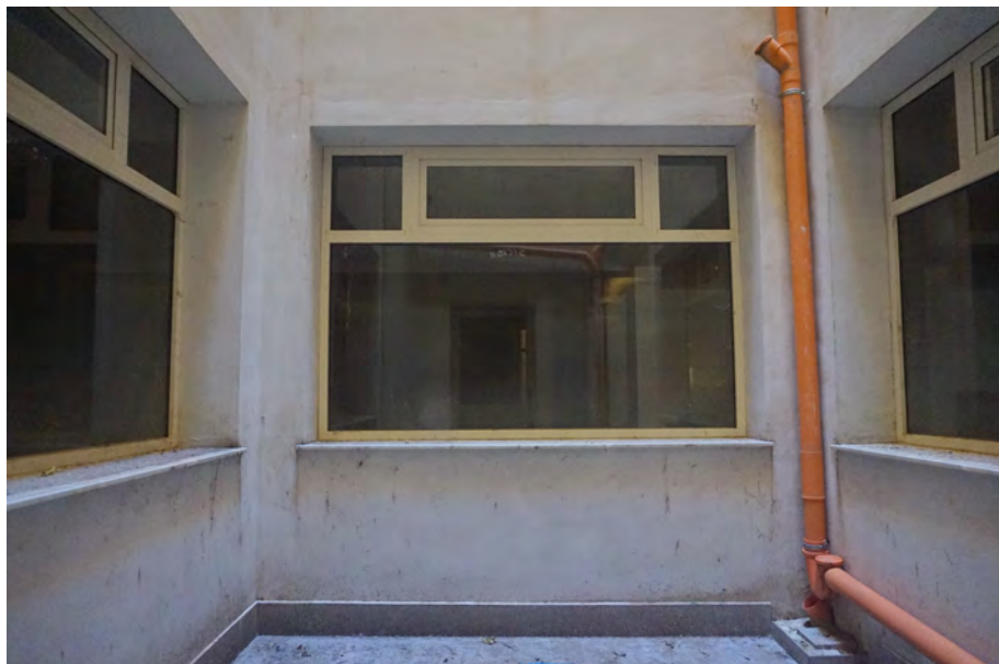
foto 28 - pozzo luce condominiale