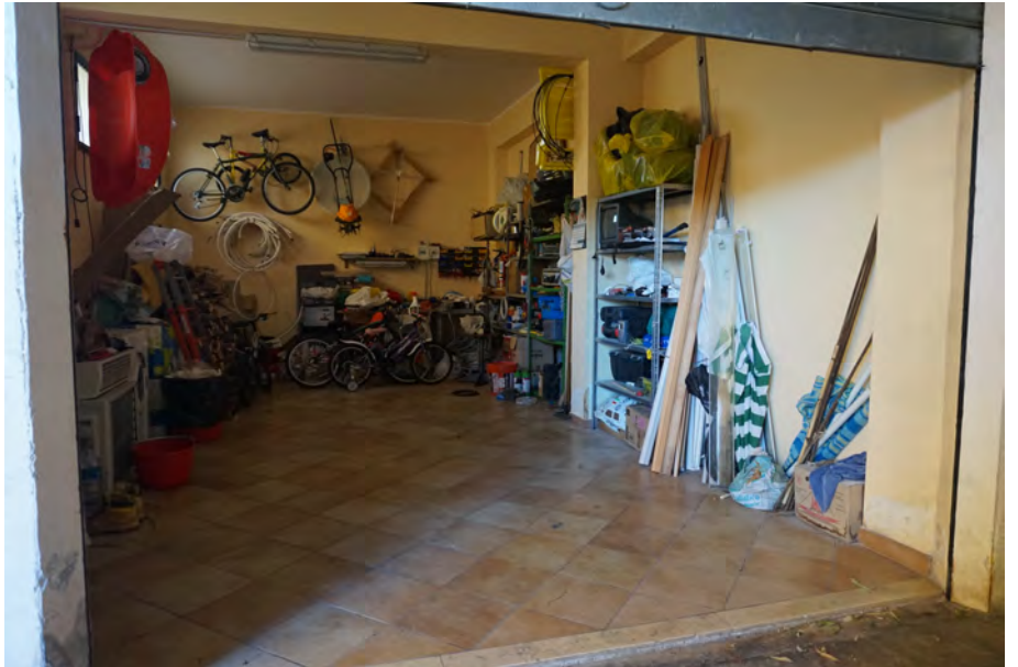
foto 22 - vista della porzione di magazzino resa indipendente