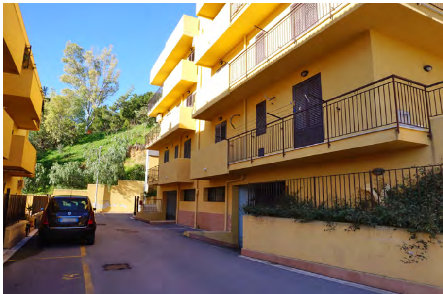
foto 19 - vista esterna del magazzino al piano S2