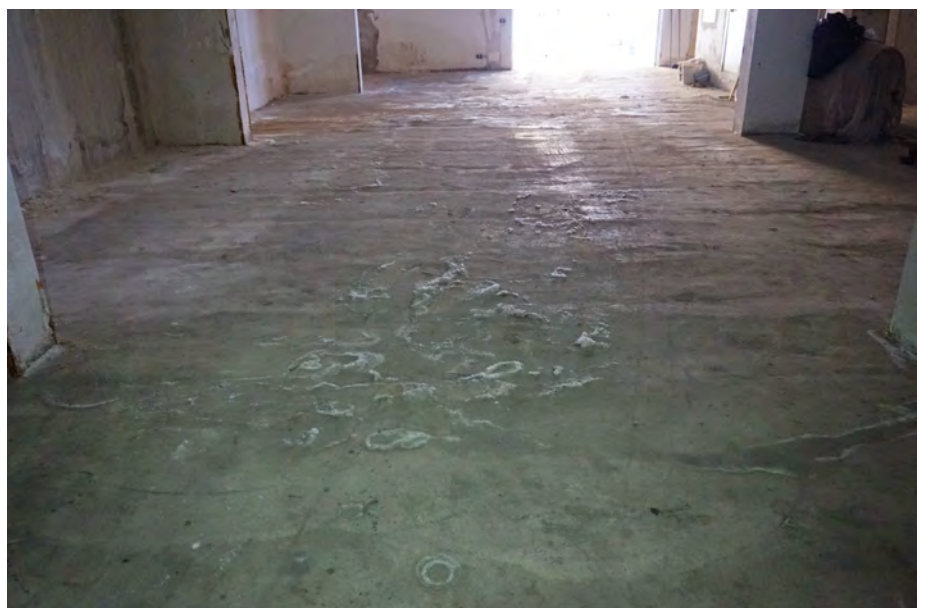
foto 36 - vista della pavimentazione dopo l'infiltrazione d'acqua