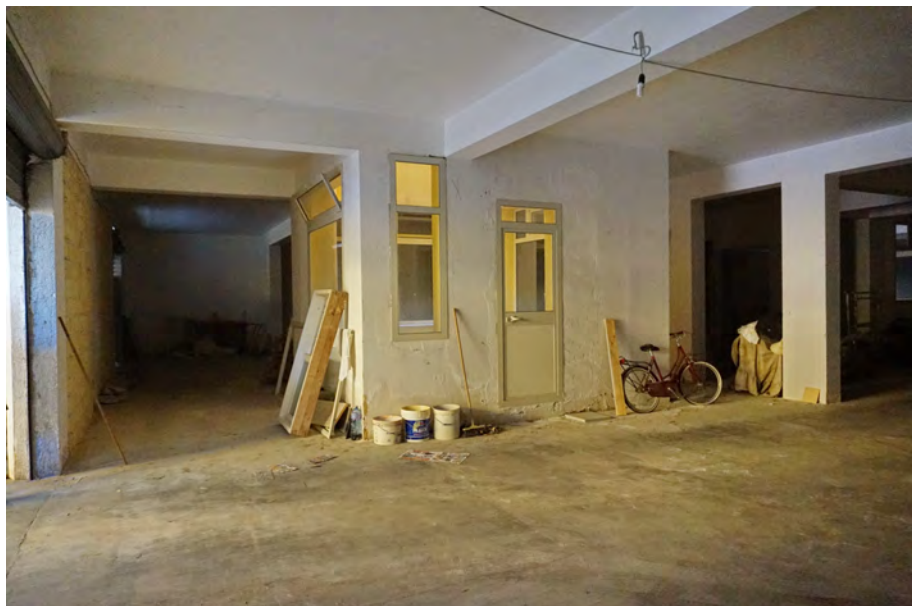
foto 25 - ambiente interno