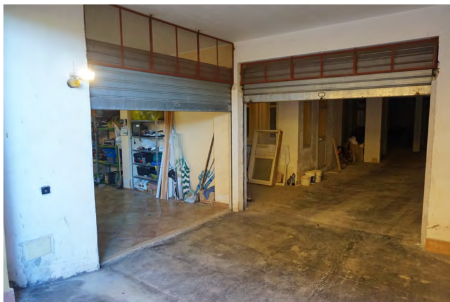
foto 21 - Ingressi Est al magazzino del piano S2