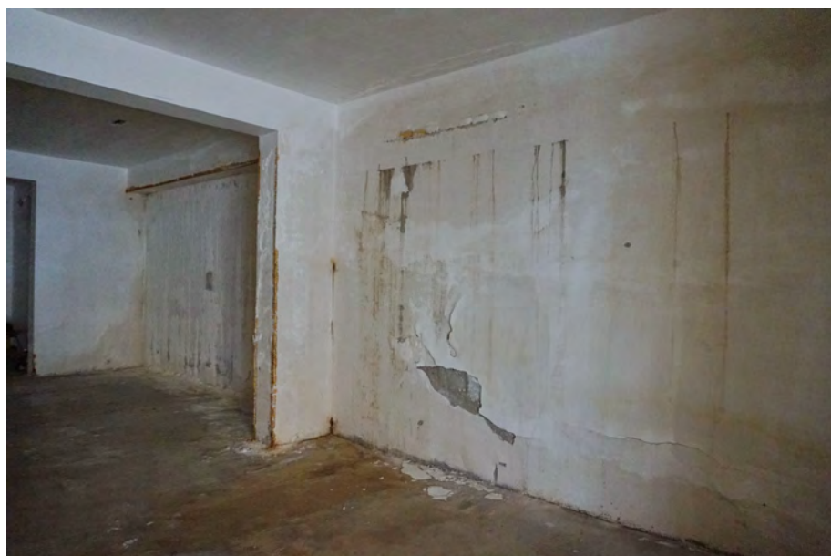
foto 33 - vista muro lato est a confine con il terrapieno