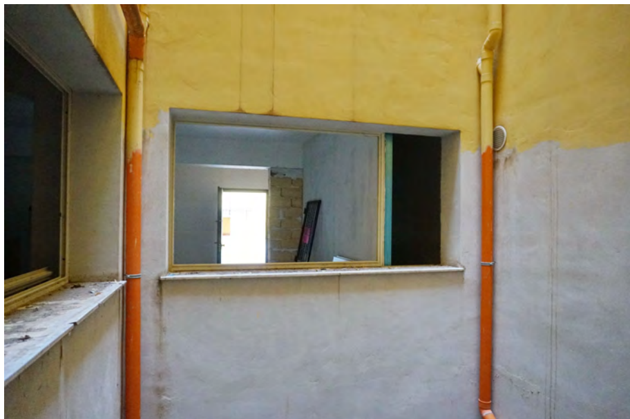
foto 13 - pozzo luce