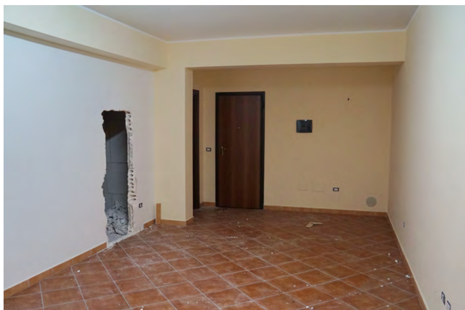
foto 14 - ambiente con accesso da androne condominiale