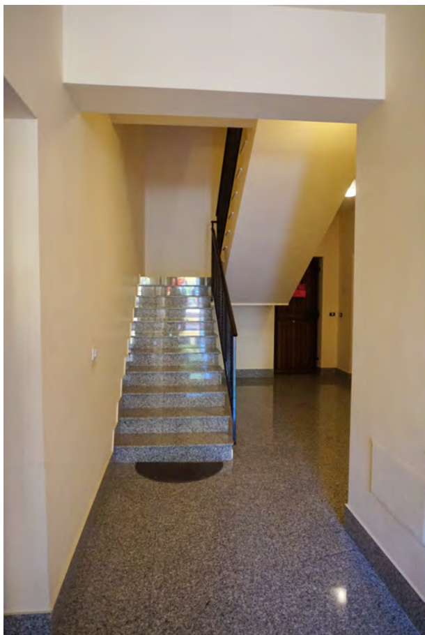
foto 7 - androne condominiale