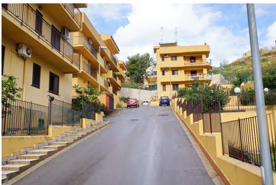
foto 3 - strada interna di accesso ai beni