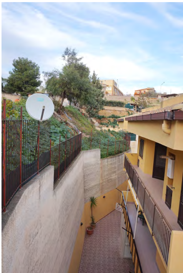
foto 40 - vista dell'area condominiale dall'alto