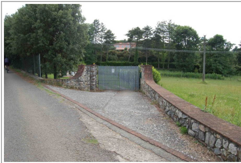
Cancello di ingresso da Via della Polla