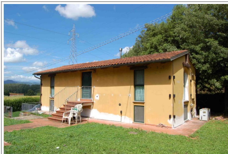
Lato sud ovest