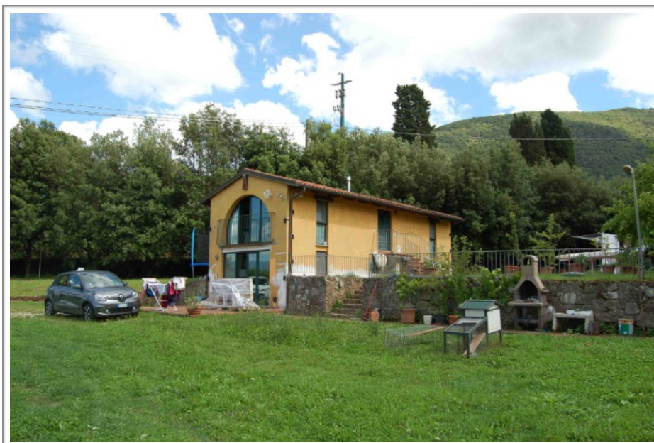
Lato nord ovest e resede