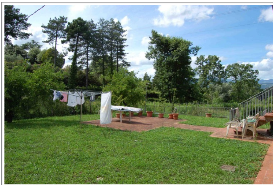
Resede lato ovest