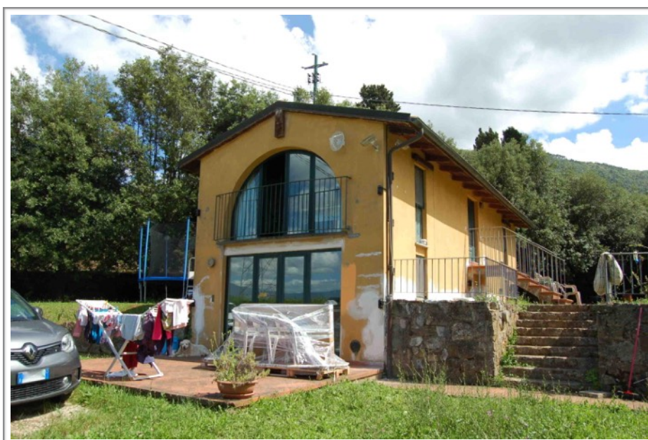
Lato nord ovest

Immobile ad uso abitazione posto in Comune di Lucca Frazione Montuolo, Via della Polla n. 700