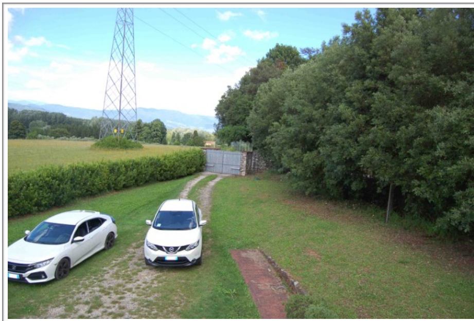
Resede lato est