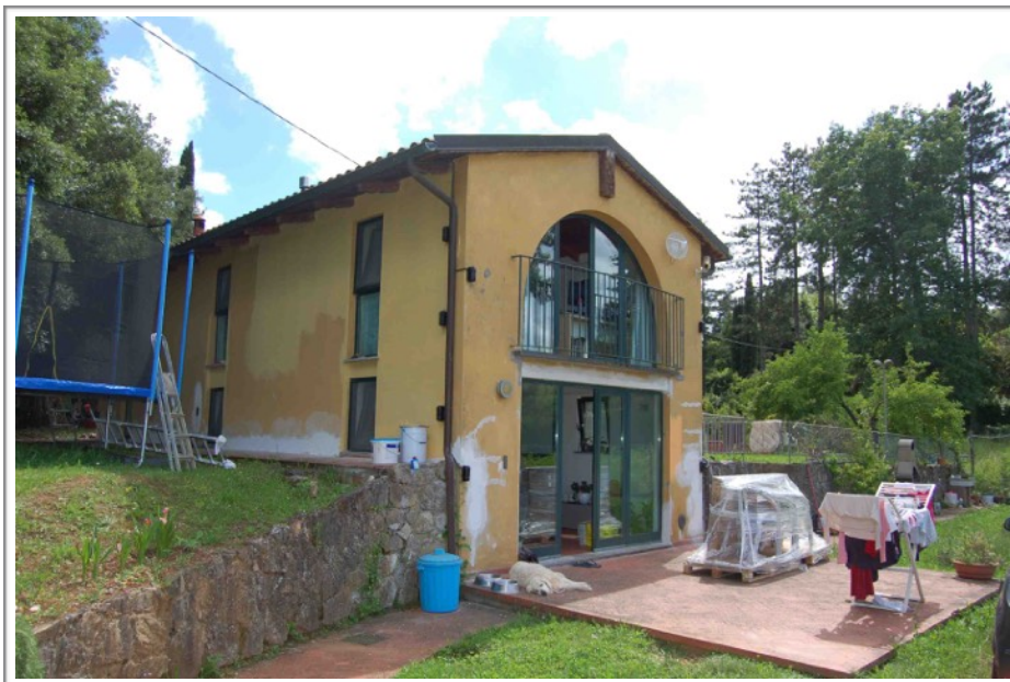
Lto nord est