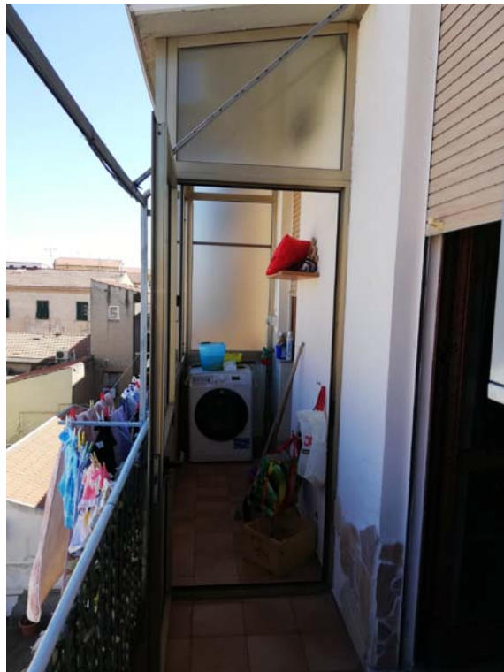
Veduta dal balcone della porzione di terrazza trasformata in veranda