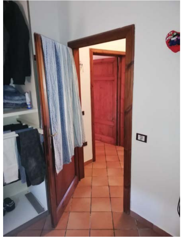
Veduta del bagno dal disimpegno e della camera con sullo sfondo il disimpegno