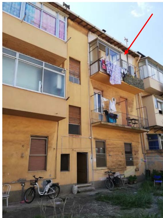
Veduta dalla chiostra sul retro della porzione di fabbricato con l'abitazione in oggetto