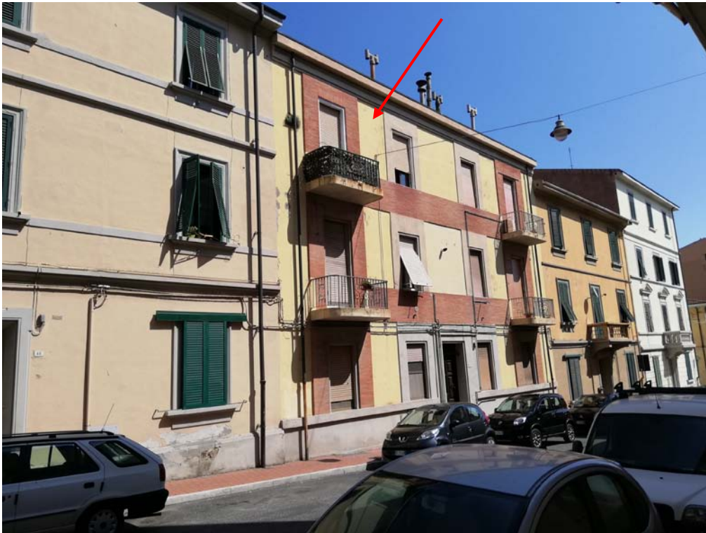
veduta dalla via San Francesco D'Assisi della porzione di fabbricato con l'abitazione in oggetto