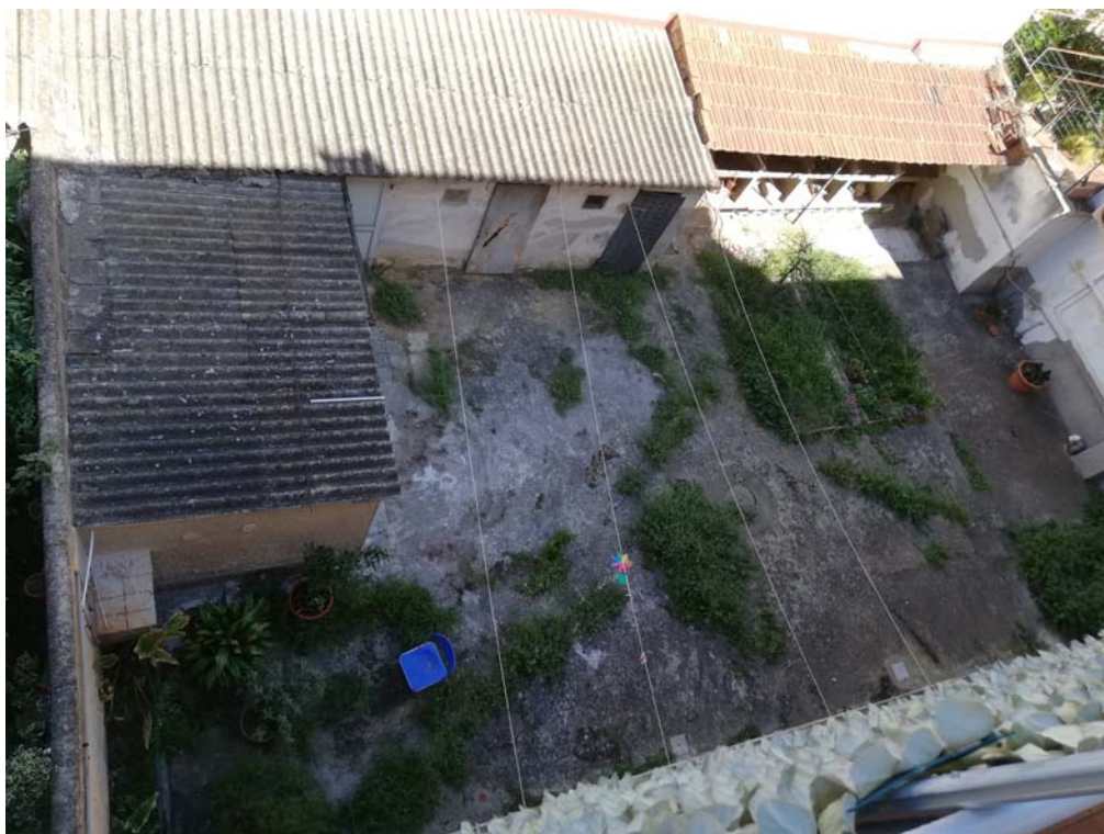
Veduta dal balcone sul retro della chiostra a comune