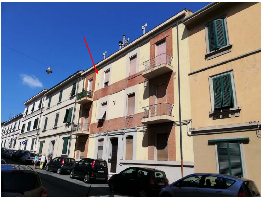
veduta dalla via San Francesco D' Assisi della porzione di fabbricato con l'abitazione in oggetto