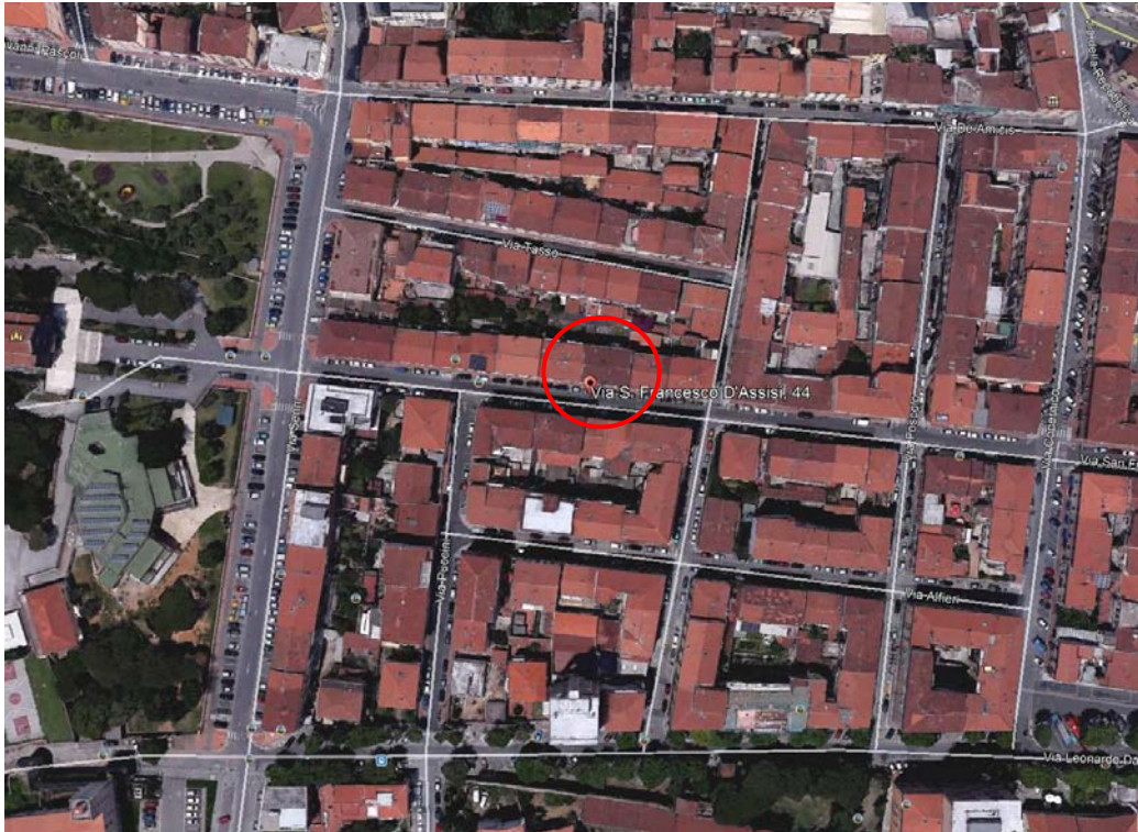
veduta da Google Earth con indicato l'ubicazione dell'abitazione