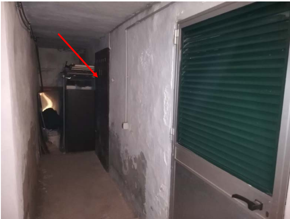
Veduta delle parti a comune interne al fabbricato, con evidenziato l'ingresso al piano terra, l'arrivo della scala al secondo piano e l'accesso alla cantinetta seminterrata