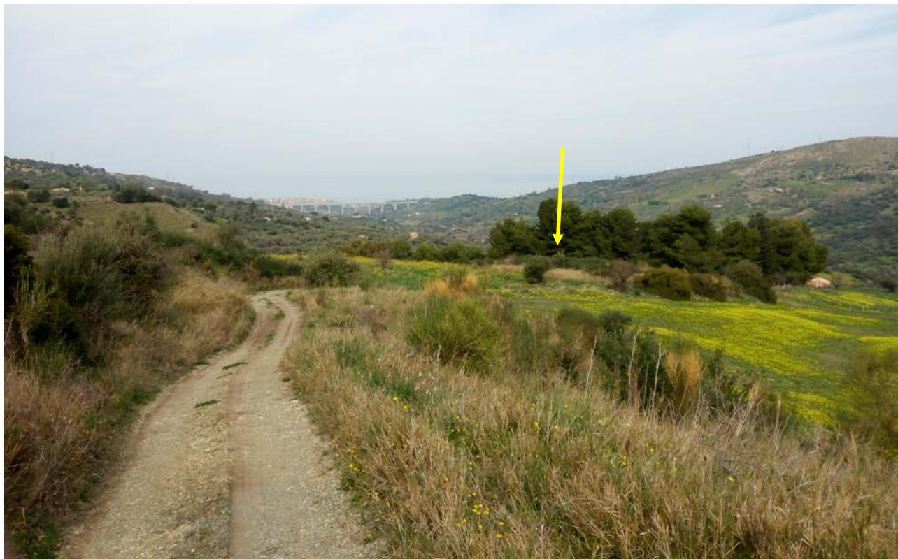
Foto n. 3 Vista dalla trazzera