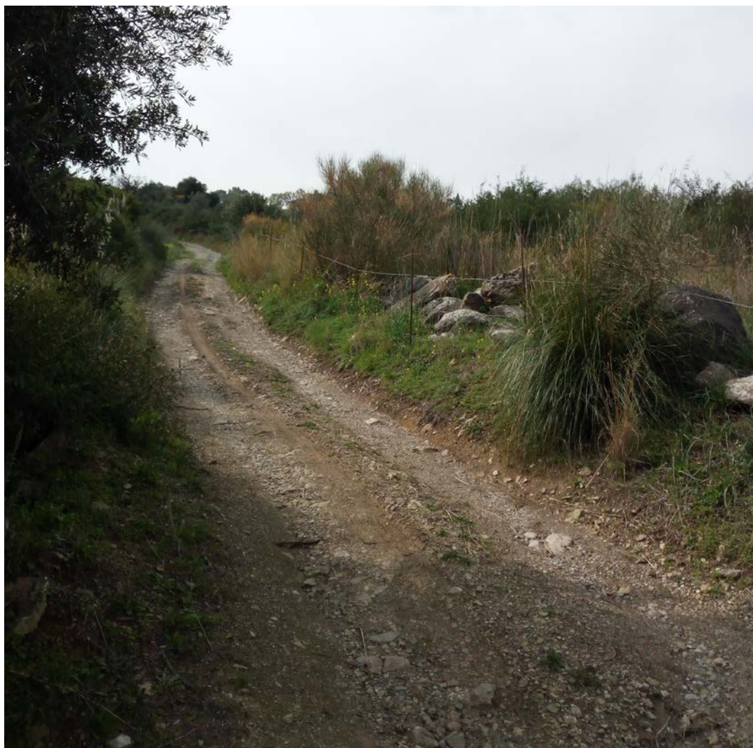
Foto n. 6 Trazzera di collegamento