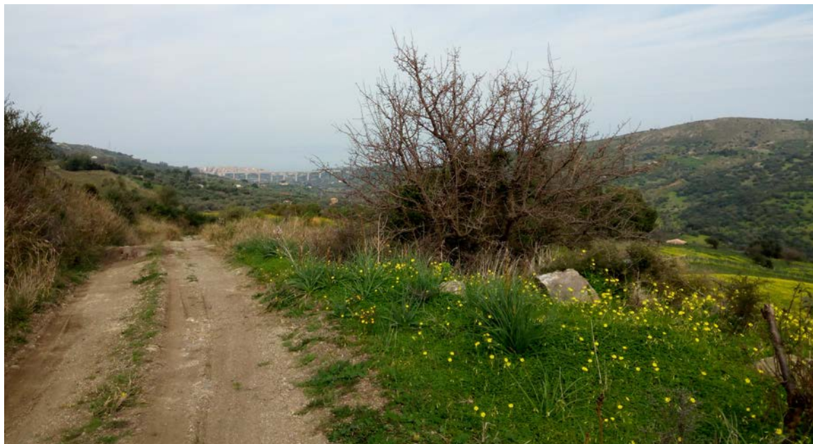
Foto n. 5 Trazzera di collegamento