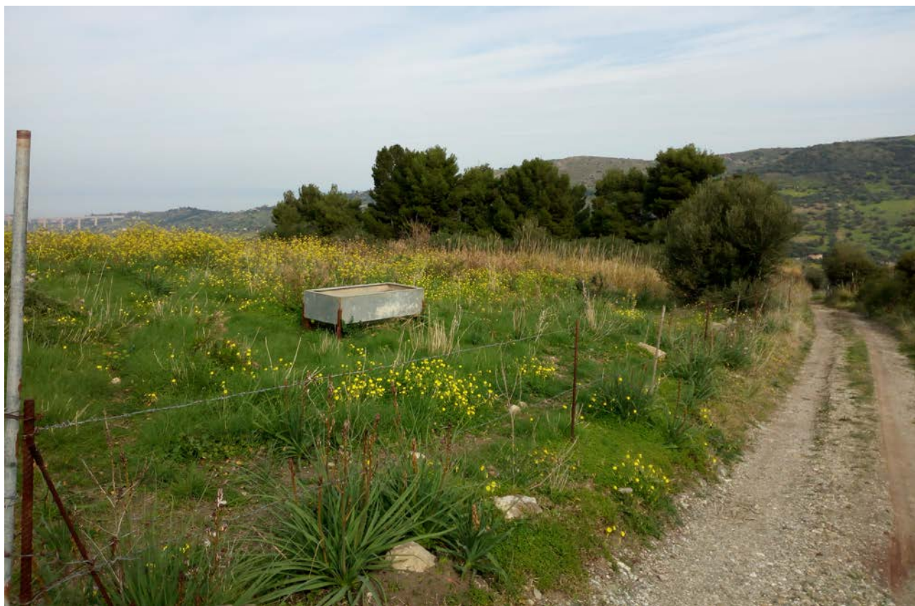
Foto n. 4 Vista dalla trazzera