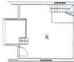
SOTTOTETTO Hm= 2.70