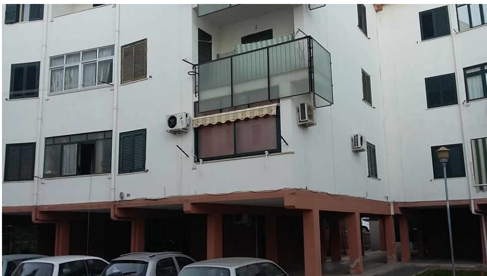
1. Vista dell'edificio dall'esterno