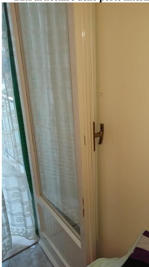
12. Particolare infissi esterni