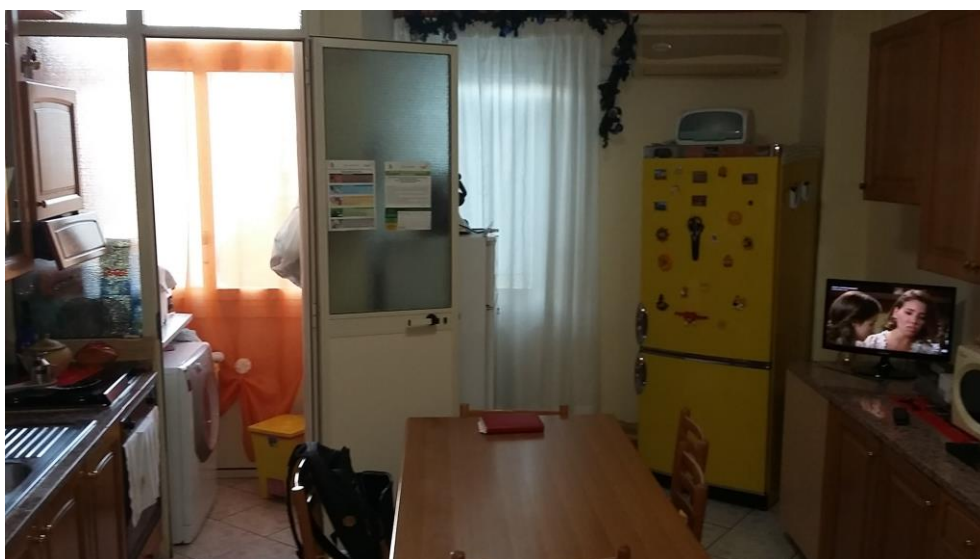
4. Cucina - soggiorno