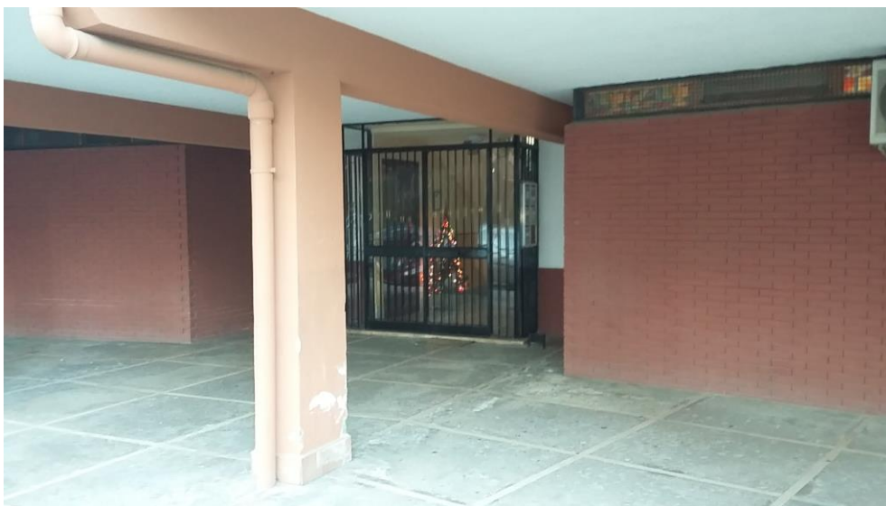
2. Vista dell'ingresso all'edificio