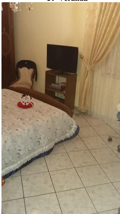
6. Camera matrimoniale