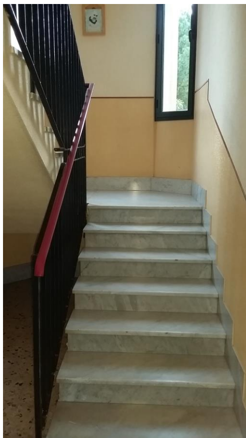
3. Vista della scala condominiale