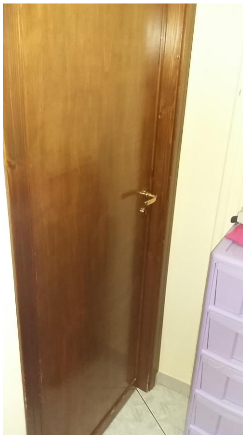
11. Particolare delle porte interne