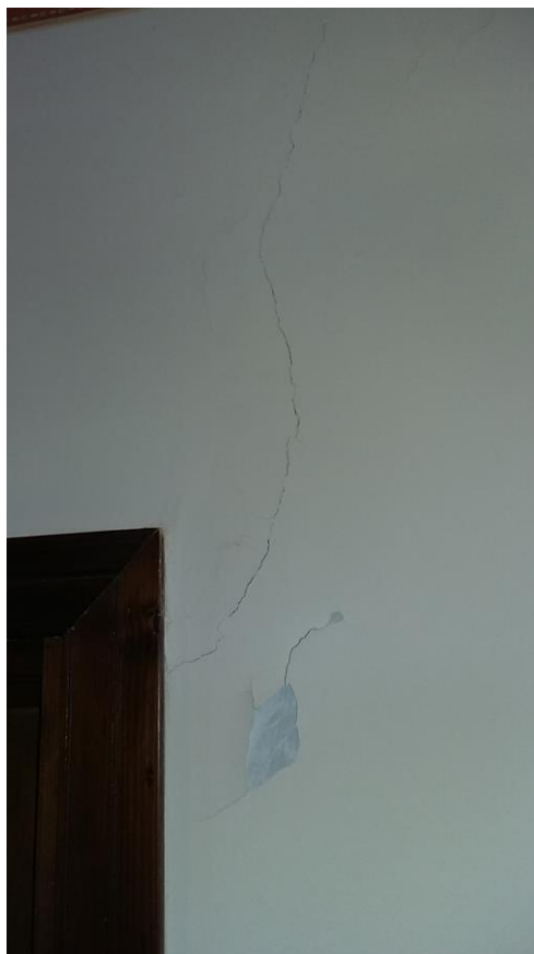
13. Particolare lesione muro