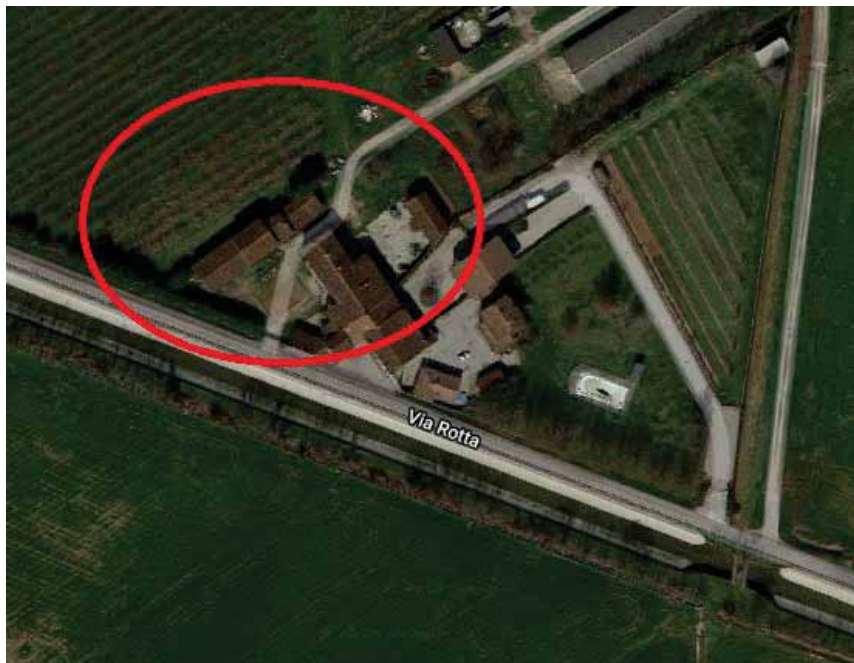
Estratto 2; Vista da satellite del compendio immobiliare