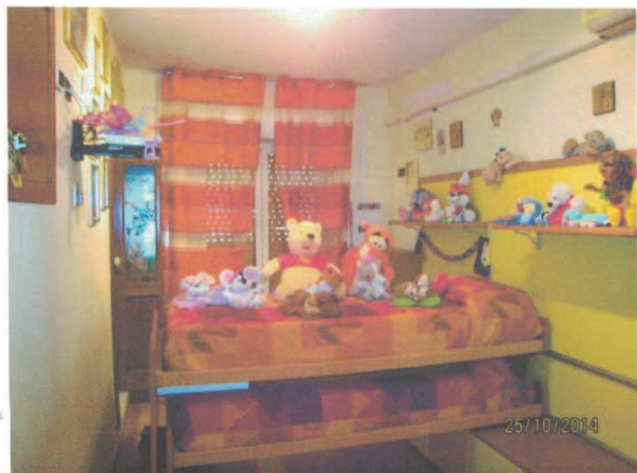
Foto n. 9. Altra immagine della stessa cameretta.