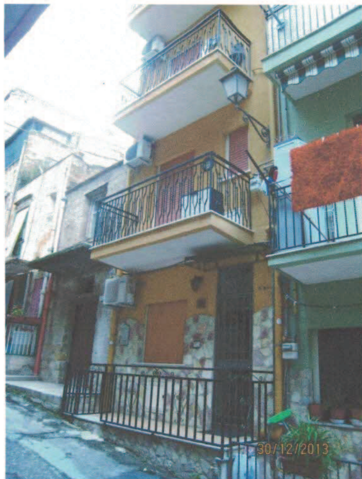
Foto n. 4. Dettaglio dell'ingresso all'edificio, nonché del P.T. e del 1° p.