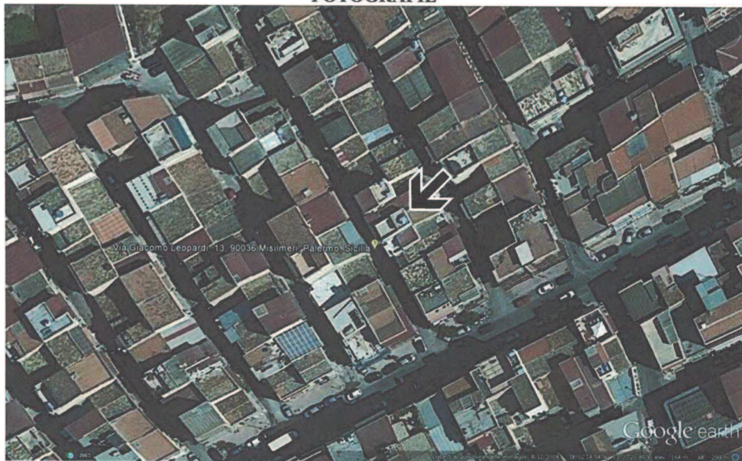
Foto n. 1. Foto aerea con indicata l'ubicazione del fabbricato pignorato, sito a Misilmeri nella Via Leopardi n. 13.