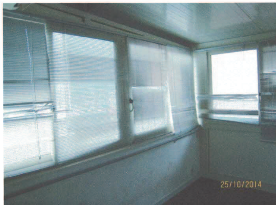
Foto n. 21. .... Materiale sintetico e vetrate a giorno.