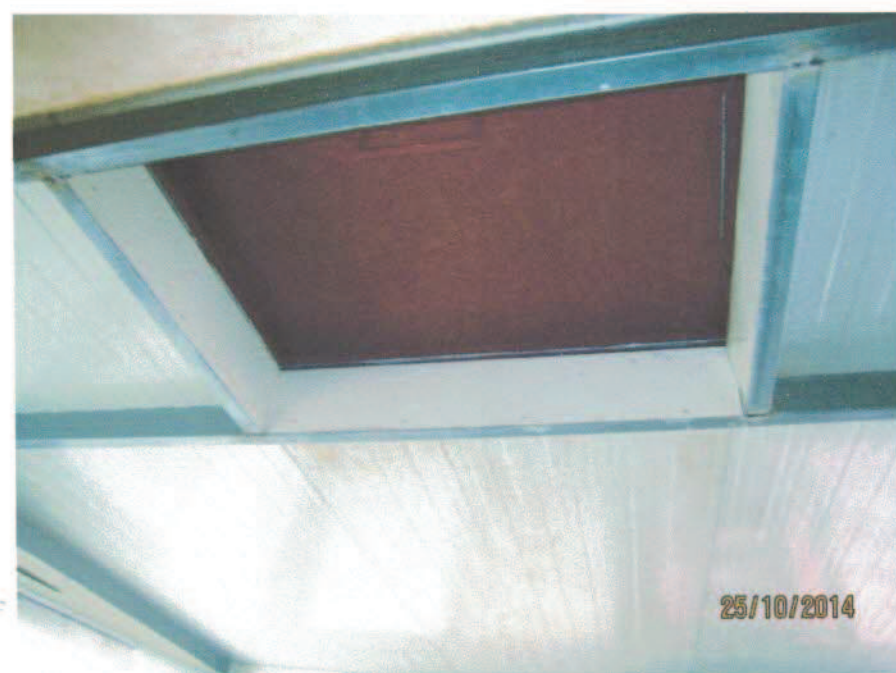
Foto n. 22. Una botola consente di giungere sul tetto.