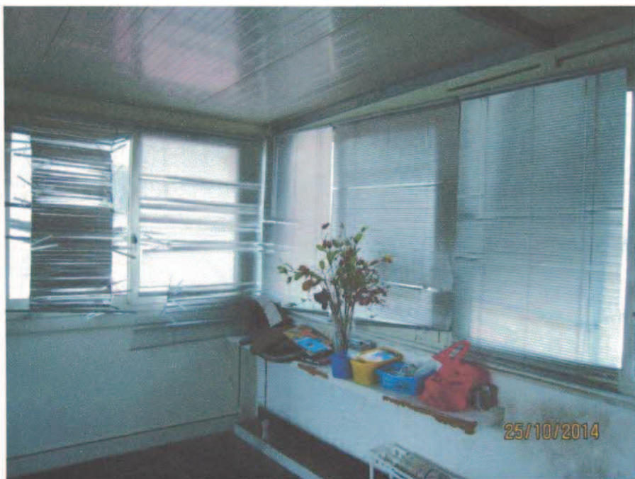
Foto n. 20. La struttura è metallica con pannelli in ....