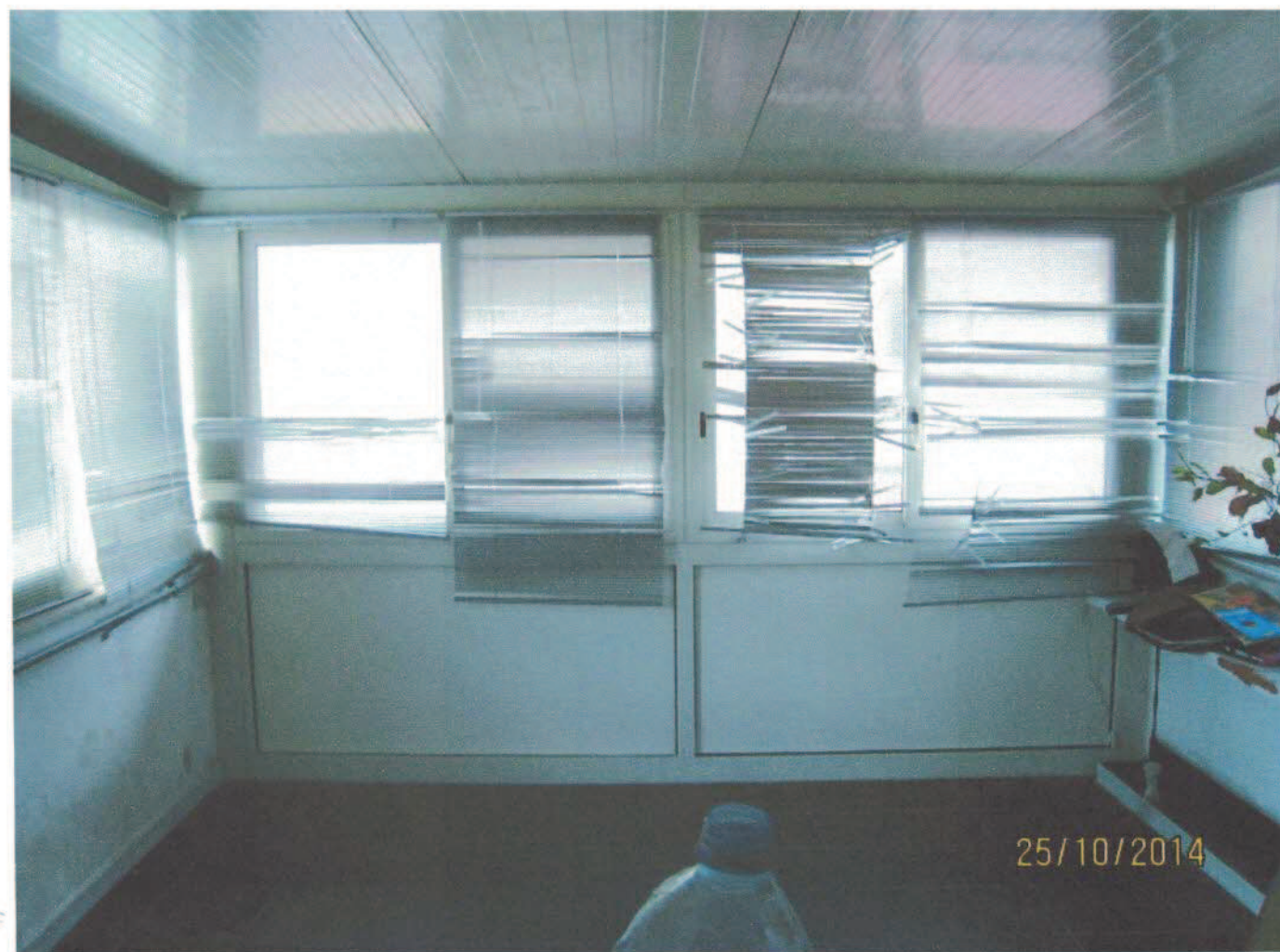
Foto n. 19..... su questo ambiente, un tempo lastrico solare ed oggi chiuso con strutture metalliche, pannelli sintetici e vetri.