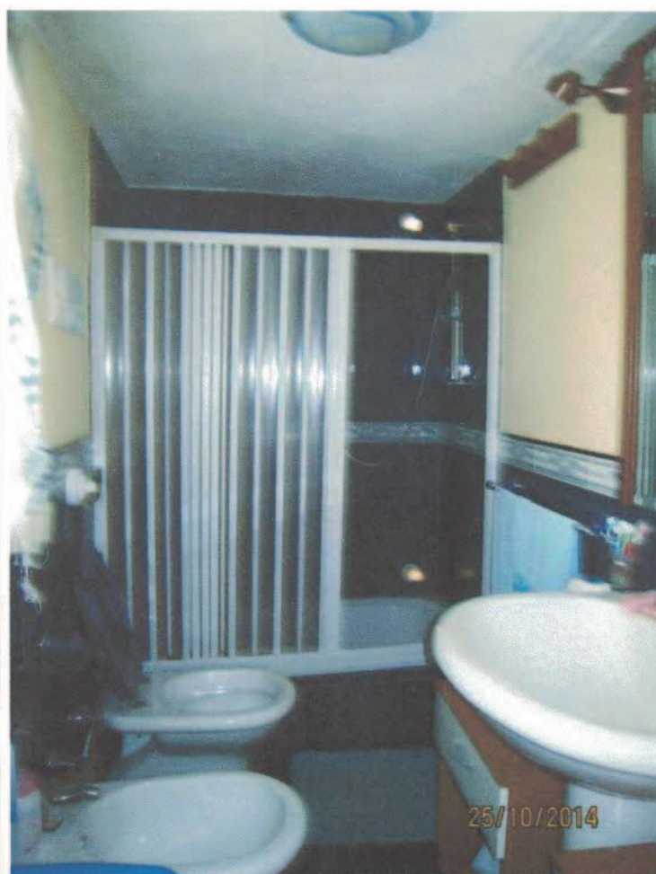
Foto n. 18. .... Un w.c doccia con finestra che si apre .....