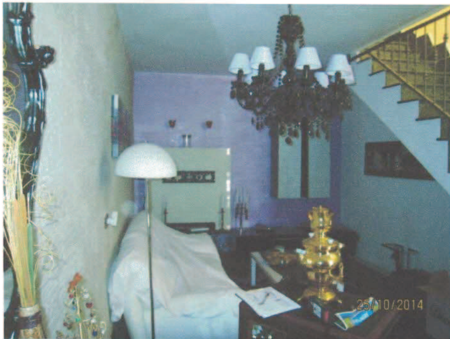
Foto n. 7. Altra immagine del soggiorno al P.T..