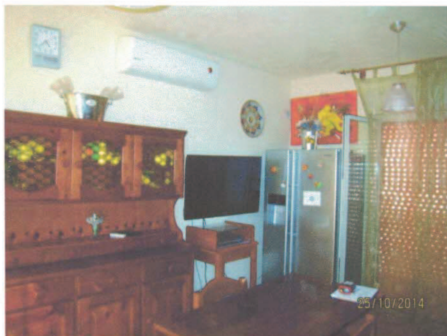
Foto n. 16. Altra immagine della stessa stanza.