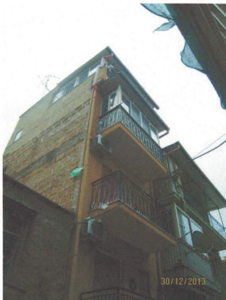
Foto n. 5. Dettaglio dei piani superiori.