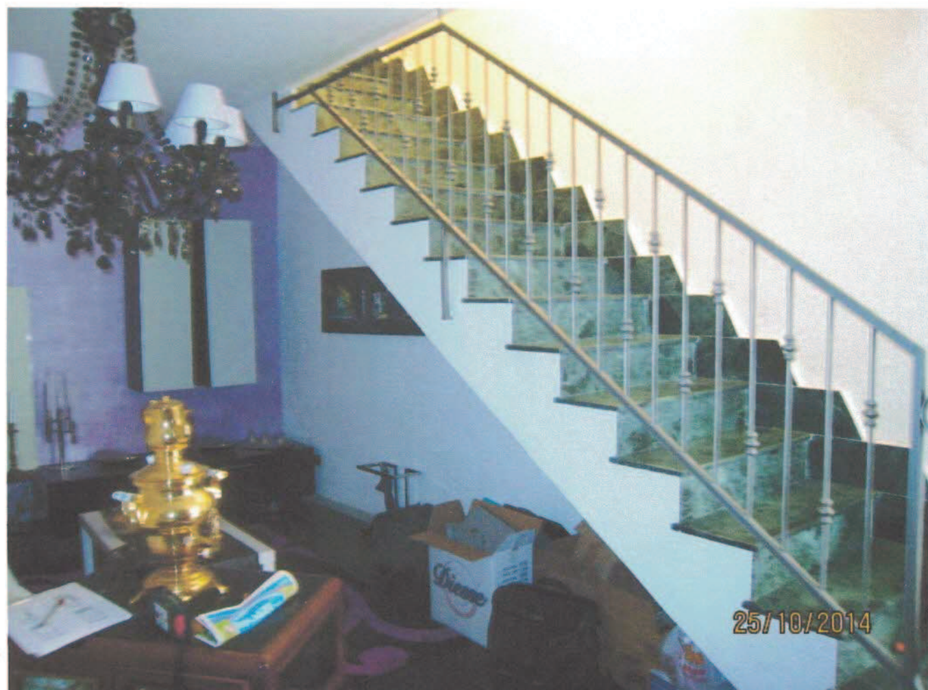
Foto n. 6. Il soggiorno di piano terra con la scala aperta che conduce al 1° piano.