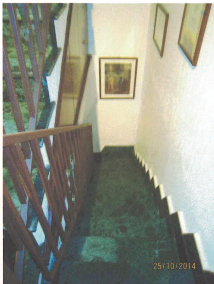
Foto n. 13. La scala è ben rifinita e con marmo pregiato.