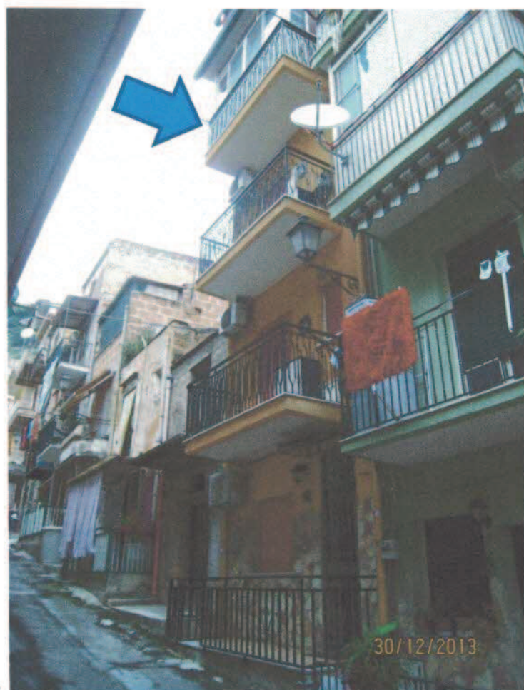
Foto n. 2. Il prospetto su Via Leopardi.