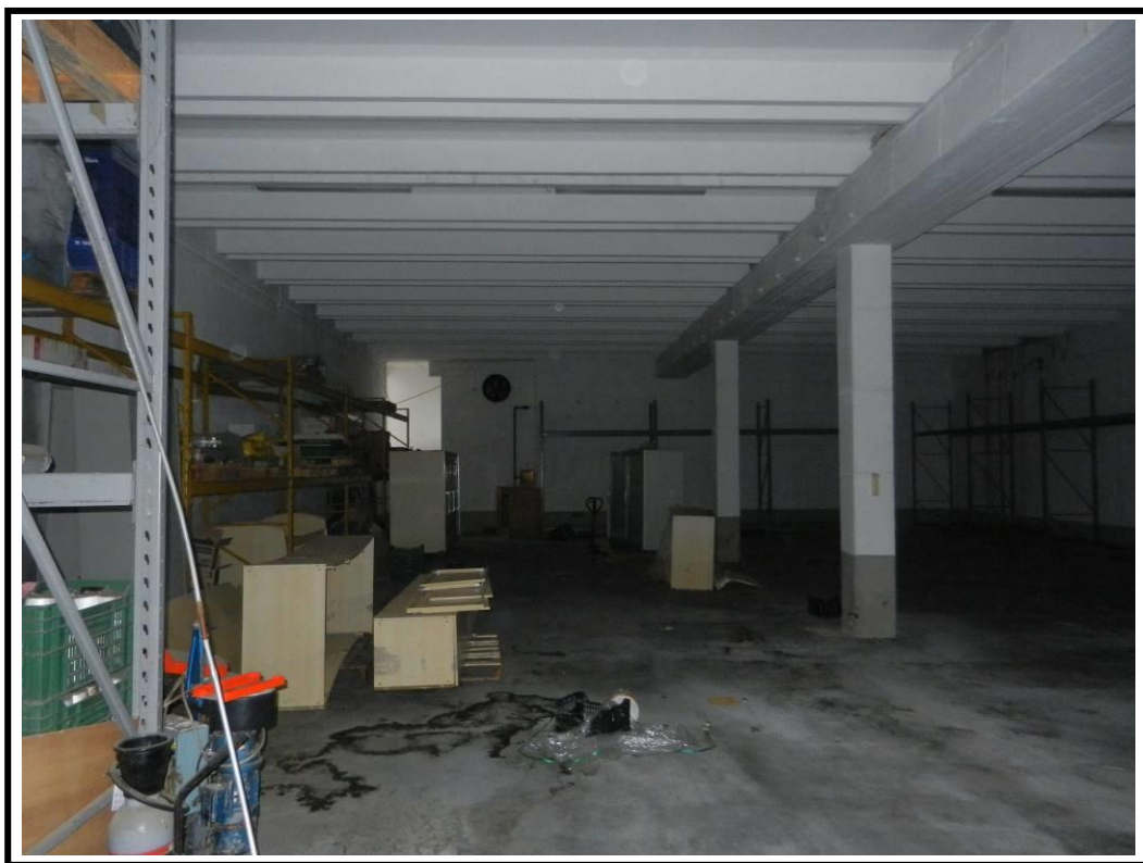
Foto 11 Magazzino interrato