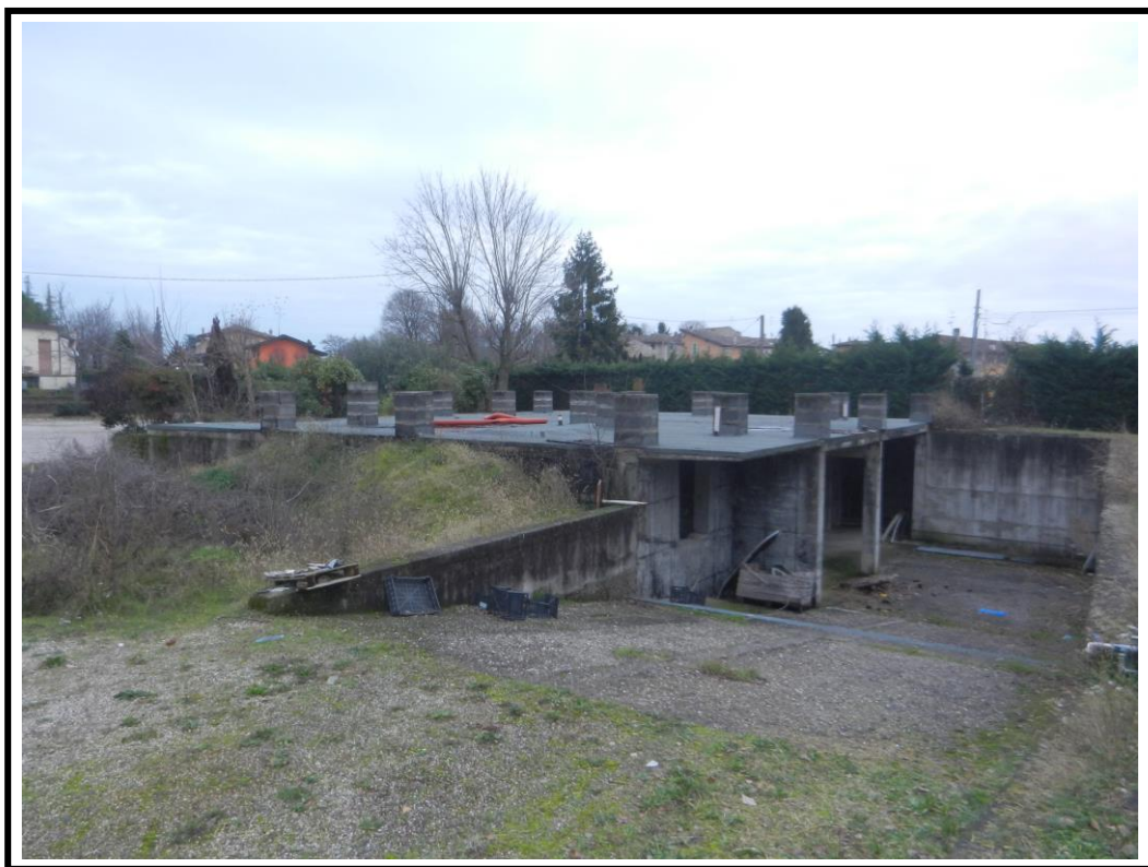
Foto 21 Fabbricato in corso di costruzione