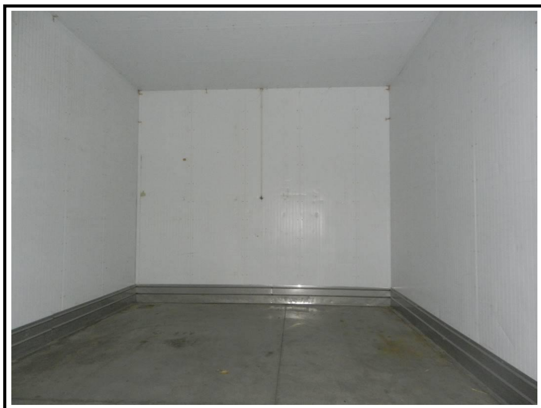
Foto 8 Cella frigorifera