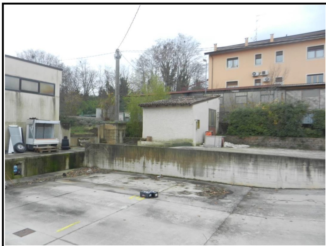
Foto 18 Ripostiglio