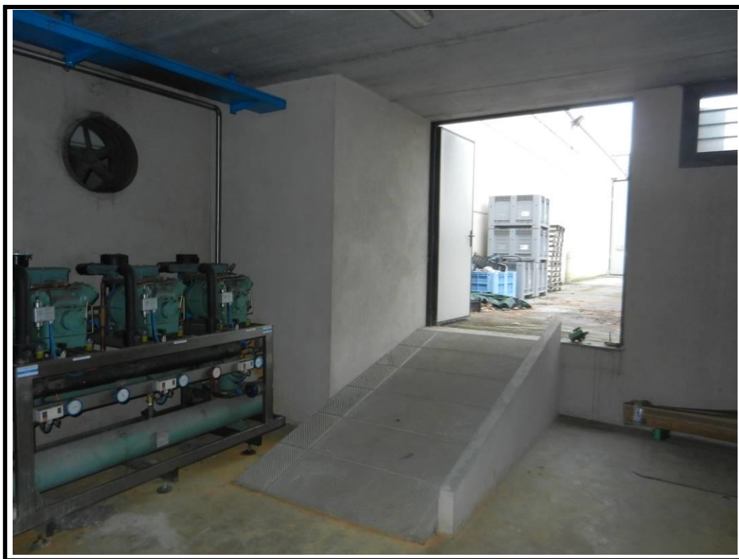
Foto 13 Locale tecnico