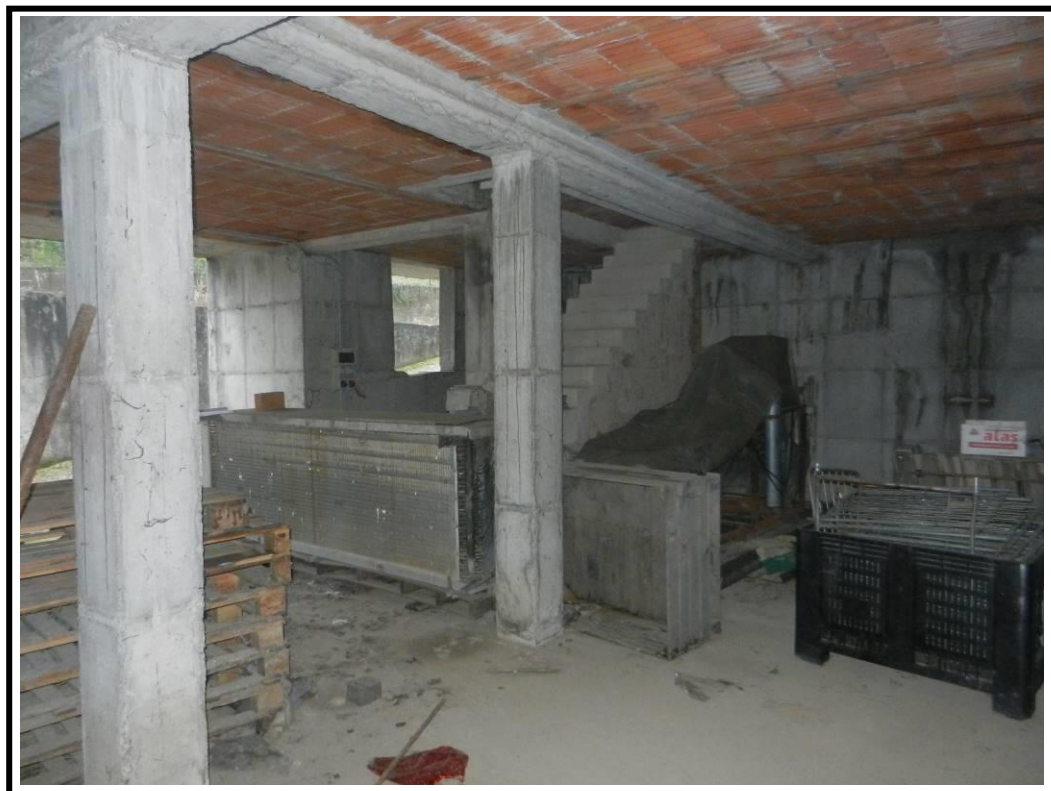
Foto 24 Fabbricato in corso di costruzione