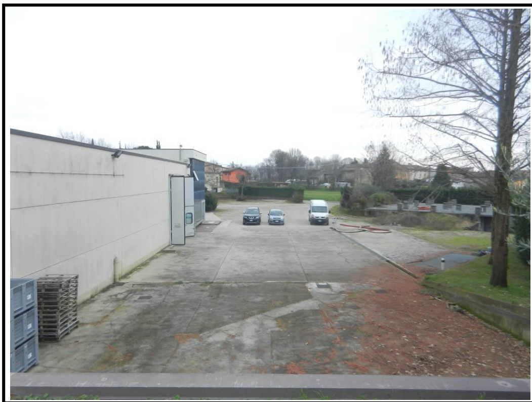
Foto 19 Area pertinenziale