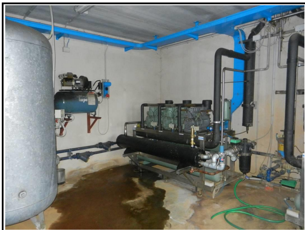
Foto 14 Locale tecnico