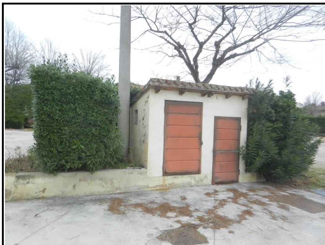
Foto 16 Ripostigli