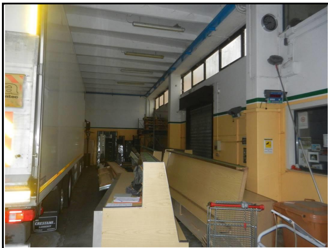
Foto 6 Magazzino