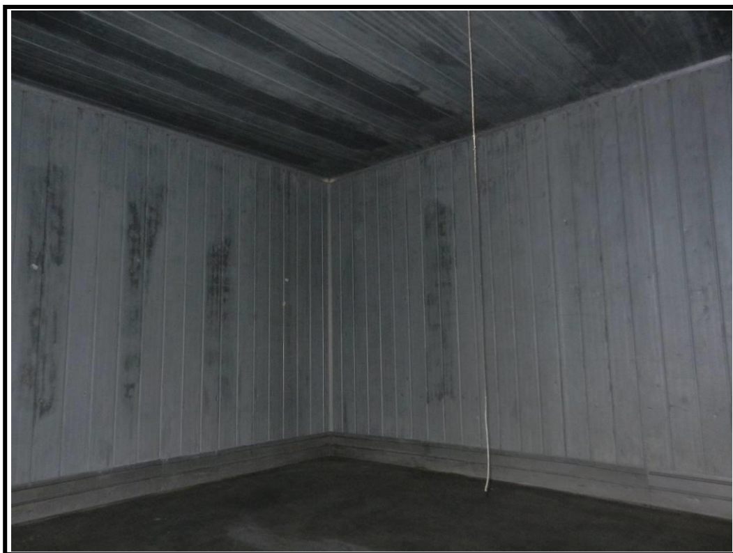
Foto 7 Cella frigorifera