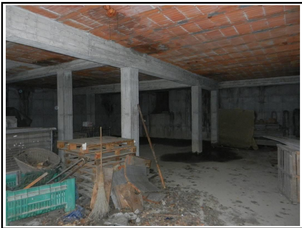
Foto 23 Fabbricato in corso di costruzione