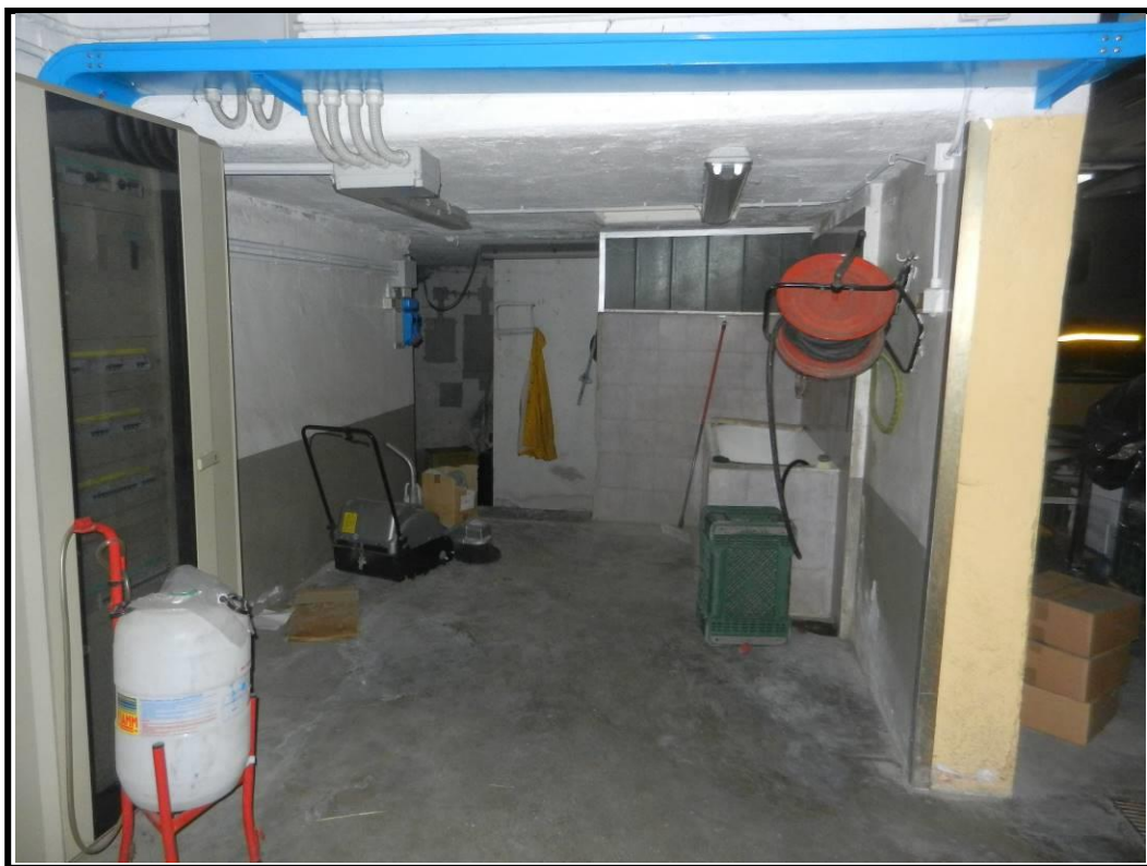
Foto 9 Blocco servizi