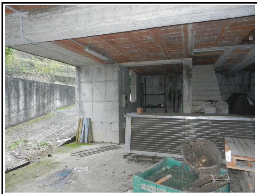
Foto 22 Fabbricato in corso di costruzione