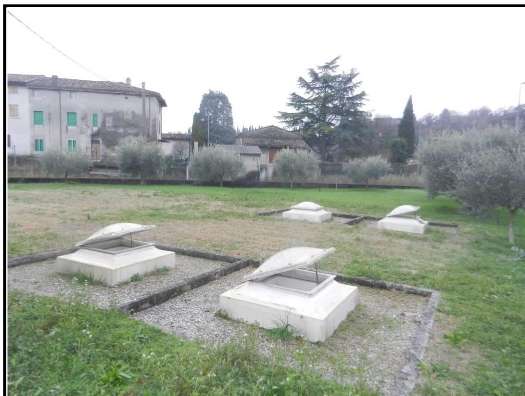
Foto 20 Area pertinenziale retro