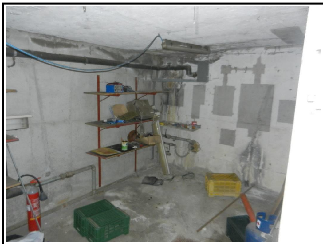
Foto 10 Locale tecnico