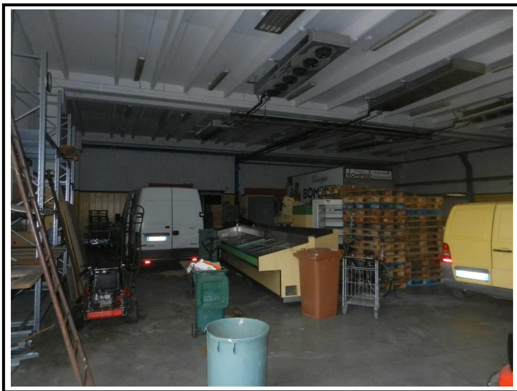
Foto 5 Magazzino