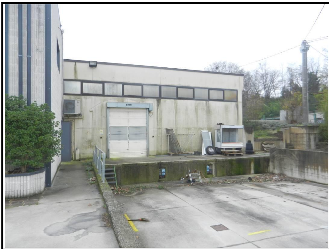
Foto 17 Rampa di carico e scarico