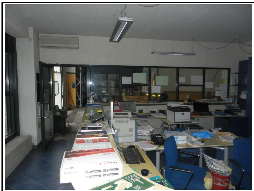
Foto 2 Ufficio