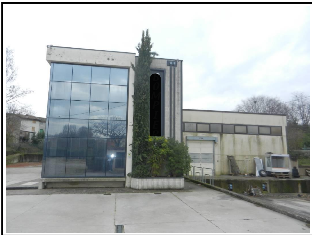
Foto 1 Prospetto dall'area pertinenziale