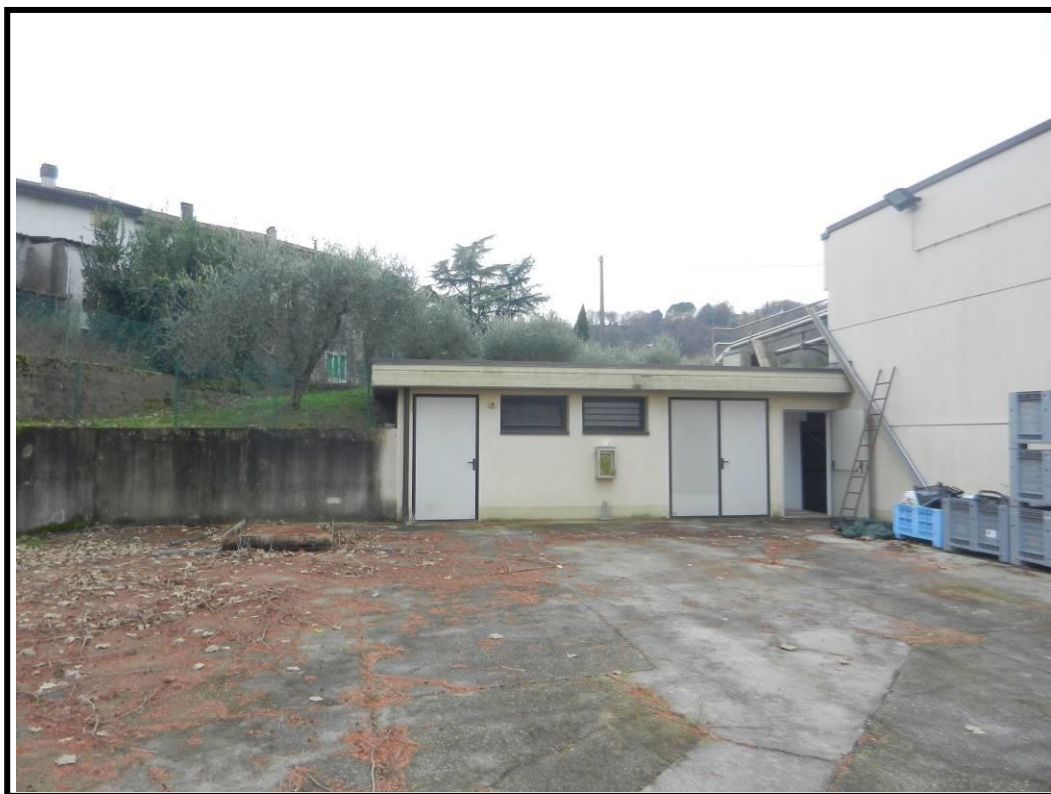
Foto 15 Locali tecnici