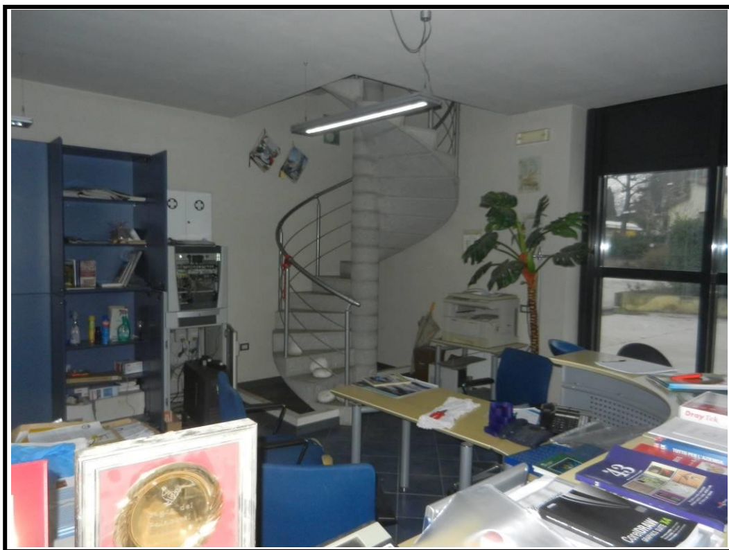
Foto 3 Ufficio PT