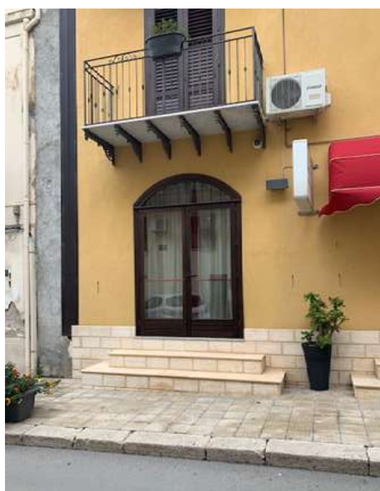
Foto 2. Accesso al Lotto 1 da via Roma.