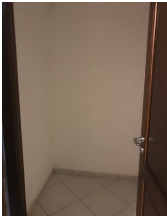
Foto 8. Antibagno.