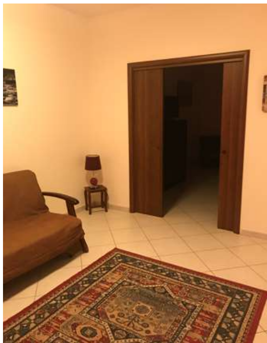
Foto 4. Vano d'ingresso.