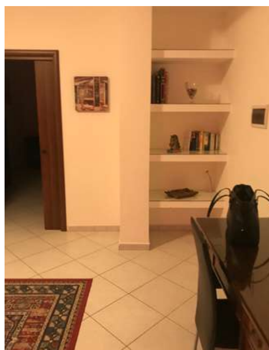
Foto 3. Vano d'ingresso.