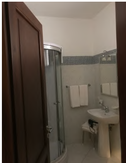
Foto 9. Servizio igienico.