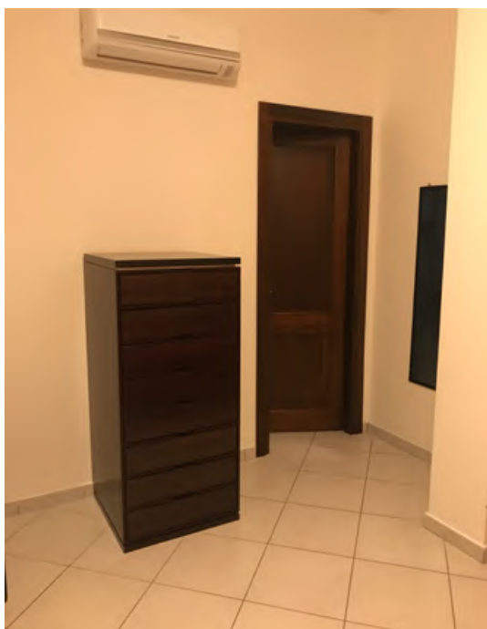
Foto 6. Vano adibito a camera da letto.