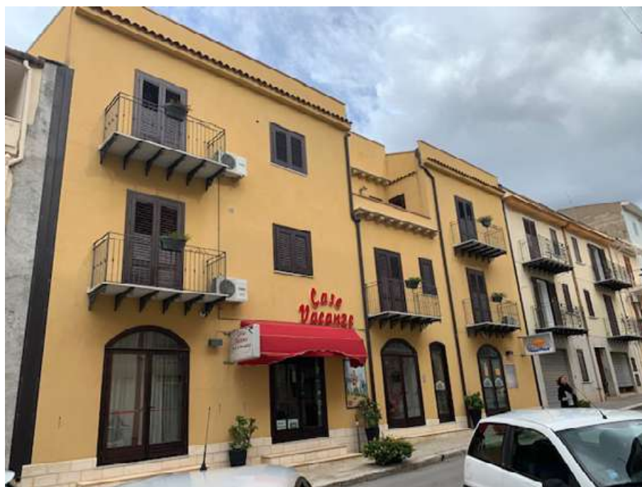
Foto 1. Prospetto dell'intero fabbricato su via Roma.