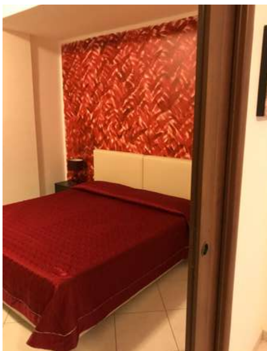
Foto 7. Vano adibito a camera da letto.