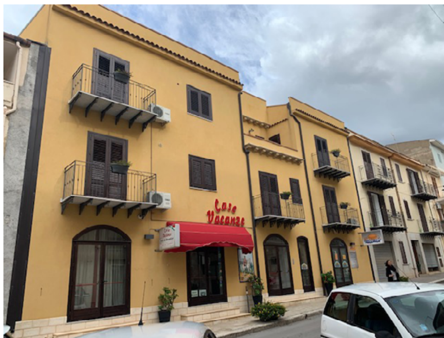
Foto 1. Prospetto dell'intero fabbricato su via Roma.