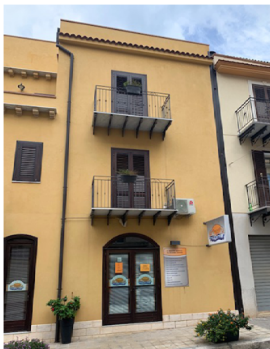
Foto 2. Accesso al Lotto 2 da via Roma.