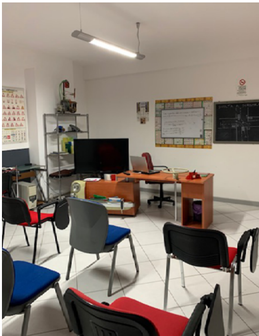
Foto 6. Vano adibito ad aula.