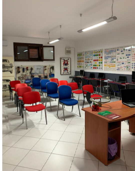
Foto 5. Vano adibito ad aula.