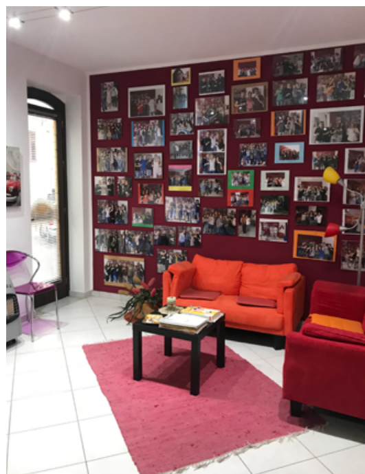
Foto 3. Vano d'ingresso adibito a sala d'attesa e ricevimento.