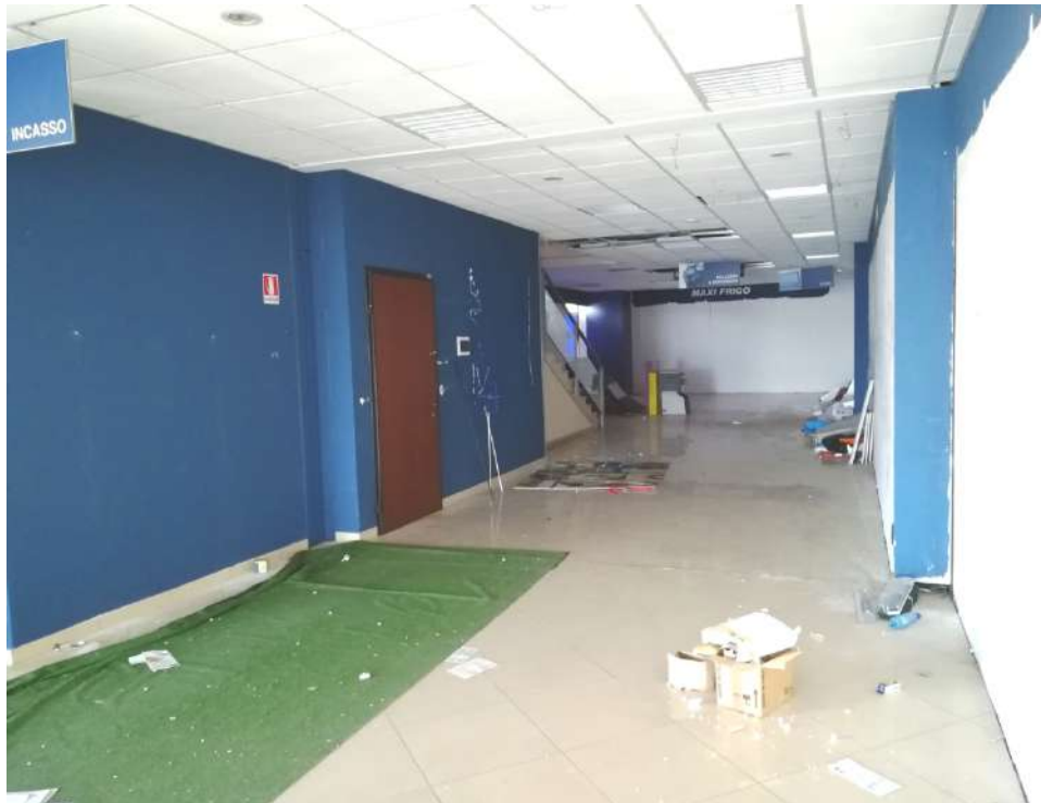
Foto 15- Interni del piano rialzato