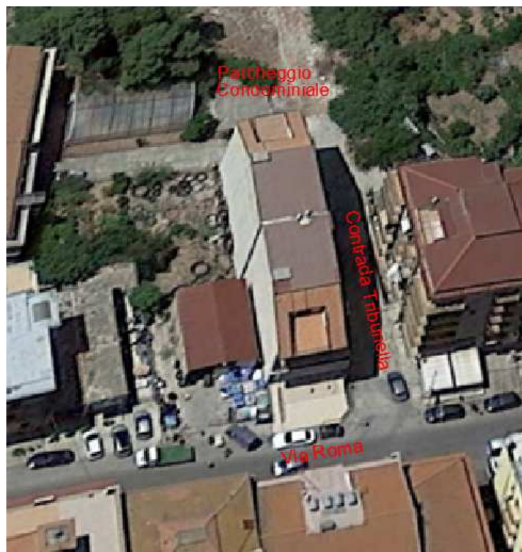
Foto 4 - Immagine del fabbricato