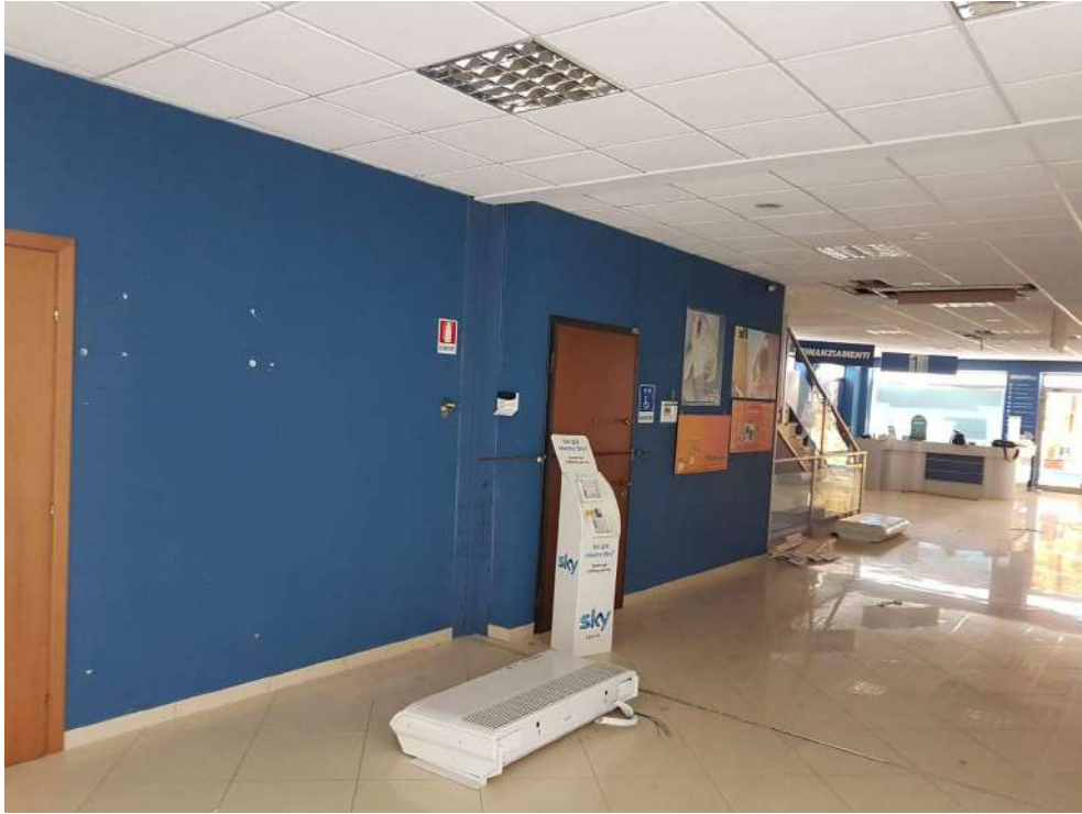
Foto 11- Interni del piano rialzato