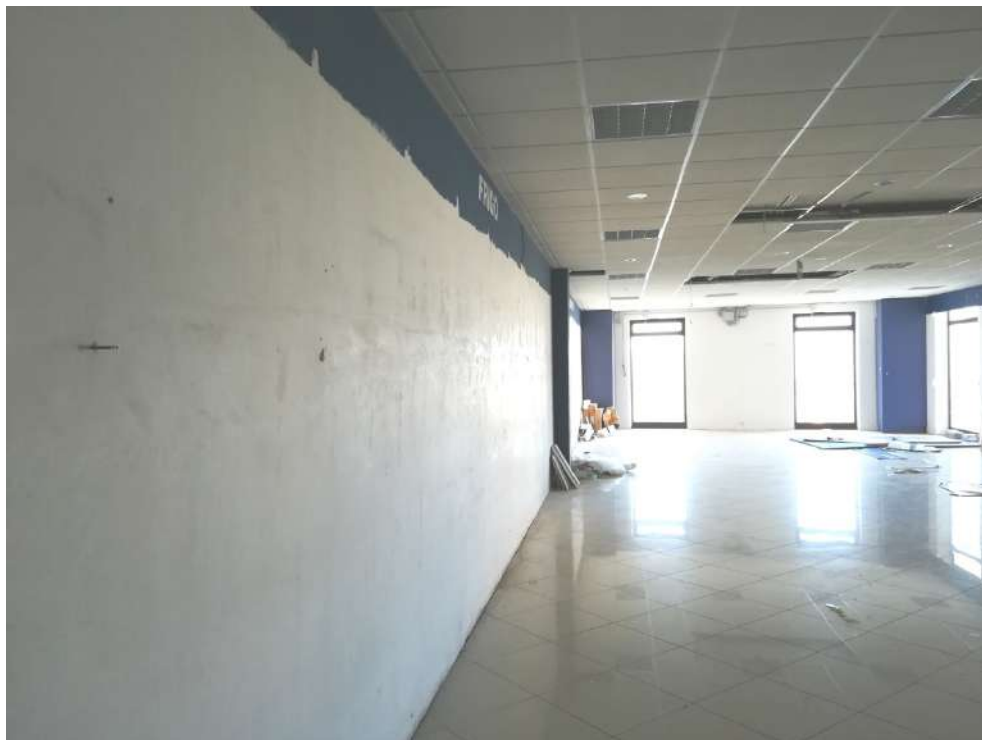
Foto 16- Interni del piano seminterrato