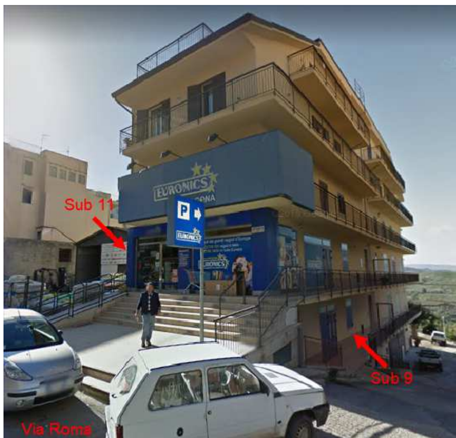
Foto 3 - Immagine del fabbricato- individuazione delle unità catastali