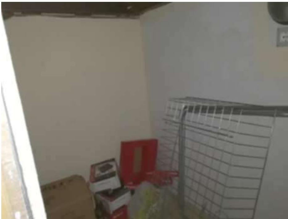
Foto 17- Interni del piano seminterrato