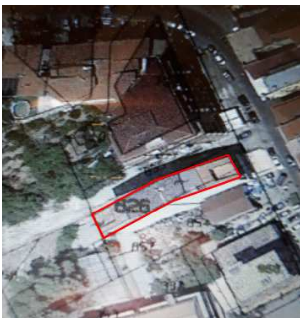
Foto 2 - Immagine acquisita da Google Earth Sovrapposizione dell'immagine con stralcio di mappa catastale