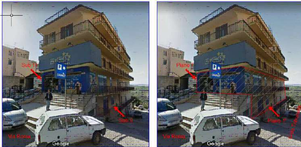
Foto 5 - Immagine del fabbricato- Individuazione delle unità immobiliari