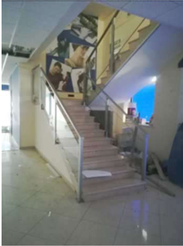
Foto 17- Interni del piano seminterrato