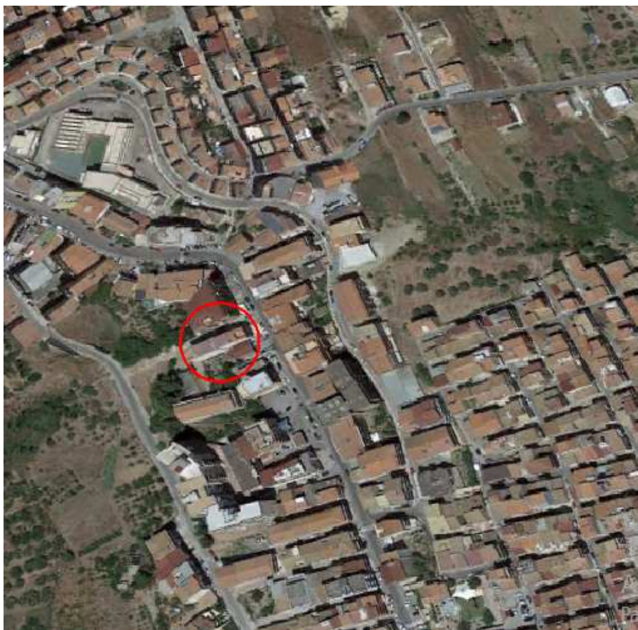
Foto 1 - Immagine acquisita da Google Earth Individuazione del fabbricato del quale fanno parte gli immobili oggetto di pignoramento