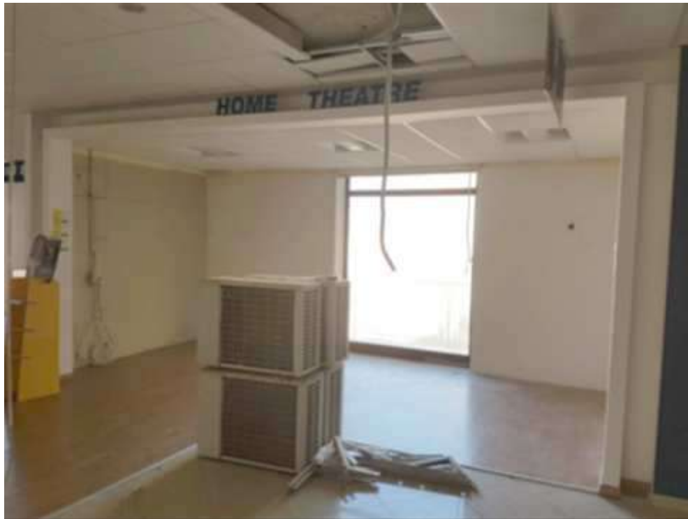
Foto 13- Interni del piano rialzato