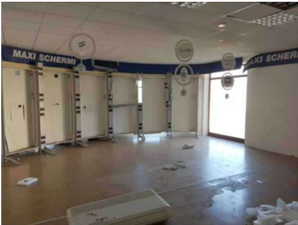
Foto 12- Interni del piano rialzato