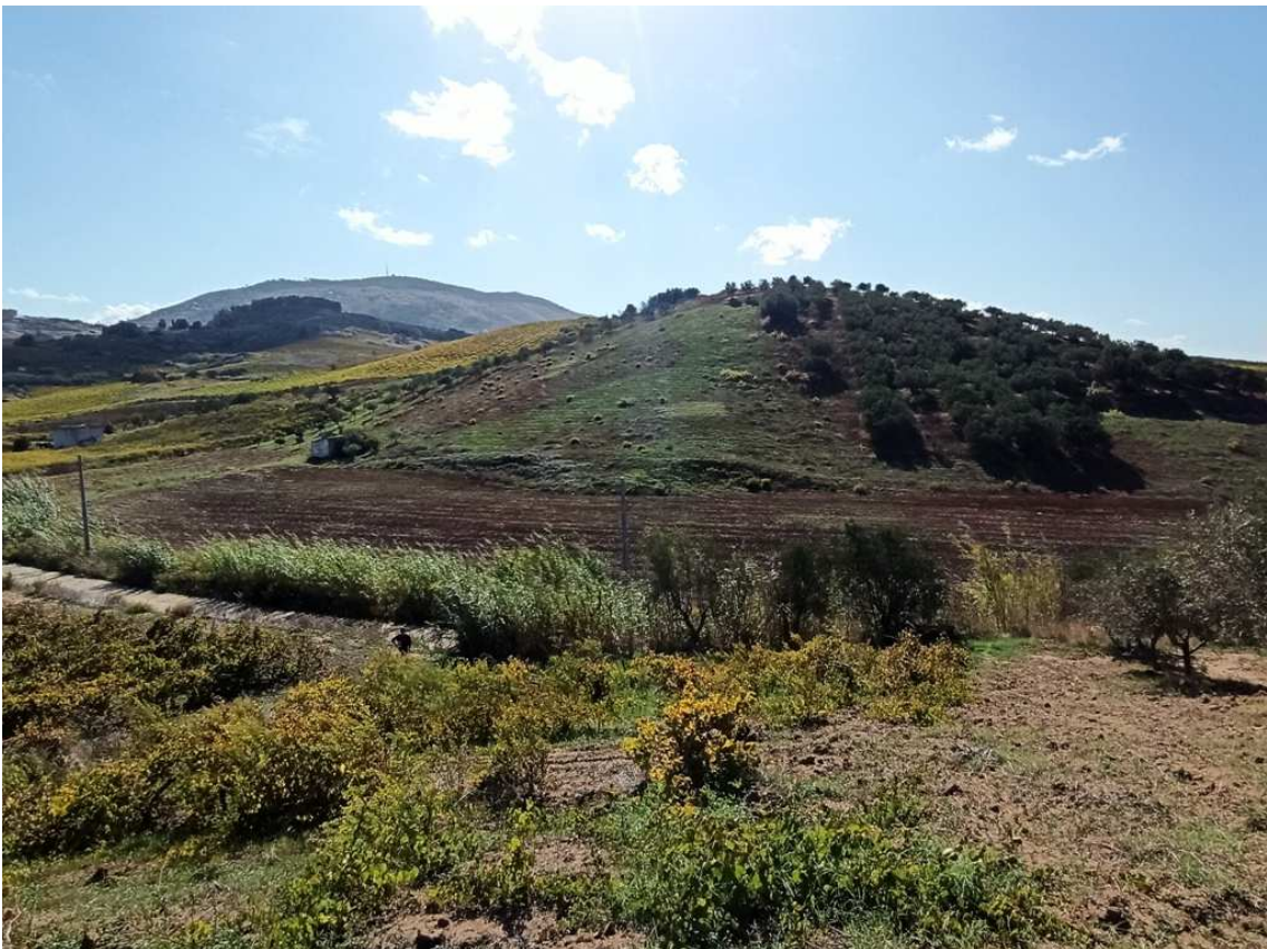
Foto 8 – Appezamento formato dalle partt. 30, 596, 595 e 29 del foglio 39 (vista generale in direzione Sud)