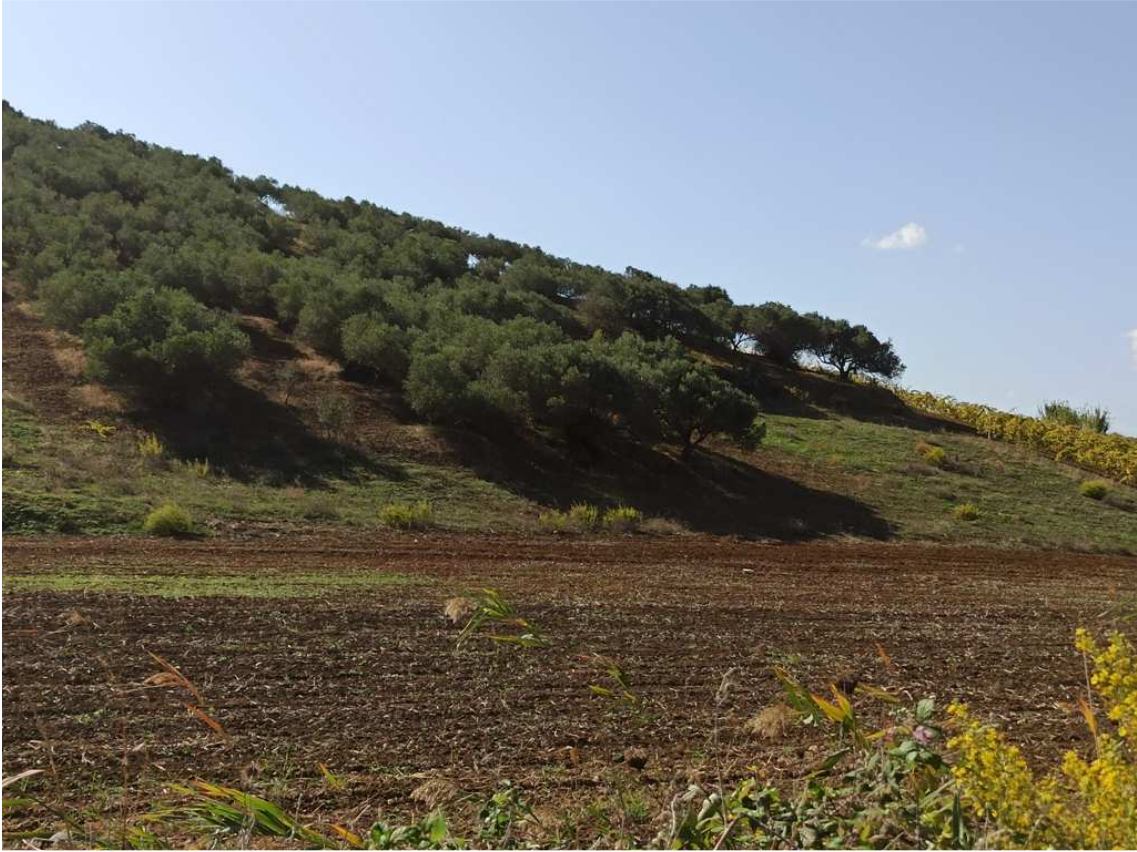
Foto 7 – Partt. 595 e 29 del foglio 39 a uliveto (vista da strada in direzione Sud-Ovest)