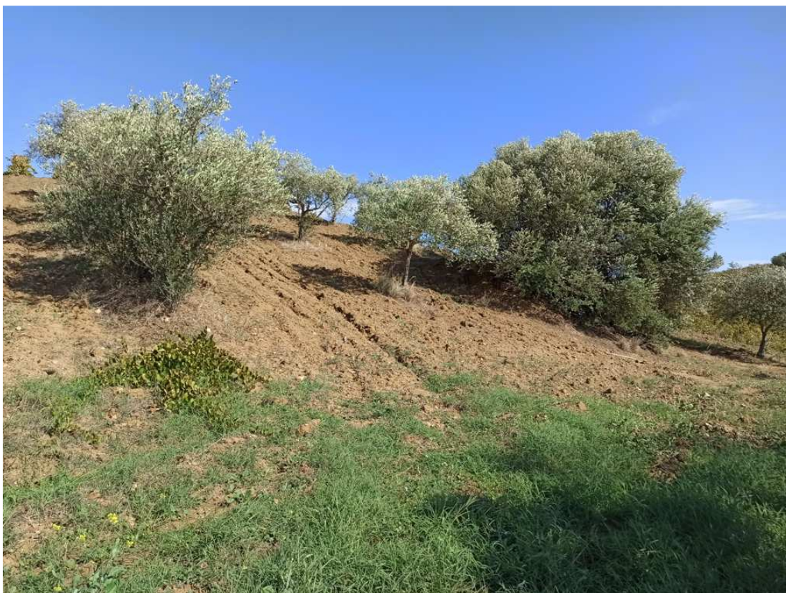
Foto 12 – Appezamento formato dalle partt. 427, 428, 429, 470, 508, 574 del foglio 32 (vista in direzione N-E) (particolare di una porzione a uliveto)