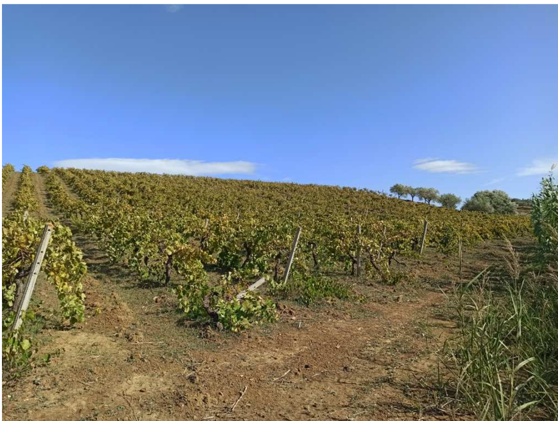
Foto 10 – Appezamento formato dalle partt. 427, 428, 429, 470, 508, 574 del foglio 32 (vista in direzione N-E) (porzione a vigneto)