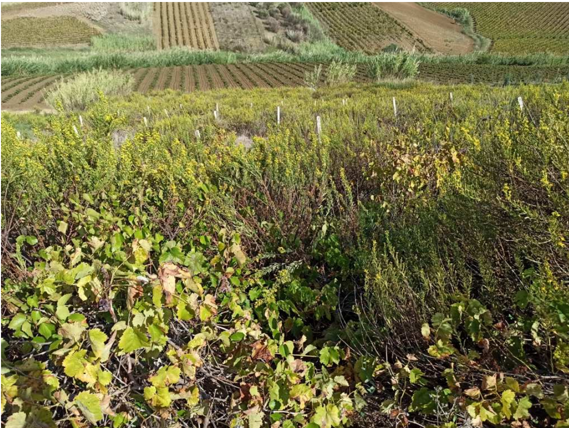
Foto 4 – Part. 392/fg. 32 (vista in direzione N) – Stato del vigneto