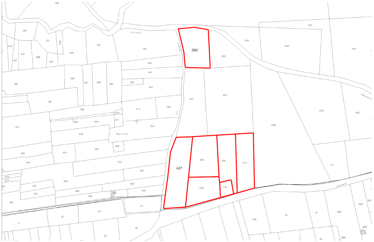
Stralcio del foglio di mappa catastale n. 32 – Comune di Alcamo – partt. 392, 427, 428, 429, 470, 508, 574

Terreni agricoli a vigneto e uliveto di complessivi mq. 23.440 catastali siti in Alcamo, c/da Crivara-Molinello