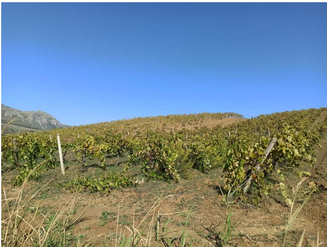
Foto 9 – Appezamento formato dalle partt. 427, 428, 429, 470, 508, 574 del foglio 32 (vista in direzione N-O) (porzione a vigneto)