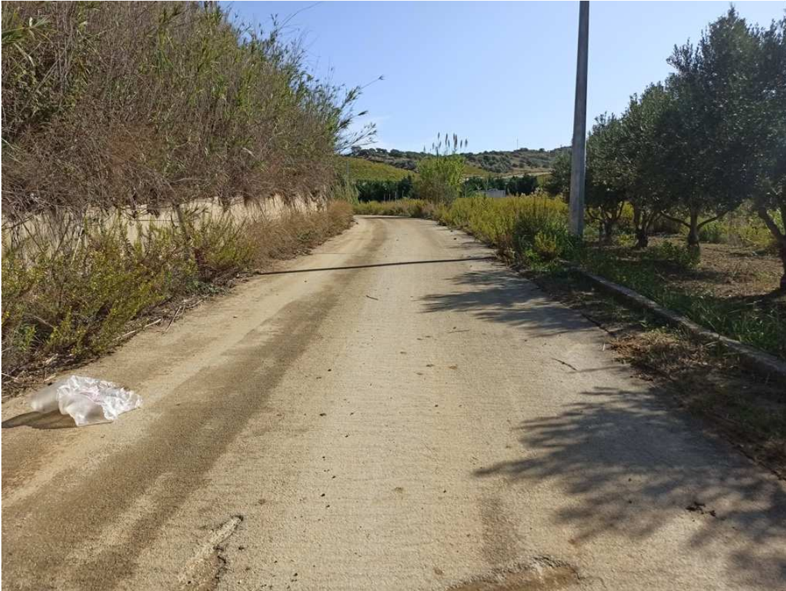
Foto 5 – Strada che divide le particelle di terreno ricadenti sui fogli di mappa 32 e 39