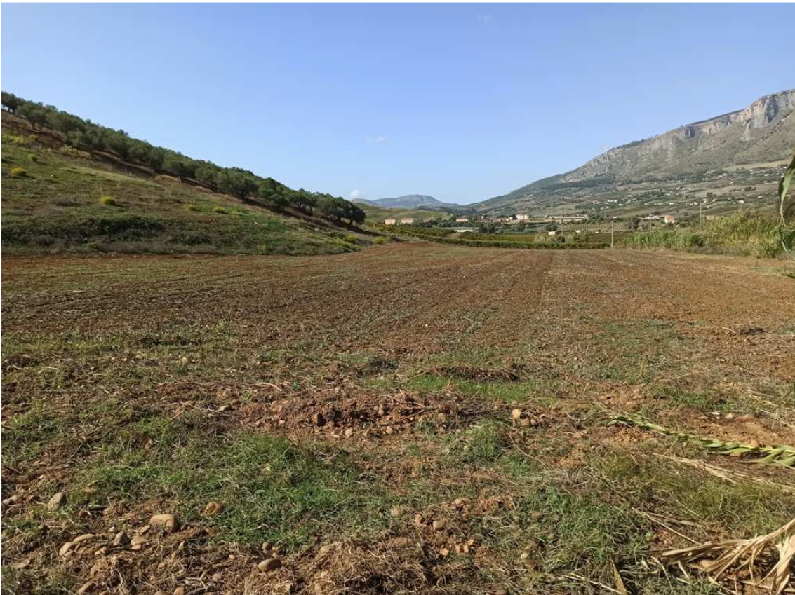
Foto 6 – Partt. 30, 596, 595 e 29 del foglio 39 (vista in direzione Ovest)

(NB: Le partt. 30 e 596 sono incolte mentre le partt. 595 e 29 sono in parte incolte ed in parte a uliveto)