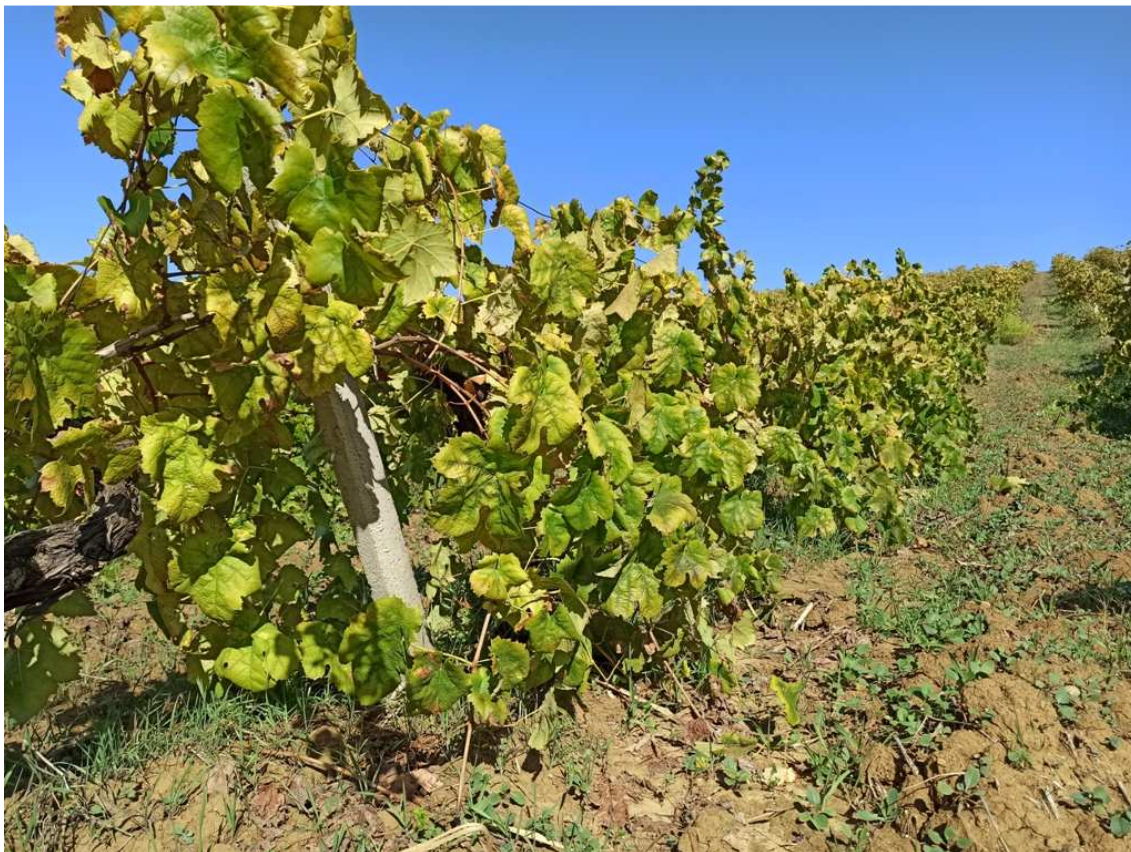
Foto 11 – Appezamento formato dalle partt. 427, 428, 429, 470, 508, 574 del foglio 32 (vista in direzione N) (particolare di una porzione a vigneto)