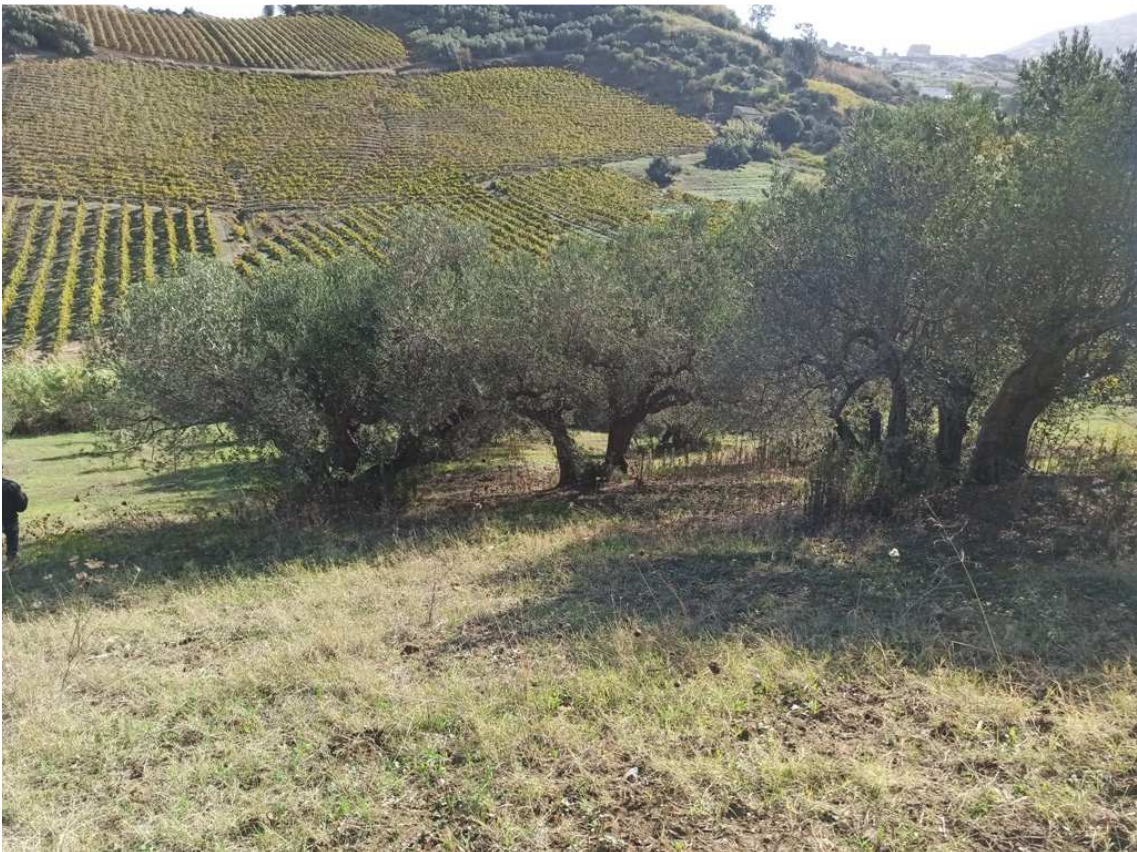
Foto 6 – Part. 636 – Uliveto (foto scattata in direzione sud - est)