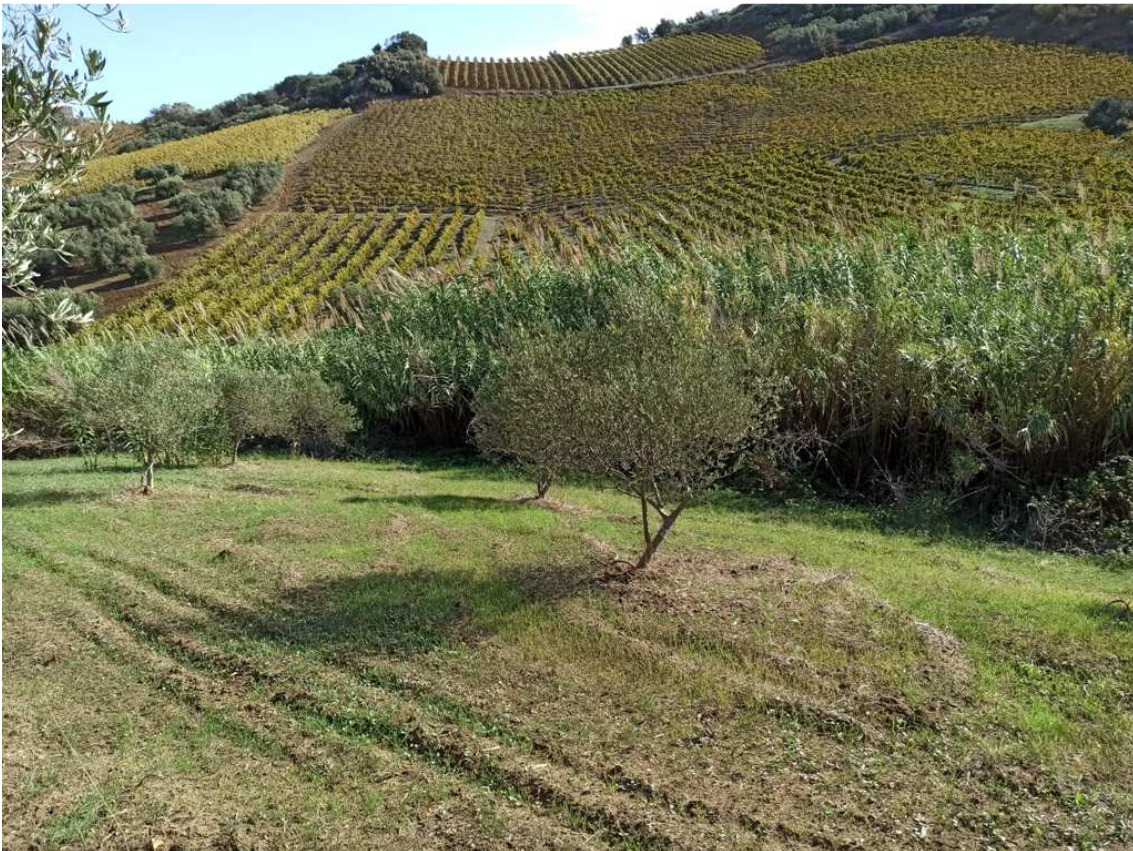
Foto 8 – Part. 558 – Uliveto/Canneto – (foto scattata in direzione est)