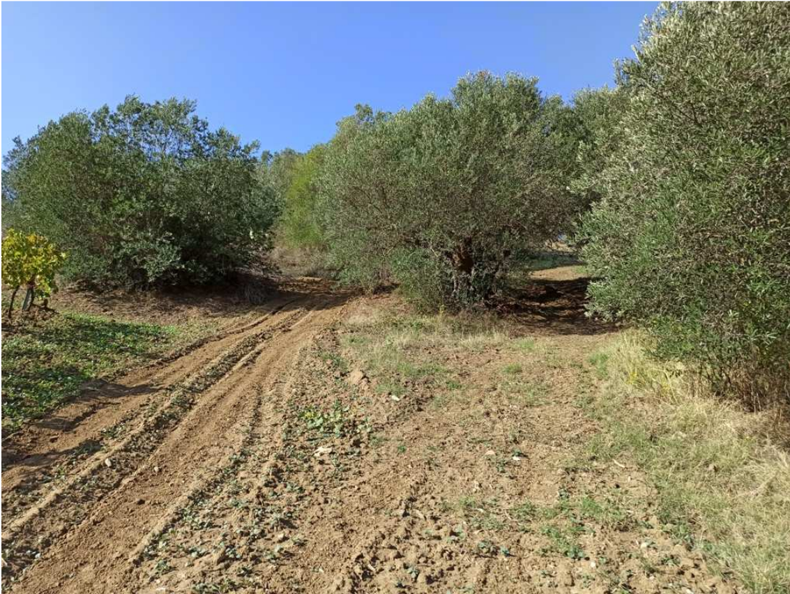
Foto 7 – Part. 636 – Uliveto – (foto scattata in direzione ovest) – a sx terreno di proprietà altrui