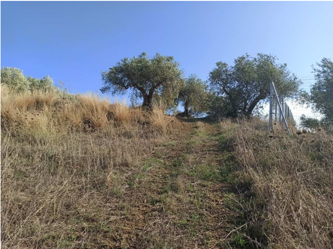
Foto 2 – Part. 636 – Uliveto (a dx recinzione a confine con altro terreno)