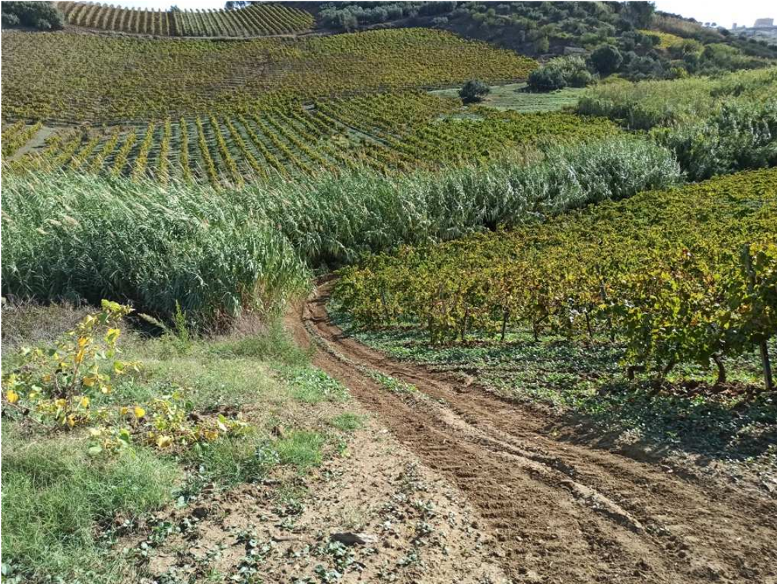
Foto 9 – Part. 558 – Canneto – (foto scattata in direzione sud-est)

N.B. – a dx è visibile una parte del lotto a vigneto ricadente in mappa sulla part. 558 ma coltivato da terzi