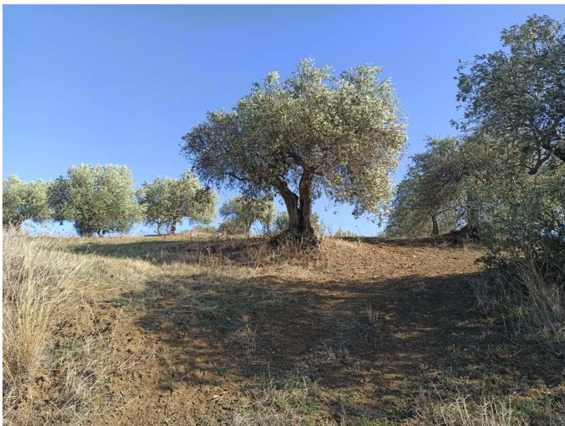
Foto 3 – Part. 636 – Uliveto (foto scattata in direzione nord-est)