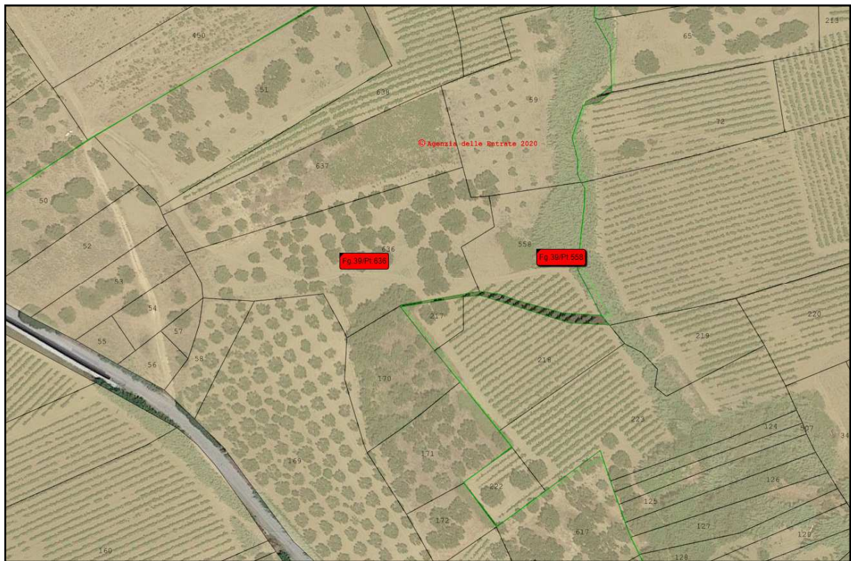
Sovrapposizione foglio di mappa con mappa satellitare - Comune di Alcamo – partt. 636 e 558