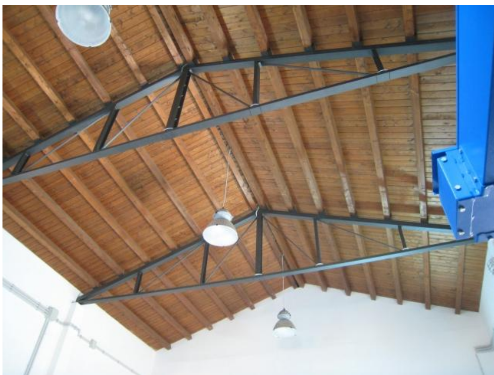
Foto n. 113. Copertura del frantoio.