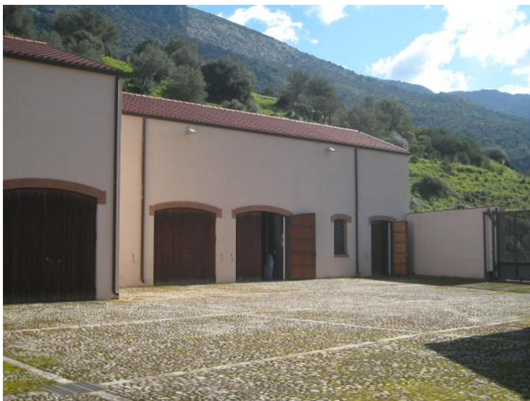
Foto n. 99. Imbottigliamento, deposito confezioni, magazzino e cancello di accesso carraio.