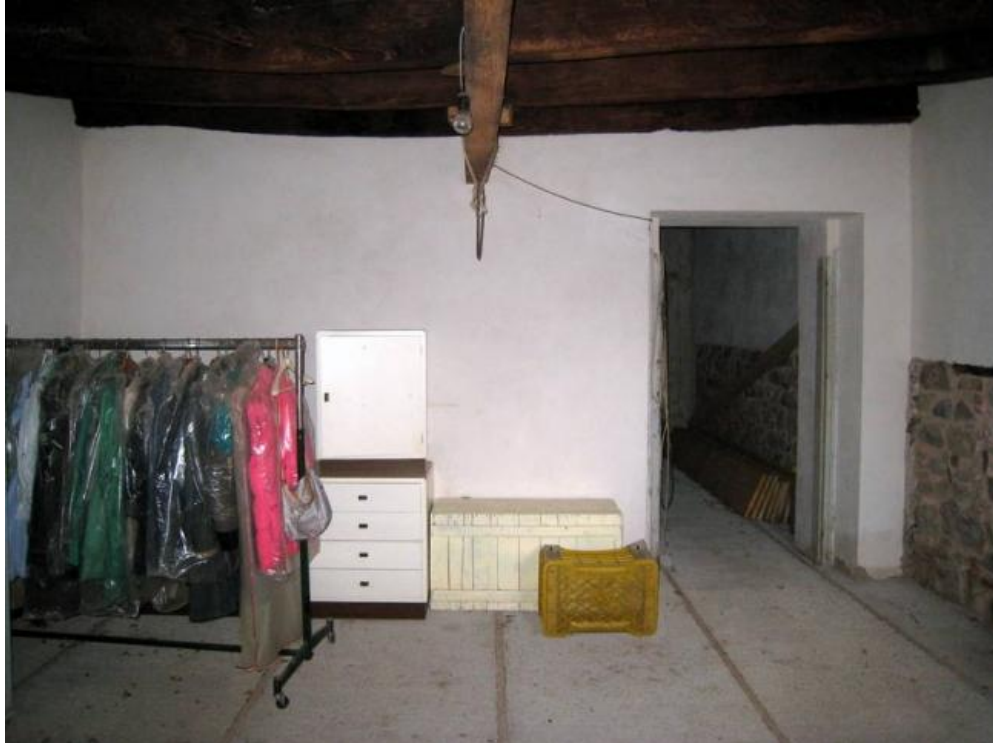
Foto n. 22. Altra immagine della stessa stanza.