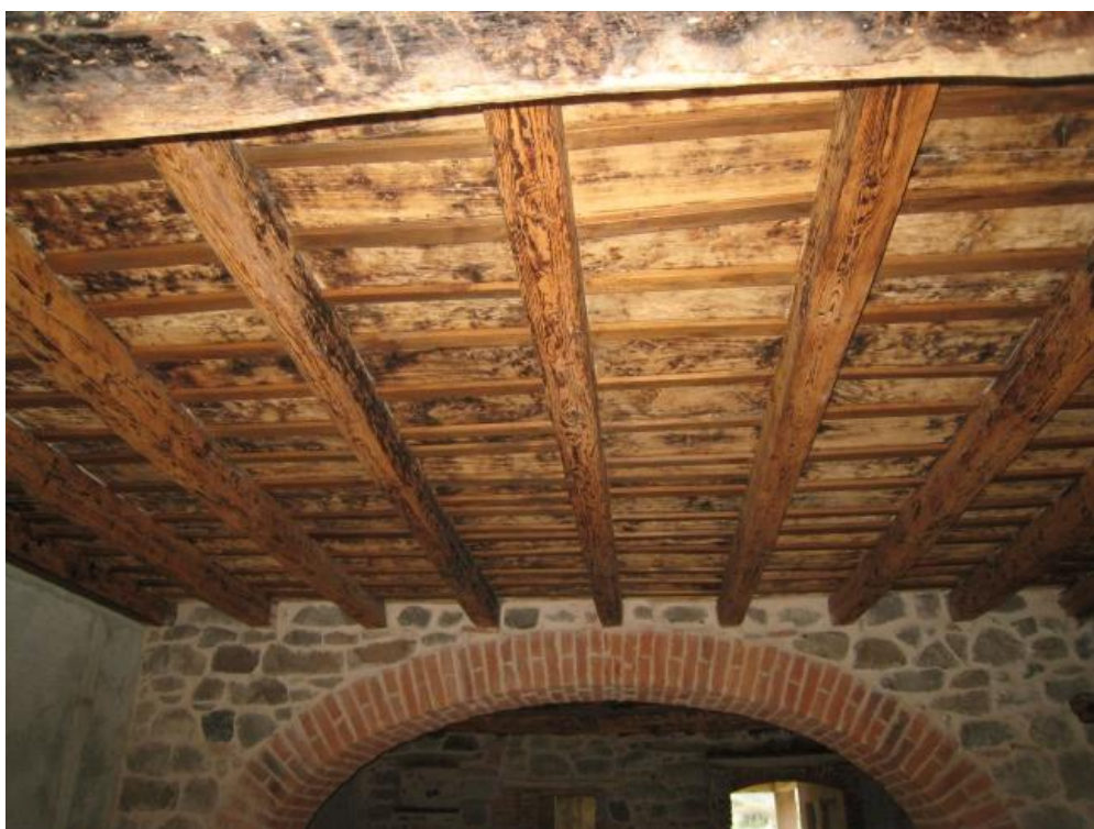
Foto n. 15. Dettaglio del solaio.