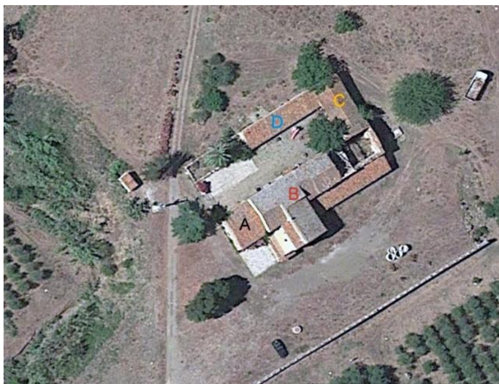
Foto n. 9. Foto aerea dei quattro corpi di fabbrica che formano il baglio.