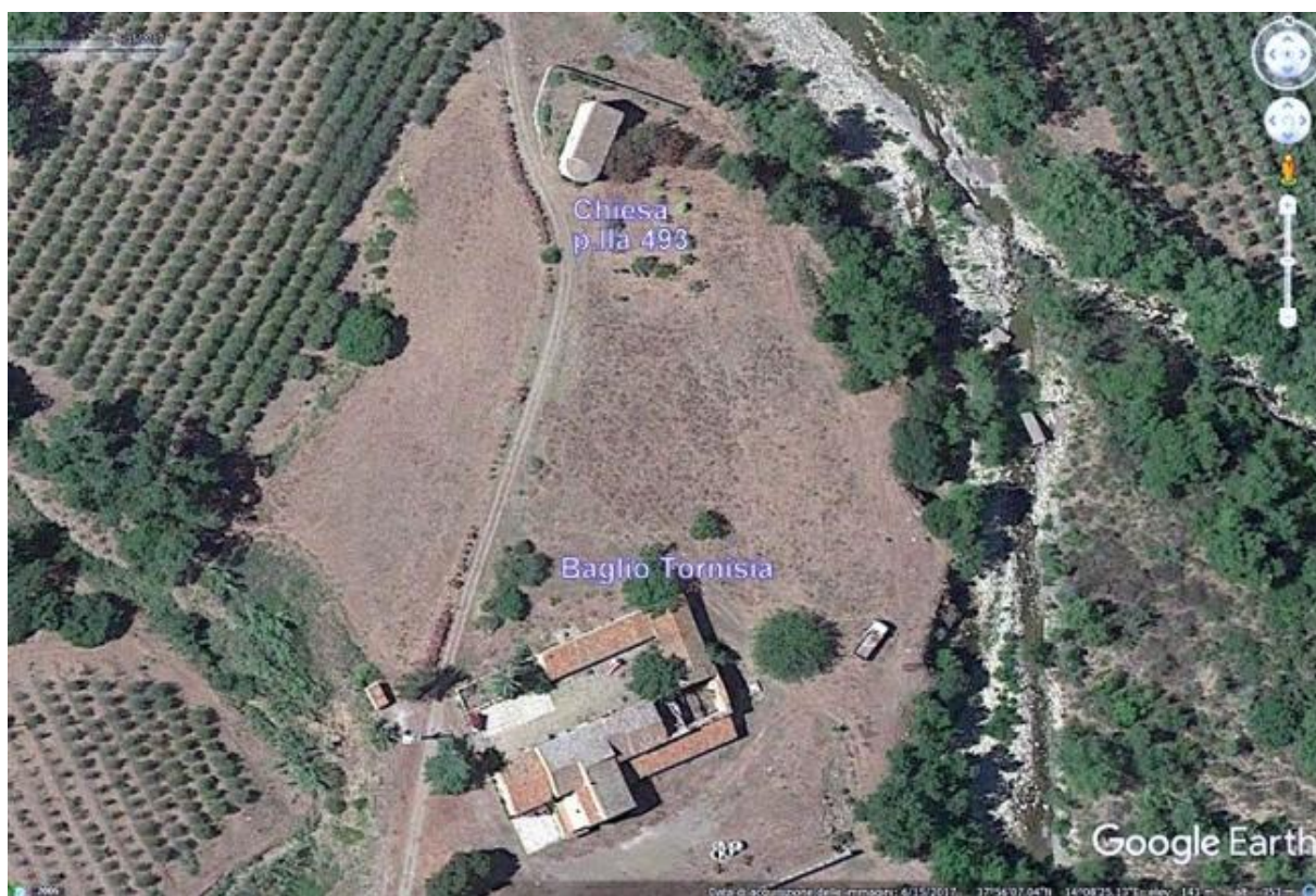
Foto n. 60. Posizione territoriale della chiesa rispetto al baglio Tornisia.