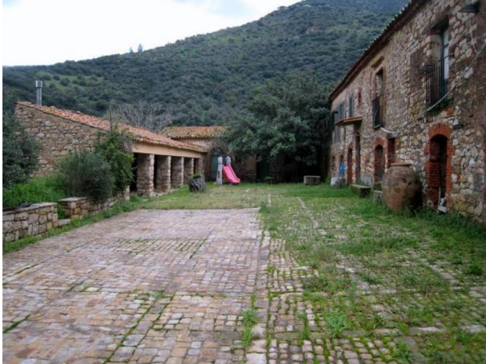
Foto n. 8. Il cortile.