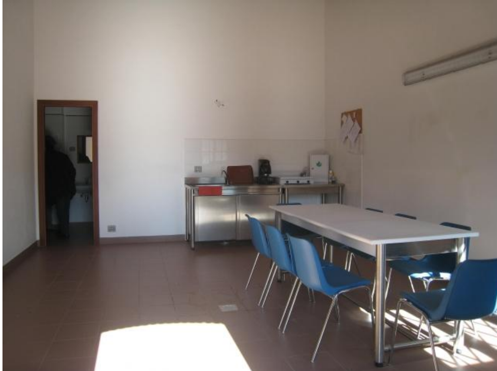
Foto n. 108. Stanza operai.