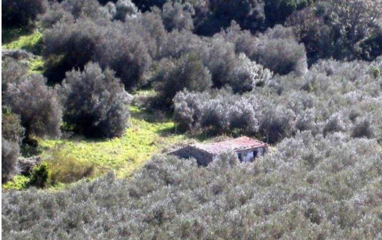
Foto n. 94. Il fabbricato.