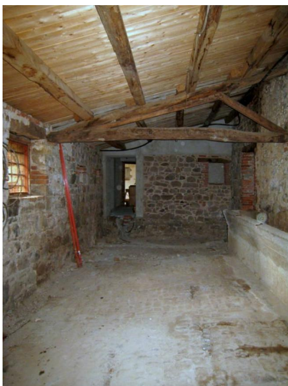
Foto n. 26. La stalla, altra immagine.