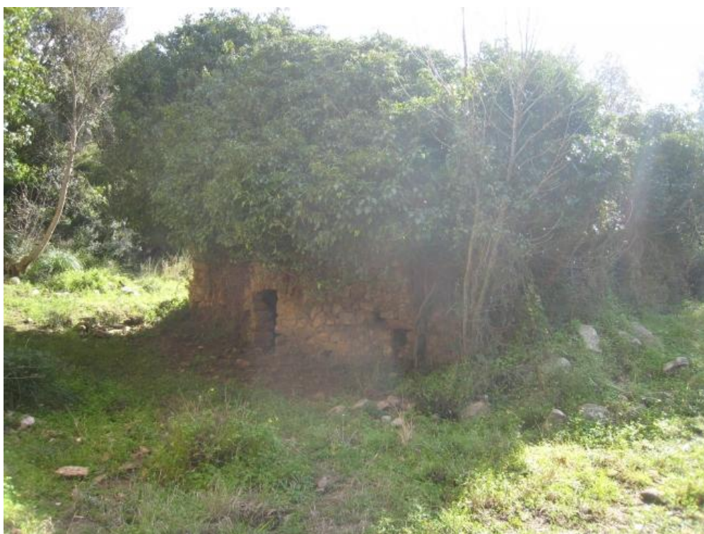
Foto n. 80. L'edificio più piccolo.