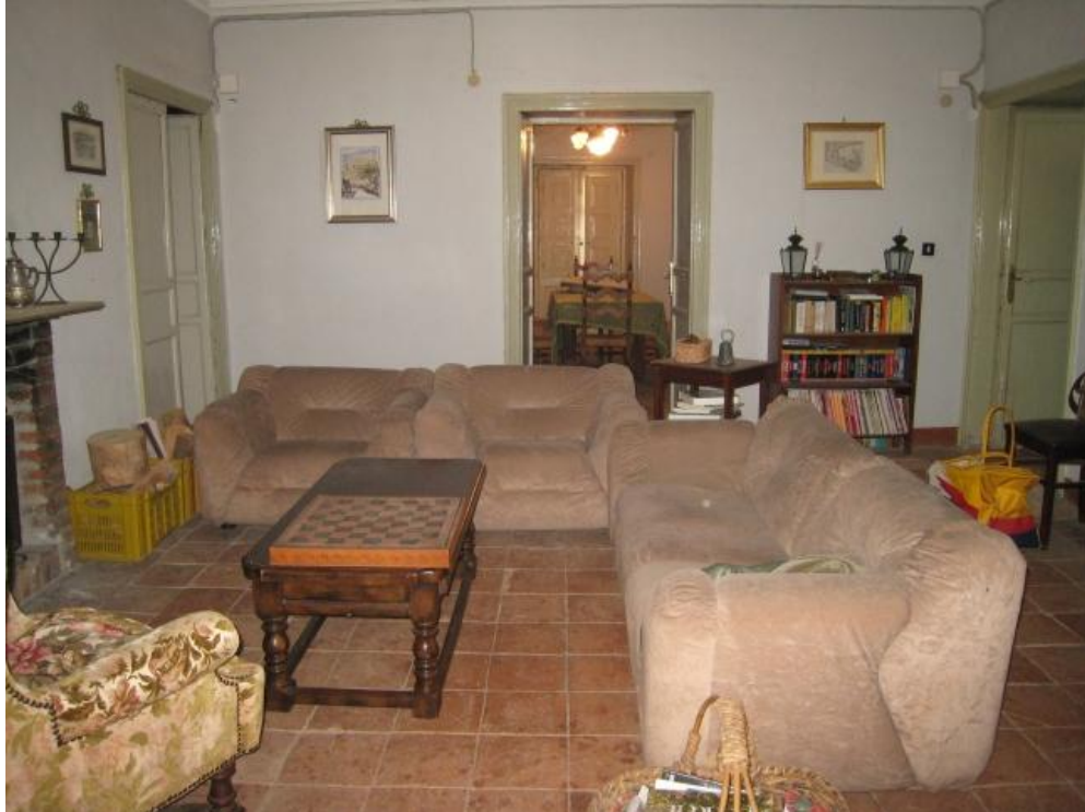
Foto n. 37. Il salotto di piano primo. L'impianto elettrico è a vista.