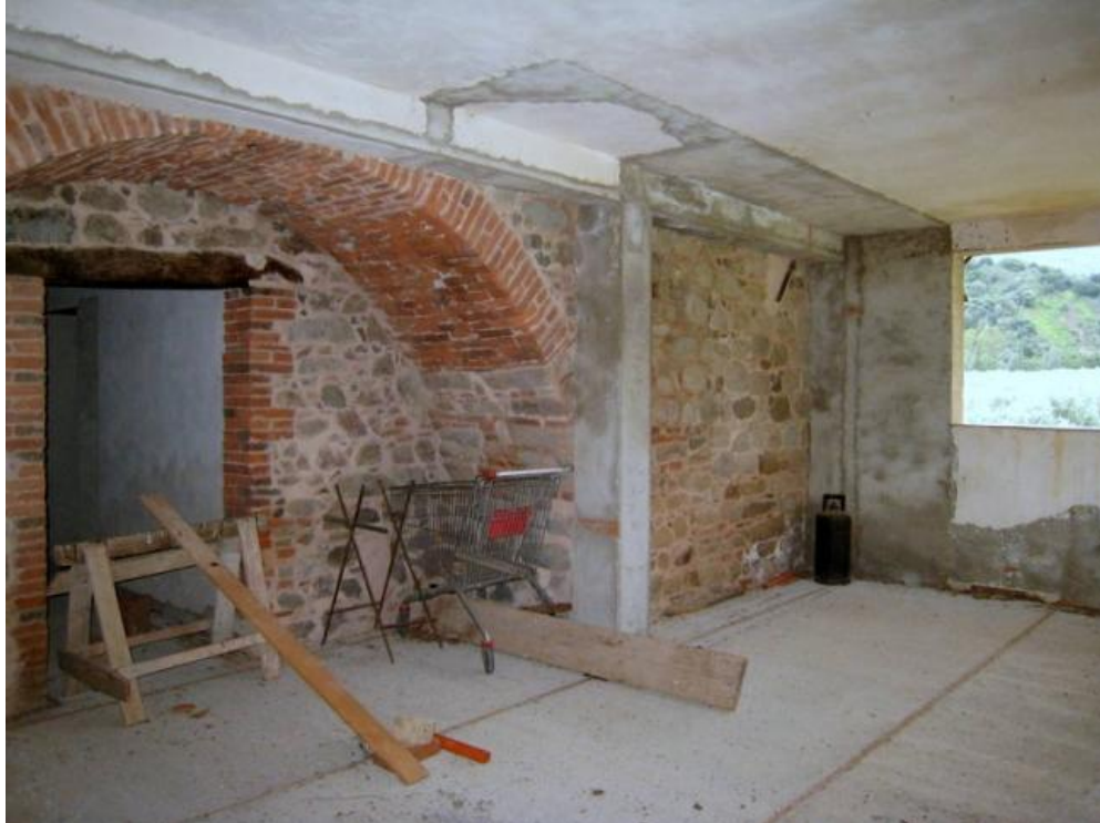
Foto n. 16. Ampliamento al piano terra del corpo "B" fatto abusivamente.