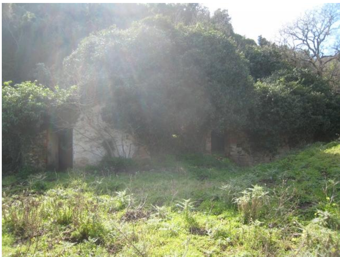
Foto n. 83. La struttura muraria è appena riconoscibile tra la folta vegetazione.