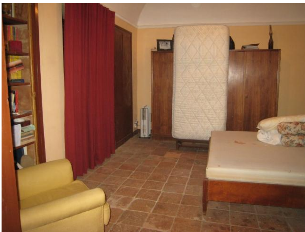
Foto n. 44. La camera da letto con affaccio sul terrazzo. Il pavimento è sconnesso.