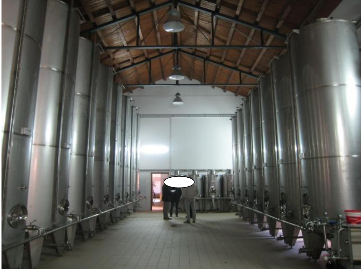
Foto n. 114. Il grande locale che ospita i silos di stoccaggio.