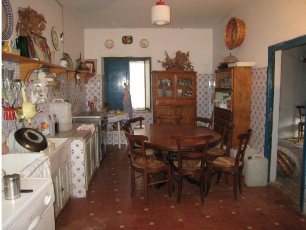
Foto n. 39. La cucina.