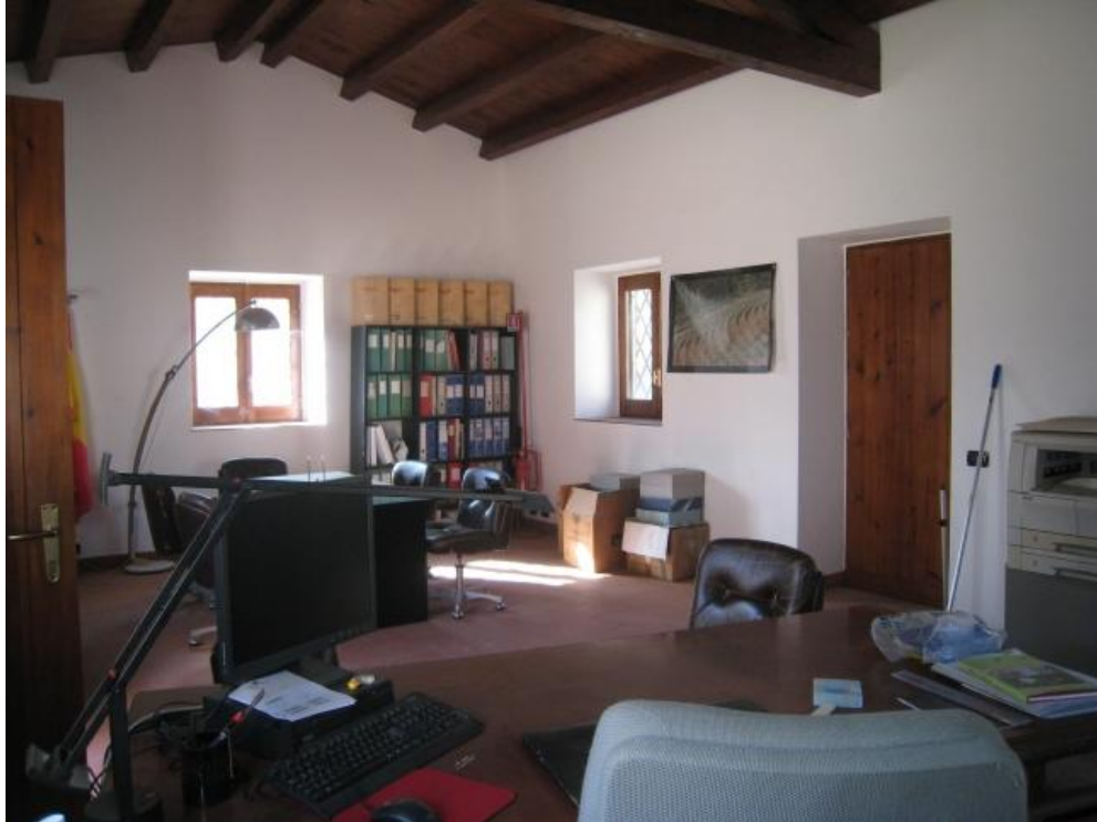
Foto n. 102. L'ufficio.