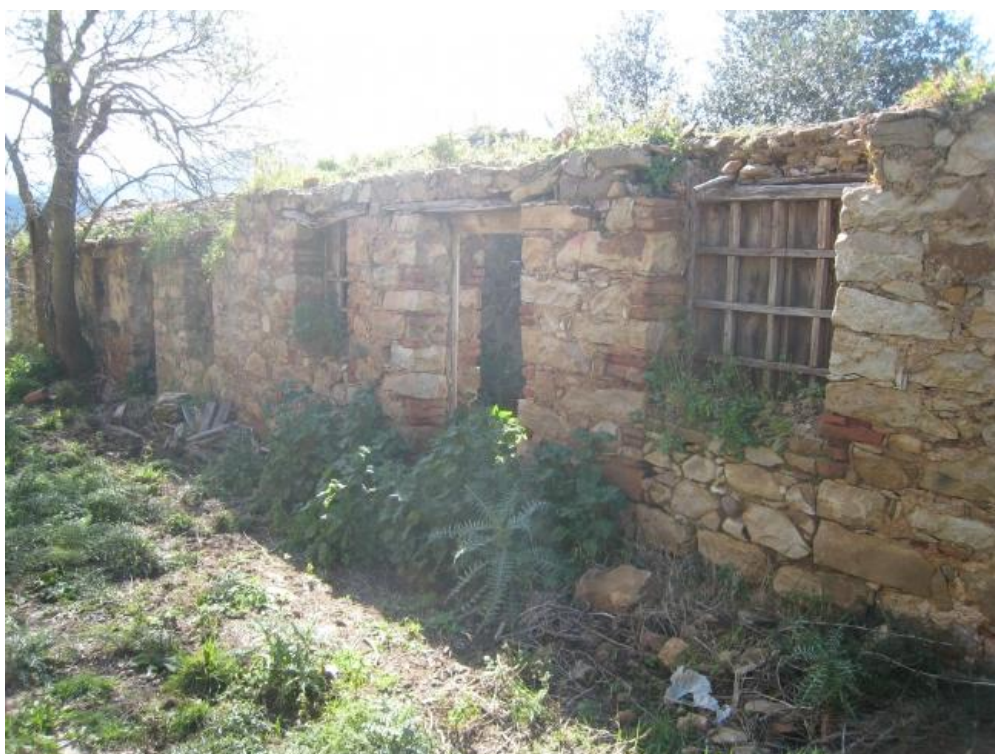
Foto n. 73. Altra immagine del prospetto principale del fabbricato ad una sola elevazione.