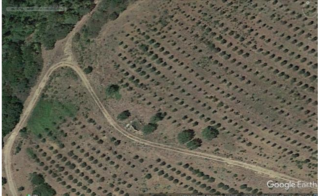
Foto n. 87. Di questa casa, detta casa Pagliera, rimane in piedi un solo setto murario.