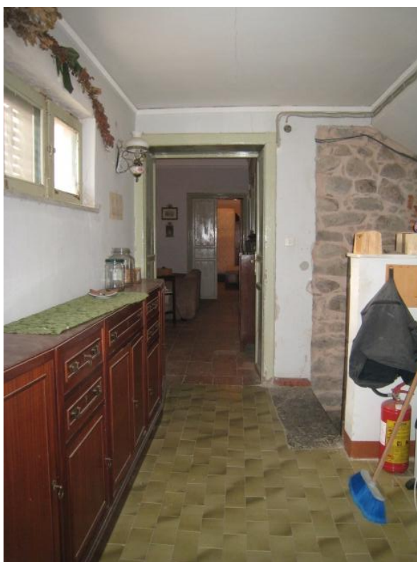
Foto n. 34. Il disimpegno, immagine opposta alla precedente.