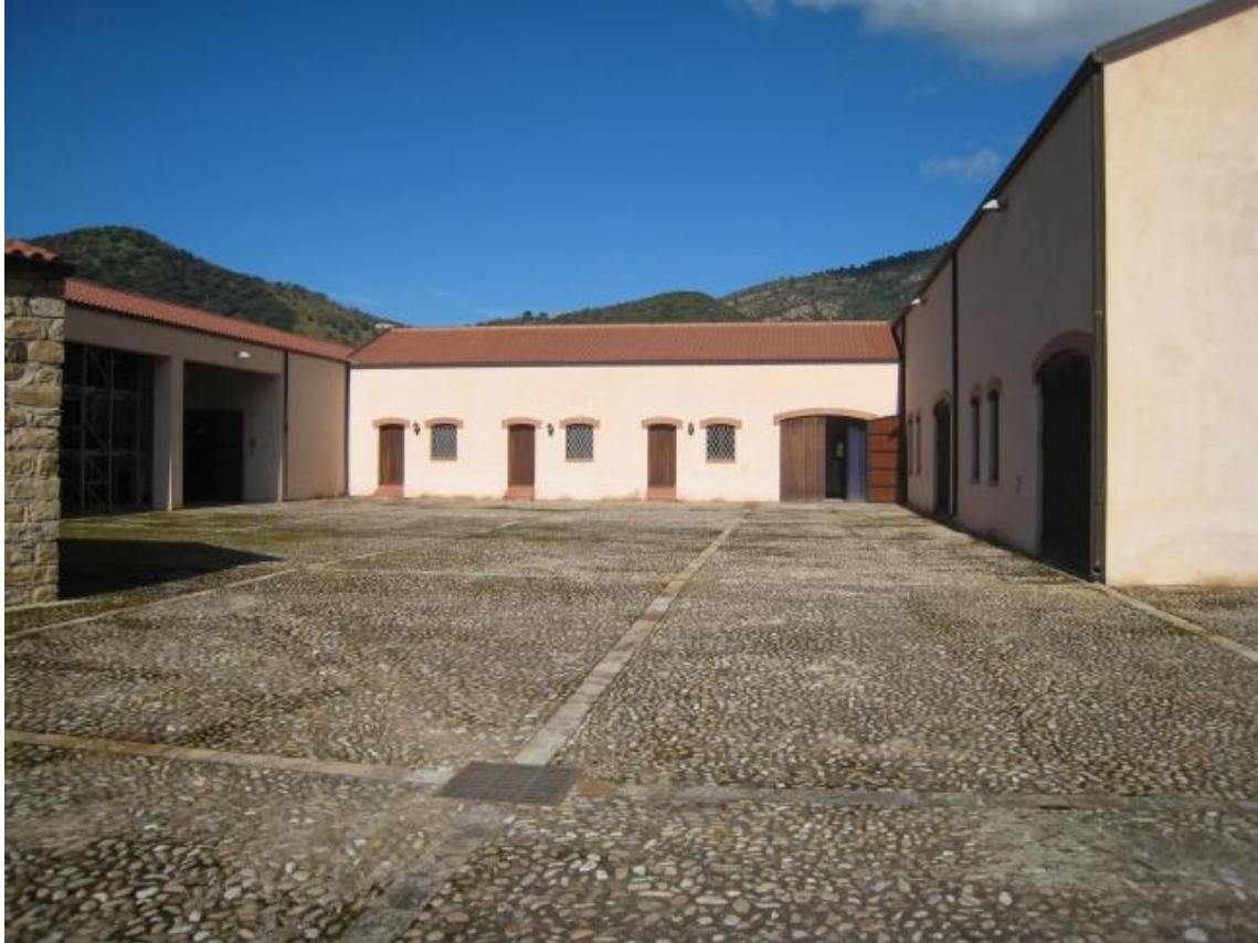
Foto n. 98. Il cortile: a Sx il portico; al centro la stanza operai, la sala conferenze, la sala riunioni; a Dx il frantoio con i silos.