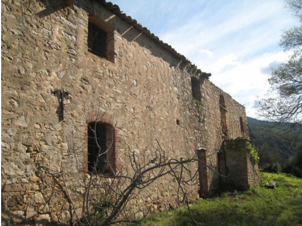
Foto n. 68. Prospetto principale dell'edificio a due piani.