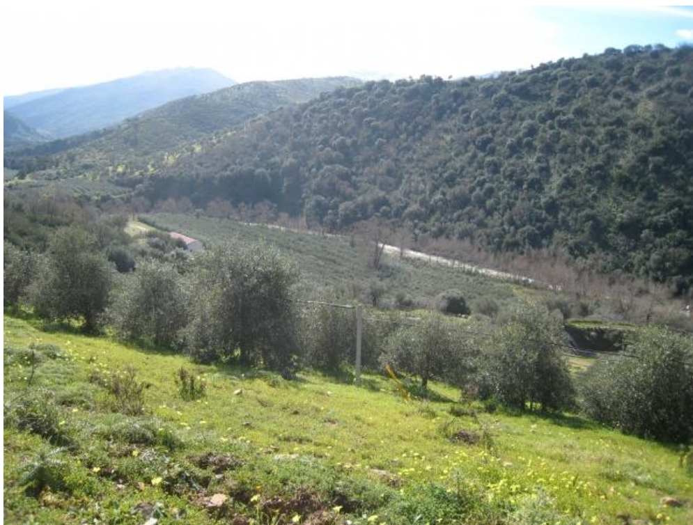
Foto n. 124. Frassineto lungo il Fiume Pollina.