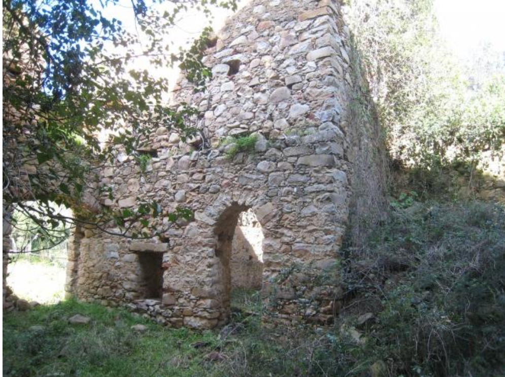
Foto n. 77. Altro prospetto dell'edificio più grande.