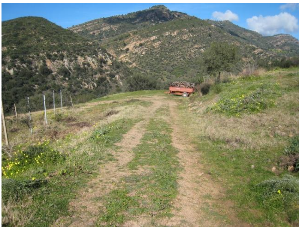
Foto n. 126. Viabilità interna.