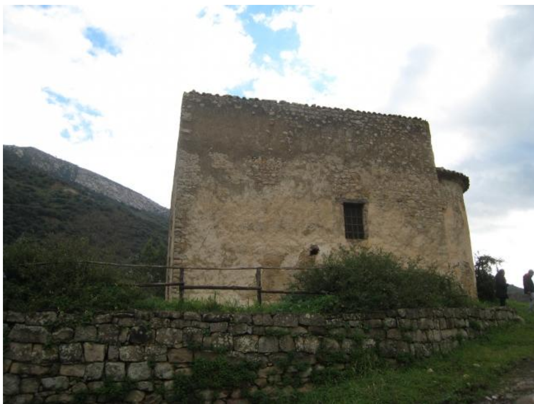
Foto n. 62. Prospetto laterale.