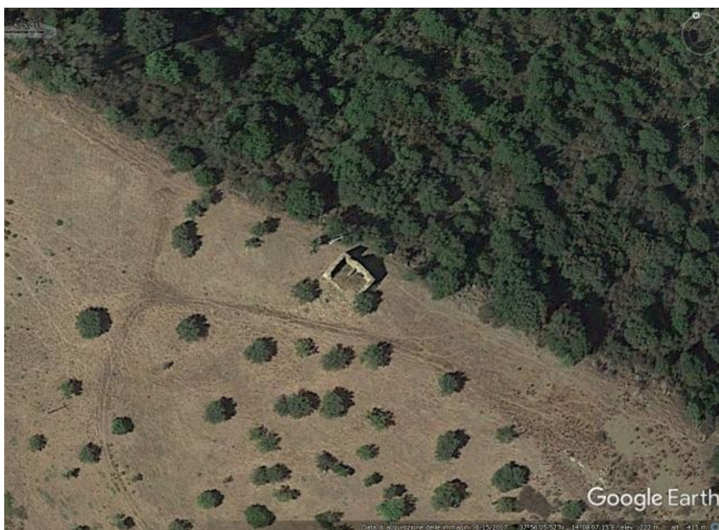
Foto n. 86. La casa Belvedere o Piano della Casa.