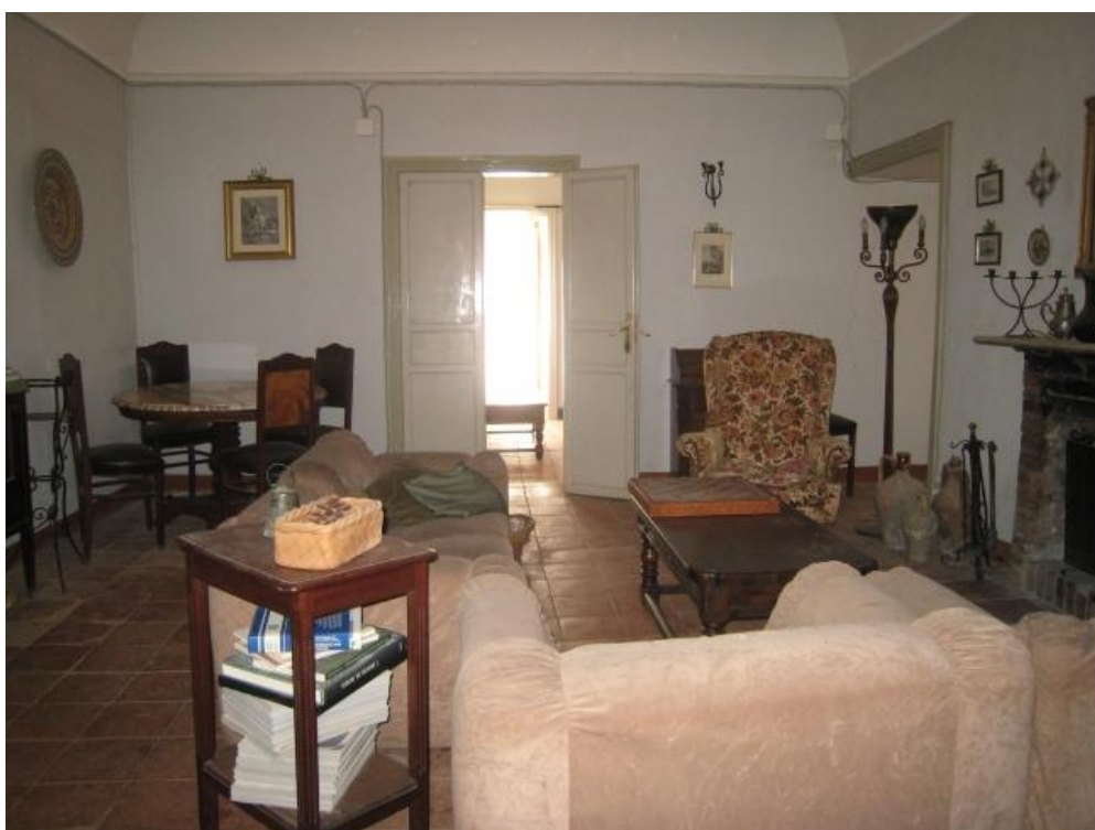
Foto n. 38. Altra visione del salotto. Il pavimento è in cattive condizioni.