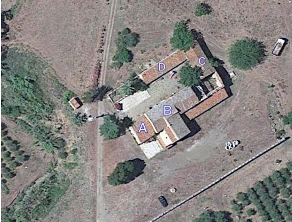
Foto n. 4. Indicazione dei diversi corpi di fabbrica che formano il baglio.