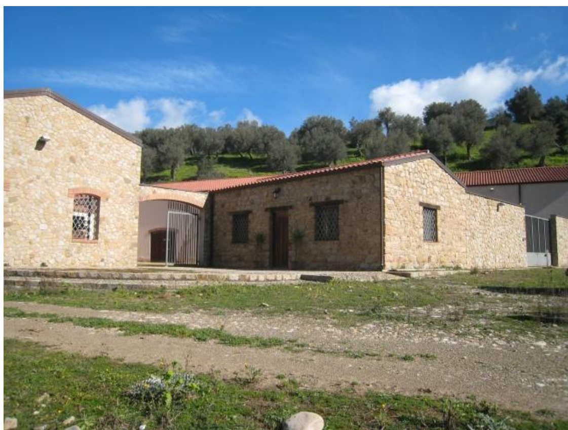
Foto n. 97. I due cancelli di ingresso con, al centro, l'ufficio ex F.R.