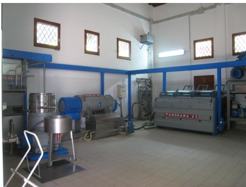
Foto n. 111. Il frantoio.