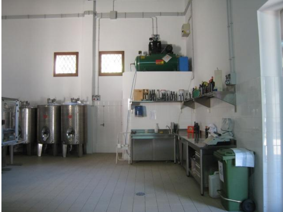
Foto n. 116. Altra immagine della sala imbottigliamento.