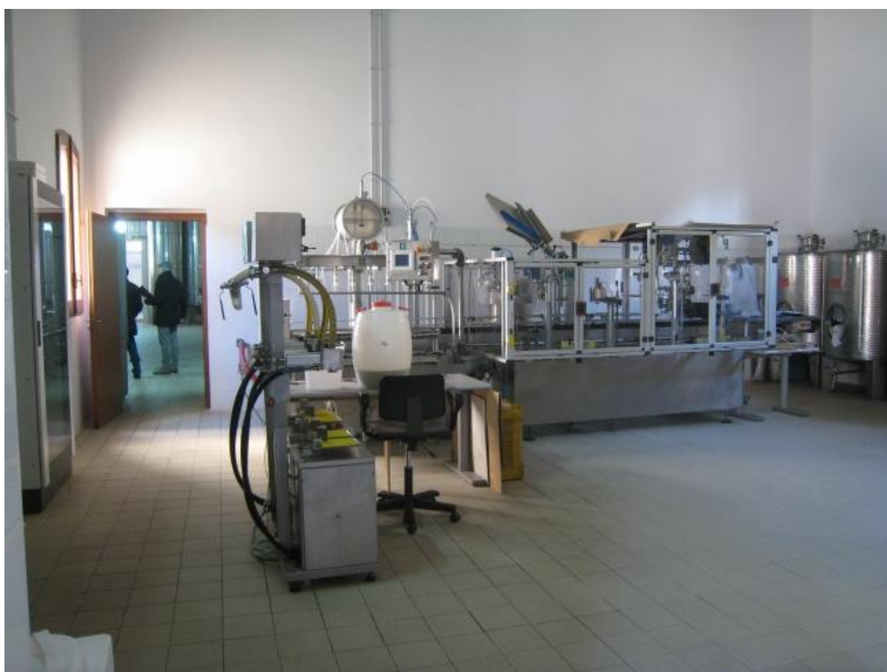
Foto n. 115. Sala imbottigliamento.