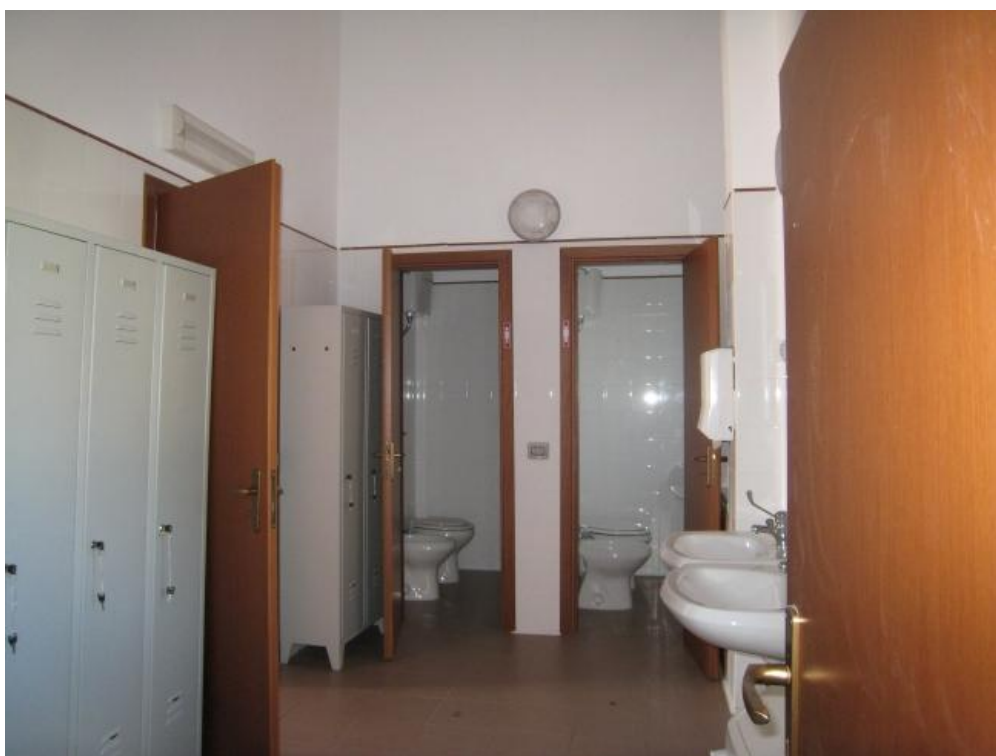
Foto n. 109. Bagno operai.