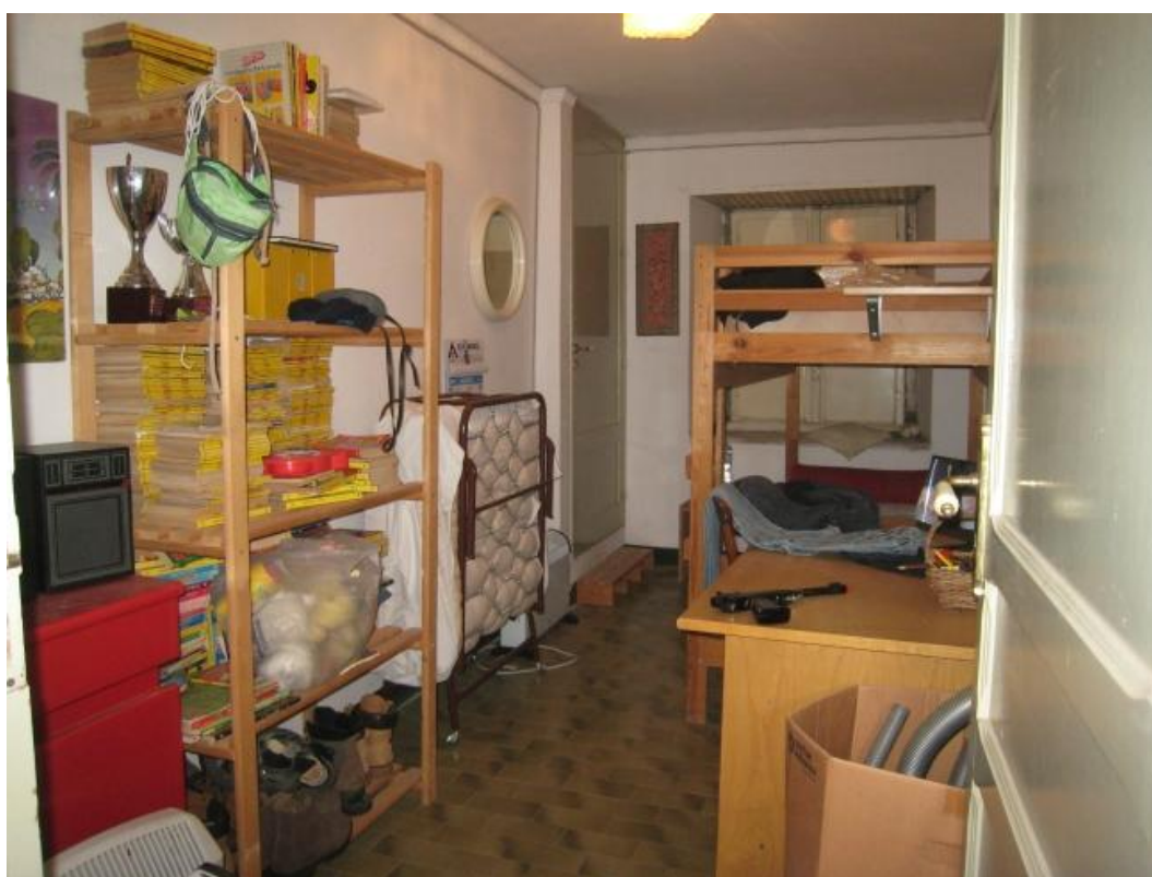
Foto n. 46. La cameretta adiacente il vano scala.