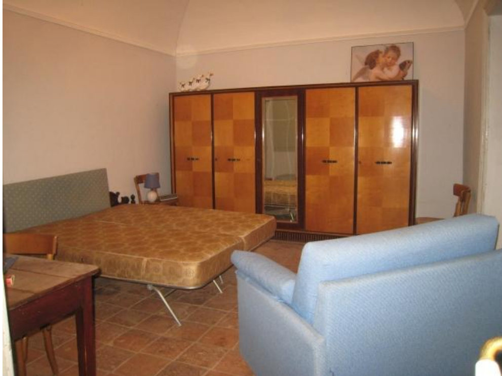
Foto n. 43. La camera da letto con affaccio sul cortile.