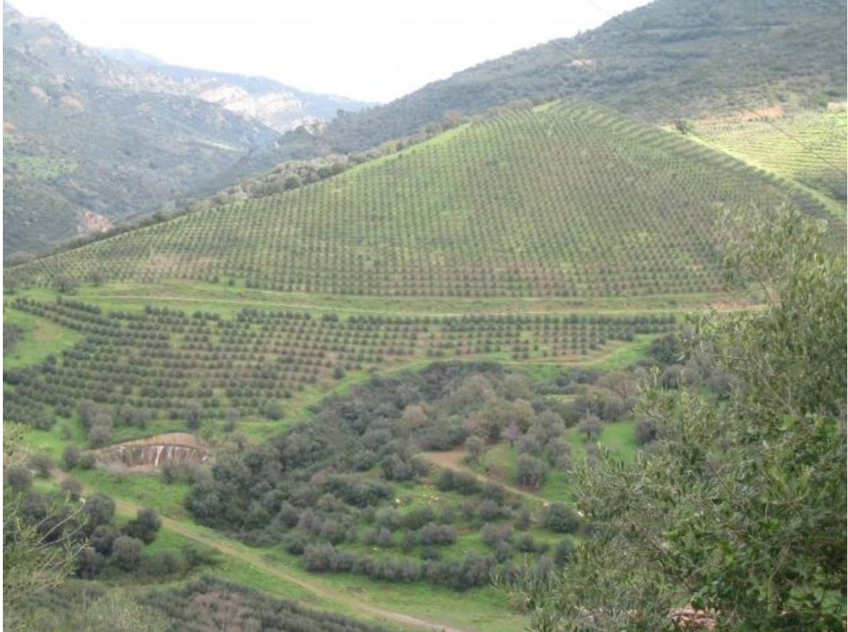
Foto n. 127. Uno dei due bacini e l'uliveto su collina.