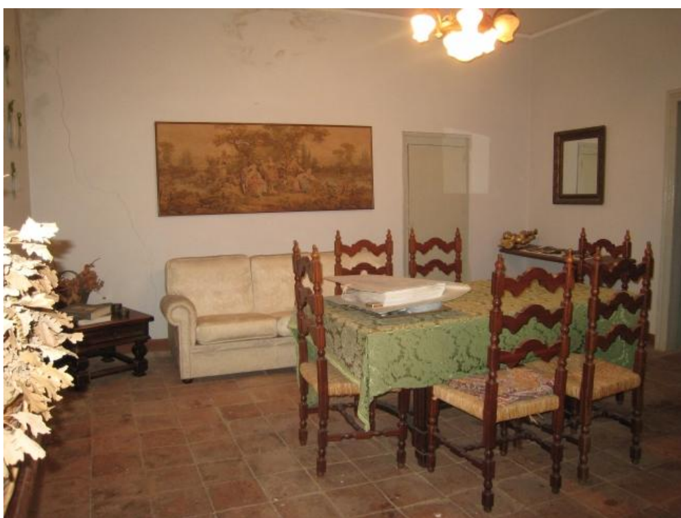
Foto n. 36. Altra inquadratura della sala da pranzo. Sono visibili macchie di umidità e lesione alla muratura.