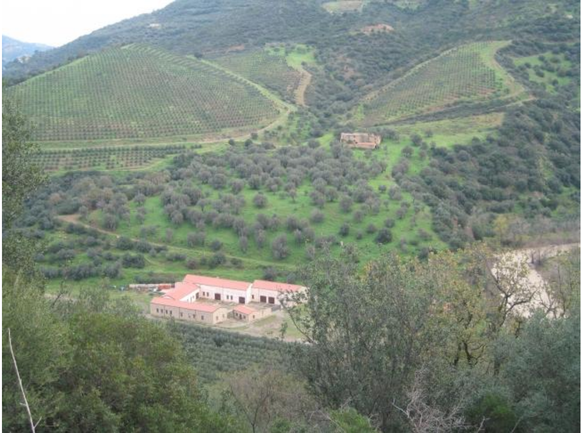
Foto n. 129. Il centro aziendale, case Moggiaro e gli uliveti che sorgono alle loro spalle.