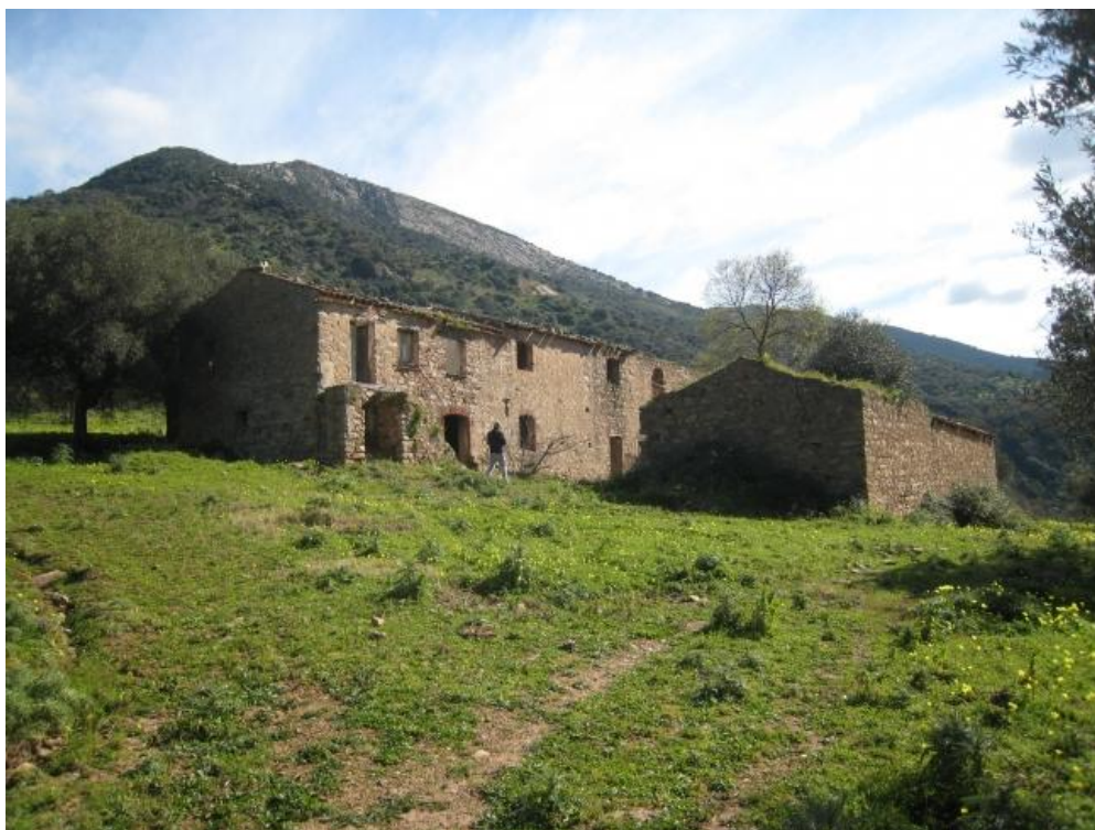
Foto n. 67. Le Case Mocchiaro.