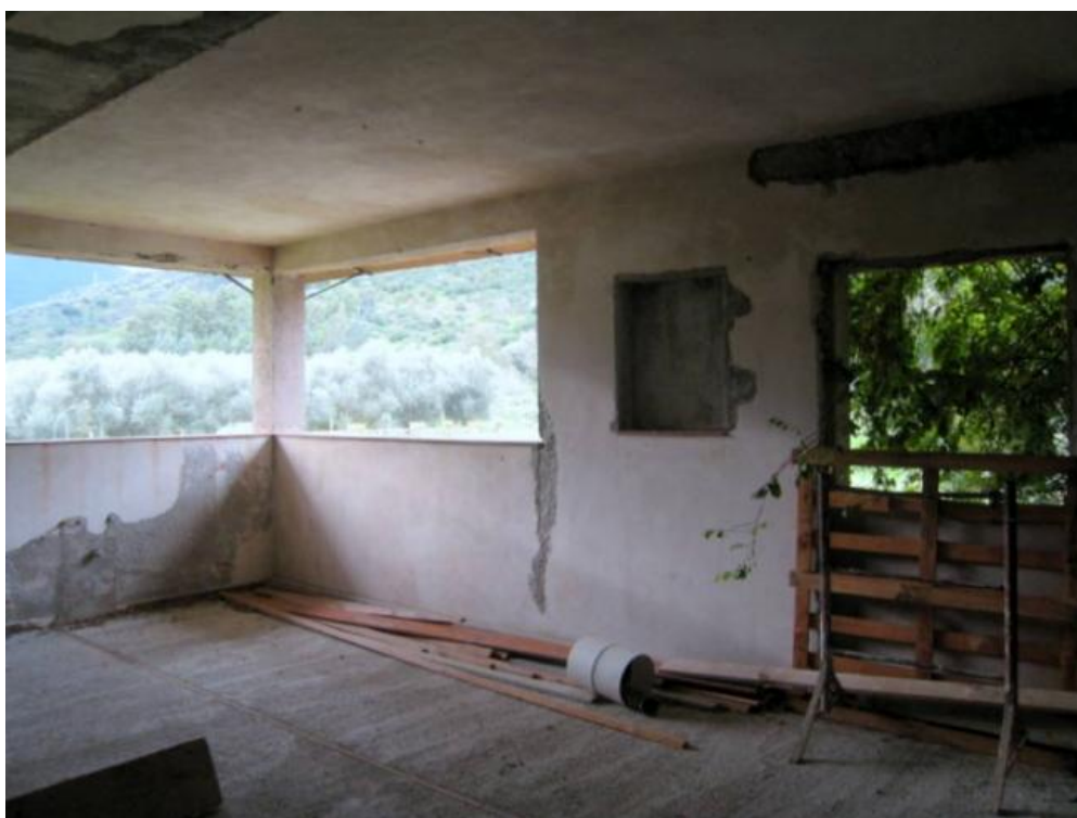
Foto n. 17. Altra immagine dello stesso ambiente abusivo.