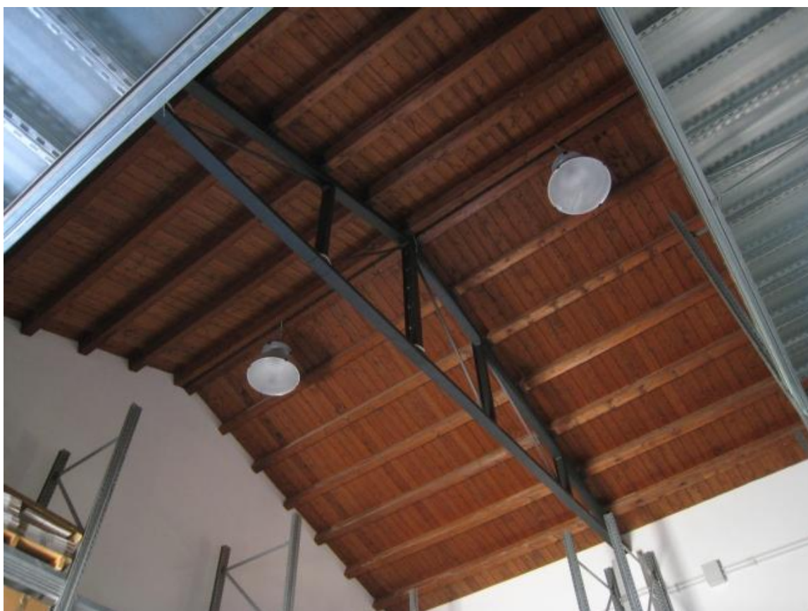
Foto n. 119. La copertura.