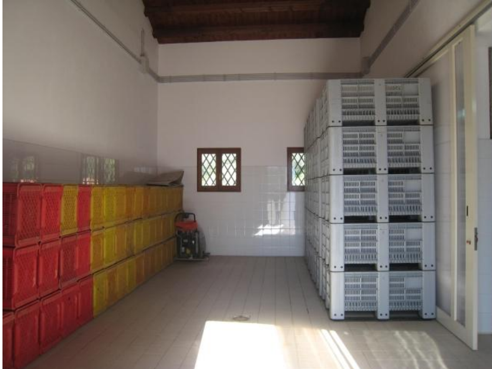
Foto n. 110. Sala stoccaggio. A Dx il frantoio.