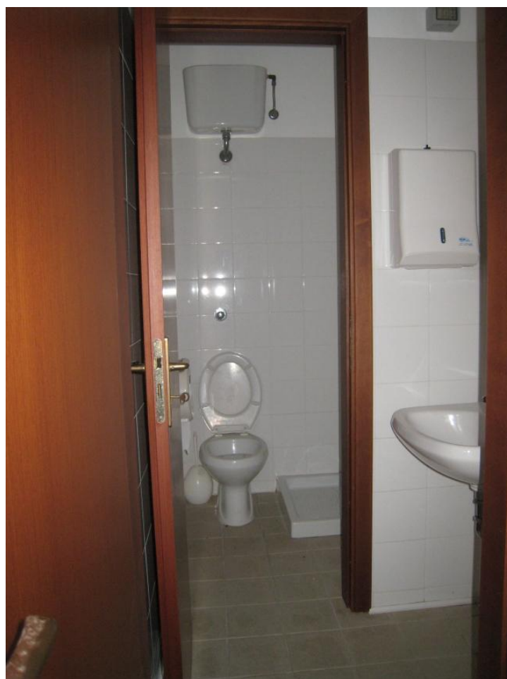
Foto n. 117. w.c ed anti w.c.