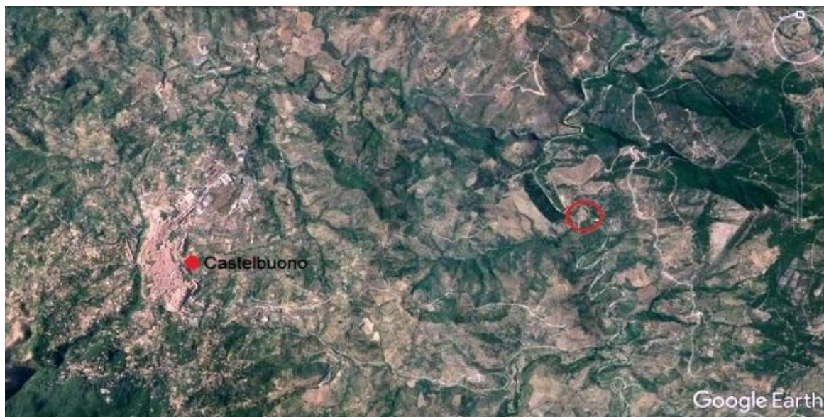
Foto n. 2. Immagine aerea della città di Castelbuono con cerchiata in rosso l'area ove è situato il fabbricato pignorato.