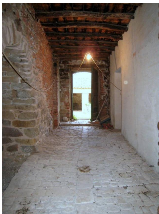
Foto n. 27. Il corridoio al P.T., sub 2 (bene comune non censibile)