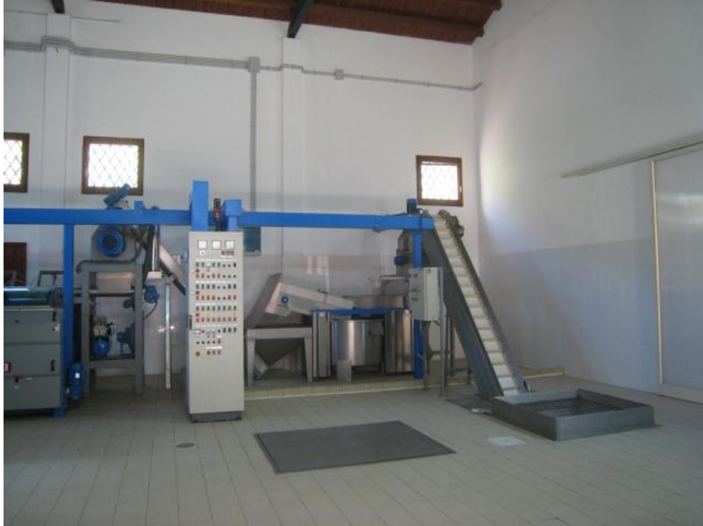
Foto n. 112. Altra immagine del frantoio.