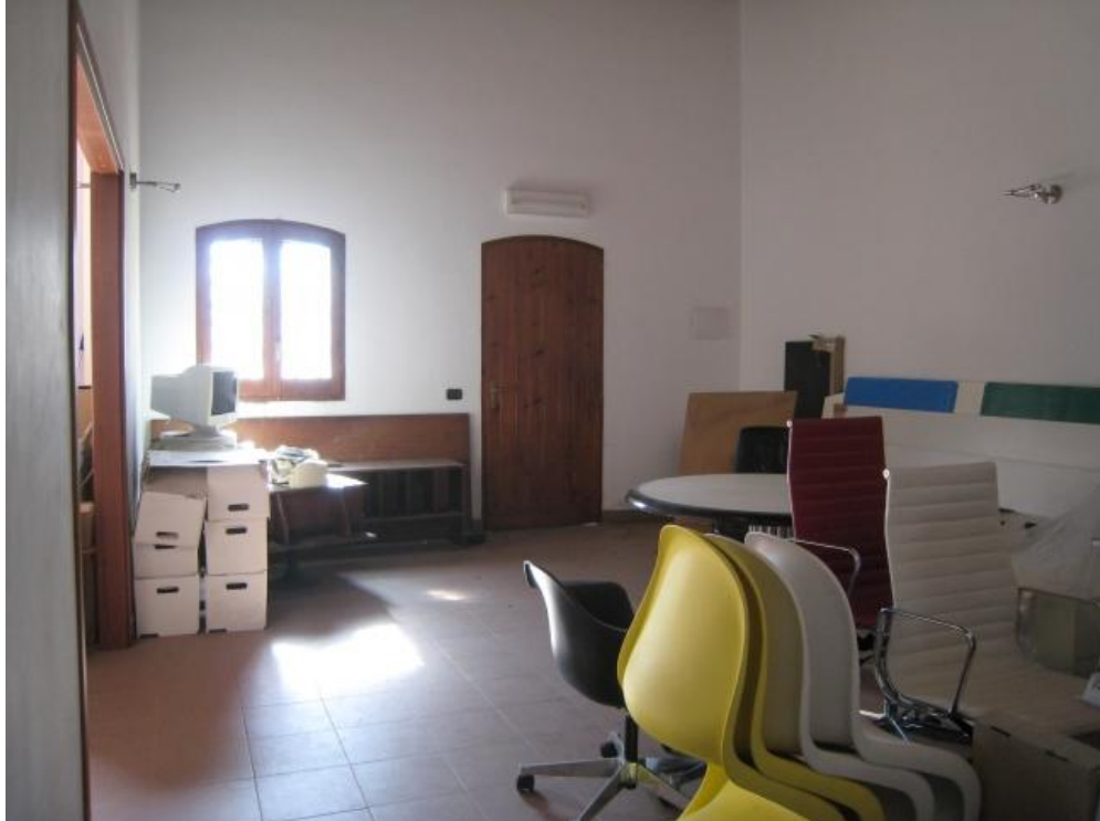
Foto n. 106. Sala riunioni.