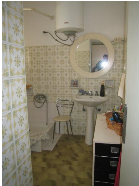
Foto n.48. Altro dettaglio del w.c. doccia.