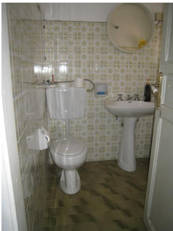
Foto n. 49. Il w.c. con finestra sul terrazzo.