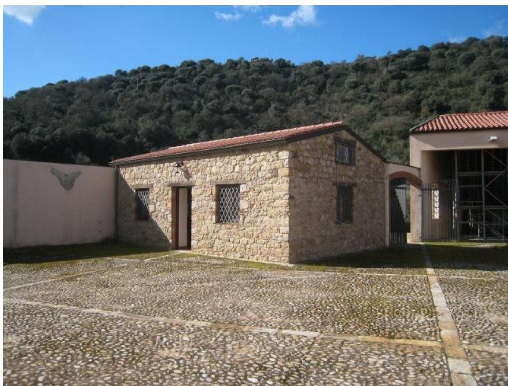
Foto n. 101. Dettaglio del fabbricato adibito ad ufficio.