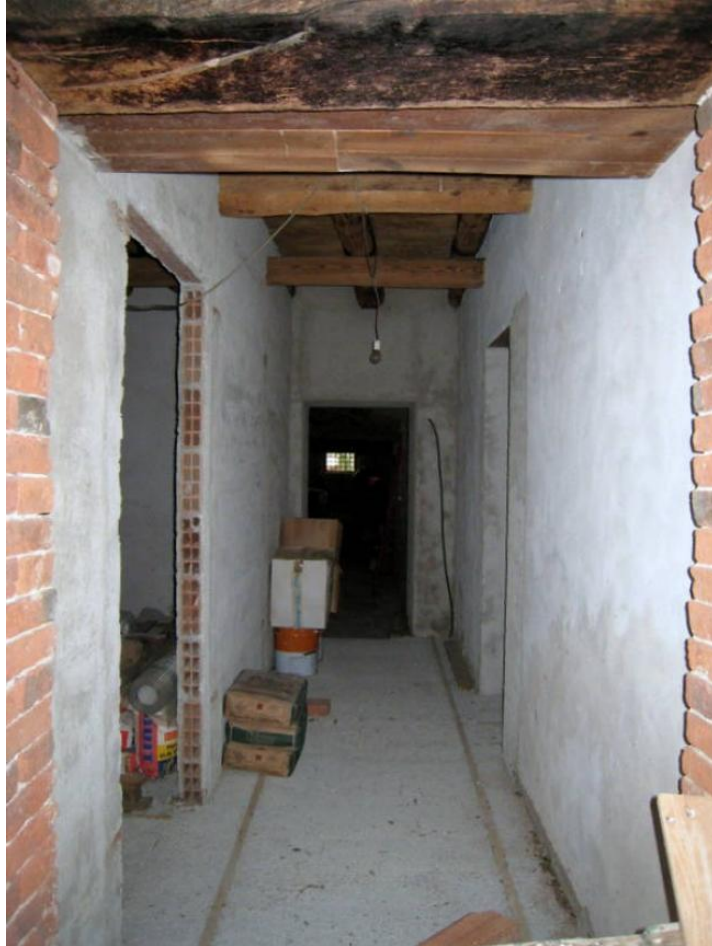
Foto n. 18. Corridoio al P.T. del corpo "B" che conduce anche alla stalla.