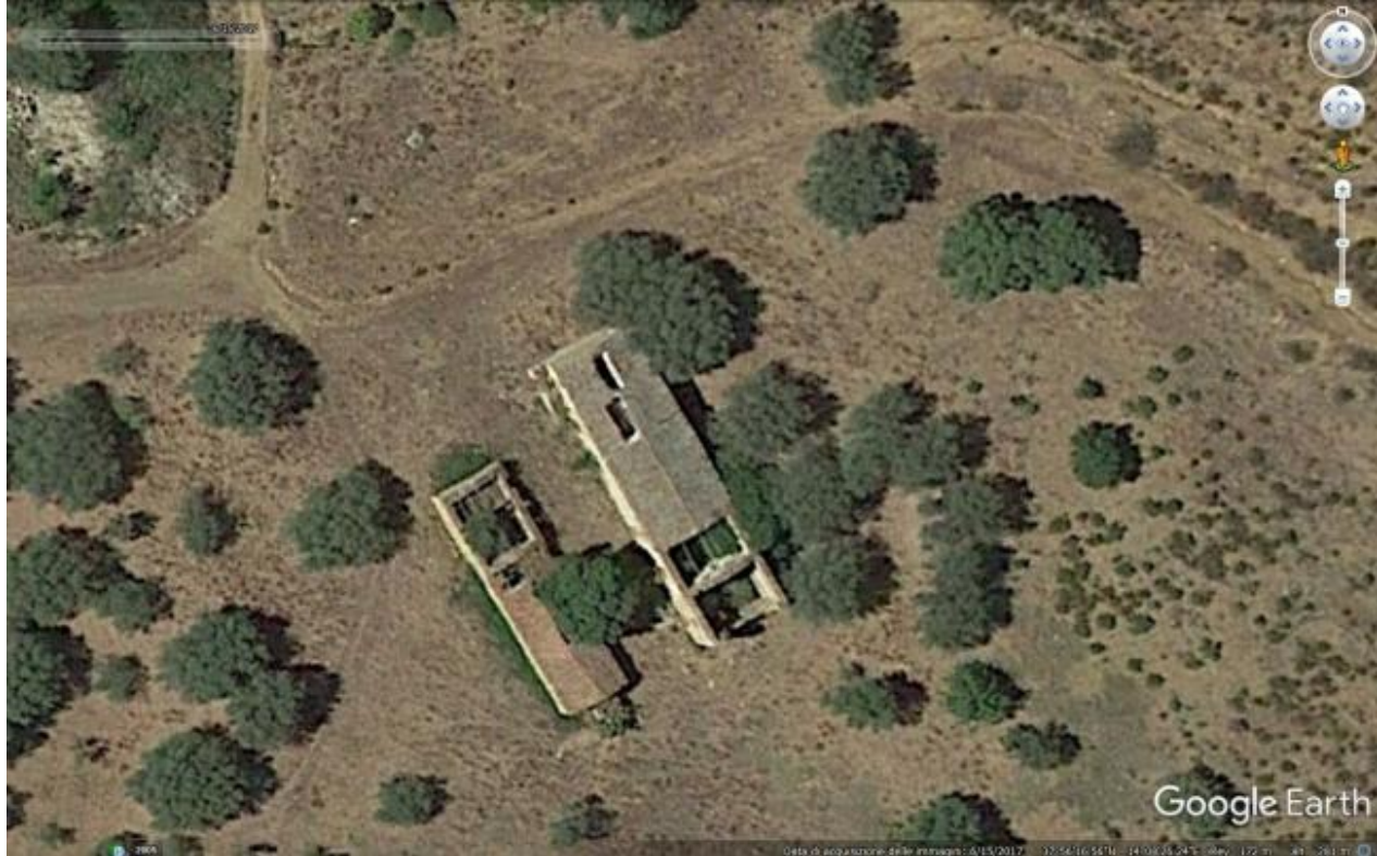
Foto n. 66. Le case Mocciano. Sono evidenti le condizioni dei tetti che sono in parte mancanti.