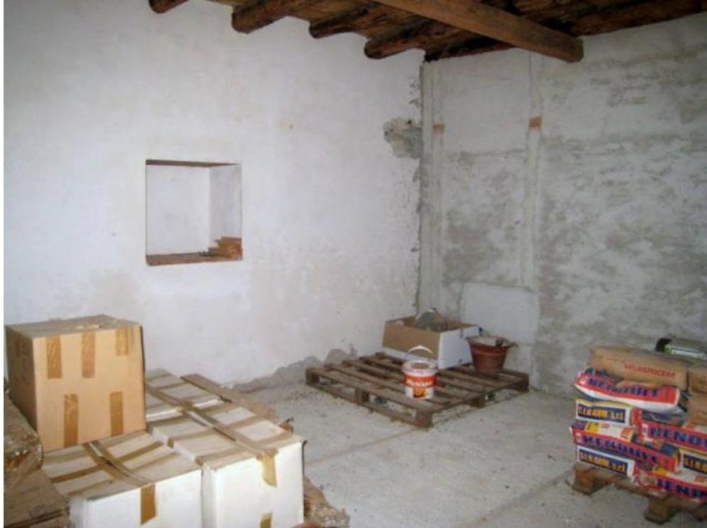
Foto n. 20. Locali in ristrutturazione.