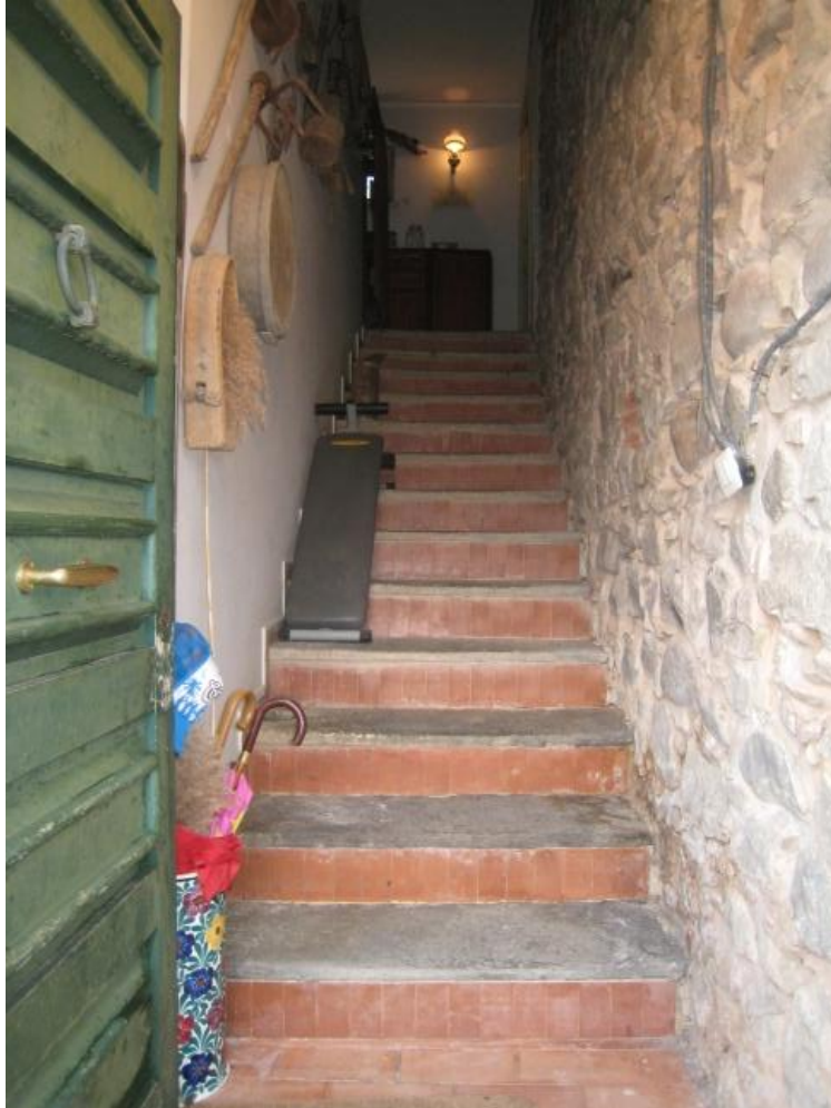
Foto n. 32. La scala di accesso al primo piano.