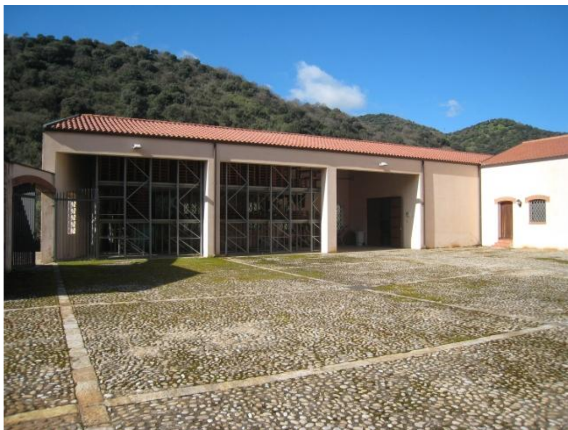
Foto n. 103. Il portico.