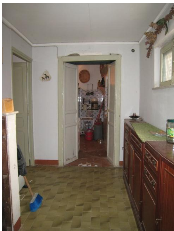
Foto n. 33. Il disimpegno di piano primo. In fondo la cucina.