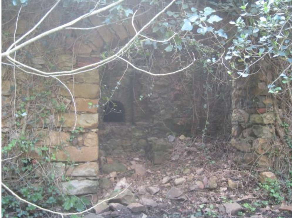
Foto n. 84. Gli interni.