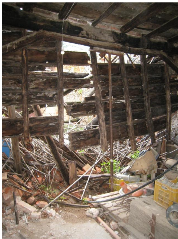
Foto n. 50. Piano terra edificio "B". Unità collabente distinta con il sub 4.