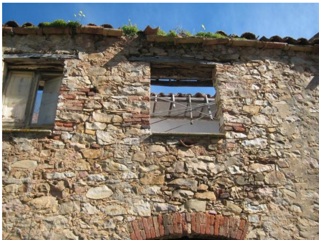
Foto n. 69. Condizioni di muratura ed infissi.