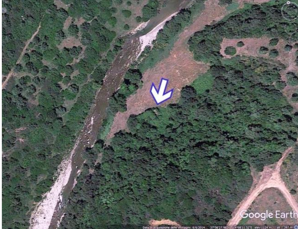
Foto n. 82. La filanda è vicinissima all'alveo del fiume Pollina.