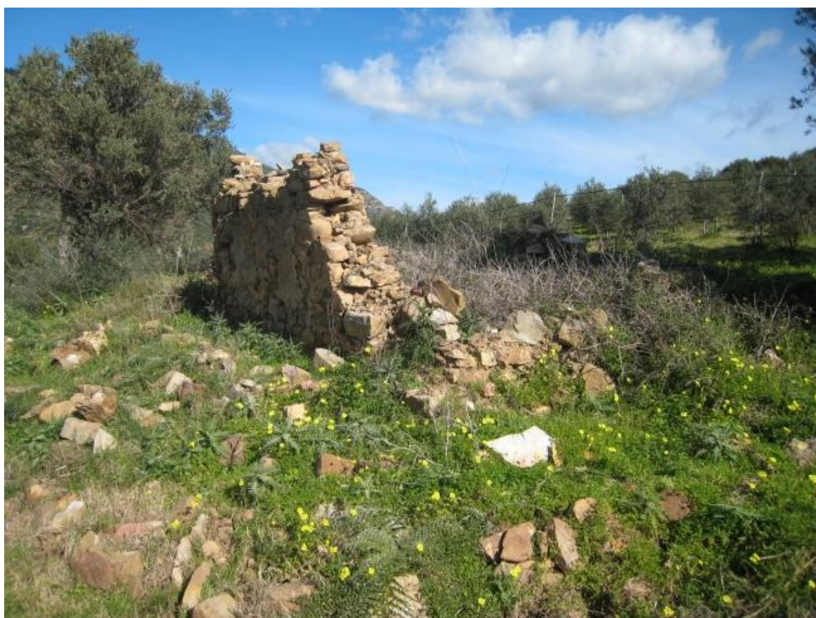
Foto n. 89. Qual che rimane della casa Pagliera.