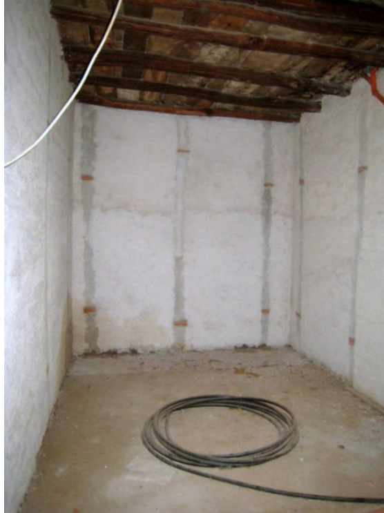
Foto n. 29. Altra piccola stanza del sub 4 (unità collabente) in fase di restauro.