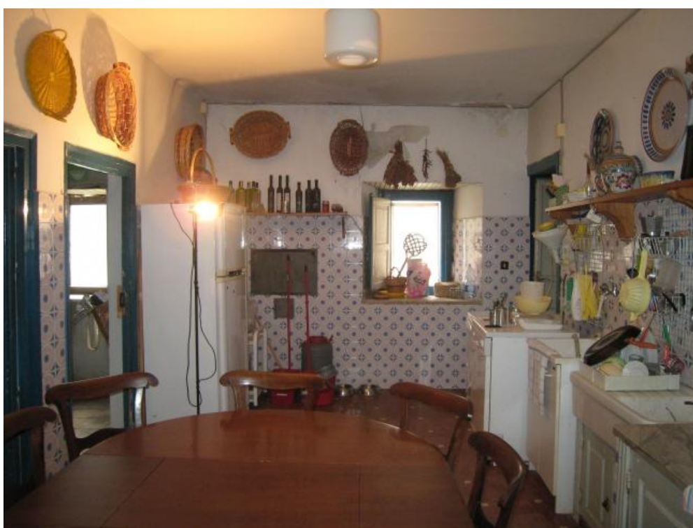
Foto n. 40. Sempre la cucina. Tracce di umidità al soffitto ed impianto elettrico a vista.