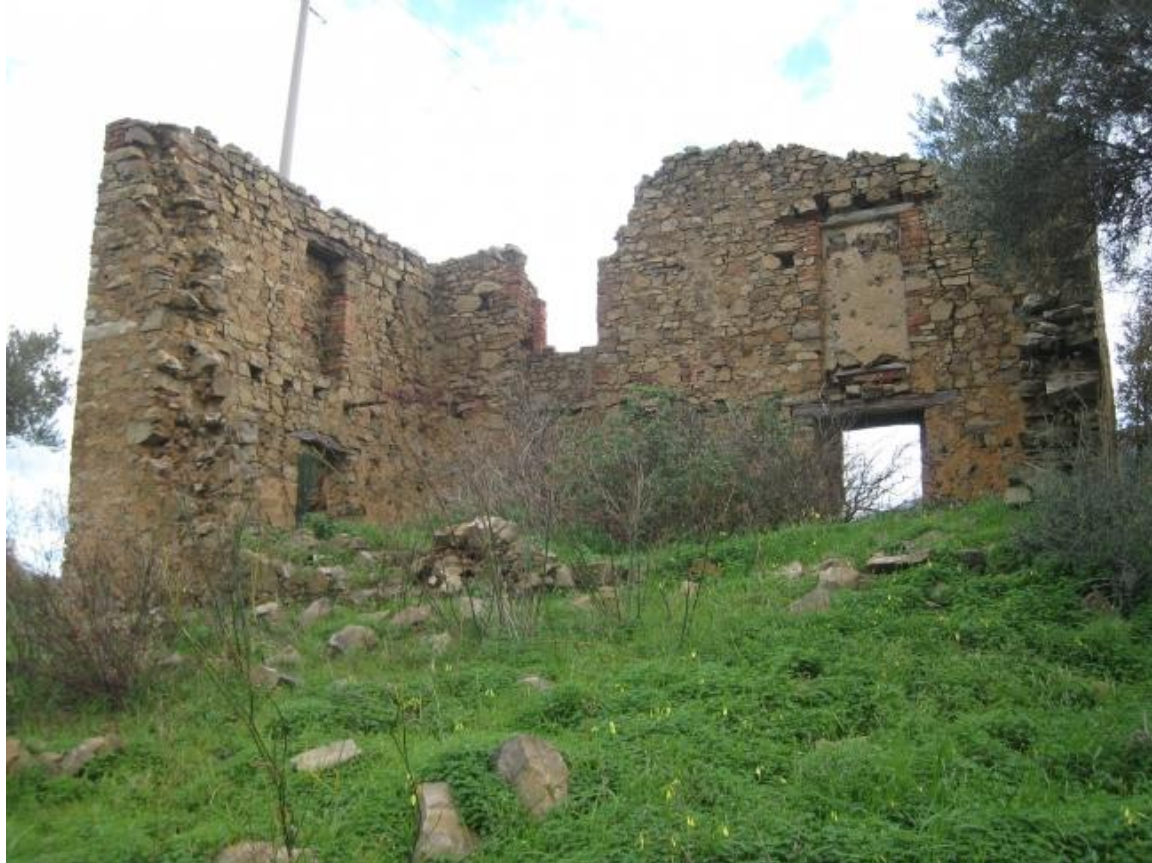
Foto n. 88. Casa Belvedere, p.IIa 50.