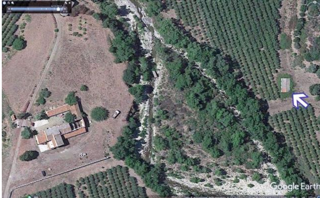
Foto n. 93. Individuazione territoriale del fabbricato in oggetto, casa Palumba.