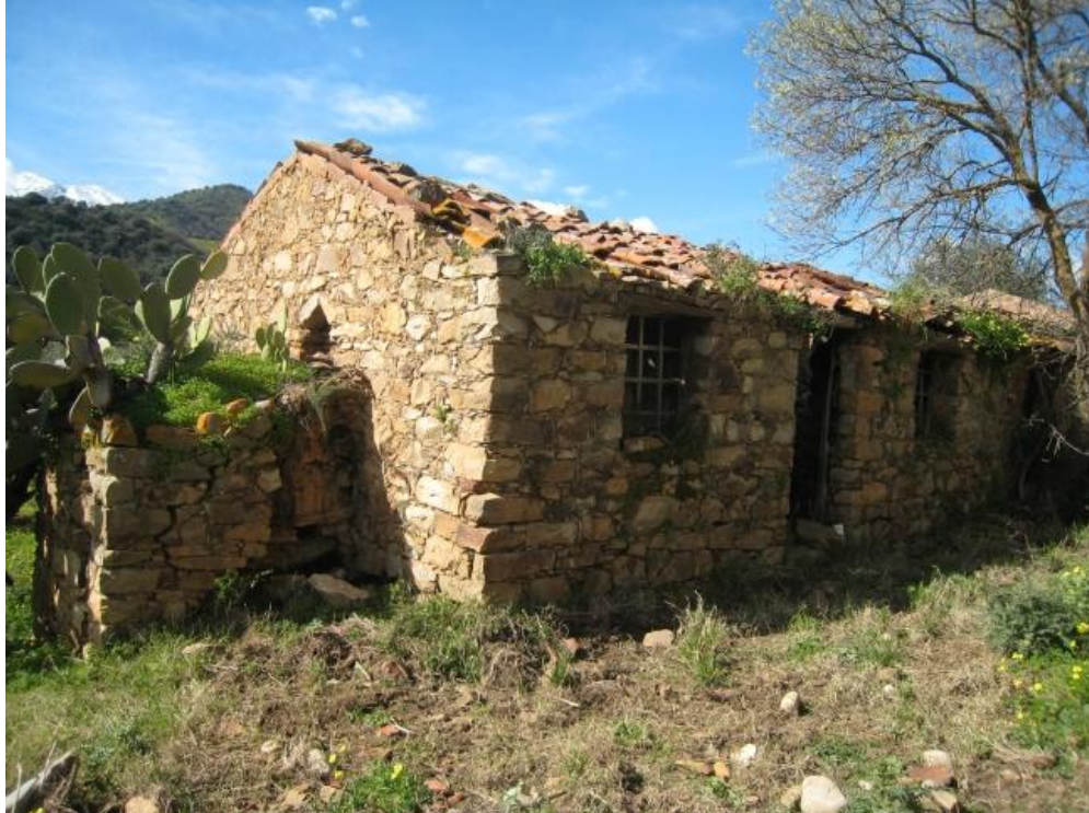
Foto n. 72. Edificio ad un solo piano fuori terra. Le condizioni sono pessime.