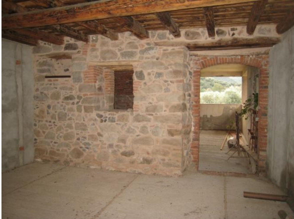
Foto n. 14. Sempre il magazzino, seconda stanza.