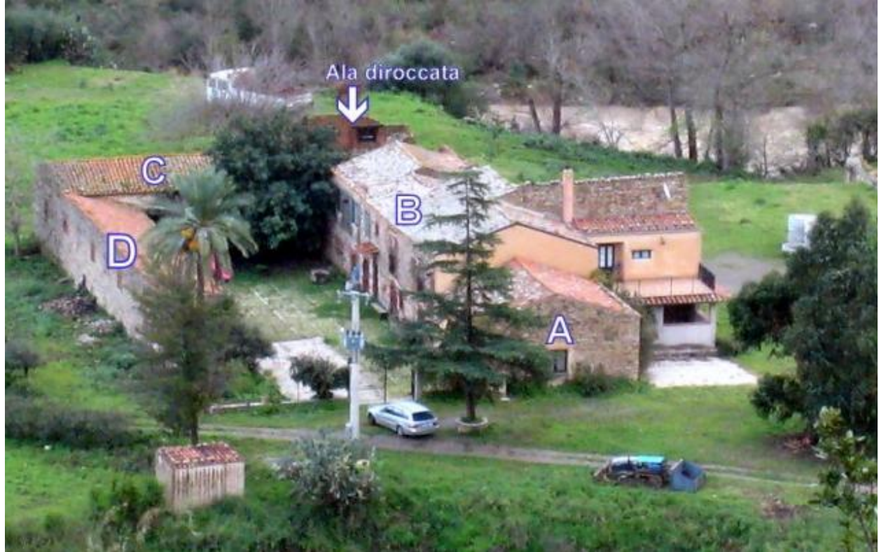
Foto n. 51. Panoramica del Baglio Tornisia.