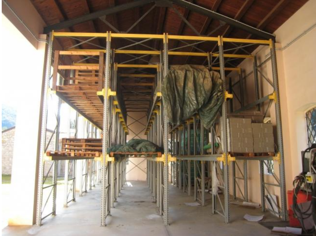
Foto n. 104. L'interno del portico.