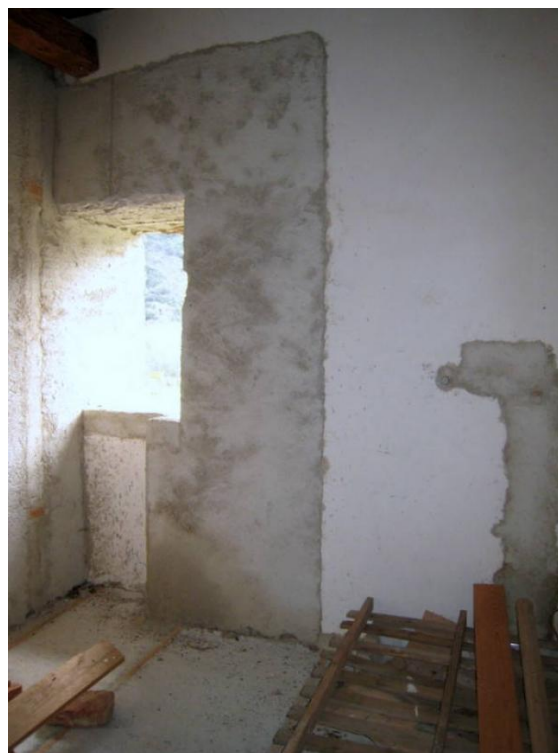
Foto n. 24. L'altro w.c. ancora al grezzo.