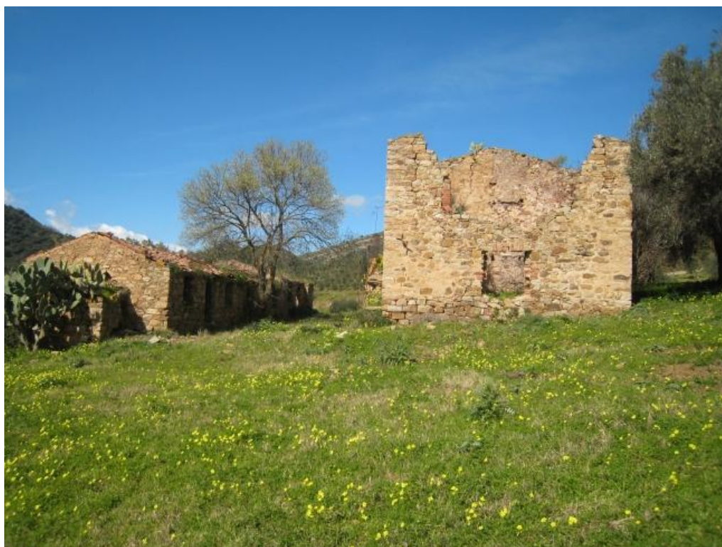
Foto n. 71. Una porzione di edificio a due piani è collassata.