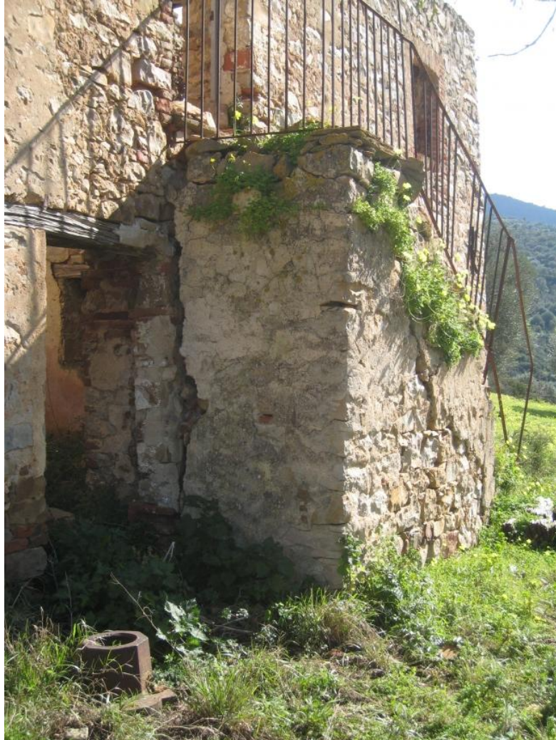
Foto n. 70. Le scale che conducono al 1 piano sono distaccate dalla muratura principale e semidirute.