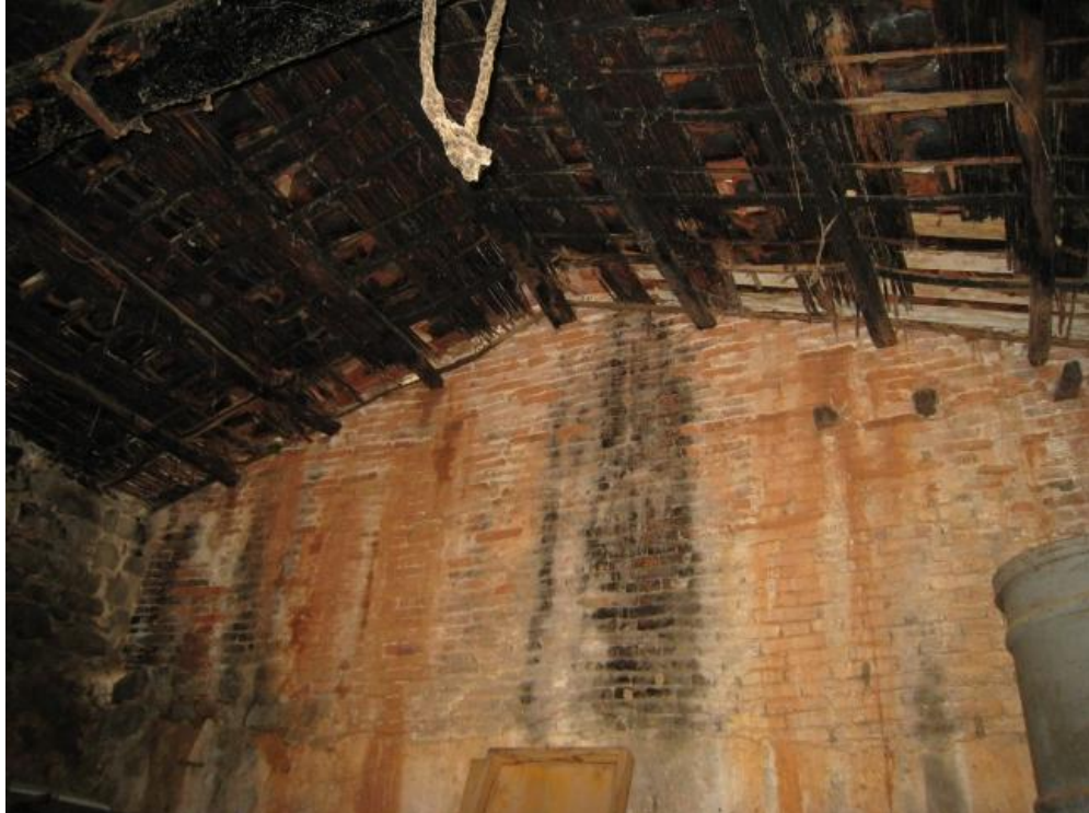
Foto n. 59. Altra immagine di pareti e tetto.