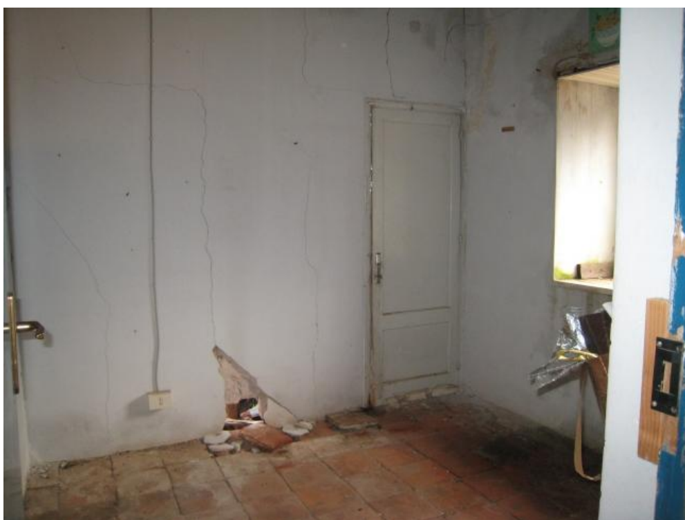
Foto n. 42. Il secondo ripostiglio adiacente la cucina, anch'esso in pessime condizioni.