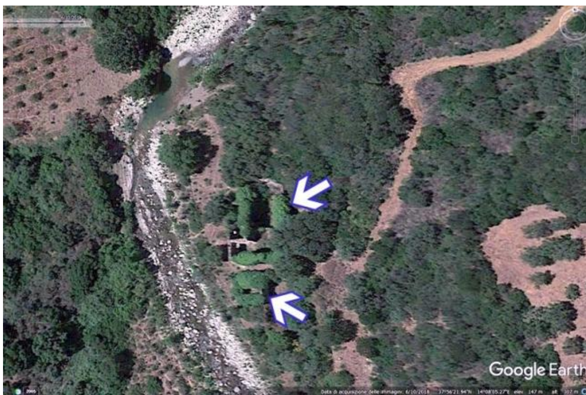
Foto n. 75. Posizione dei due fabbricati e loro consistenza.