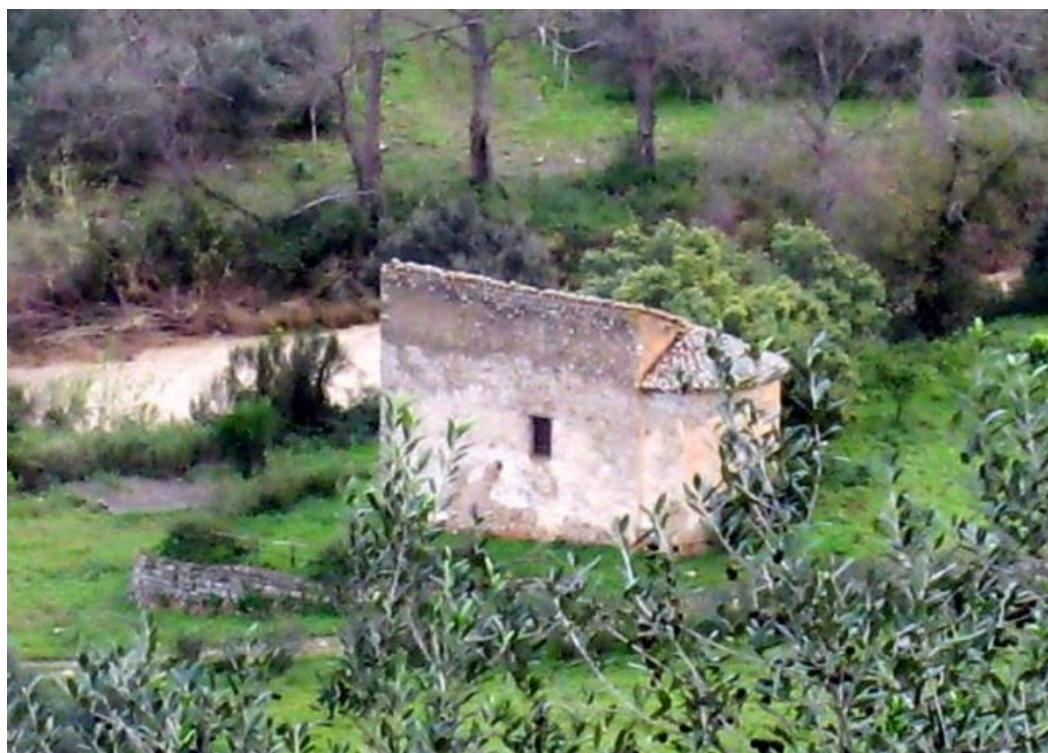
Foto n. 64. Foto dall'alto.