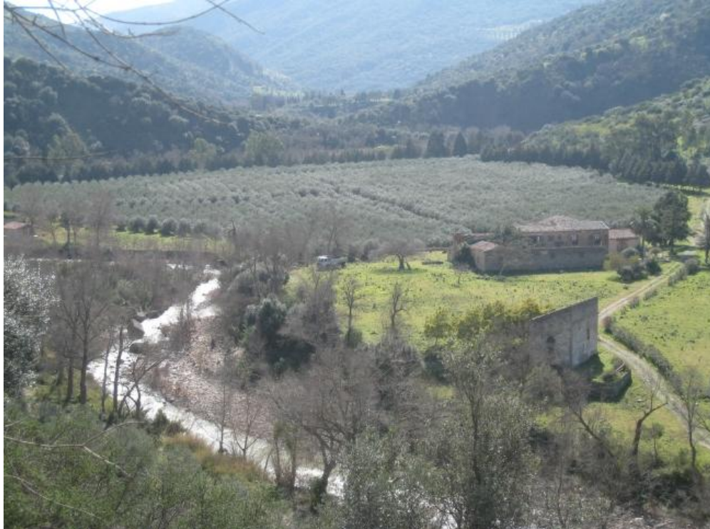
Foto n. 125. La chiesa, il baglio Tornisia e gli uliveti intensivi.