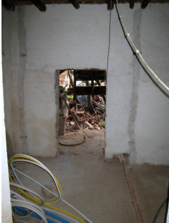
Foto n. 28. Una delle due stanze del sub 4 (unità collabente) in fase di restauro.