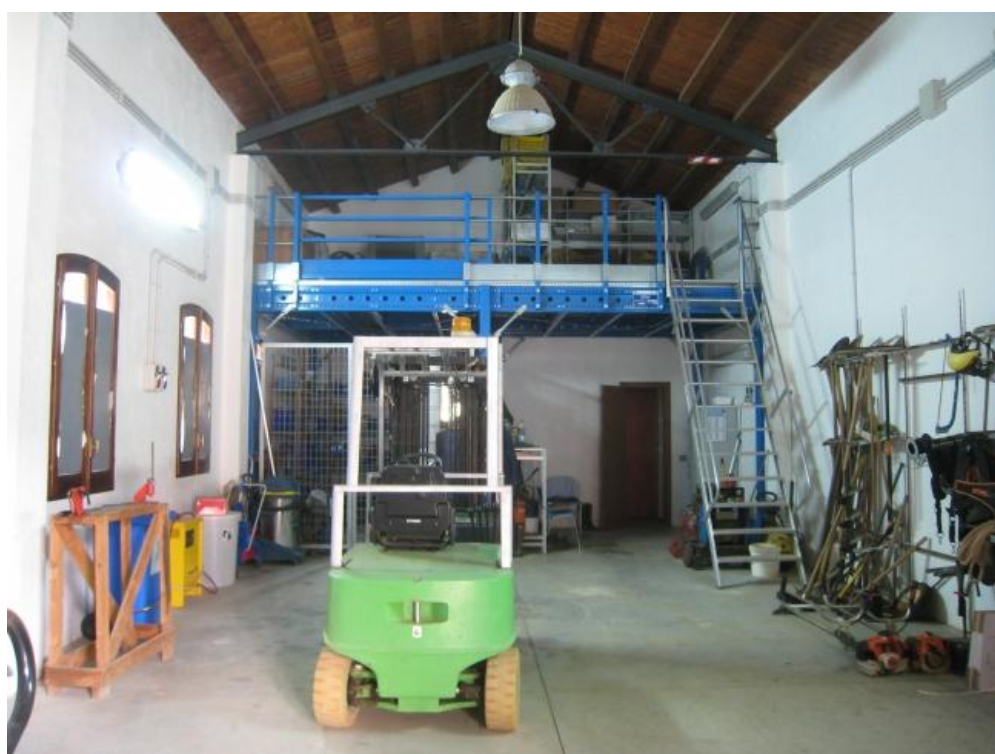
Foto n. 105. L'officina e deposito attrezzi. Il soppalco è del tipo smontabile e reversibile.