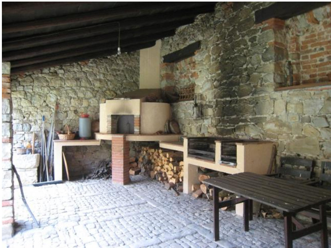
Foto n. 53. L'interno del porticato.