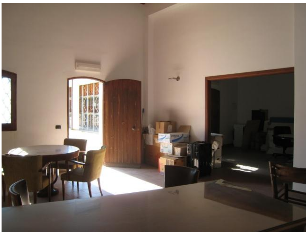
Foto n. 107. Sala conferenze.