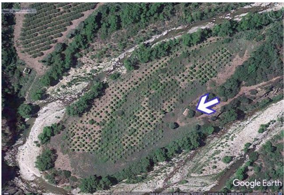
Foto n. 90. La Casa S. Giuseppuzzo tra gli argini del Fiume Pollina.