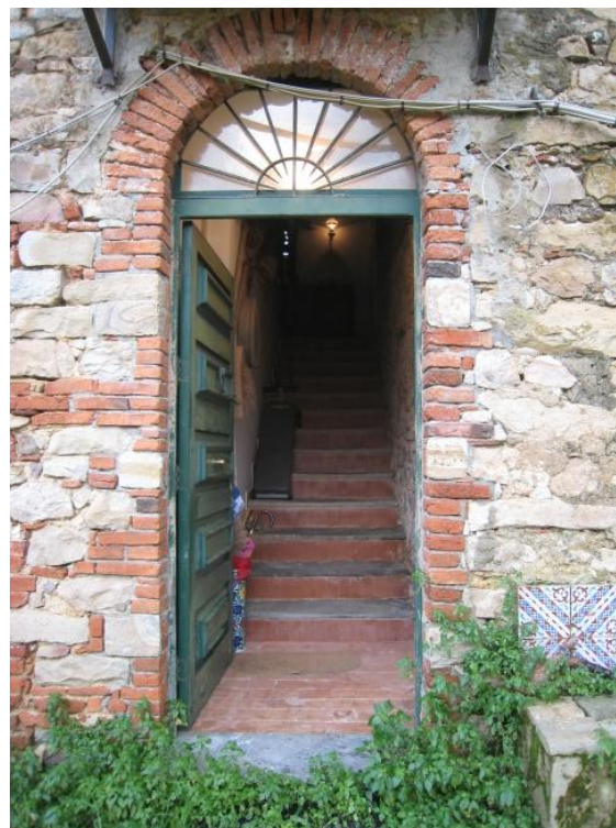
Foto n. 31. Il portone di ingresso all'unità di piano primo, corpo "B".