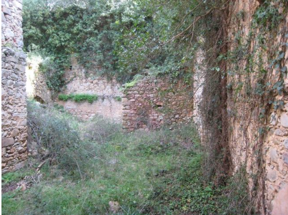
Foto n. 79. Gli interni