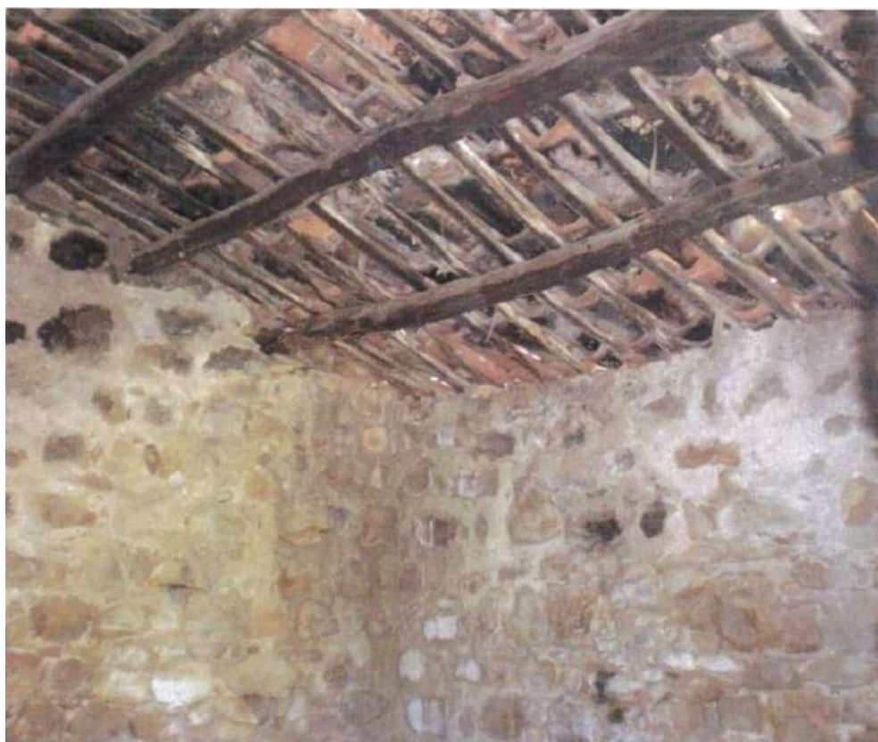
Foto n. 92. L'interno.