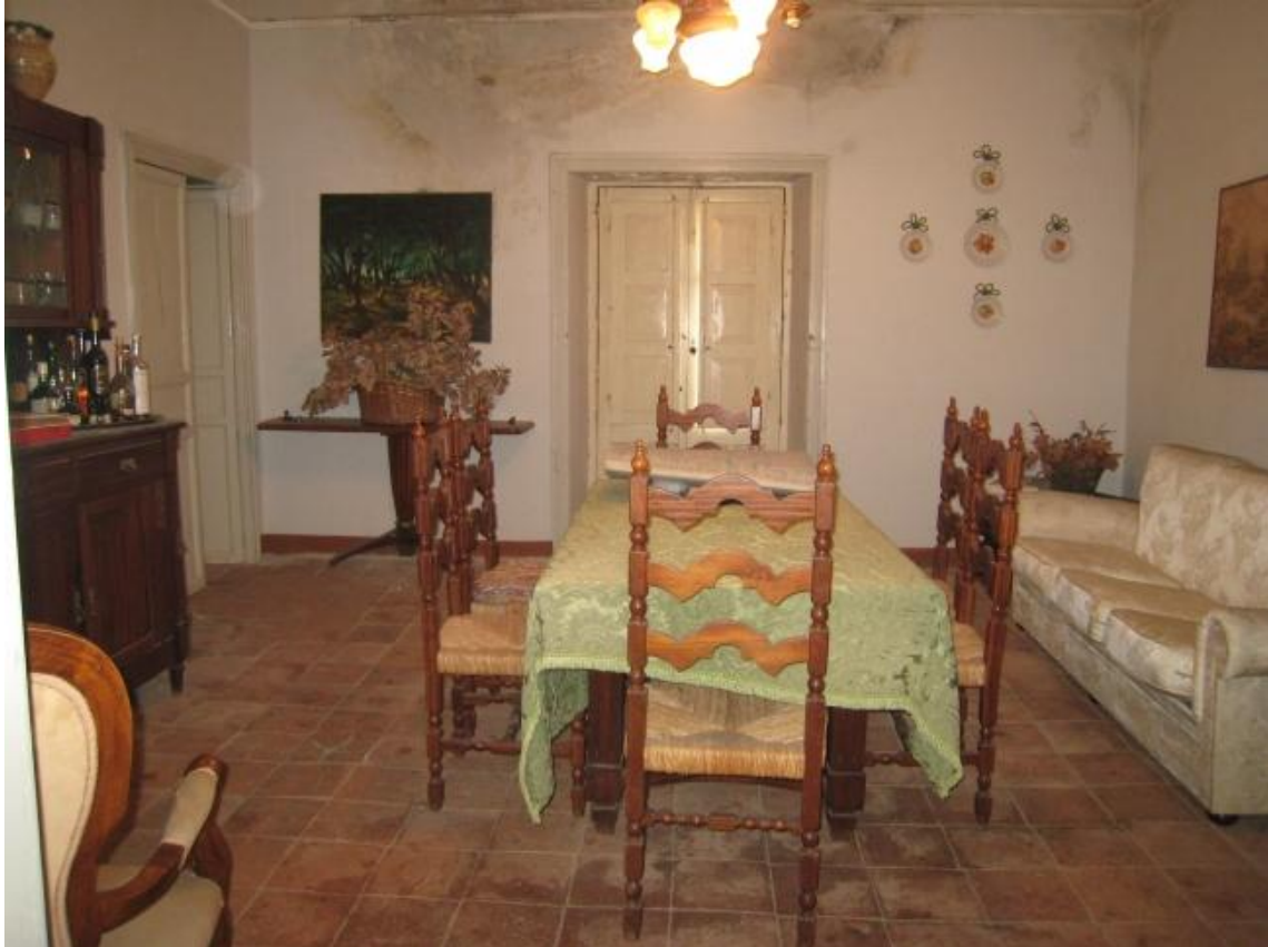
Foto n. 35. La sala da pranzo. Evidenti macchie di umidità sulla parete frontale.