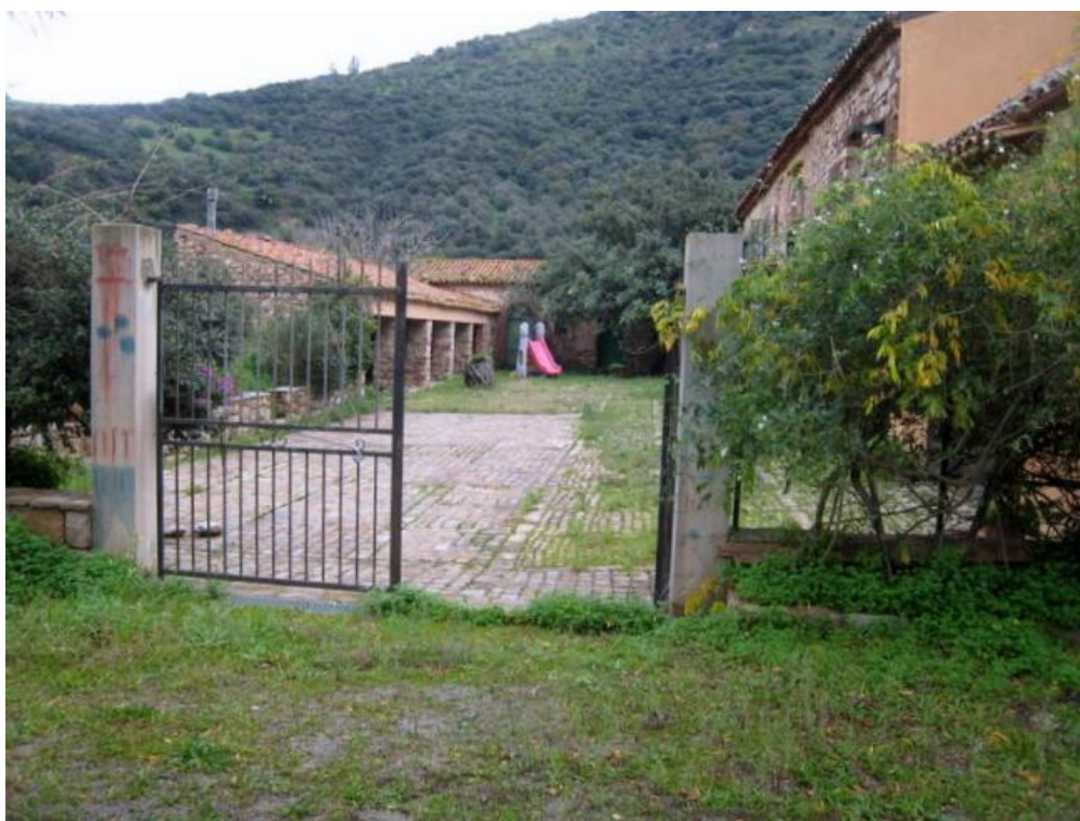
Foto n. 7. Il cancello di ingresso al baglio.