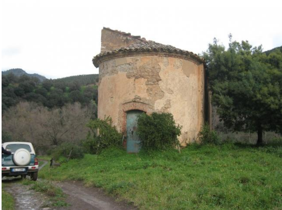
Foto n. 63. Abside.