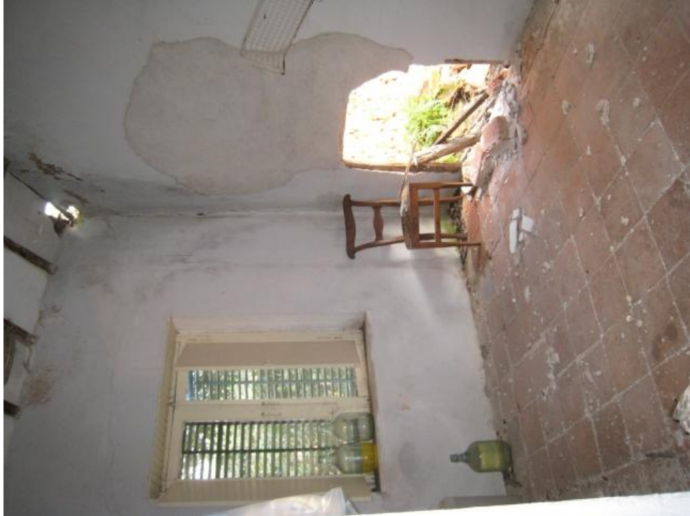
Foto n. 41. Una delle stanza dietro la cucina, a confinare con il sub 7 (unità collabente).