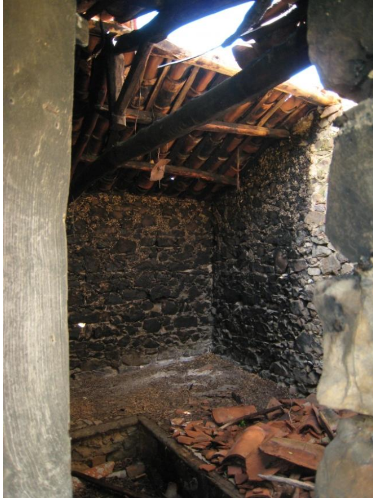
Foto n. 74. Interni del fabbricato ad un solo piano.