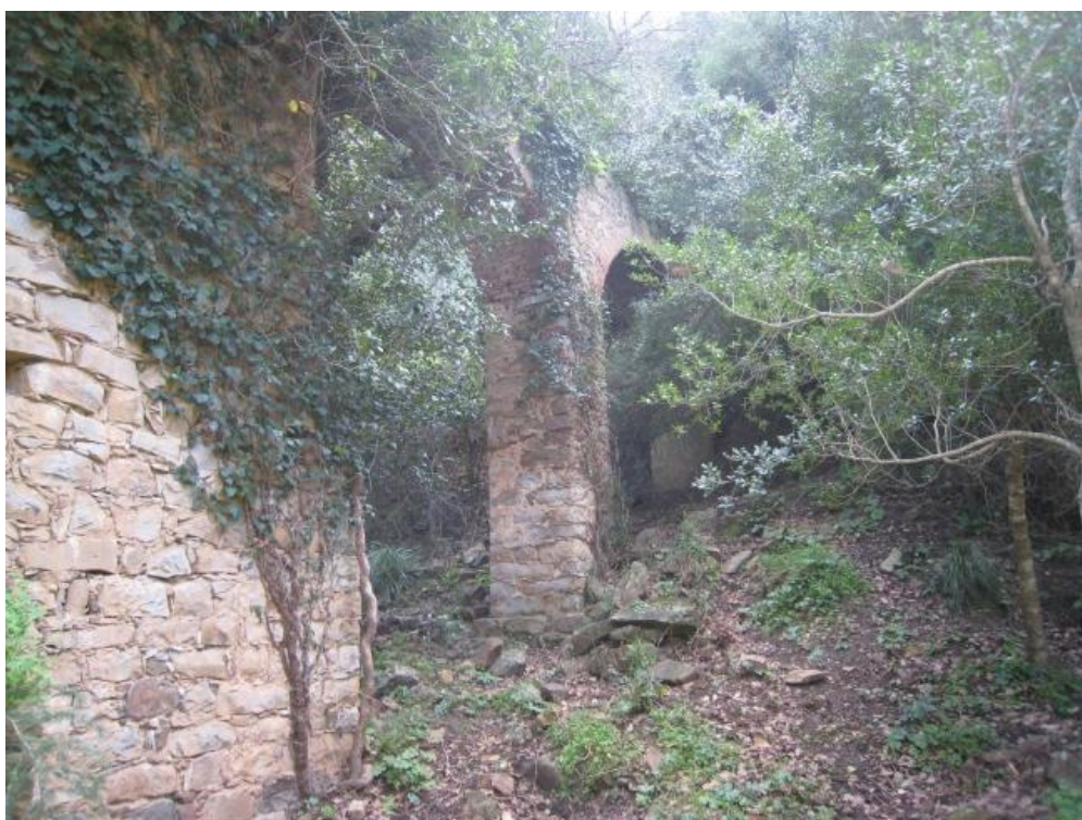
Foto n. 85. Le arcate che sorreggevano la condotta idrica.

Casa Belvedere o Piano della Casa e Casa Pagliera