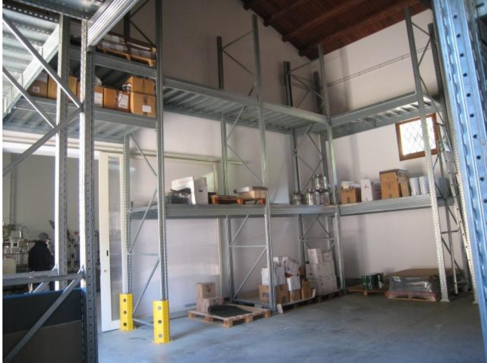
Foto n. 118. Deposito confezioni.