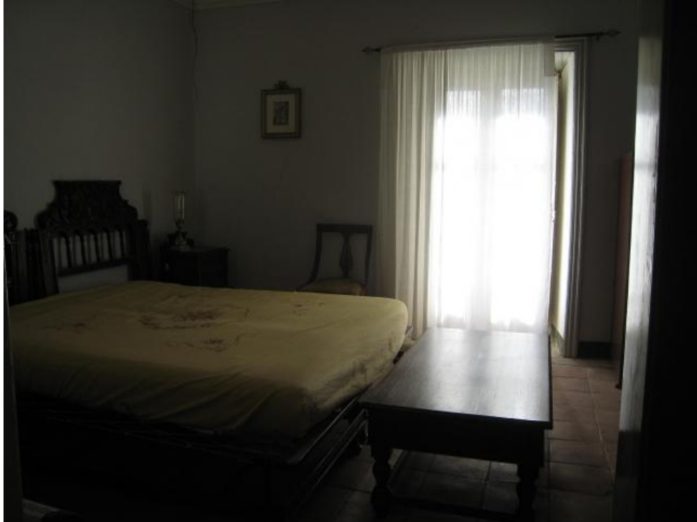
Foto n. 45. La camera da letto con balcone e bagno in camera.