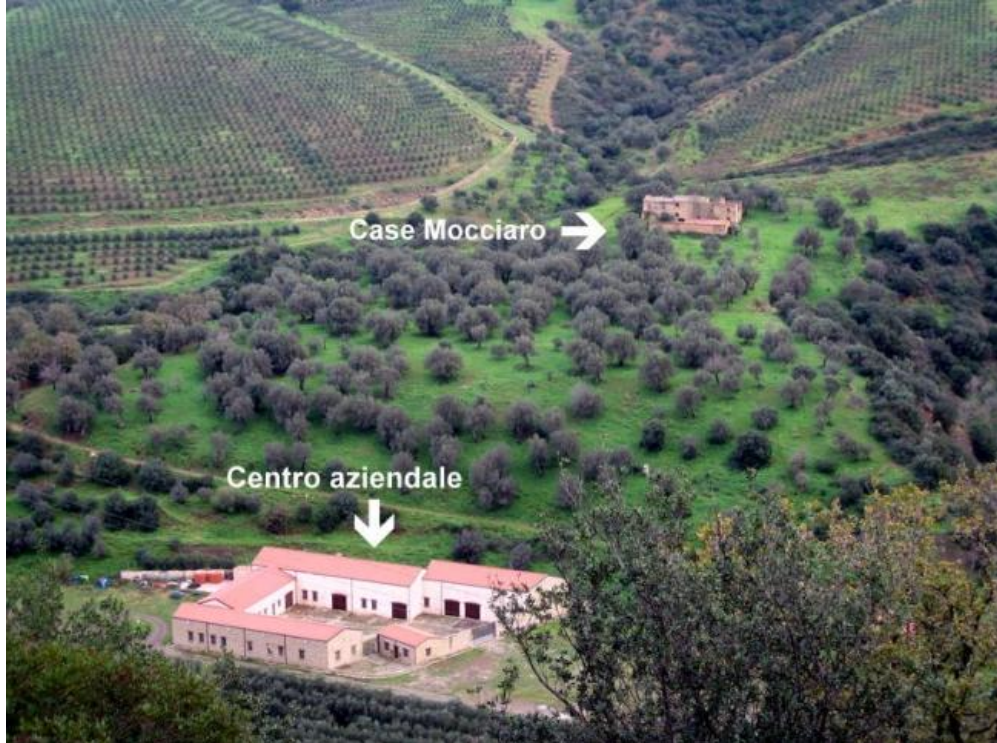
Foto n. 96. Il centro aziendale e le Case Mocciaro.