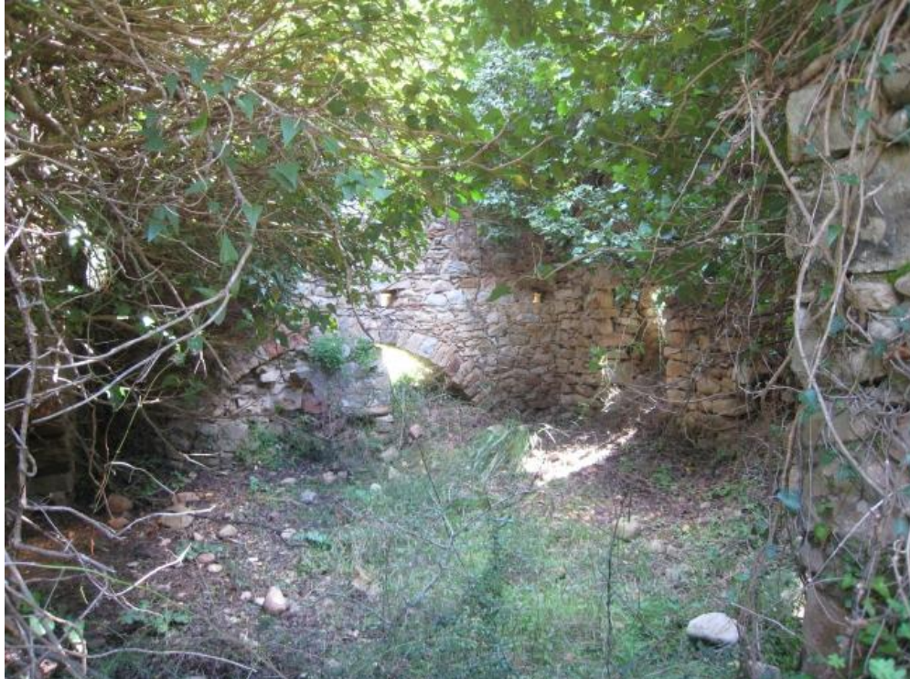
Foto n. 81. L'interno del fabbricato più piccolo.