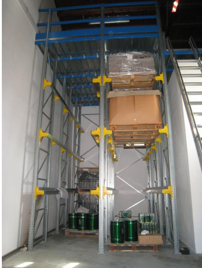
Foto n. 120. Il magazzino.