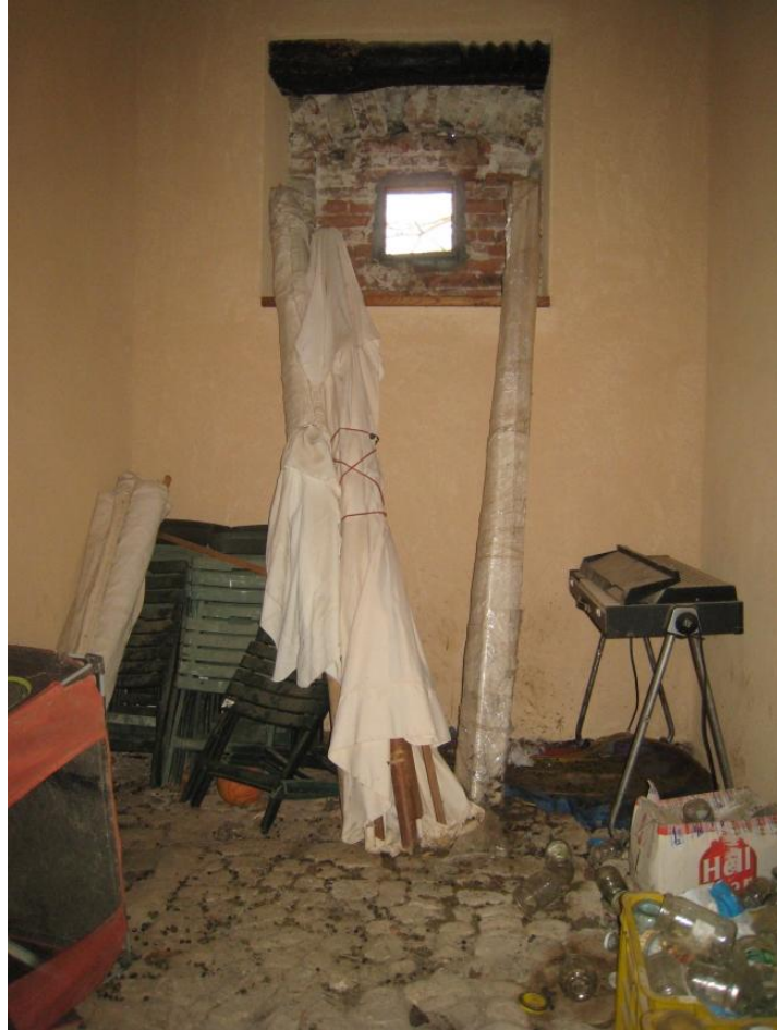
Foto n. 54. Magazzino accanto al porticato.