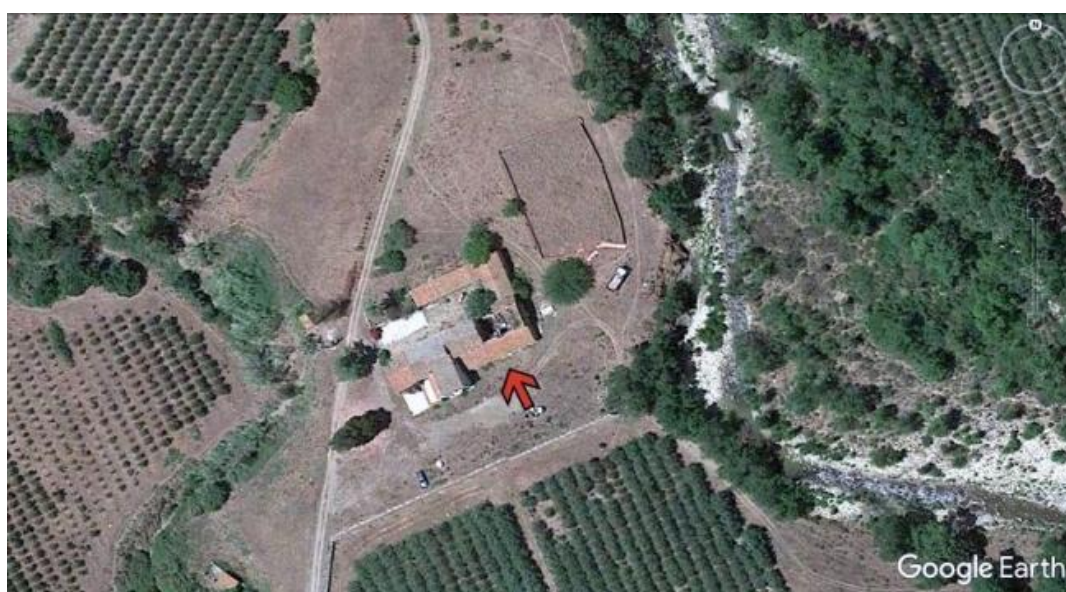
Foto n. 3. Ingrandimento del fabbricato oggetto di esecuzione.