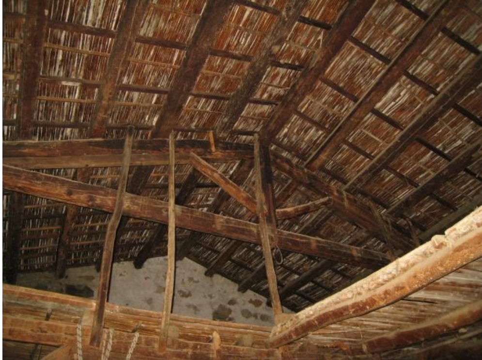
Foto n. 56. La tipologia di copertura dei magazzini del corpo "C".