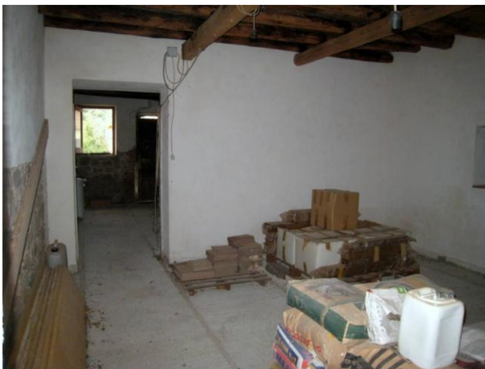
Foto n. 19. Locali al P.T. del corpo "B" in fase di ristrutturazione interna.