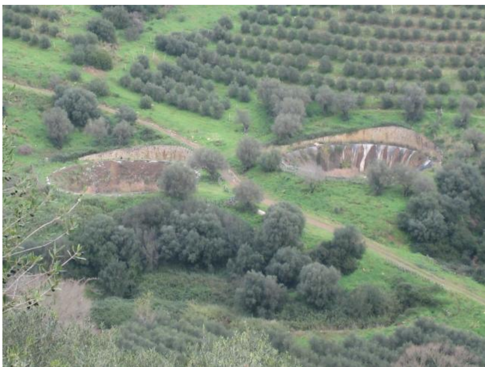
Foto n. 128. I due bacini idrici circolari.