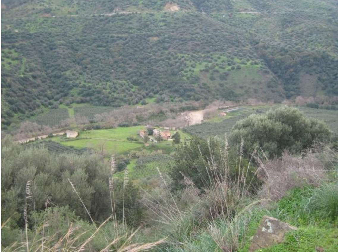
Foto n. 131. Il baglio Tornisia con i terreni coltivati.