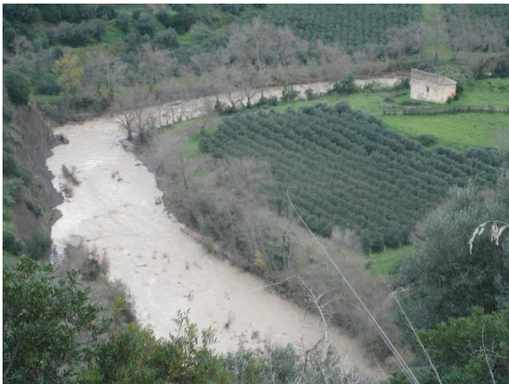
Foto n. 130. La chiesa, l'uliveto intensivo, il fiume Pollina.