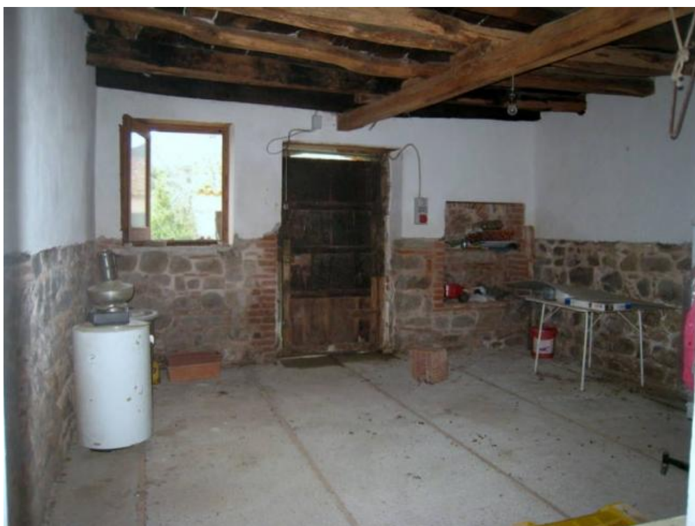
Foto n. 21. Altra stanza in fase di recupero.