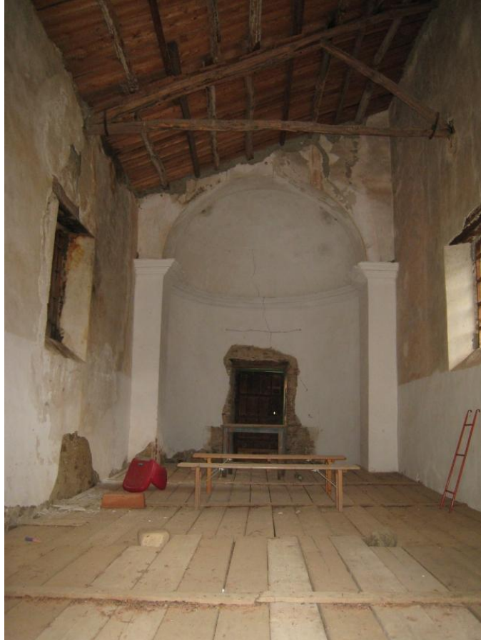
Foto n. 65. Interno.