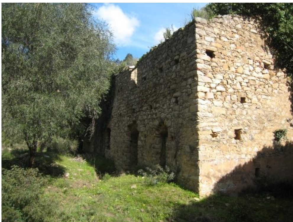
Foto n. 76. Il fabbricato più grande.