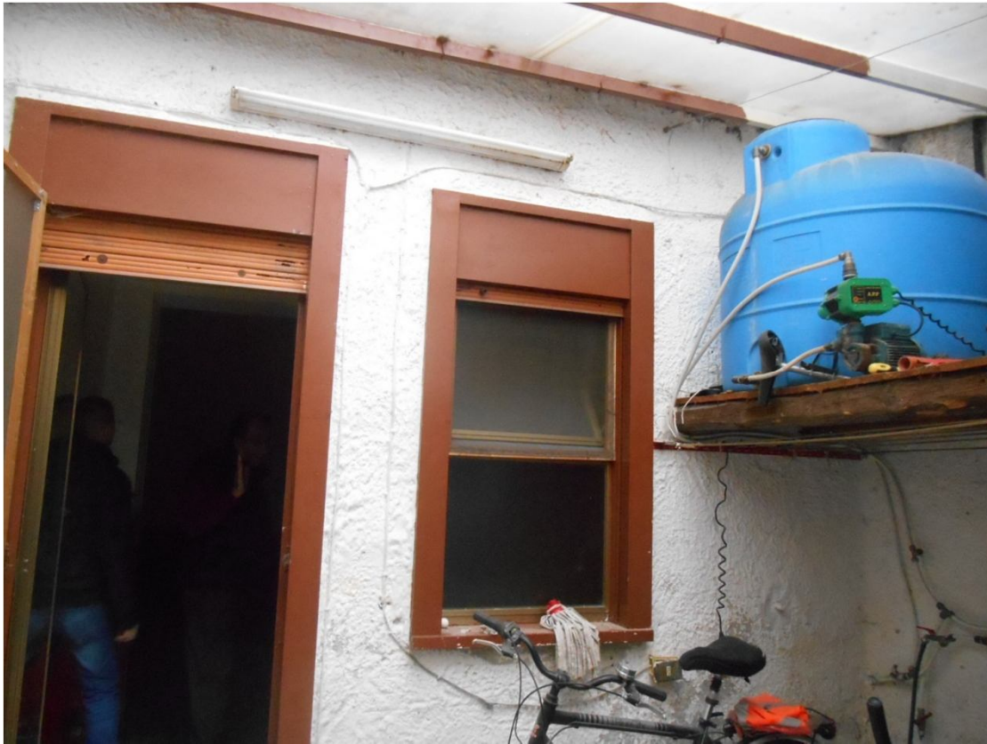
FOTO 18 – Porta finestra di collegamento dal disimpegno e finestra del wc