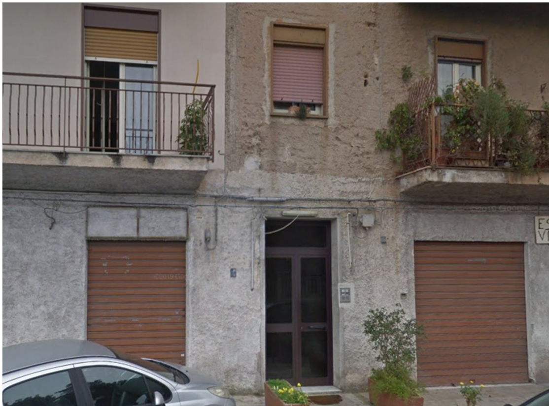
FOTO 3 – Corpo di fabbrica via Perpignano 310 portone di ingresso