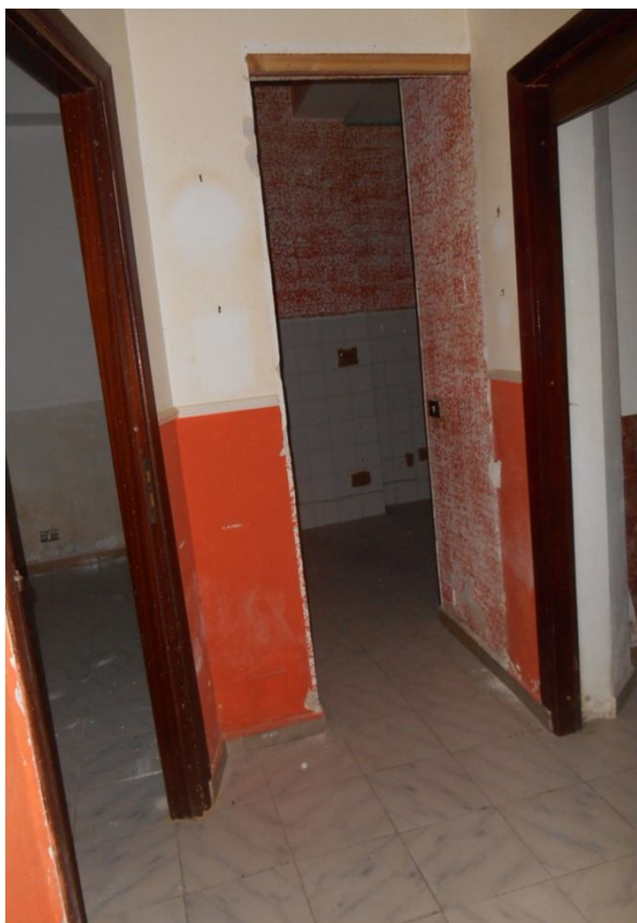
FOTO 9 - Disimpegno