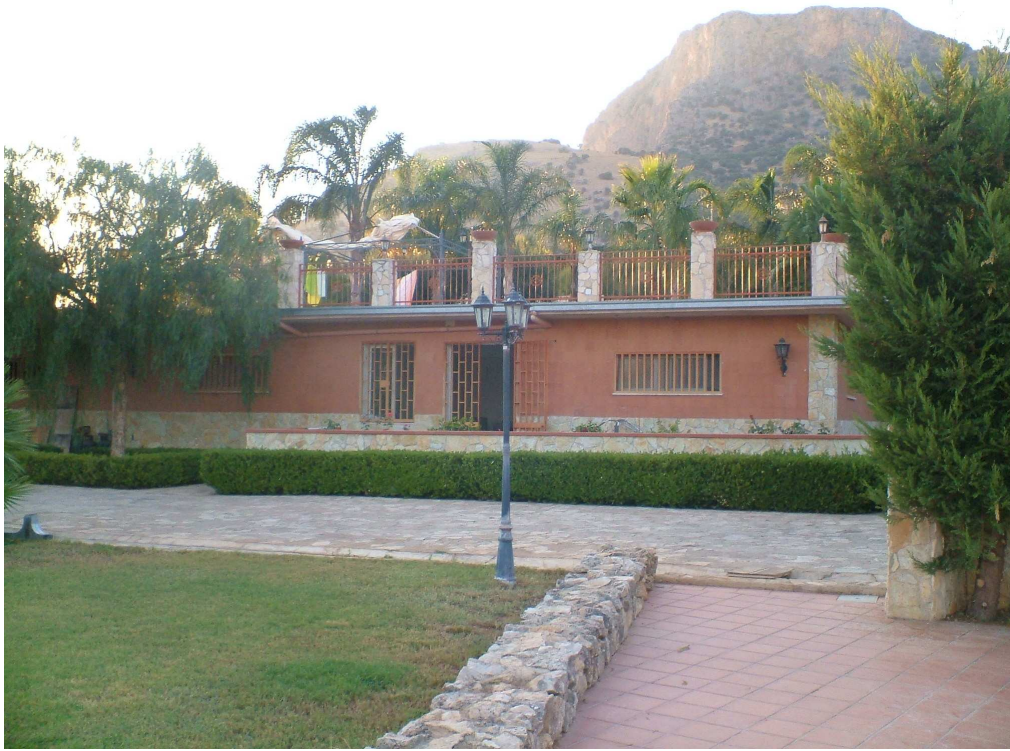
Prospetto anteriore del laboratorio