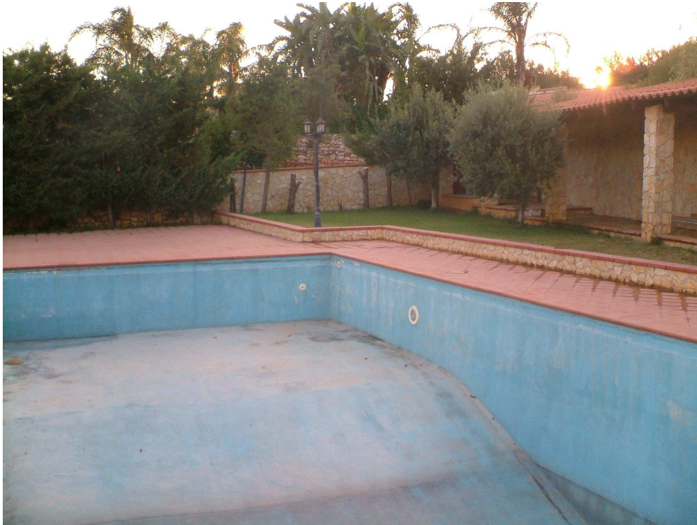
Seconda piscina insistente sulla p.lla 112