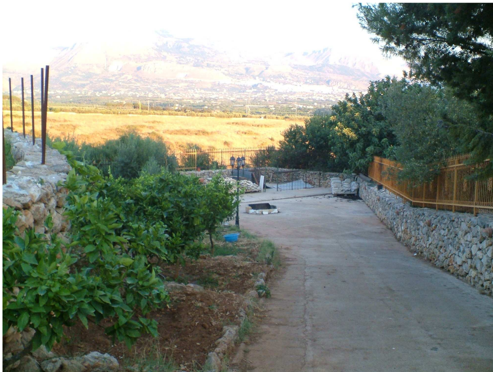
Strabella al confine del lotto