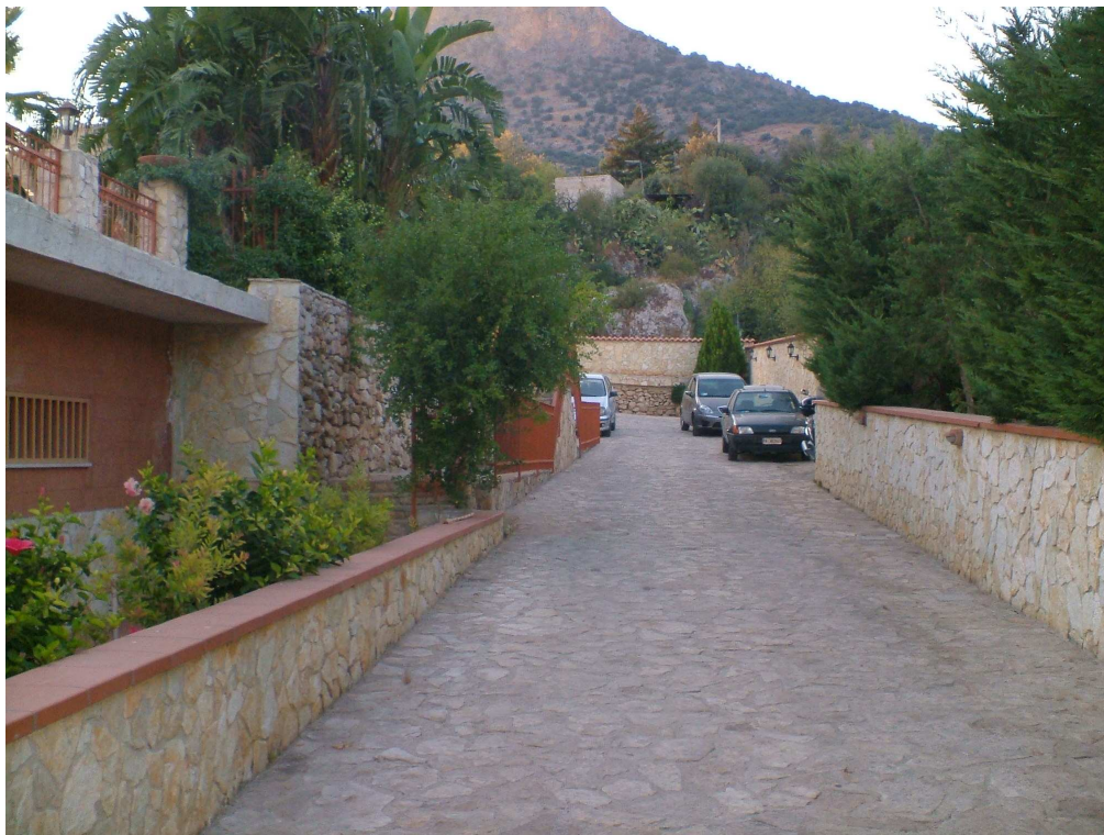
Area carrabile di accesso