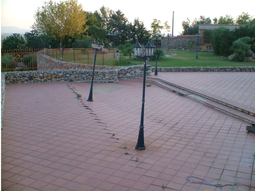
Spiazzale pavimentato in cotto con l'evidente cedimento del pavimento