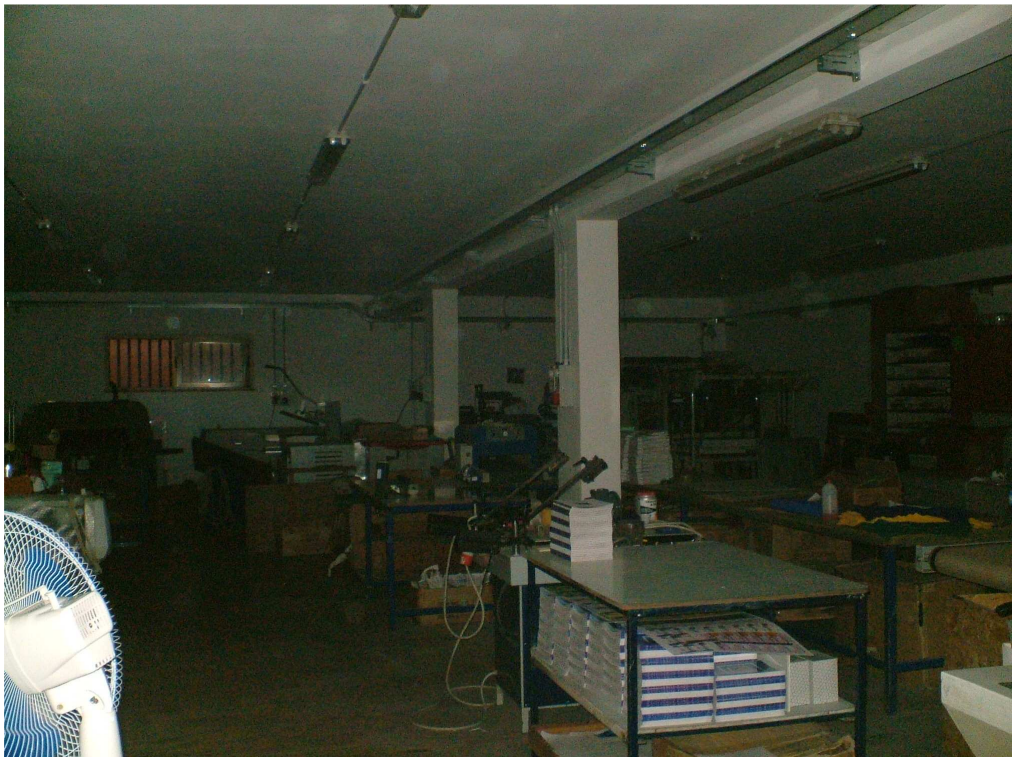
Interno del laboratorio