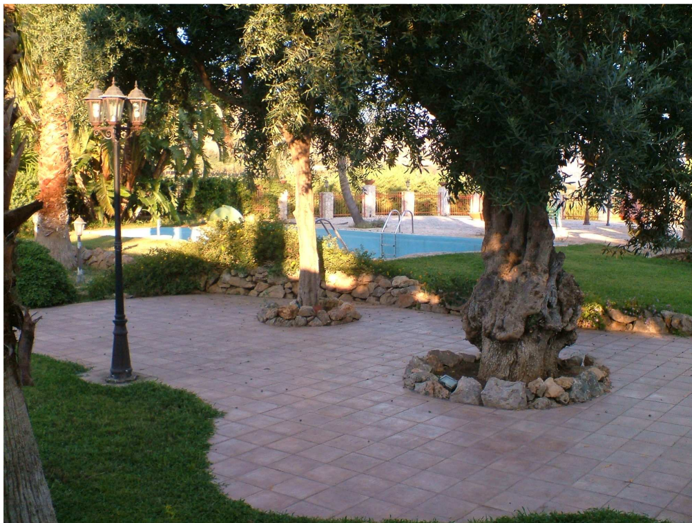
Area a verde