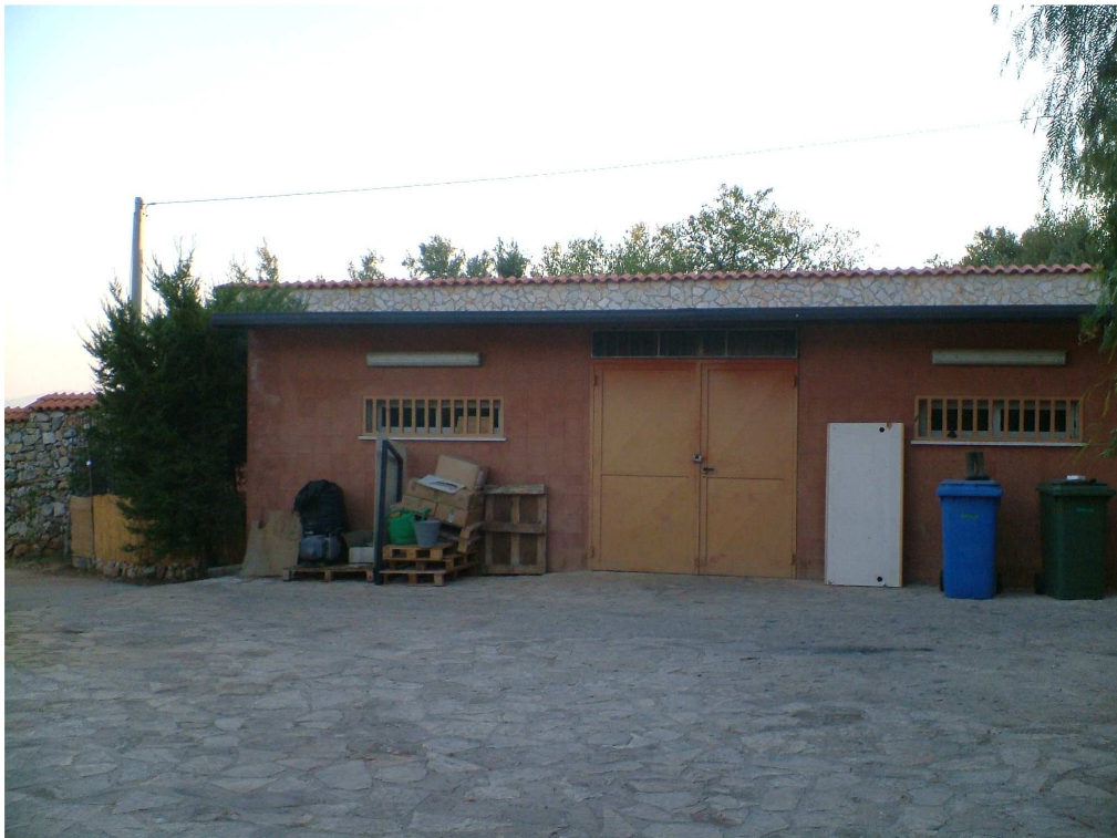
Prospetto del corpo accessorio adiacente al laboratorio