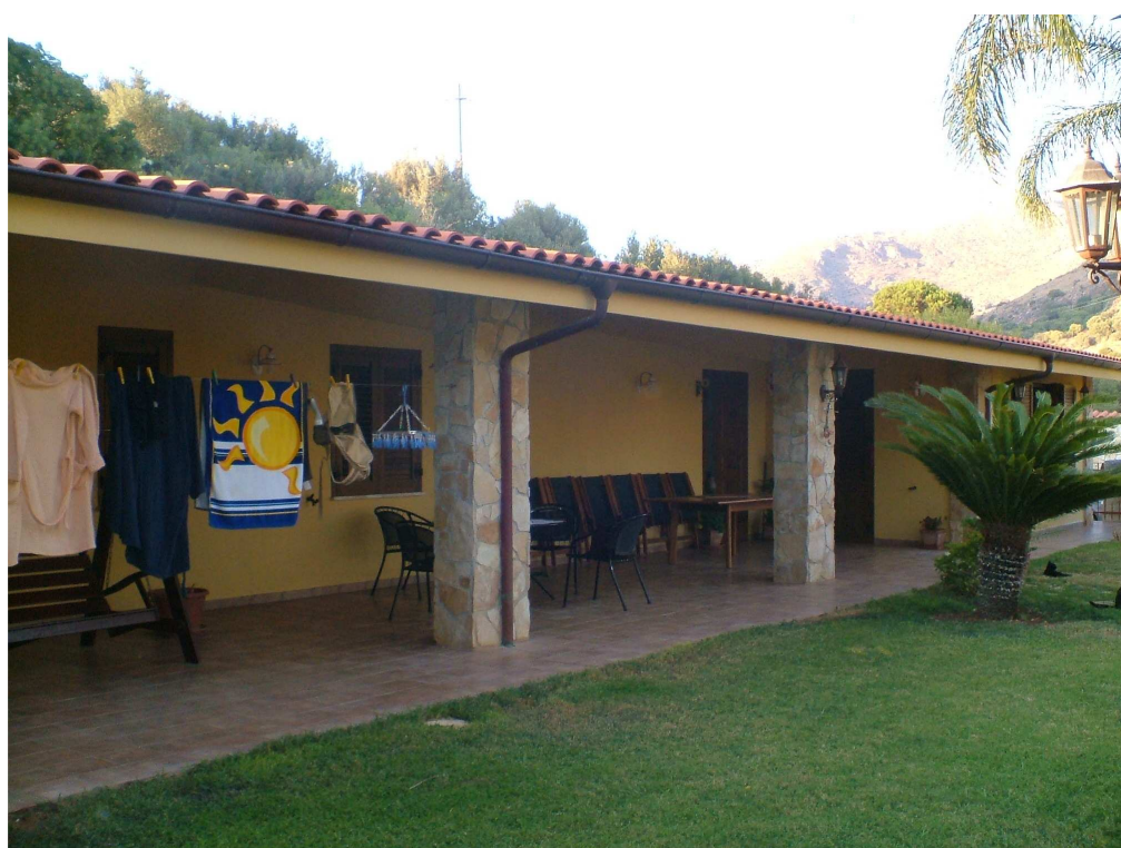
Prospetto principale dell'abitazione e a destra ingresso