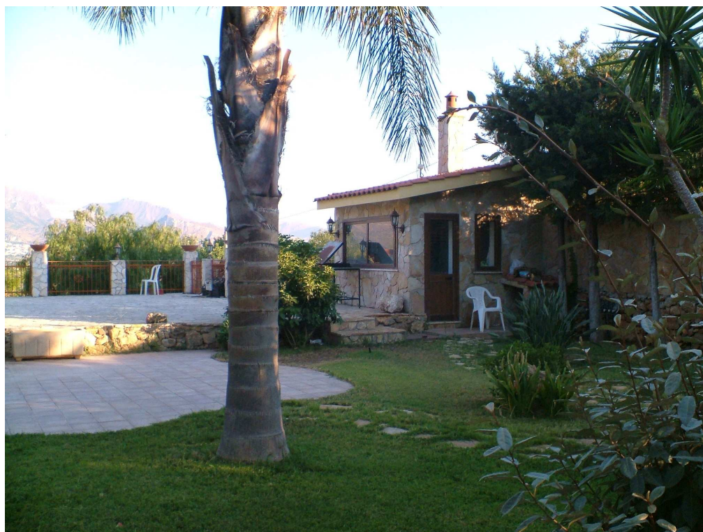
Giardino antistante l'abitazione