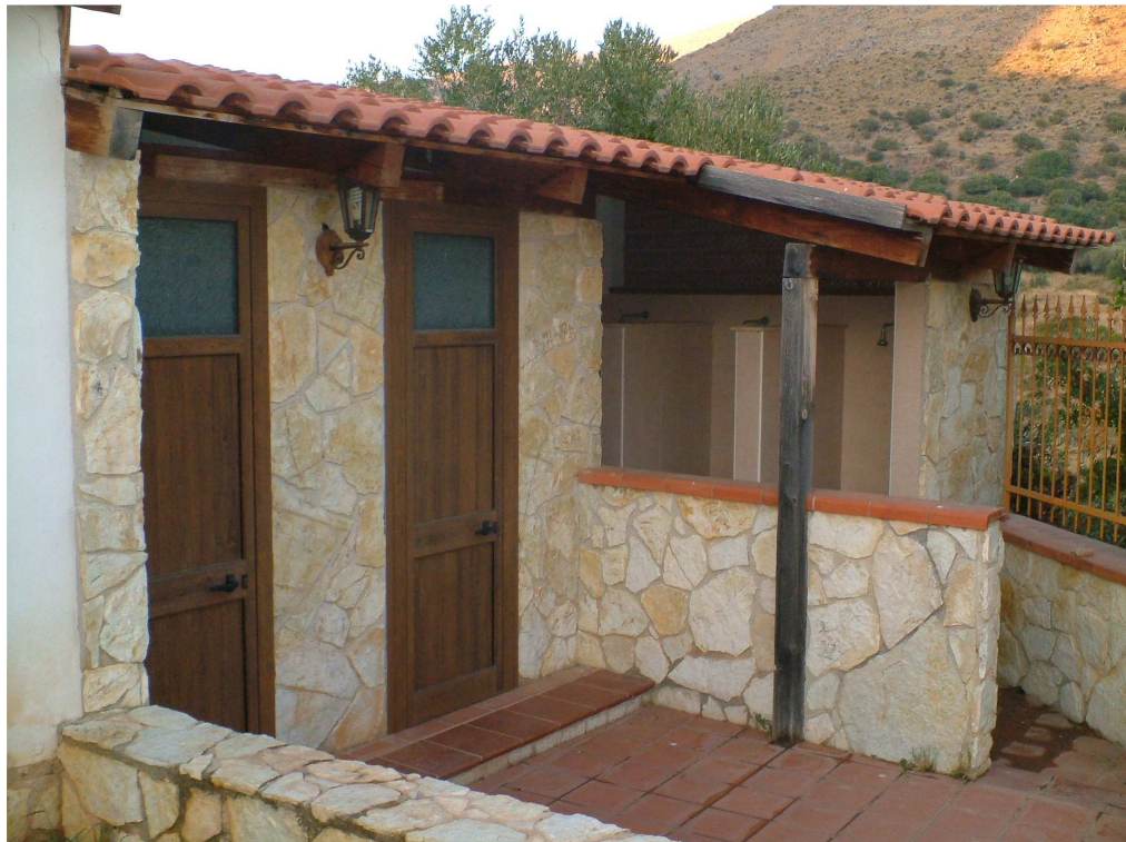
Corpo basso accessorio adibito a wc e docce