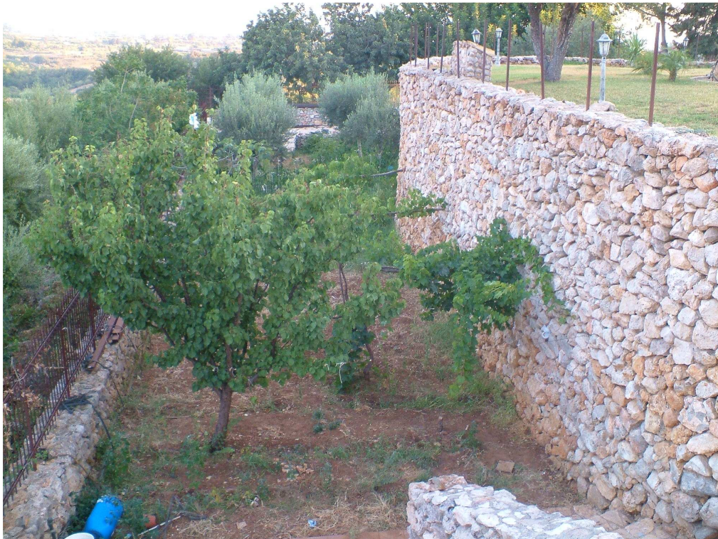
Confine a valle del lotto