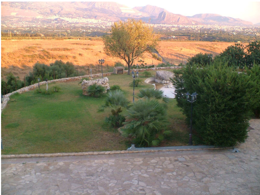
Area a verde antistante il laboratorio