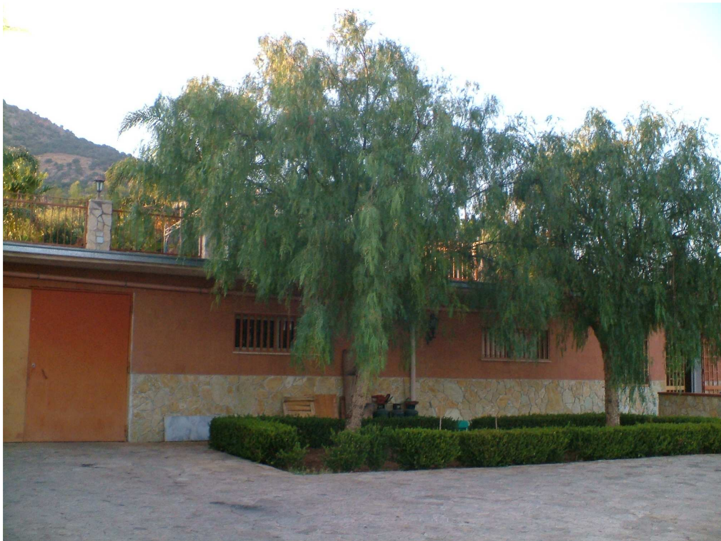
Ingresso al laboratorio