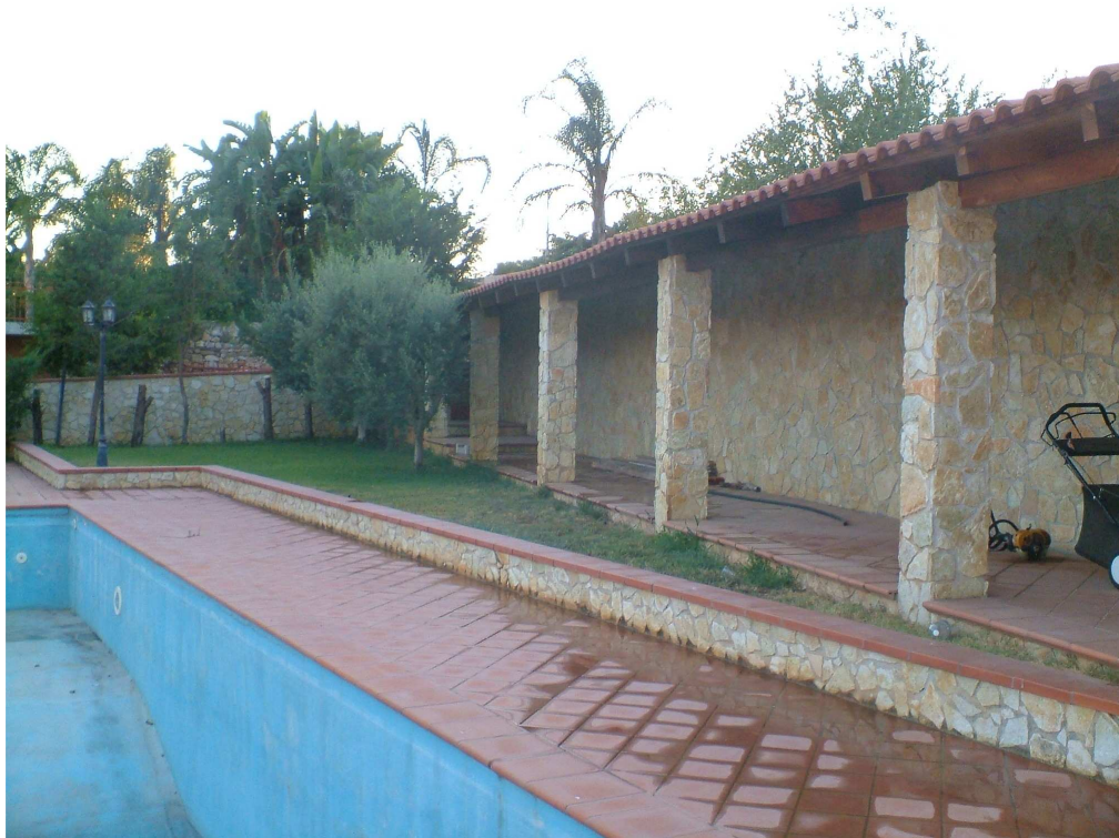
Seconda piscina e portico