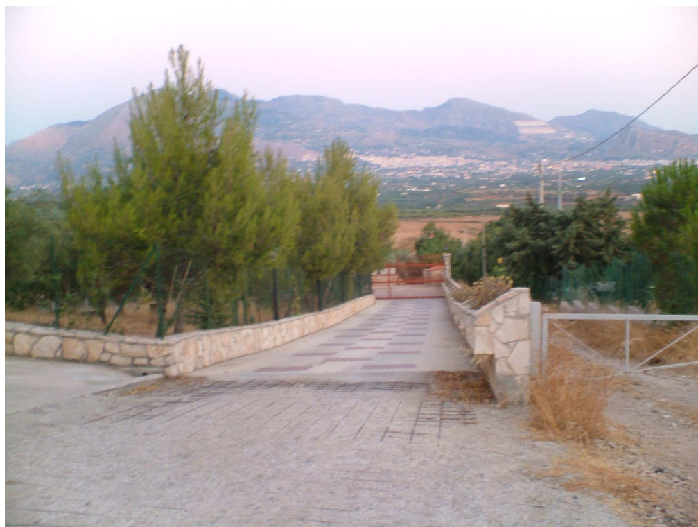
Stradella privata di ingresso all'immobile