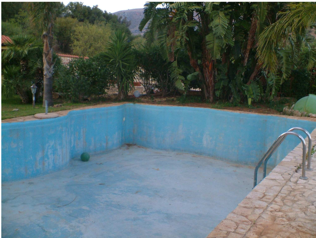
Piscina antistante l'abitazione