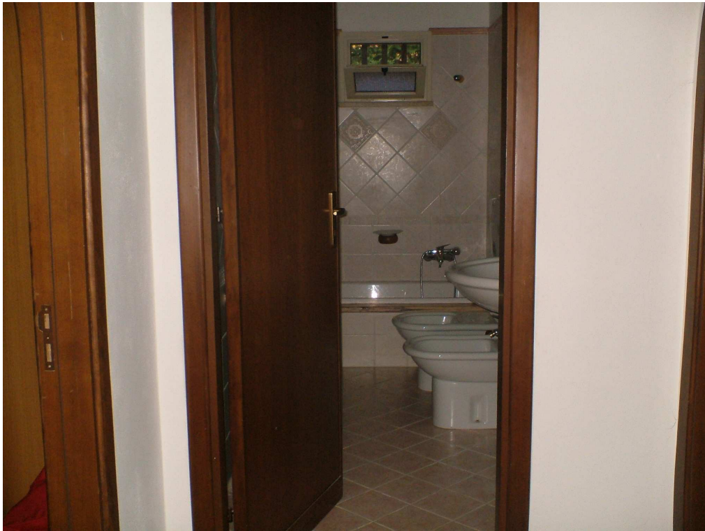
Wc-bagno del laboratorio