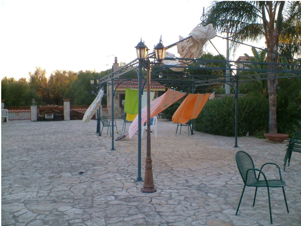
Spiazzale corrispondente al tetto del laboratorio