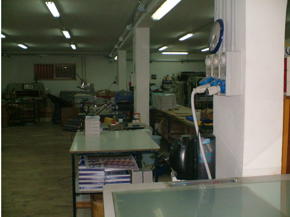
Interno del laboratorio