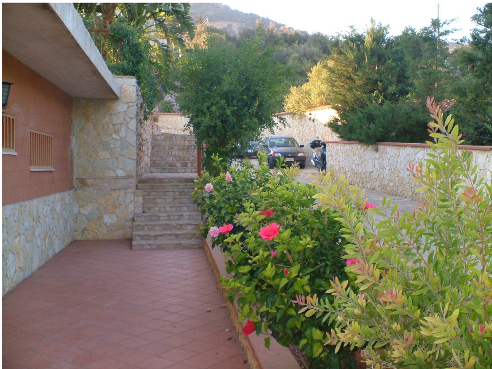
Prospetto laterale del laboratorio