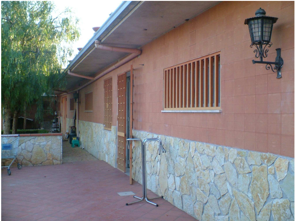
Ingresso al laboratorio