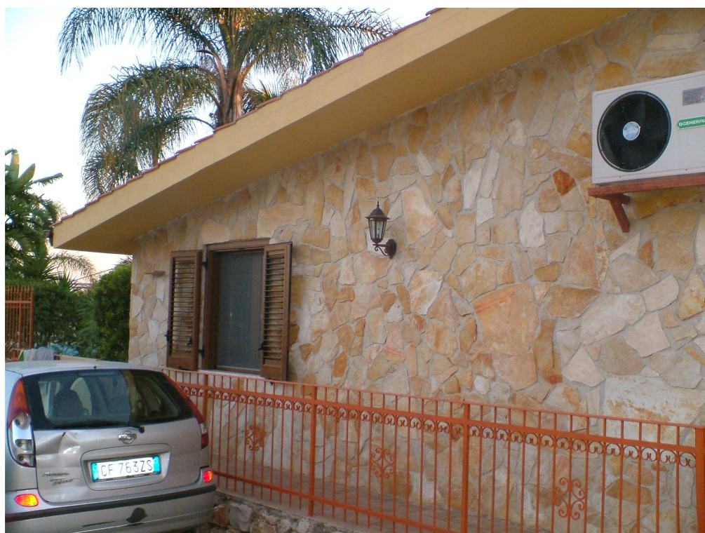
Prospetto laterale dell'abitazione