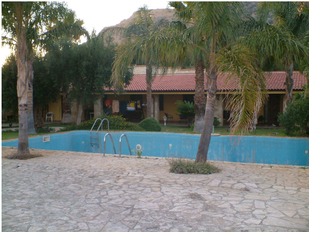
Piscina antistante l'abitazione