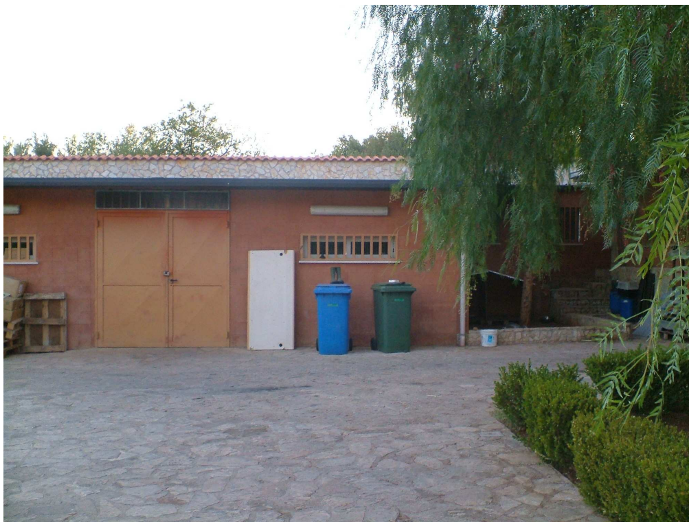
Prospetto del corpo accessorio adiacente al laboratorio