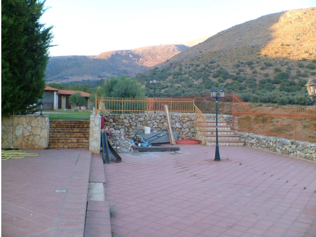
Spiazzale pavimentato in cotto con evidenti segni di degrado