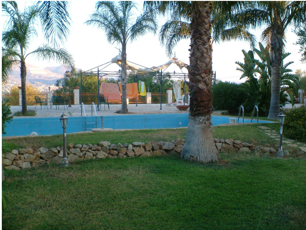
Piscina antistante l'abitazione