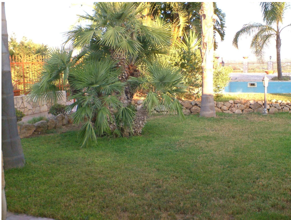
Area a verde