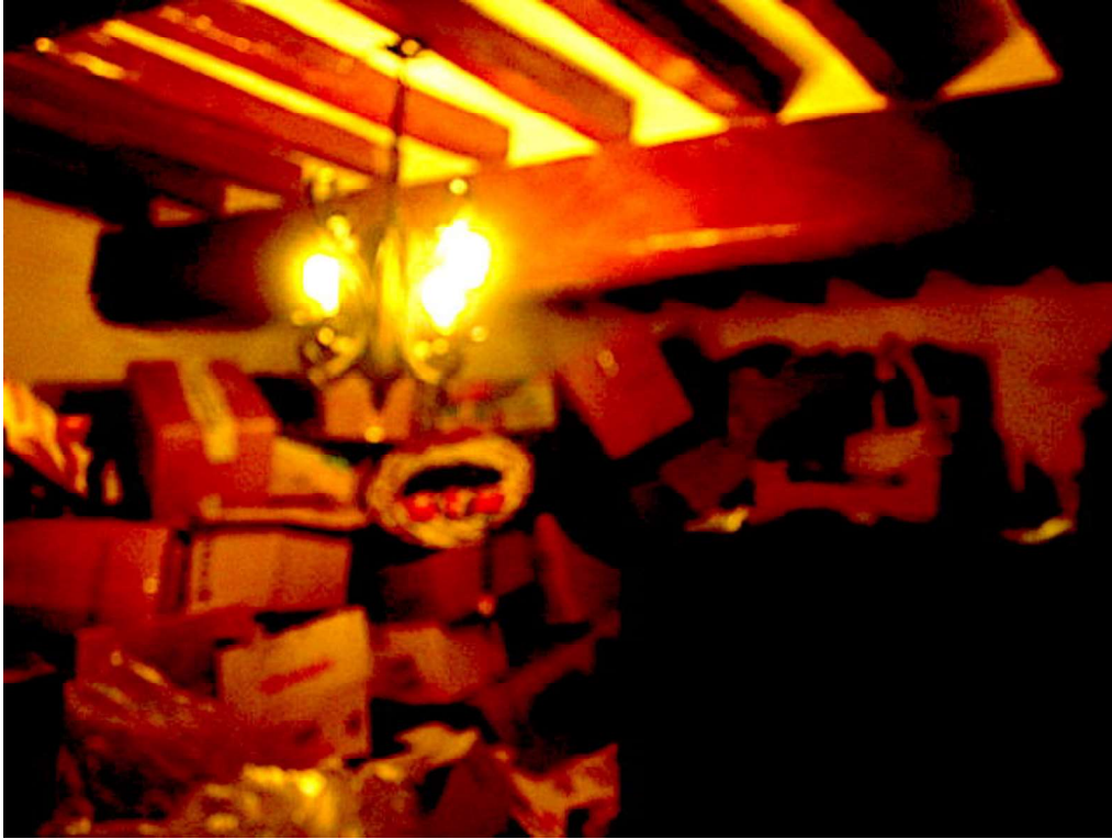
foto 9 e 10 – interni stanza e ingresso con vano scala p.t. (2019)