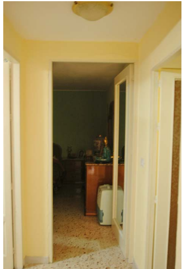
foto 9 - vista del disimpegno