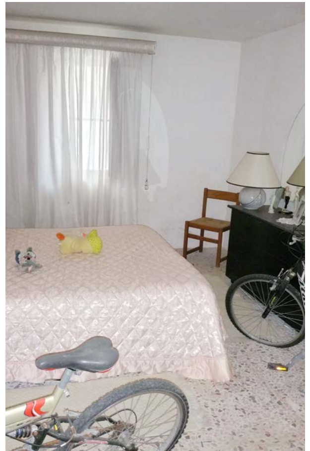
foto 20 - vista della camera da letto doppia