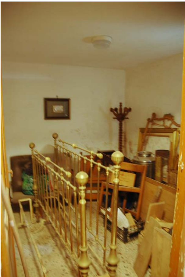
foto 23 - vista della camera singola