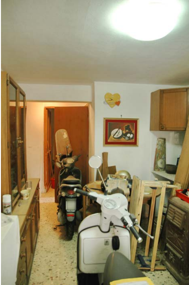
foto 17 - vista del soggiorno/pranzo