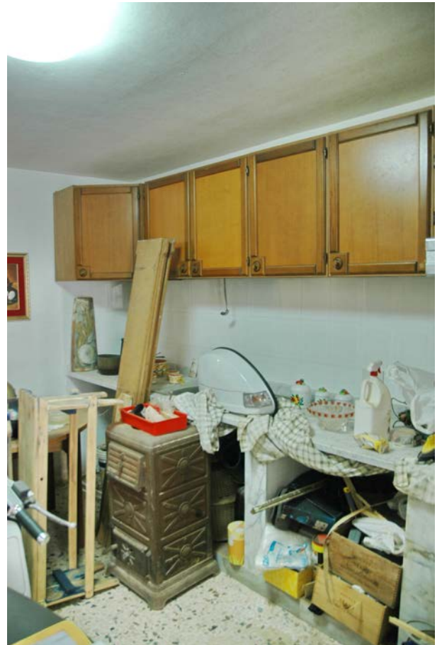
foto 22 - vista della cucina