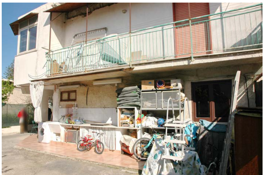
foto 6 - vista esterna