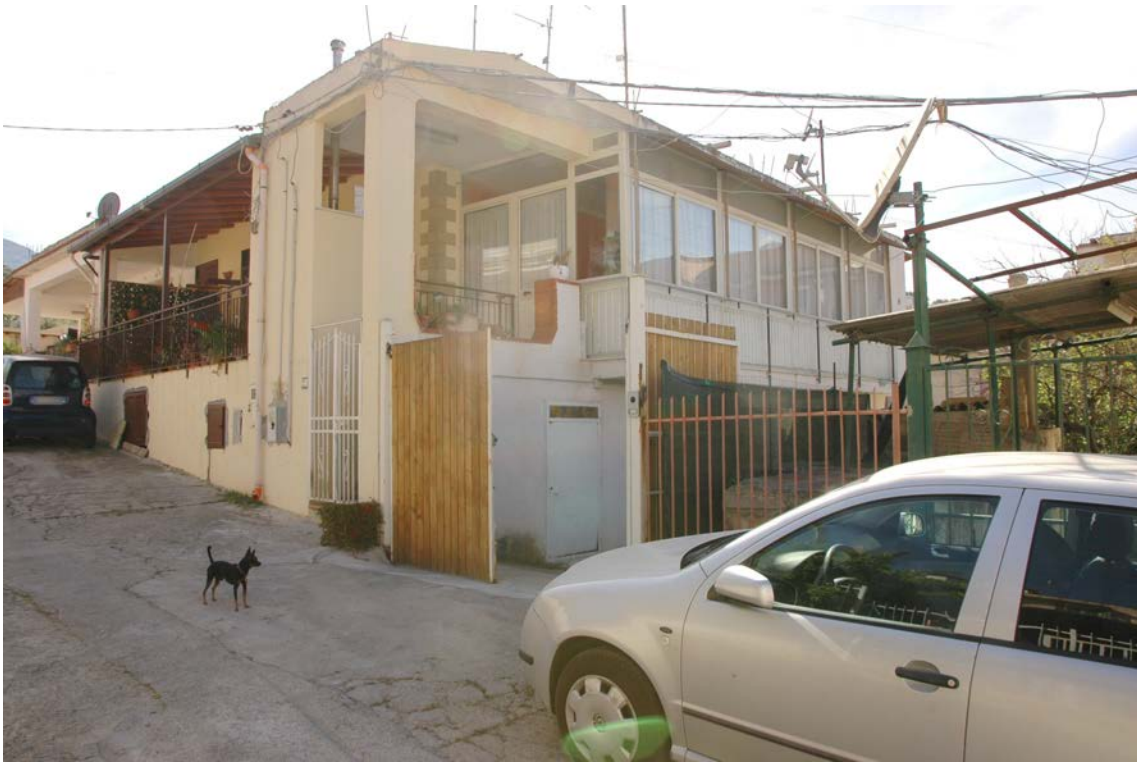
foto 1 - vista dalla strada interpodereale d'accesso