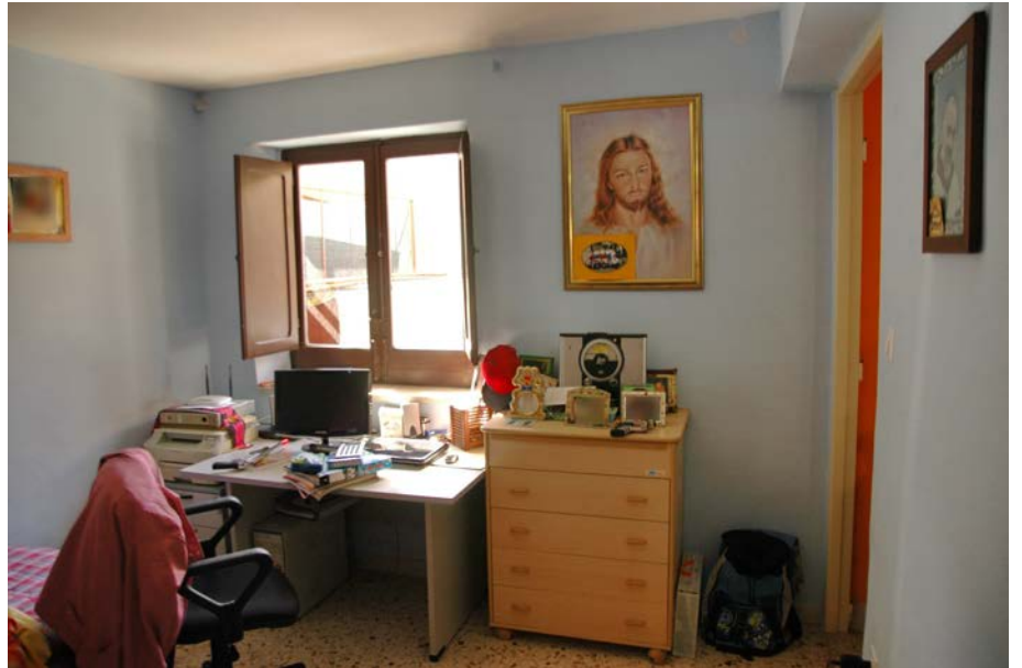
foto 13 - vista dalla camera da letto singola