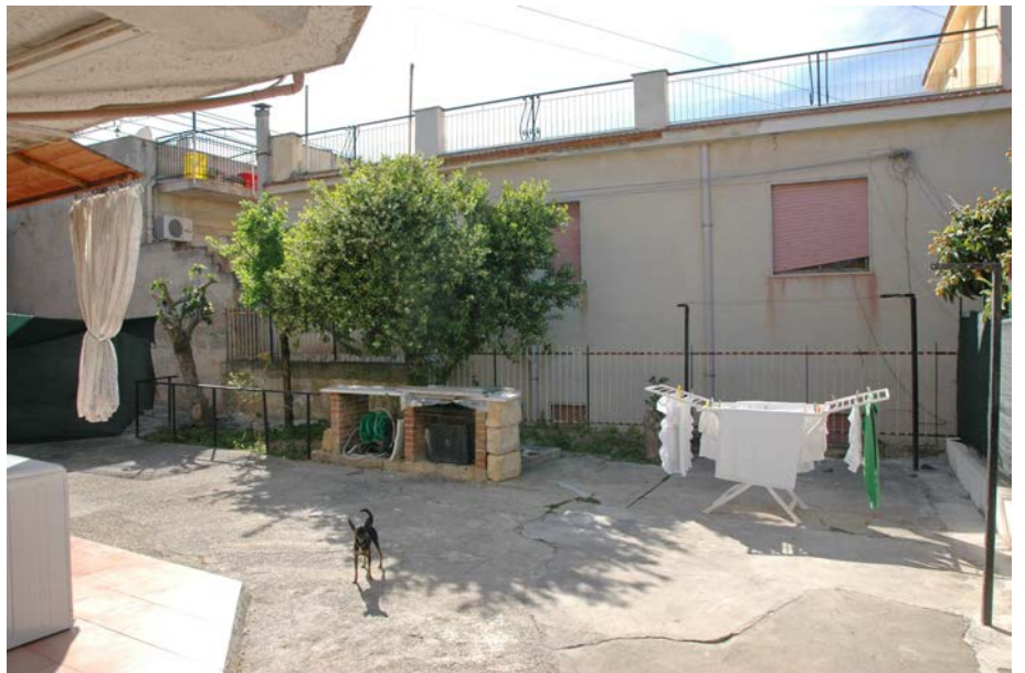
foto 5 - vista della corte