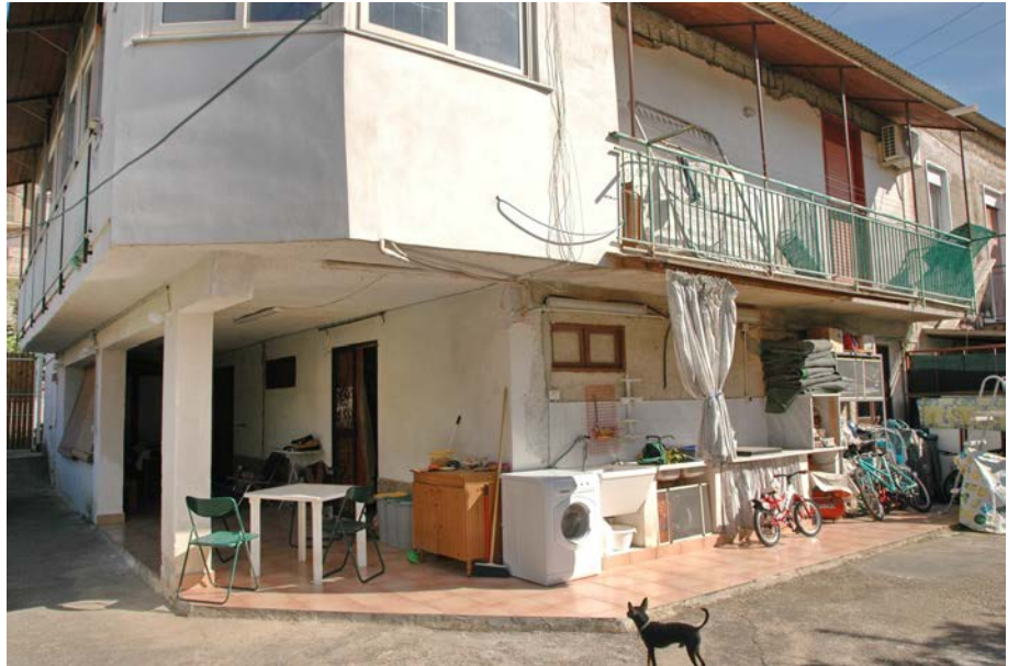
foto 4 - vista dalla corte