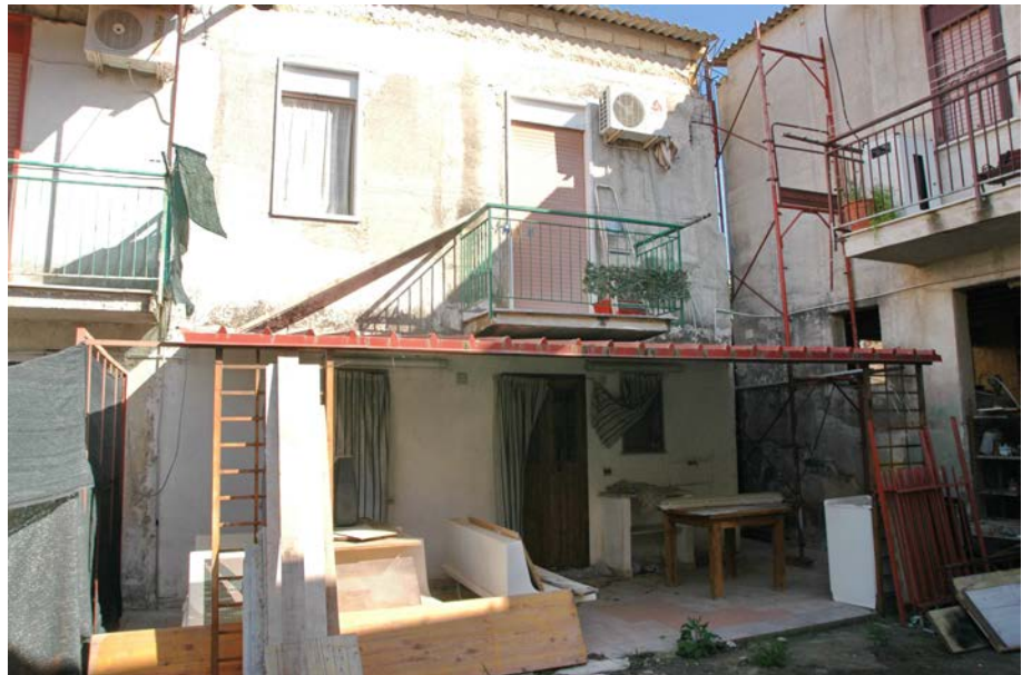
foto 14 - vista dalla corte