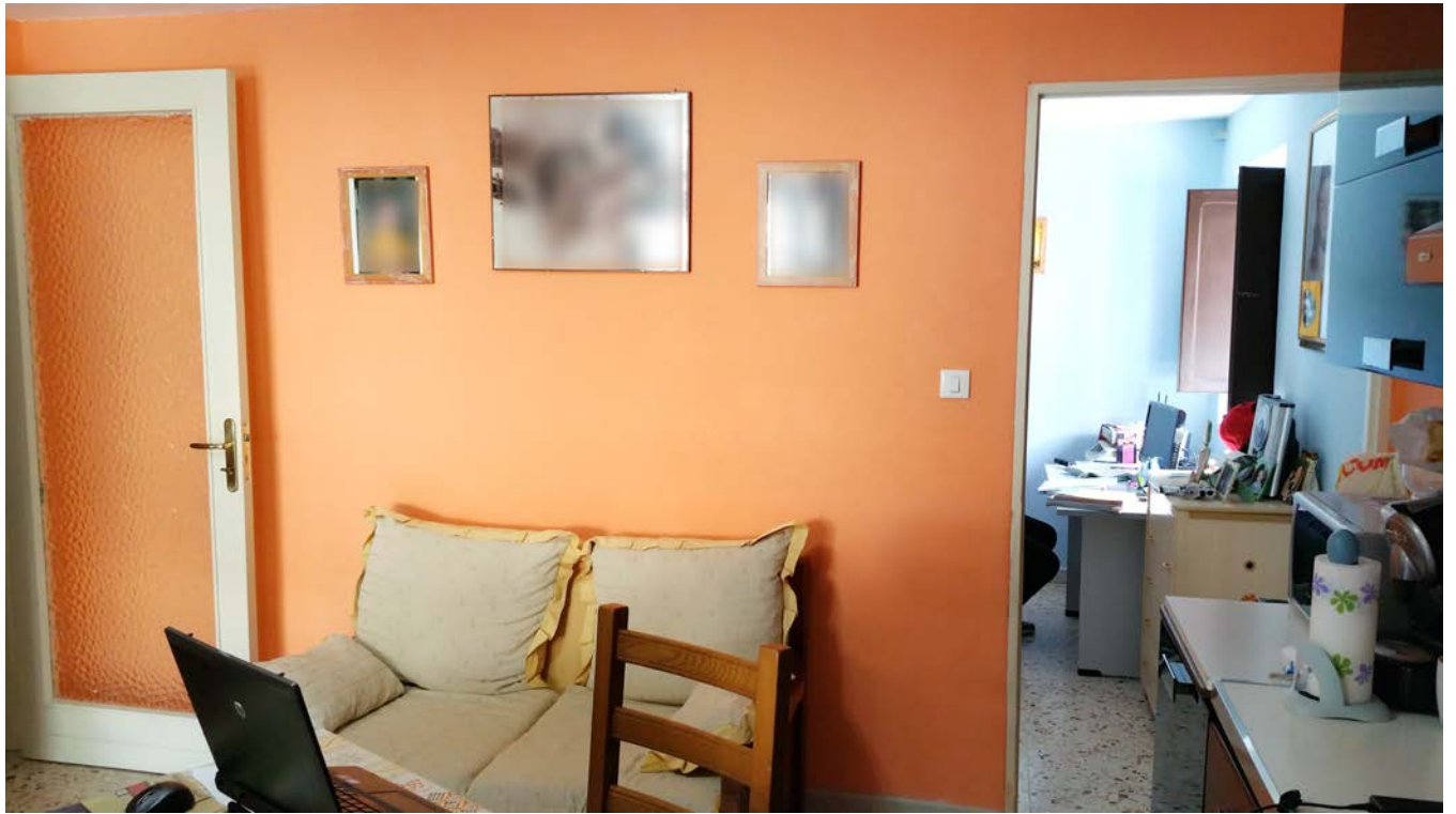
foto 7 - vista del soggiorno/pranzo