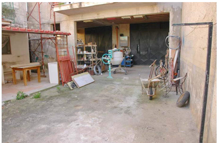
foto 16 - vista della corte esterna