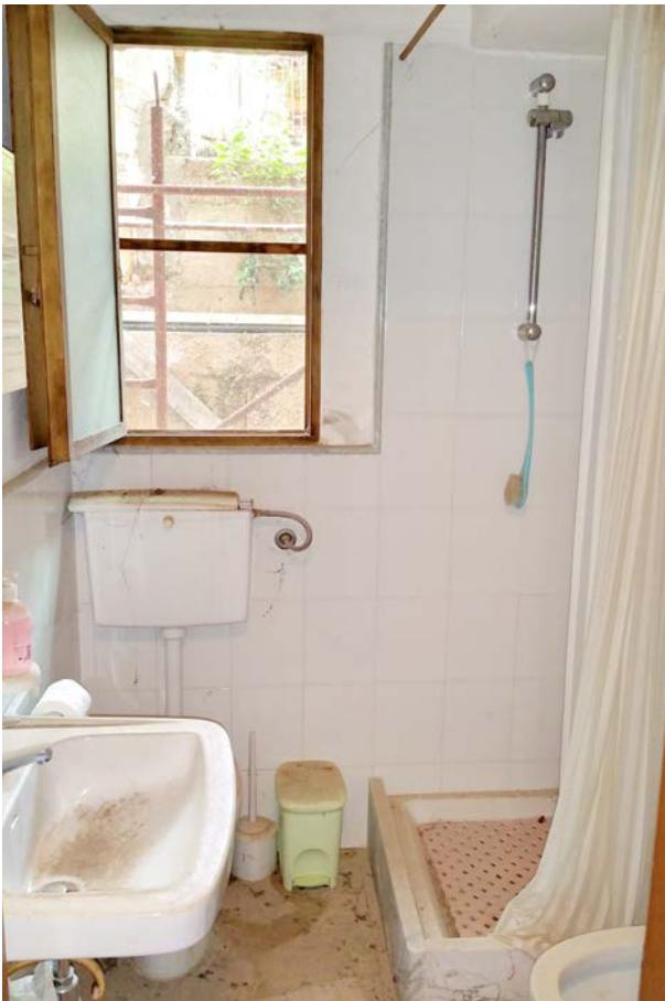
foto 19 - vista della bagno