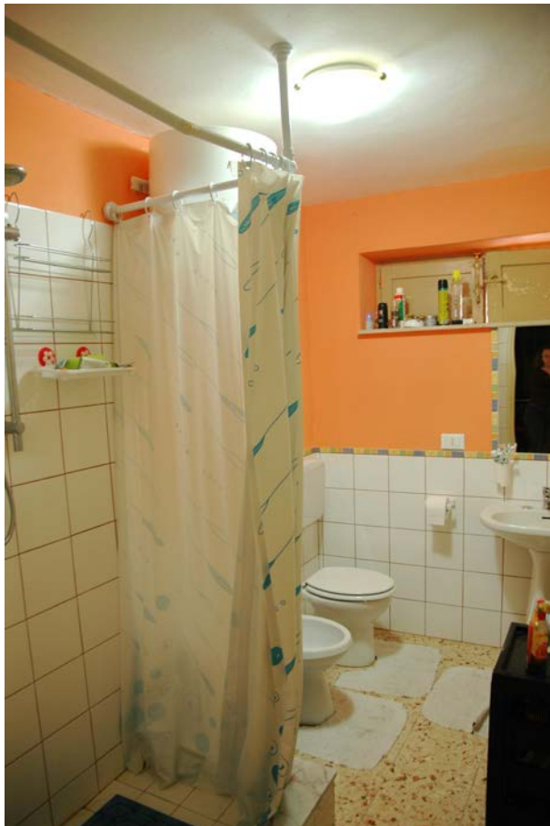
foto 11 - vista del bagno