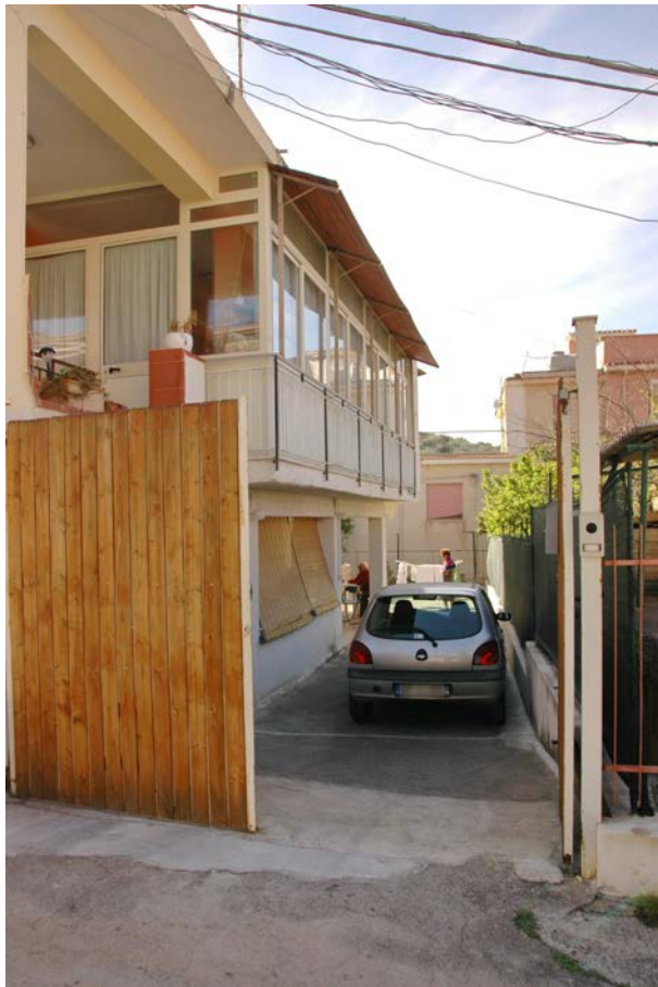
foto 2 - vista rampa dalla strada