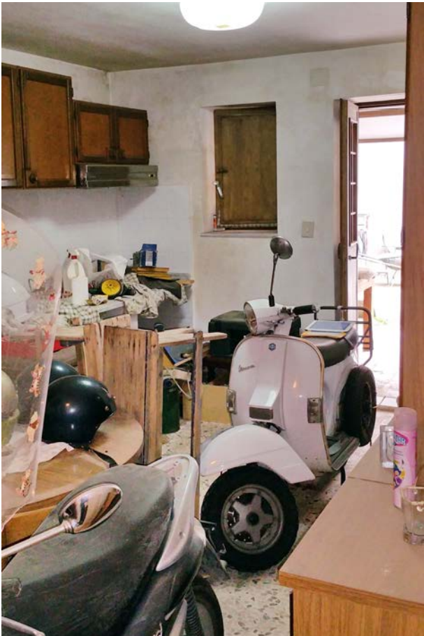
foto 21 - vista della cucina