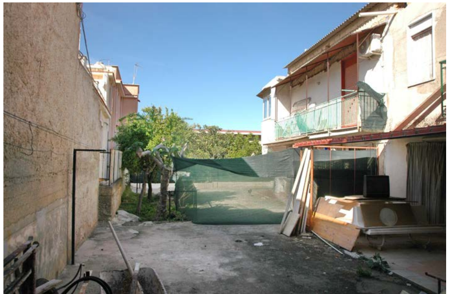
foto 15 - vista della corte