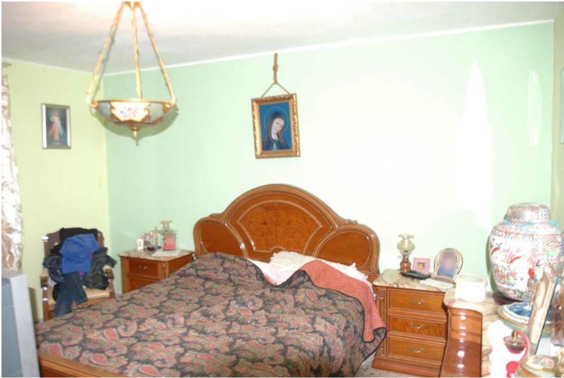
foto 10 - vista dala camera da doppia