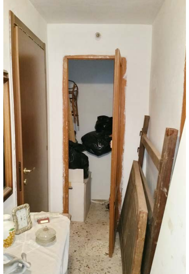
foto 18 - vista del disimpegno