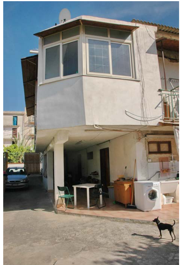
foto 3 - vista rampa di accesso dall'interno