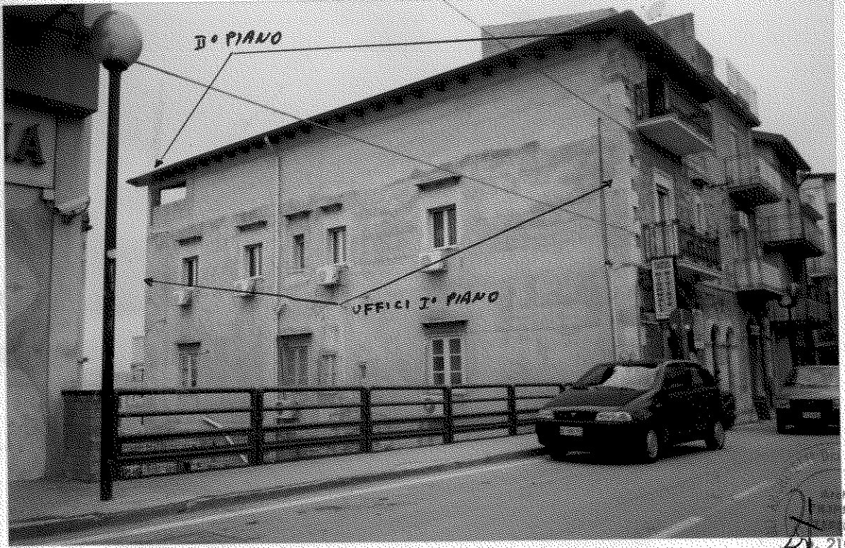
(foto n. 27) Il terrazzo al II° piano è stato coperto con un tetto