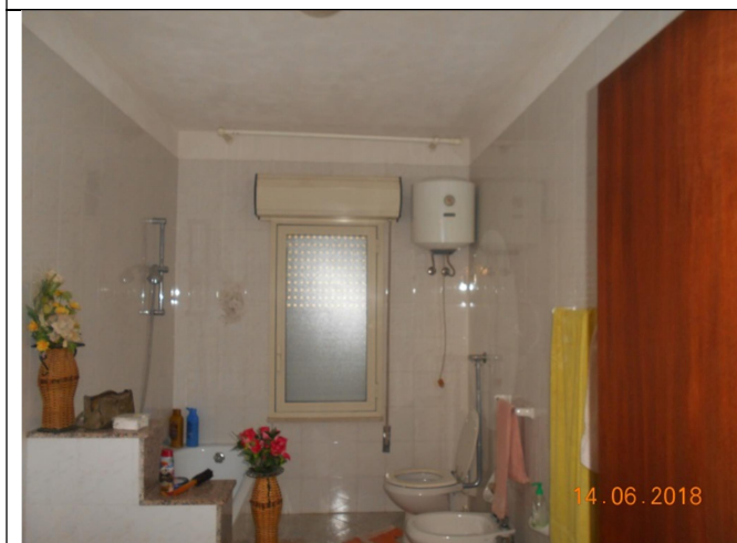
Foto n.13 - Bagno