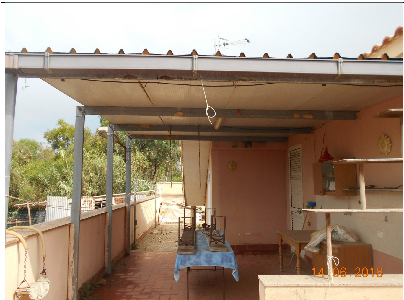
Foto n.6 – Vista del retrospetto – Si nota la presenza di una struttura precaria in ferro e copertura con pannelli in poliuretano