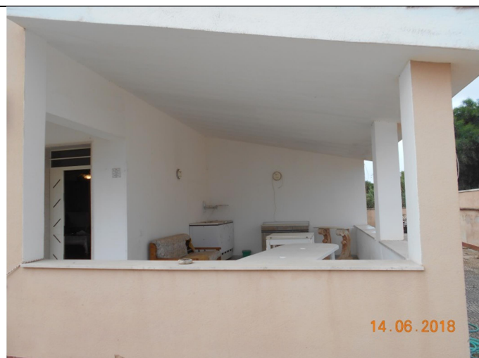
Foto n.14 - Vista della veranda