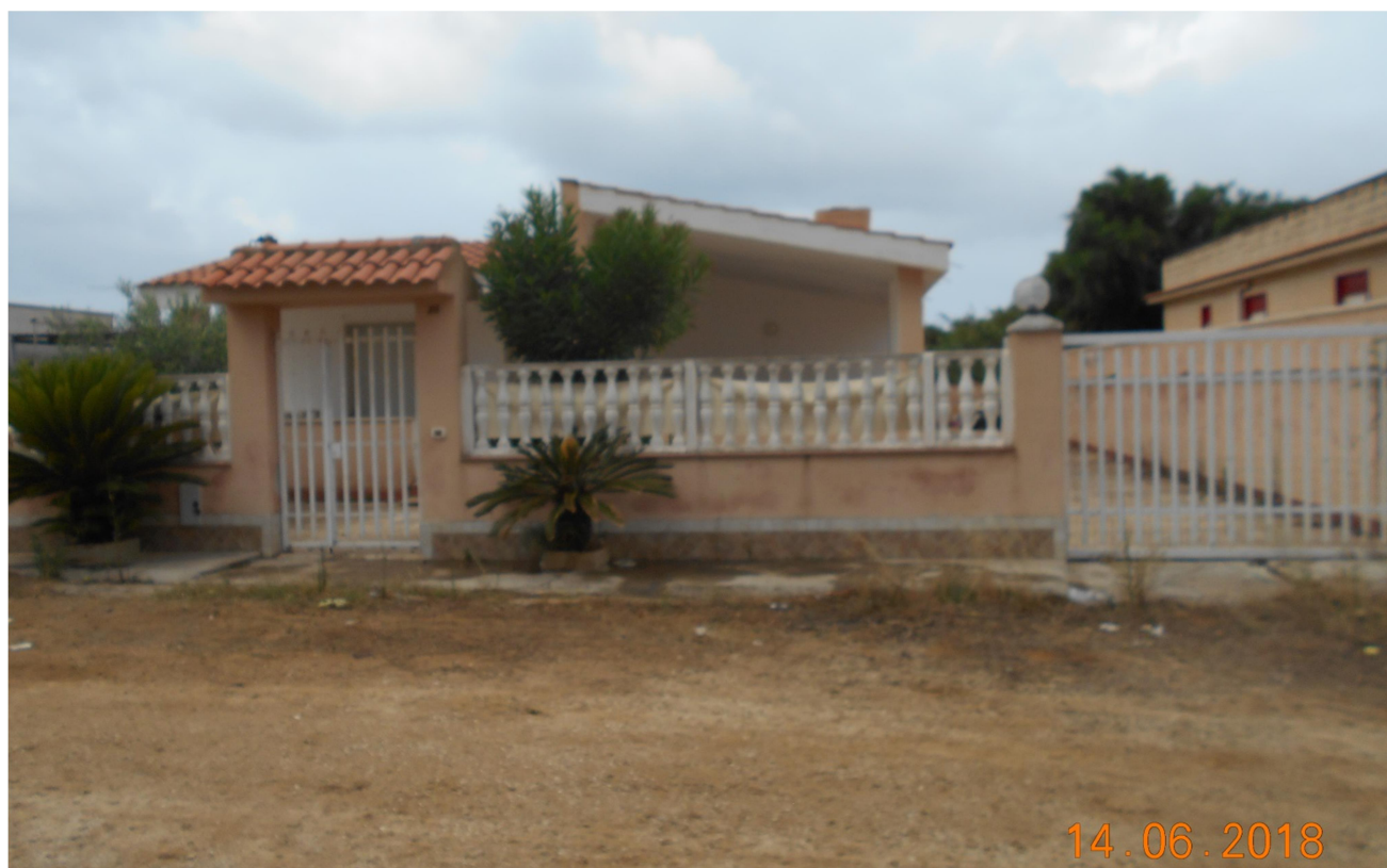
Foto n.2 – Entrate principali dell'immobile su via n.134; si nota l'entrata pedonale e quella carrabile.