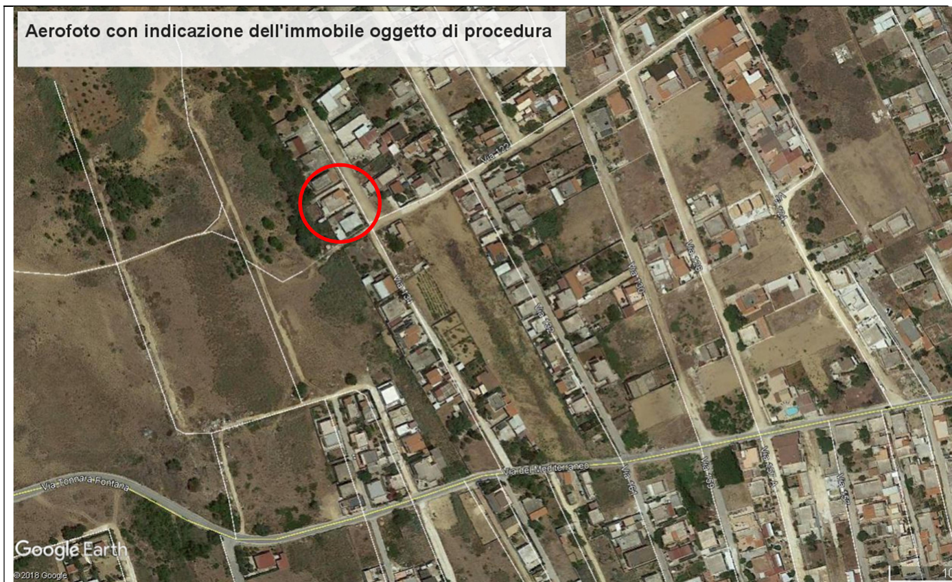
Foto n.1 - Aerofotogrammetria dell'area con indicazione dell'unità immobiliare oggetto di esecuzione.