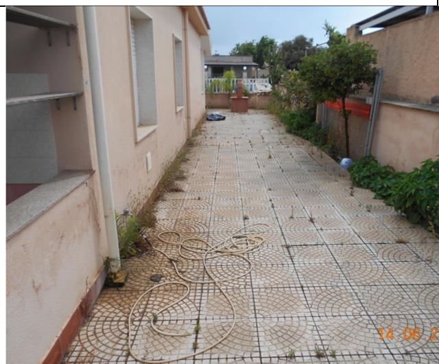
Foto n.5 – Vista del prospetto laterale a confine con la part. 1829 (lato sud)