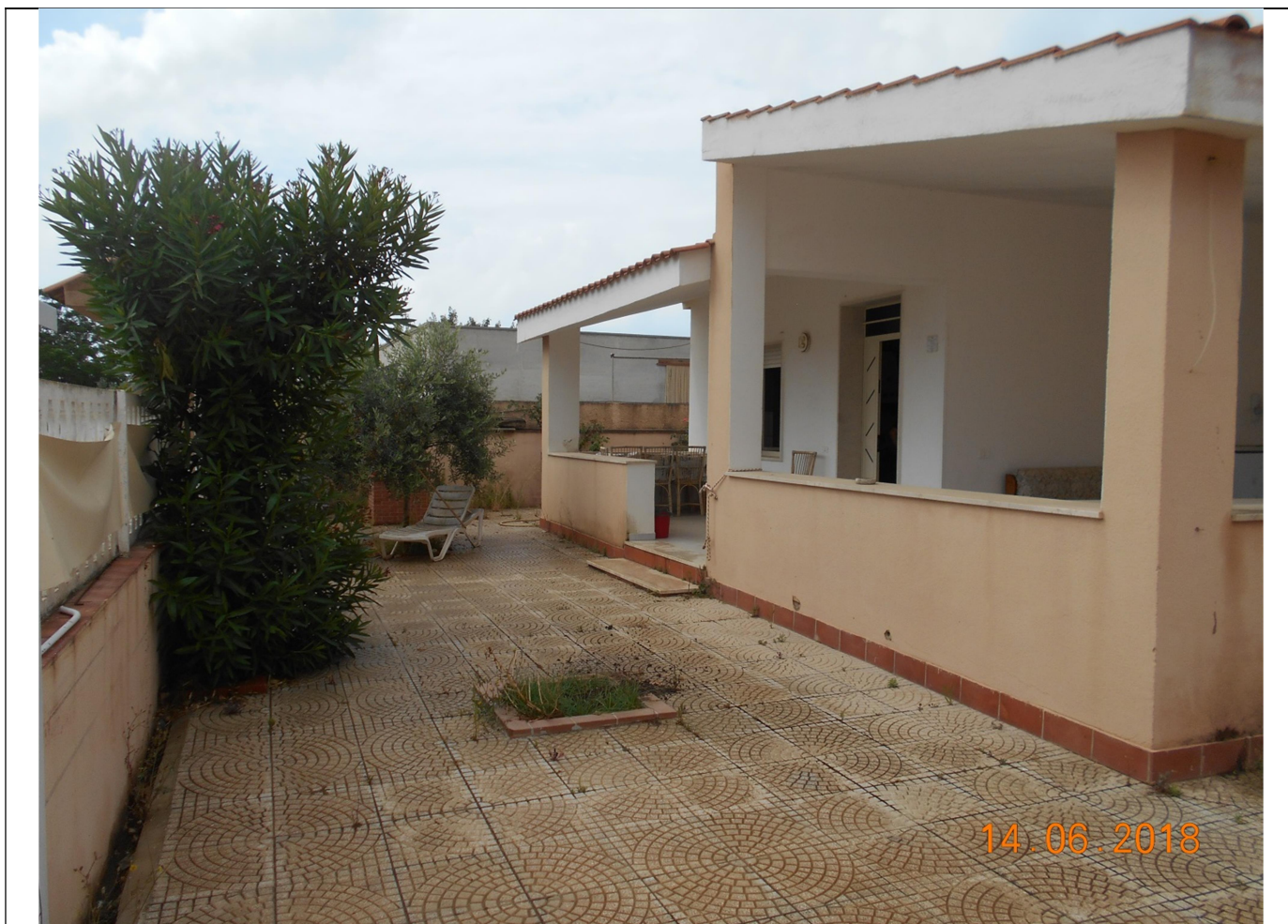
Foto n.3 – Vista dell'entrata principale dell'immobile. Si evidenzia che l'esterno è pavimentato con mattonelle in cemento