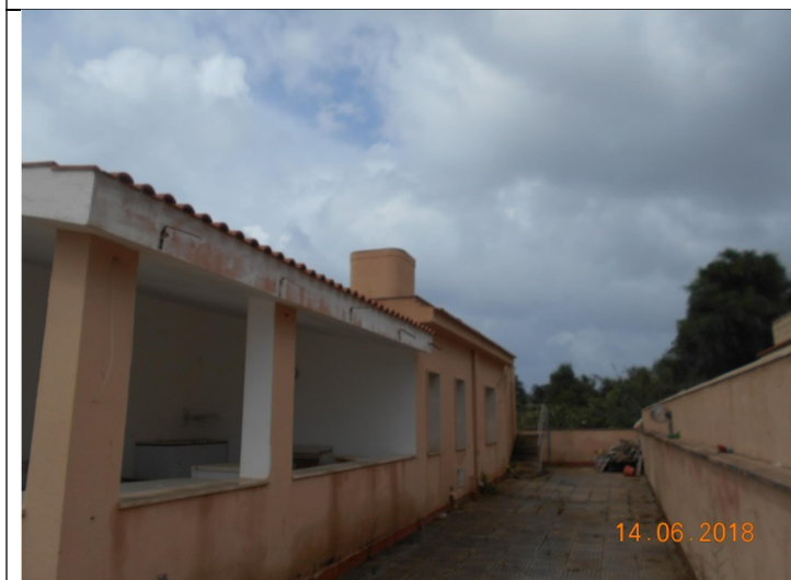
Foto n.4 – Vista del prospetto laterale a confine con la part. 2242 (lato nord)