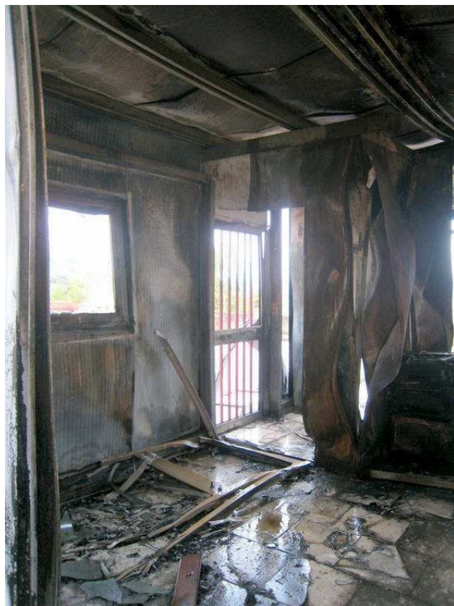
Foto n. 4 e 5. Gli interni del box consumati dalle fiamme.