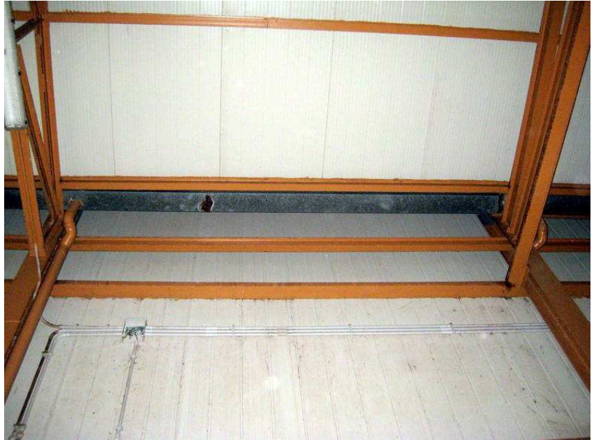
Foto n. 15. Anche nel locale gruppo elettrogeno del capannone B-2 ci sono