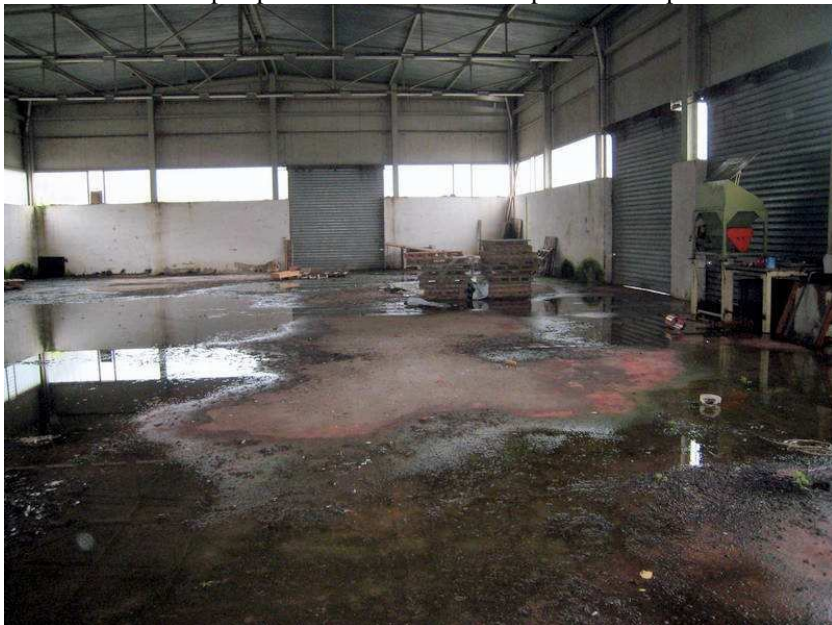
Foto n. 8. Panoramica dell'interno del capannone A-1.