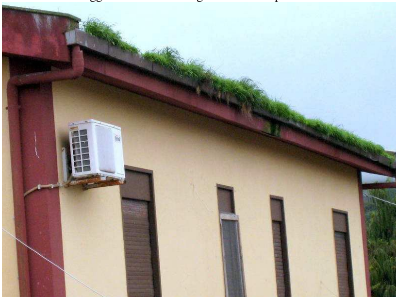
Foto n. 28. Dettaglio della gronda. I pluviali saranno otturati e ciò provocherà danni anche alla copertura.