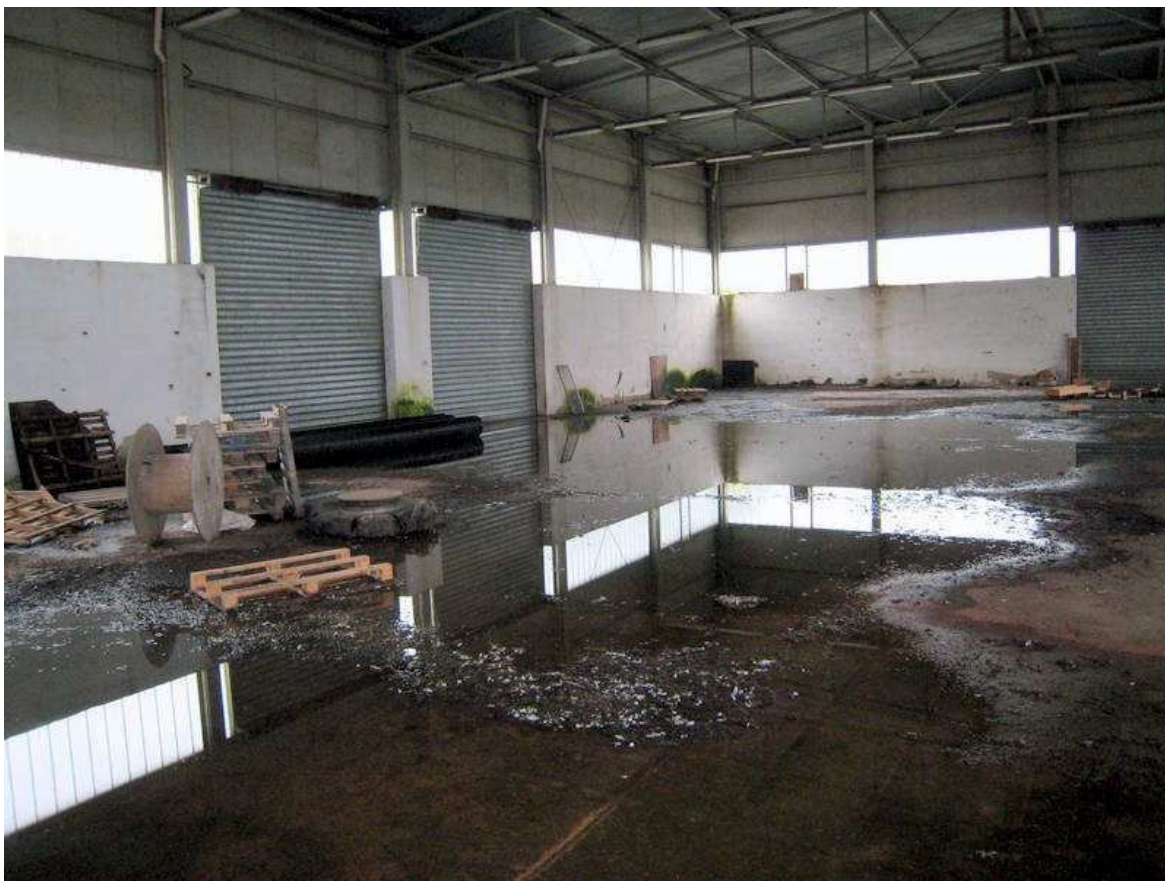
Foto n. 9. Le infiltrazioni d'acqua provengono dalla copertura ed in diversi punti.