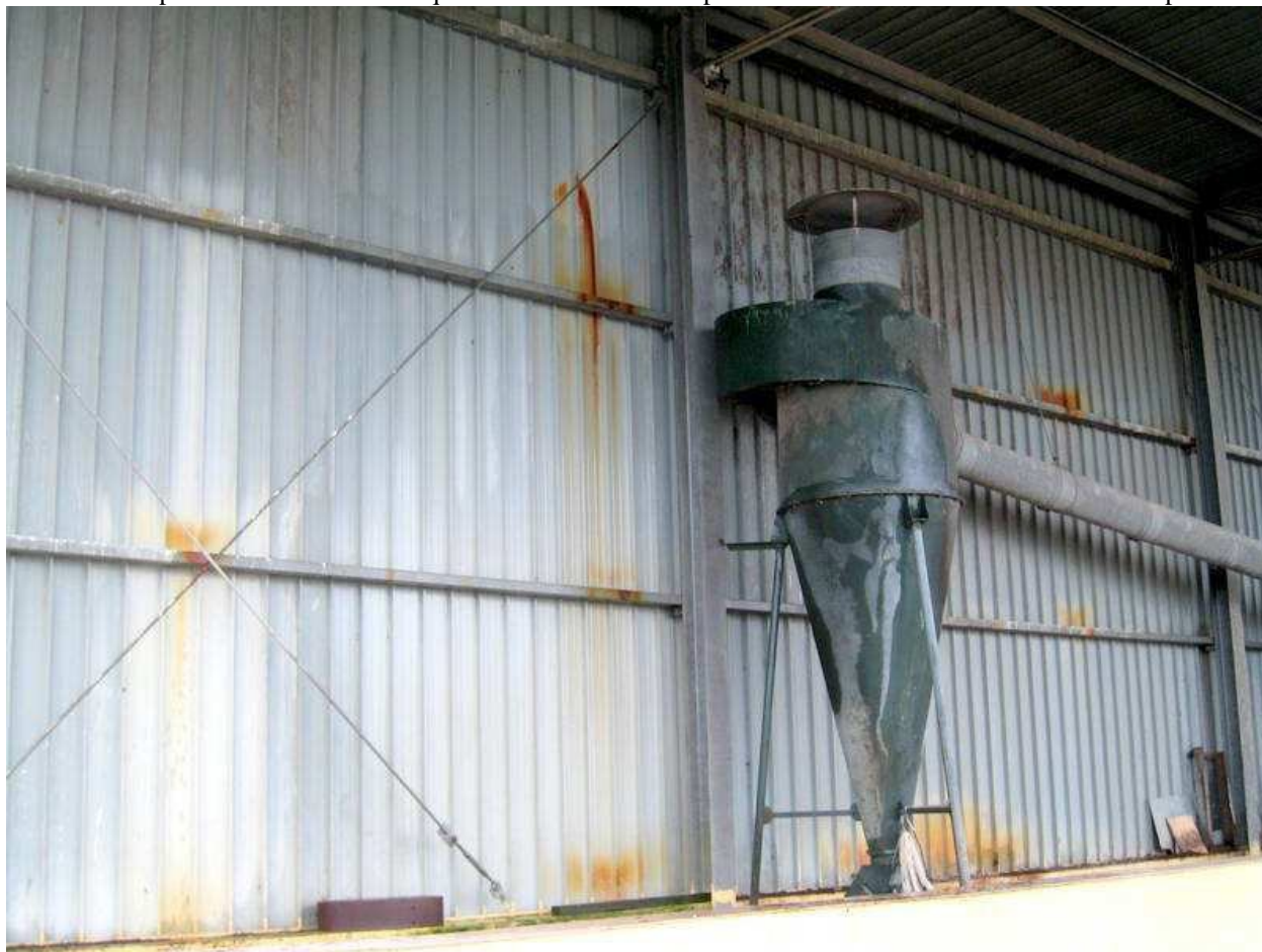
Foto n. 26. Pannellatura della tettoia D-15 che denota problemi di ruggine.