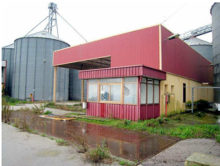
Foto n. 21. L'area intorno alla pesa è caratterizzata da vegetazione infestante. La cabina ha subito danni.