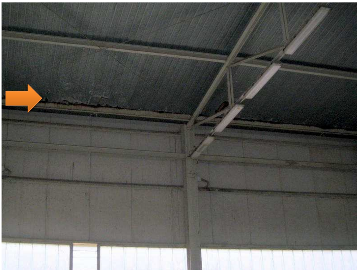
Foto n. 12. Altra zona con i pannelli di copertura già attaccati dalla ruggine.