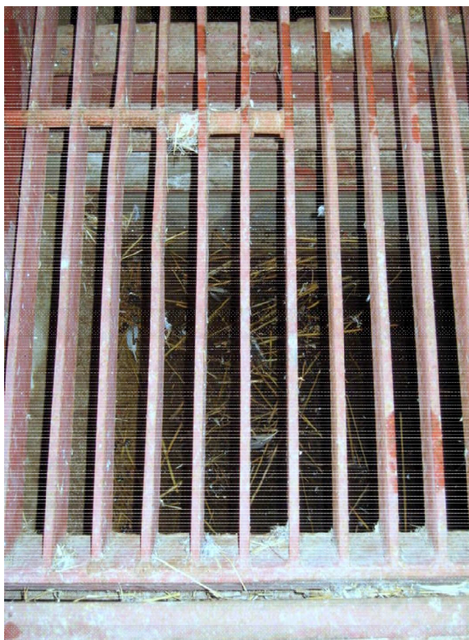
Foto n. 24. La porta è stata divelta ed il quadro di comando della pesa è vandalizzato. Foto n. 25. La fossa è piena d'acqua.