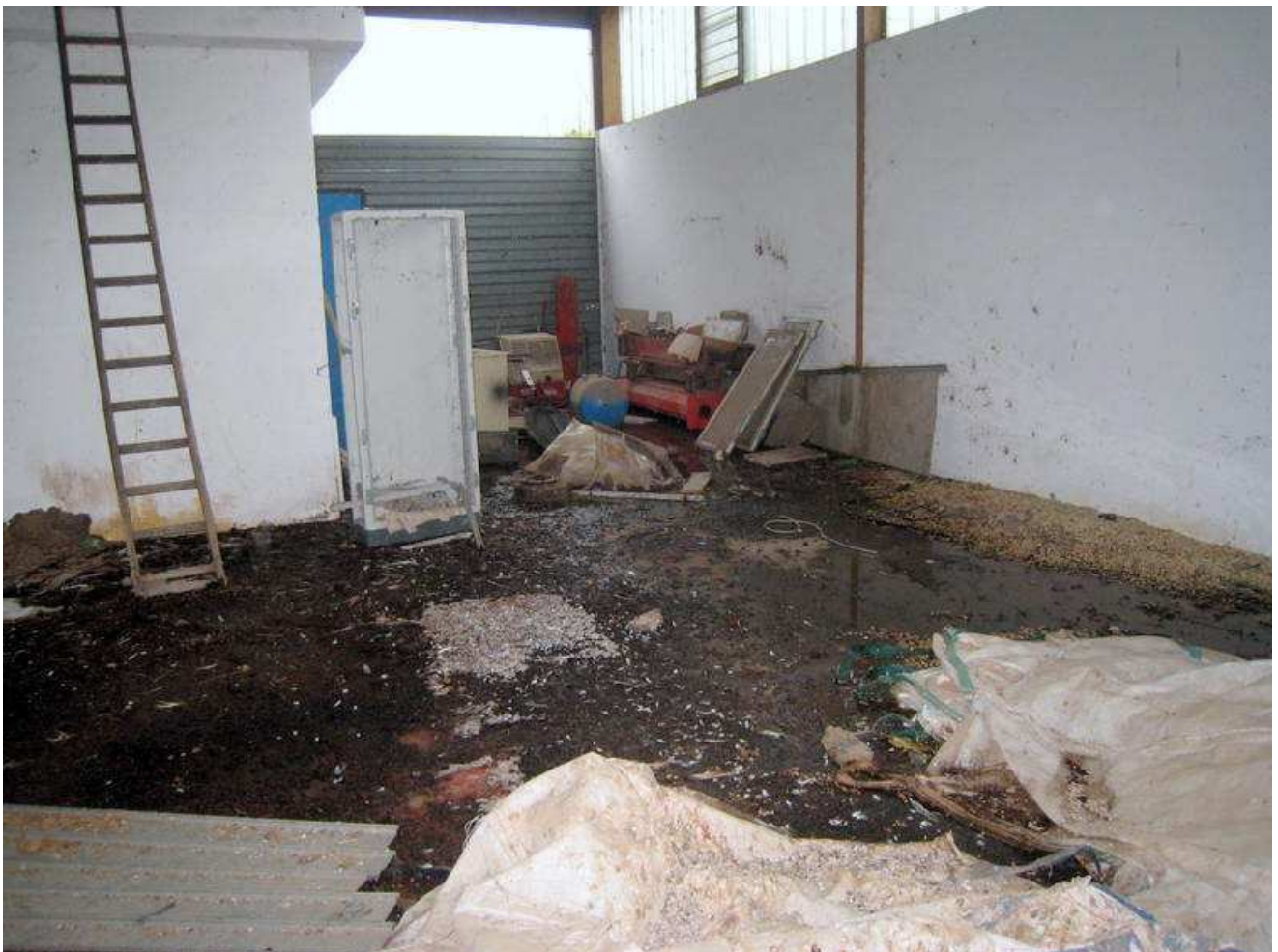
Foto n. 16. Il locale si allaga a seguito delle piogge. L'acqua entra, prevalentemente, da sotto gli infissi e dal tetto.