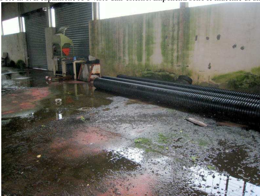
Foto n. 7. Lo stesso prospetto visto dall'interno. Il pavimento è praticamente allagato.