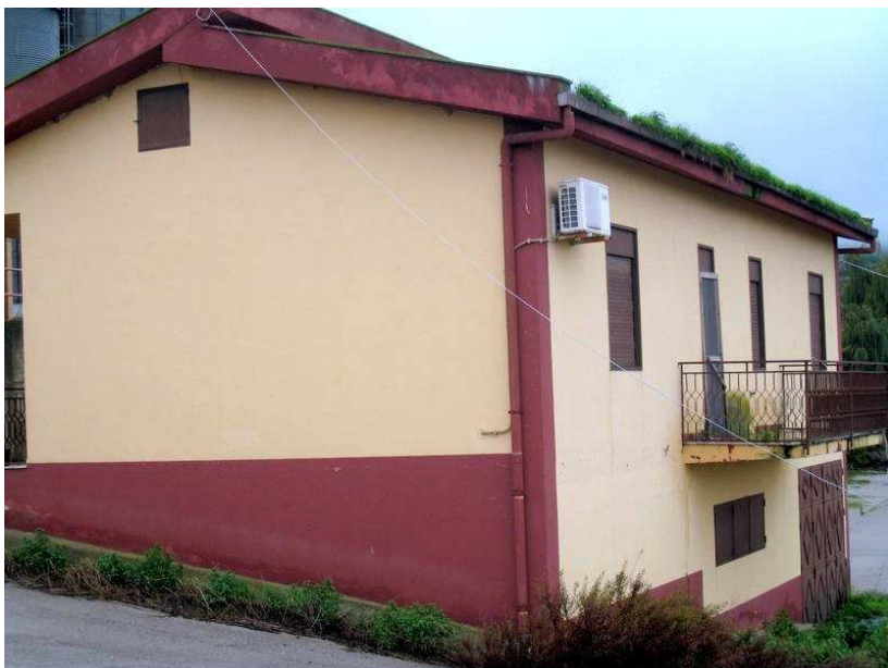
Foto n. 27. L'alloggio del custode. La gronda della copertura è intasata e vi cresce l'erba.