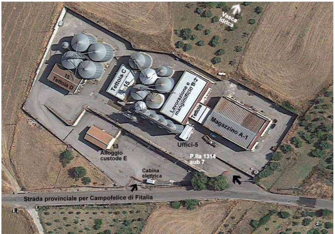
Foto n. 1. Immagine aerea con indicato lo stabilimento con tutti i suoi componenti.