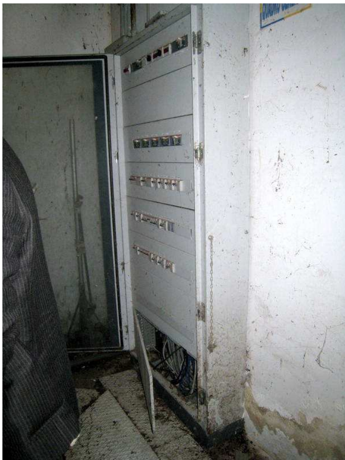
Foto n. 17 e 18. Quadri elettrici ormai danneggiati e vandalizzati.