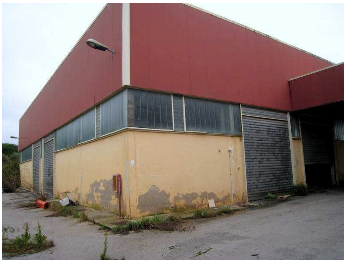
Foto n. 13. Altro prospetto, quello lato monte, del capannone A-1. L'umidità è ormai diffusa su tutto il perimetro.