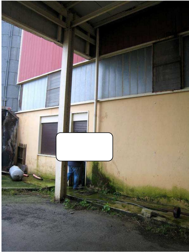
Foto n. 14. Pluviale rotto del capannone B-2. segni di ruggine in copertura.