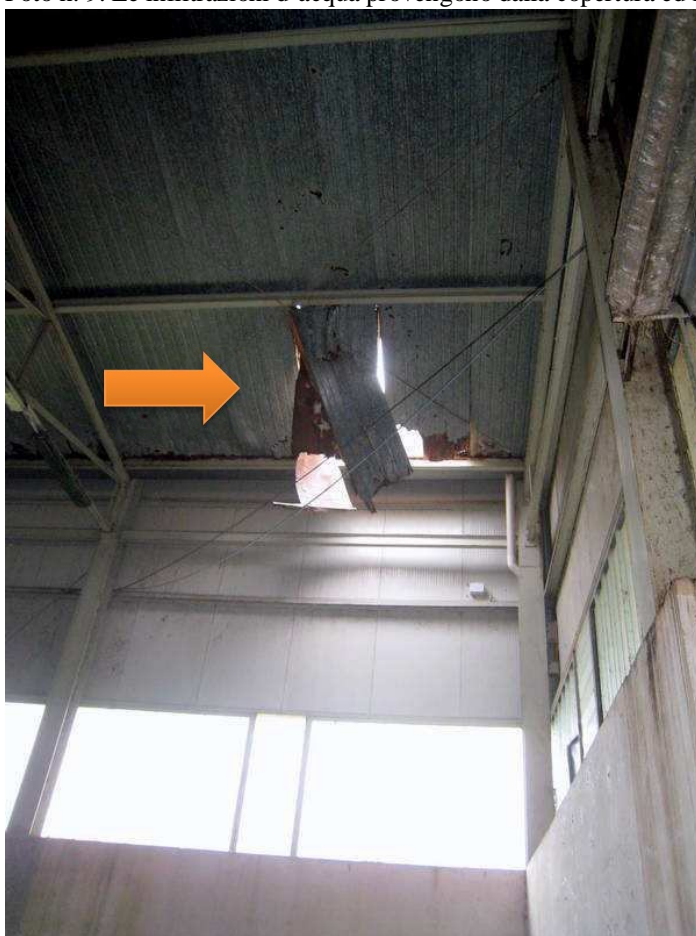
Foto n. 10. Parte dei pannelli collassati a causa della ruggine.