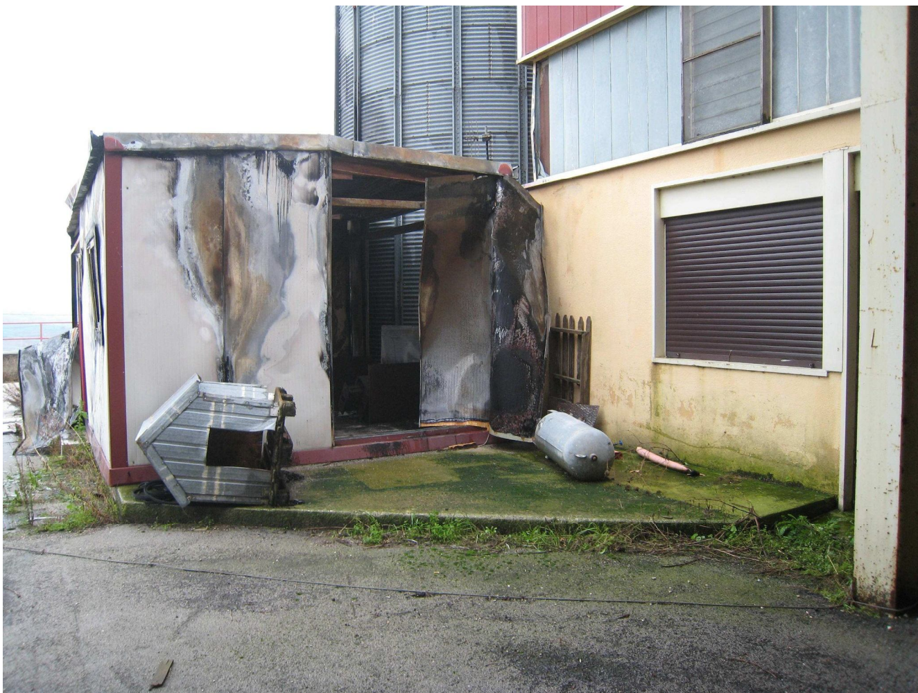
Foto n. 3. Altra immagine dello stesso box.