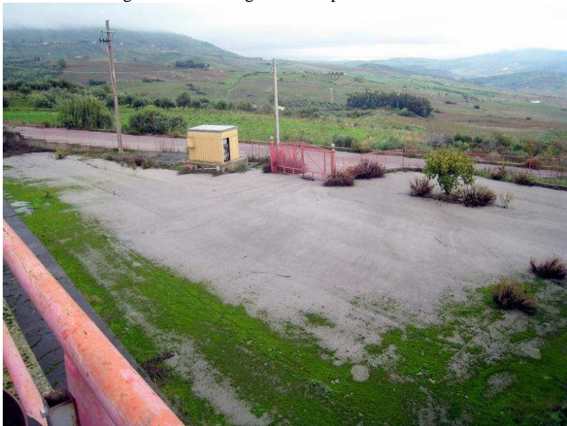
Foto n. 32. Ancora il piazzale lato valle.