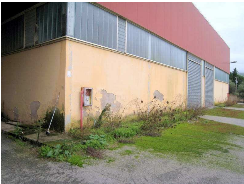
Foto n. 6. Il capannone A-1 visto dall'esterno. Imponenti sono le macchie di umidità.