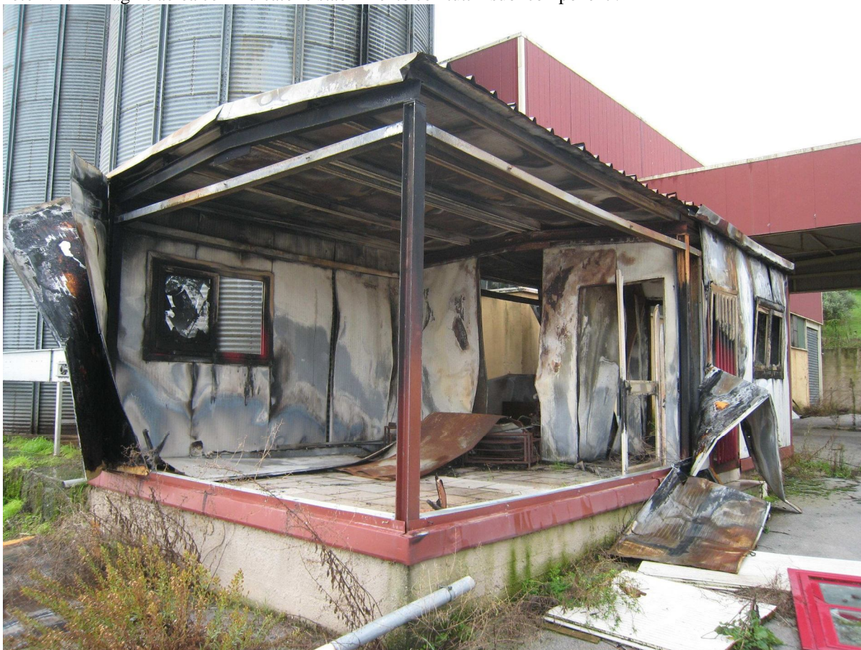
Foto n. 2. Il box ufficio andato a fuoco non è più utilizzabile.