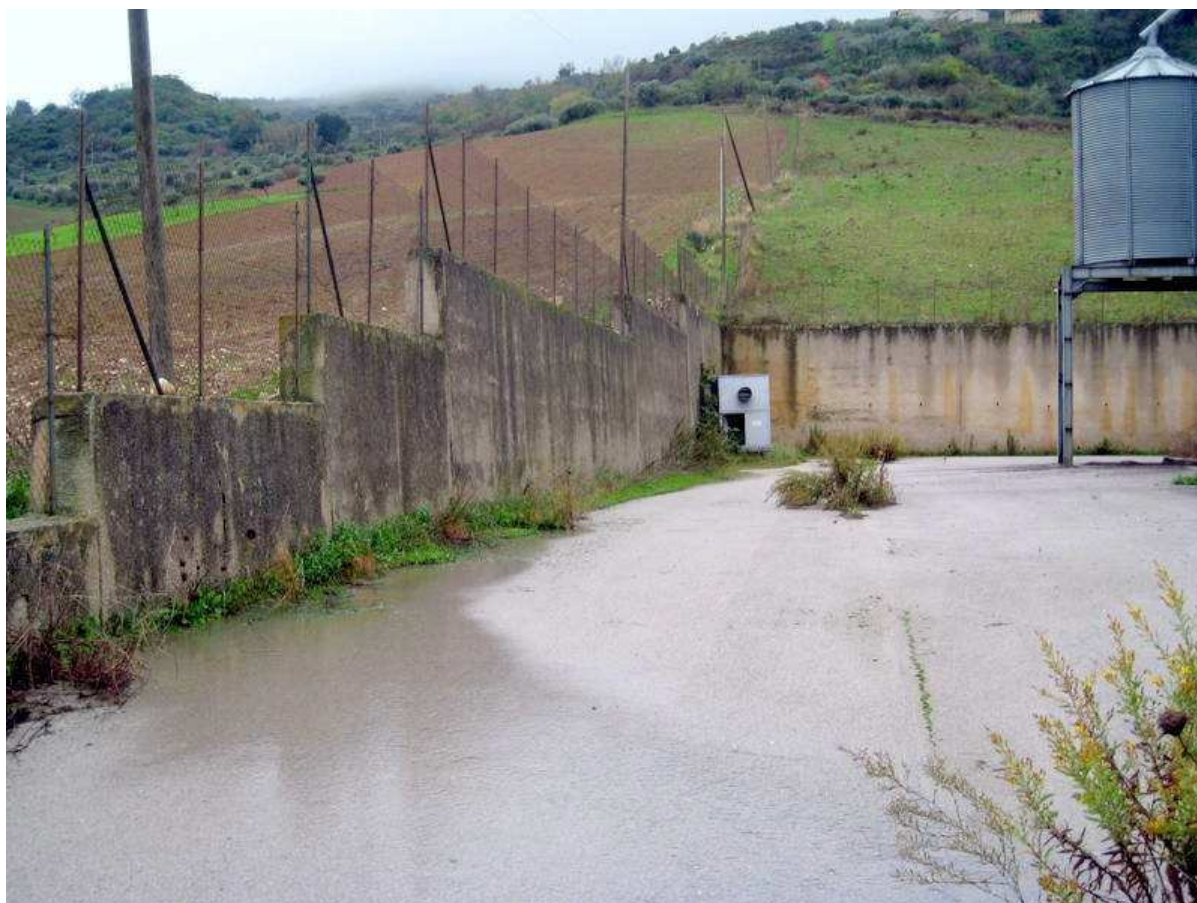
Foto n. 33. Il piazzale lato monte.