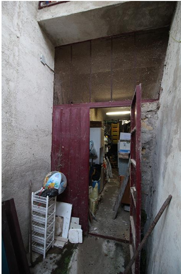
INGRESSO LOCALE DI SGOMBERO