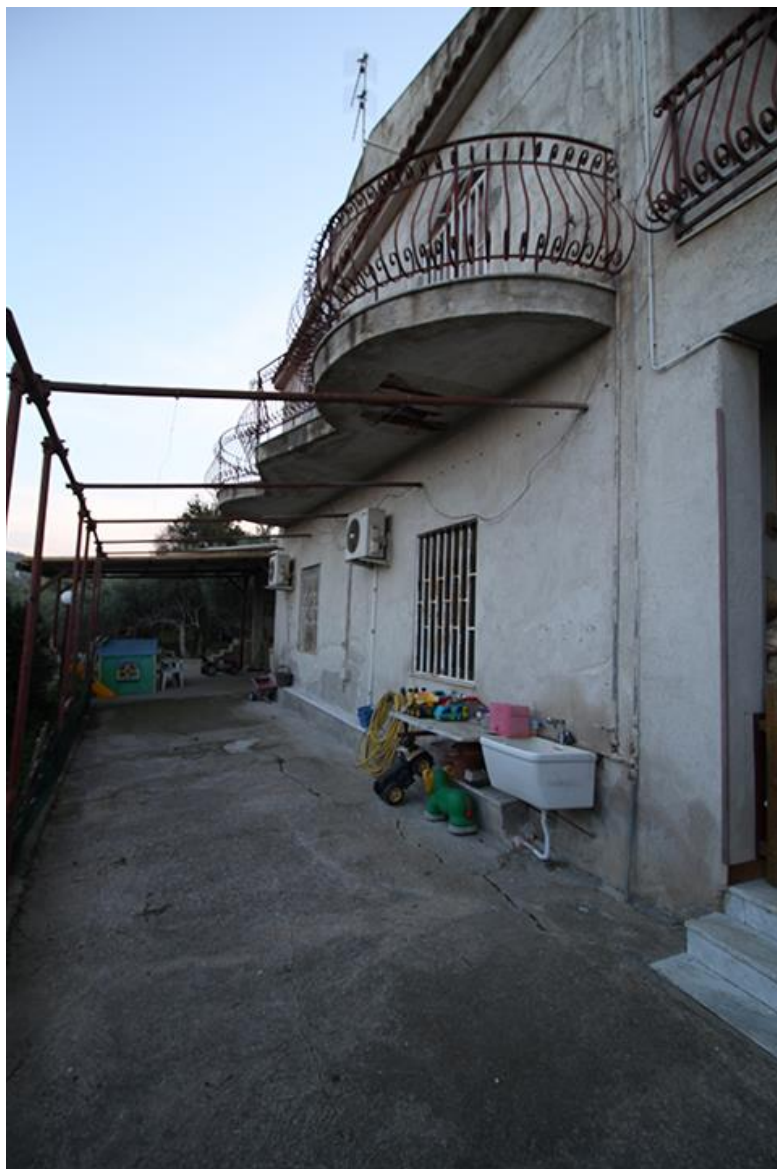
AREA ESTERNA COMUNE