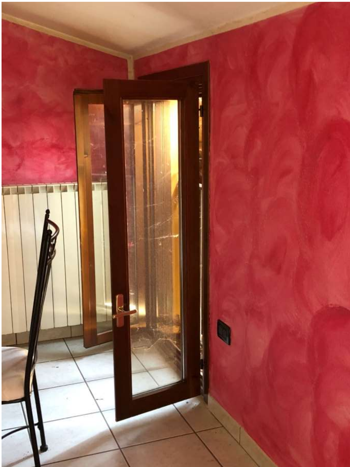
Foto 55. Particolare serramento in legno della sala