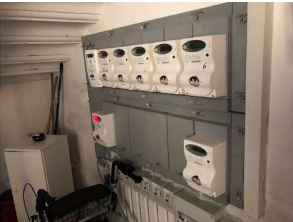
Foto 6 e 7: vano scala con contatori energia elettrica dei vari appartamenti