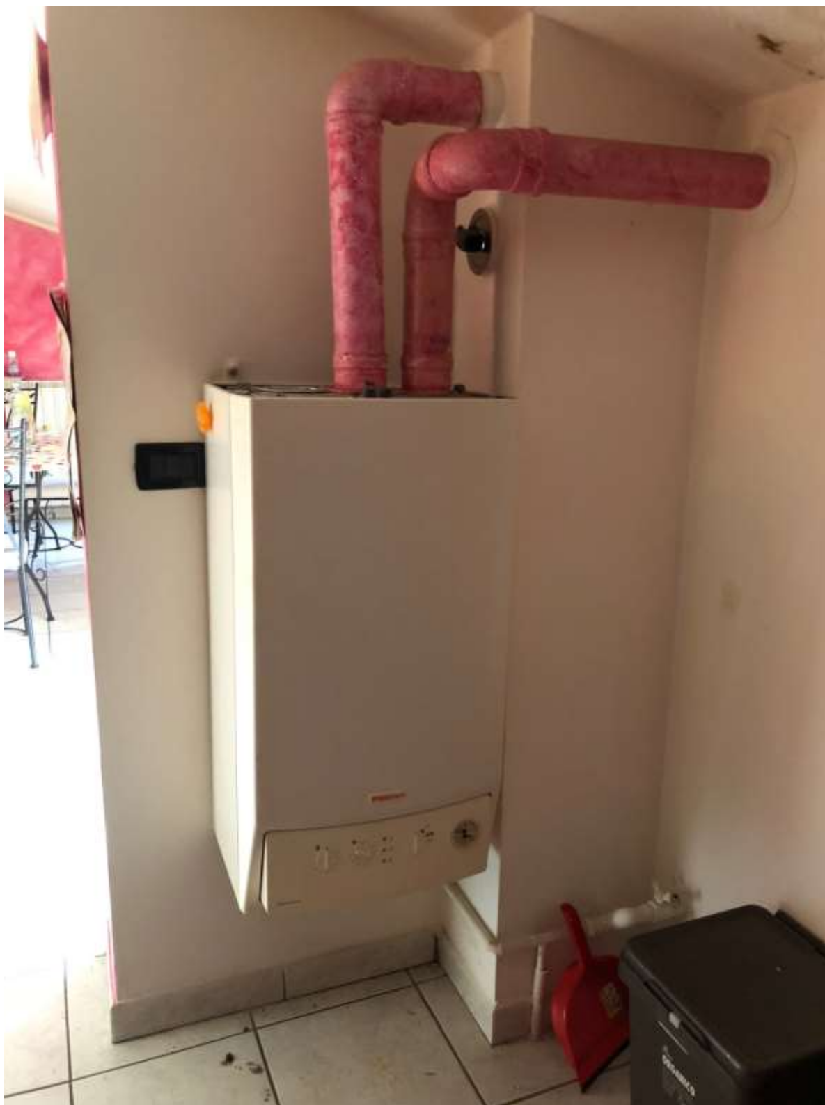
Foto 31. caldaia