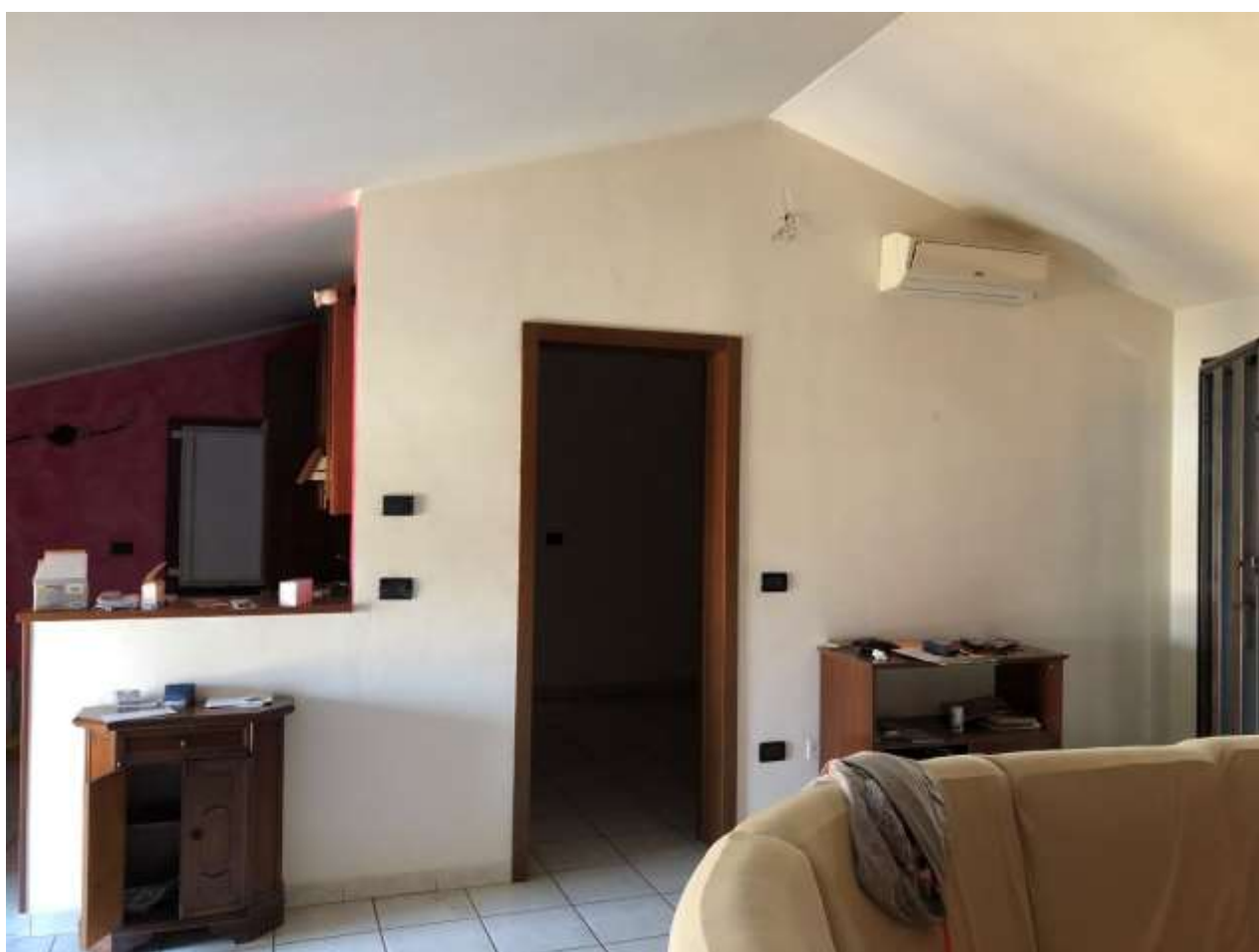
Foto 24 e 25: vano cucina collegata alla sala e porta di accesso alla zona notte