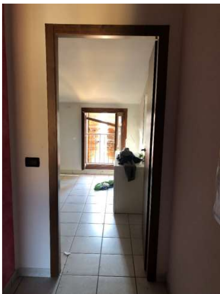
Foto 43 e 44: vedute camera da letto ad ovest e porta di ingresso