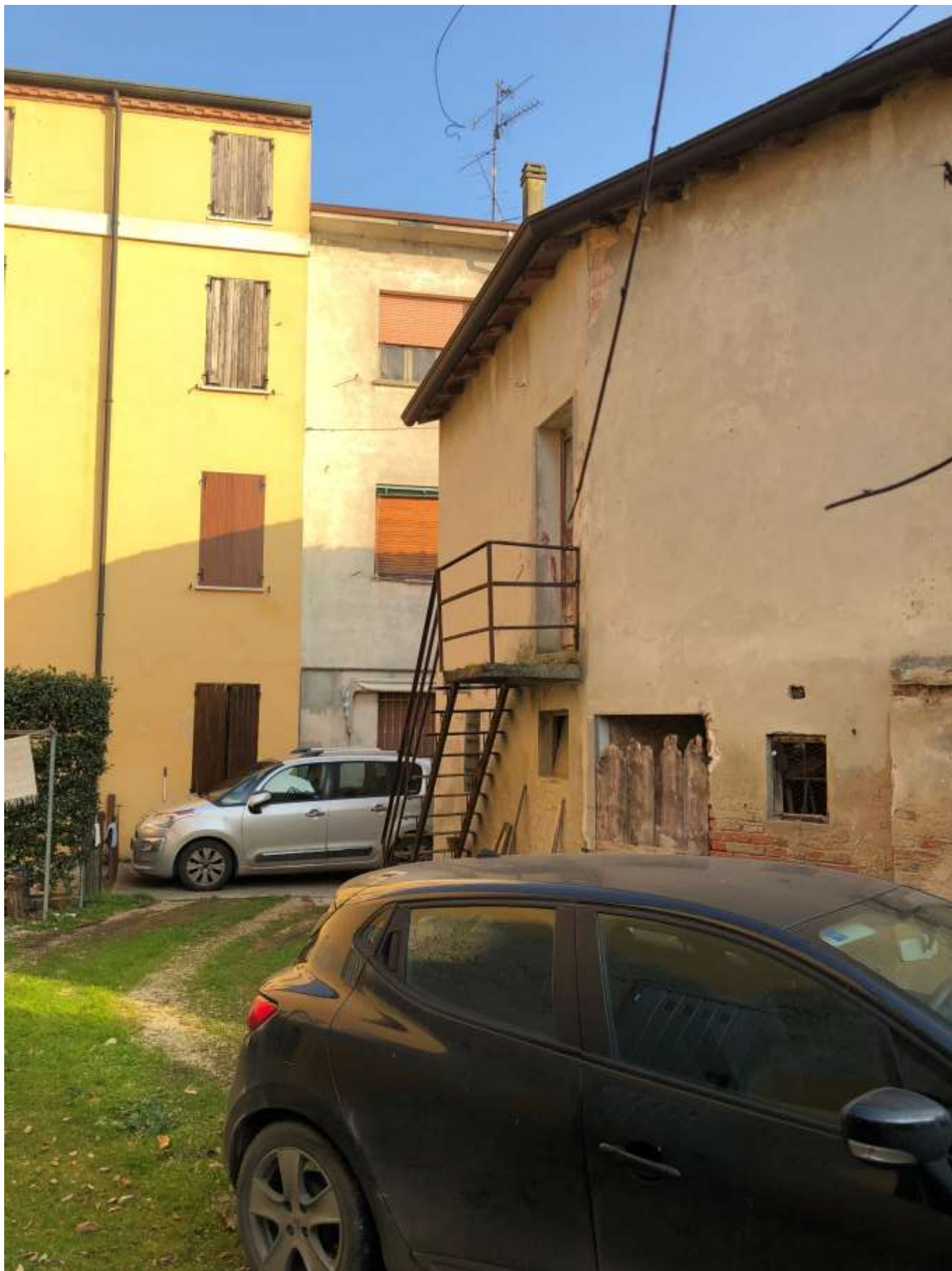
Foto 72: veduta del cortile BCNC ft 7 mapp. 105 con palazzina gialla in esame