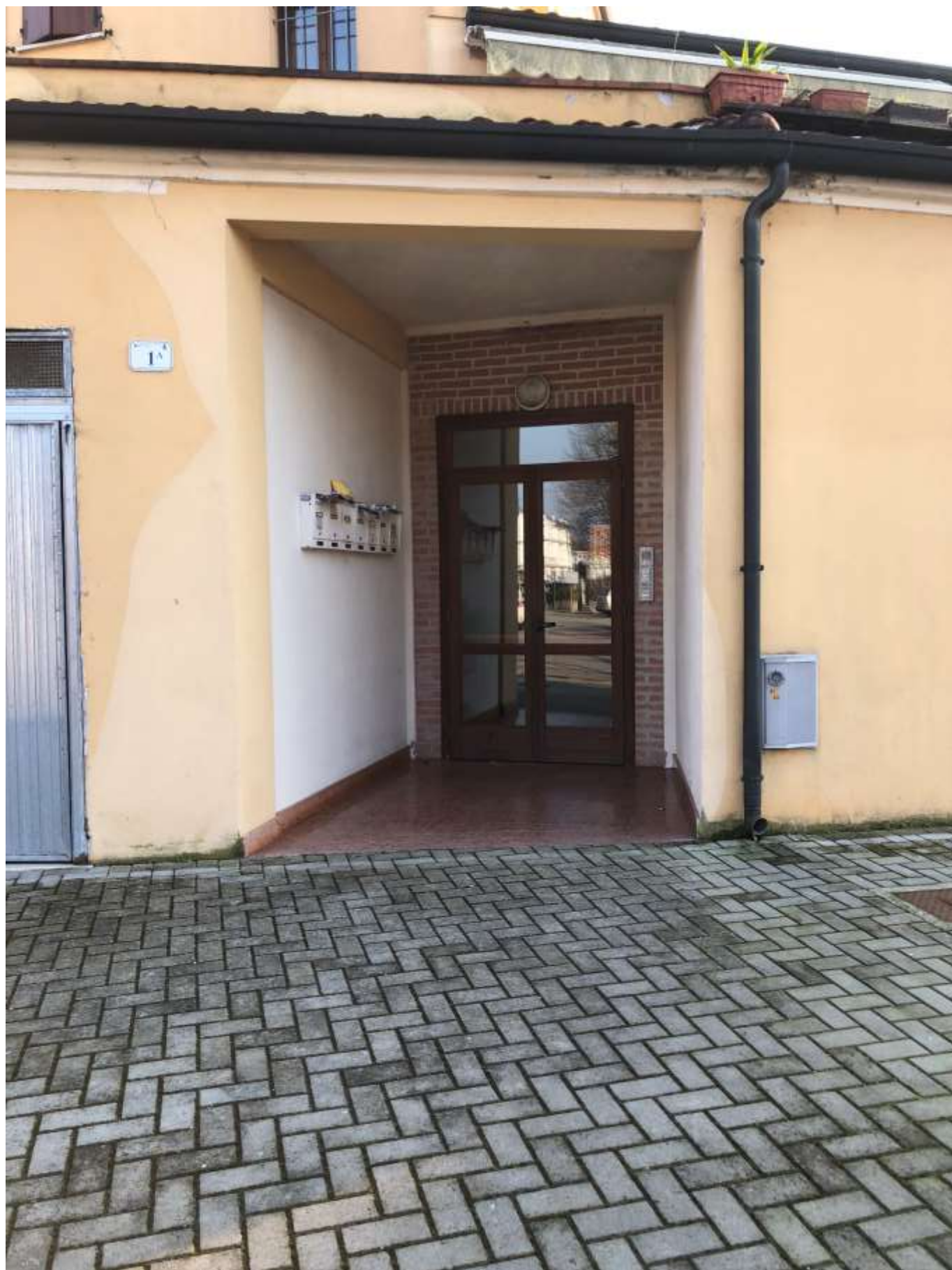
Foto 93: ingresso al palazzo, civico 1 a di largo onorevole Bruno Vincenzi con ampio marciapiede antistante