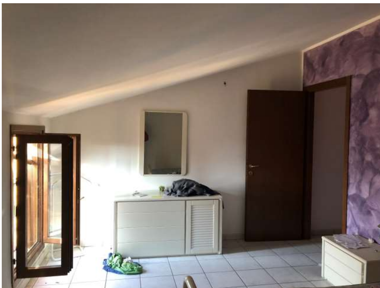
Foto 41 e 42: altre vedute della camera da letto ad ovest sul cortile comune