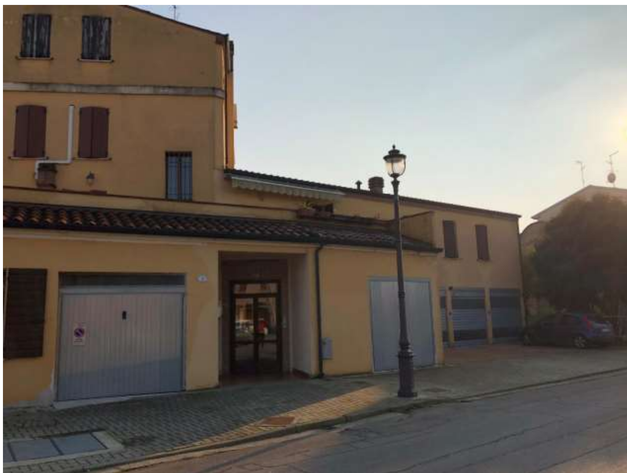
Foto 77 e 78: altre vedute della palazzina lato nord – ovest e nord con ingresso