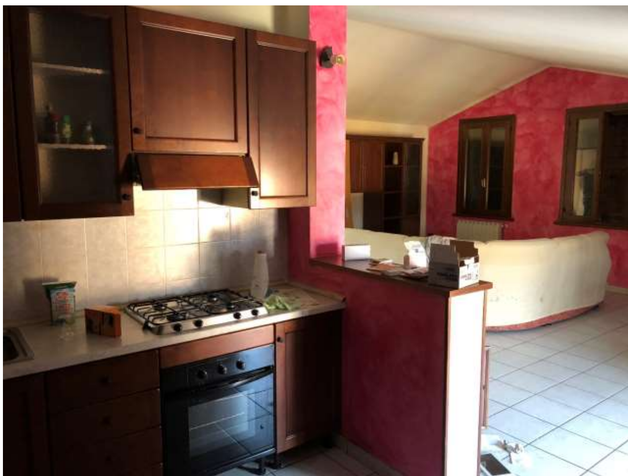
Foto 32 e 33: veduta della sala dalla cucina e particolare caldaia