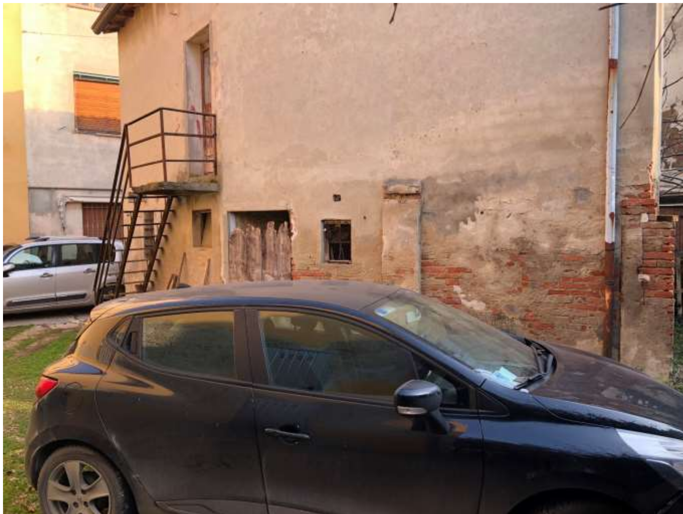
Foto 71. Veduta cortile bene comune non censibile di cui al fg 7 mappale 105