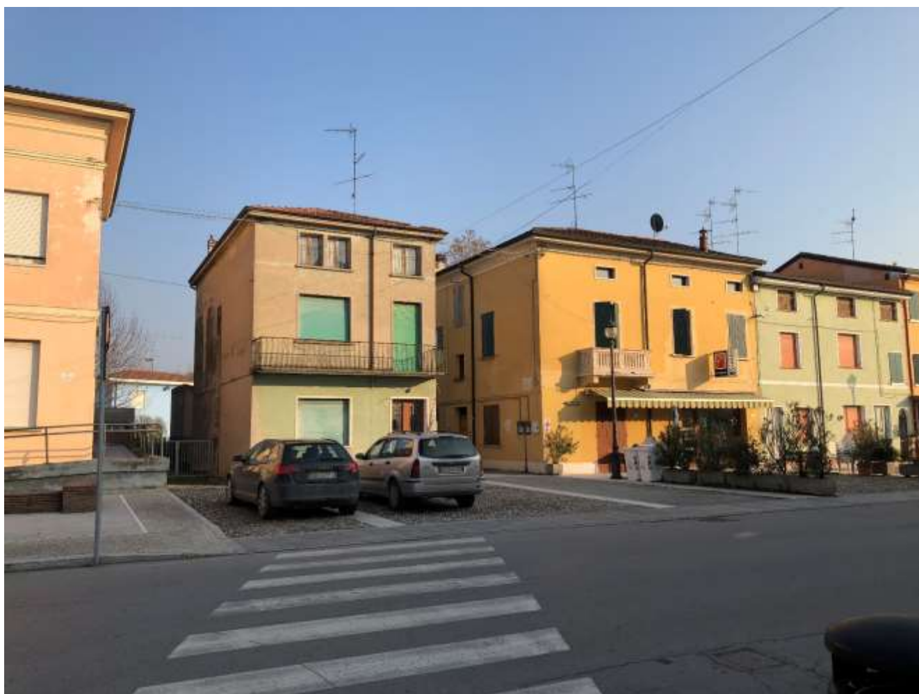
Foto 90 e 91: altre immagini di largo onorevole Bruno Vincenzi e via C. Battisti