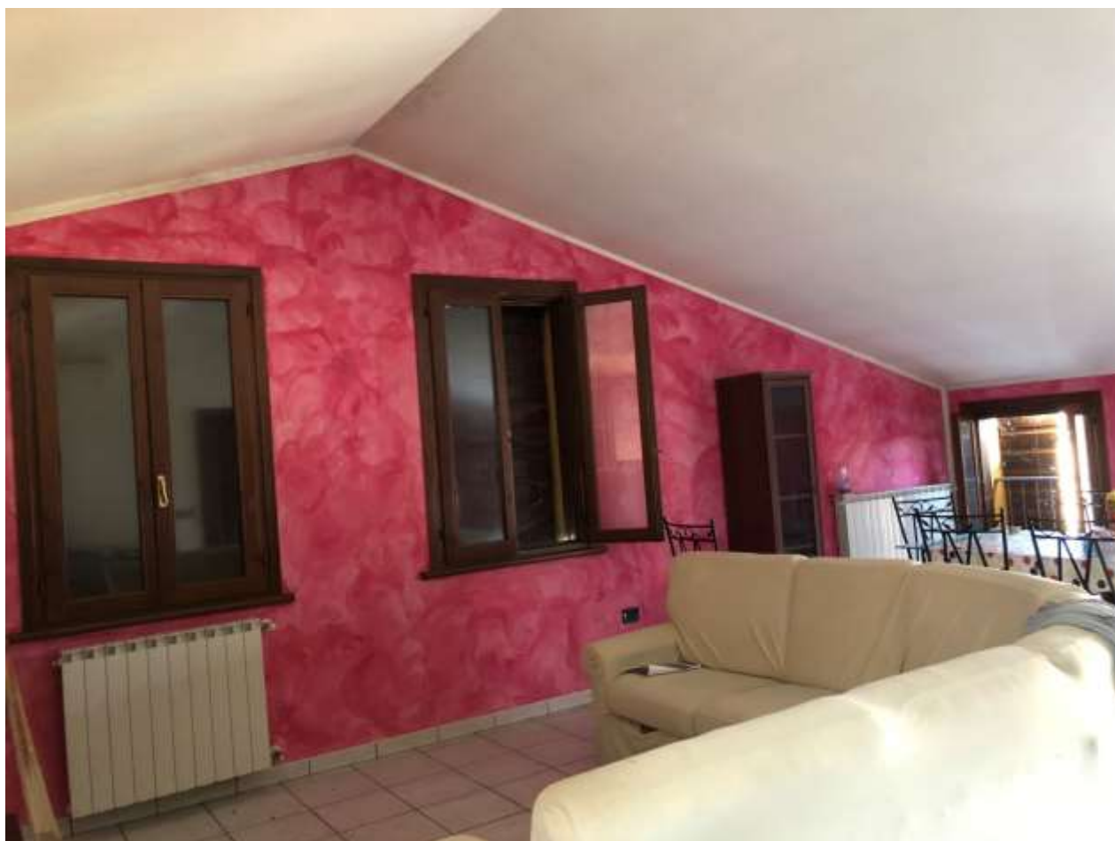
Foto 18 e 19: sala con finestre su fronte est (via Cesare Battisti) e fronte nord (largo onorevole Bruno Vincenzi)