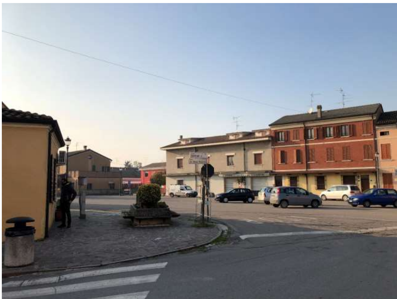
Foto 87 e 88: veduta di via Cesare Battisti e largo onorevole Bruno Vincenzi