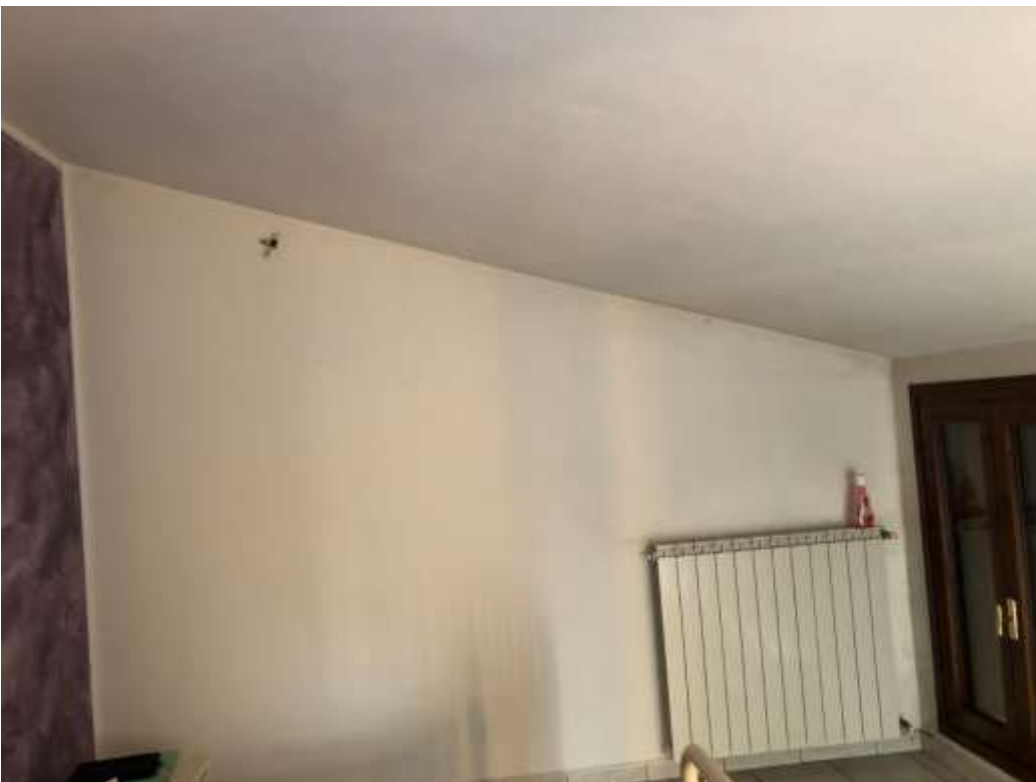
Foto 48 e 49: camera da letto ad ovest con fenomeni di umidità sulle pareti