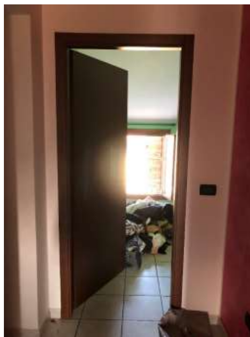
Foto 34 – 35 e 36: camera da letto ad est su via Cesare Battisti e porta di ingresso