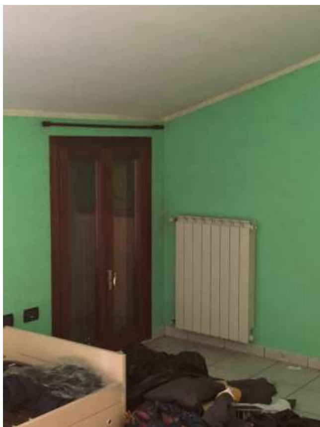
Foto 47 e 48: camera da letto ad ovest ed est con fenomeni di umidità sulle pareti