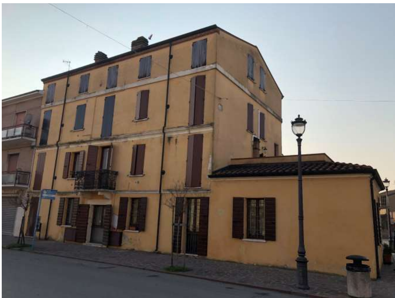
Foto 1 e 2: vedute della palazzina da largo onorevole Bruno Vincenzi e da via Cesare Battisti