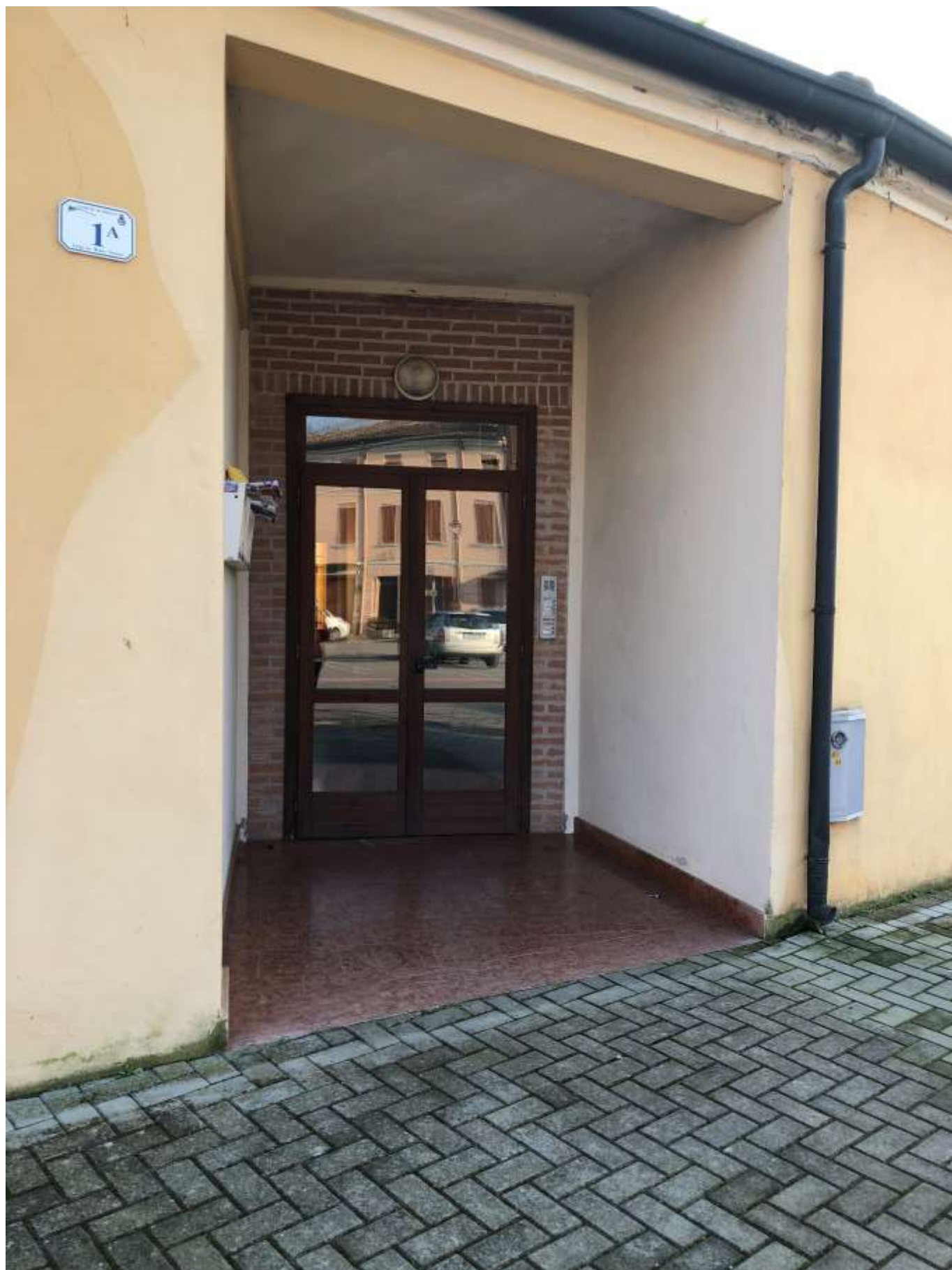
Foto 64. Veduta di ingresso al palazzo