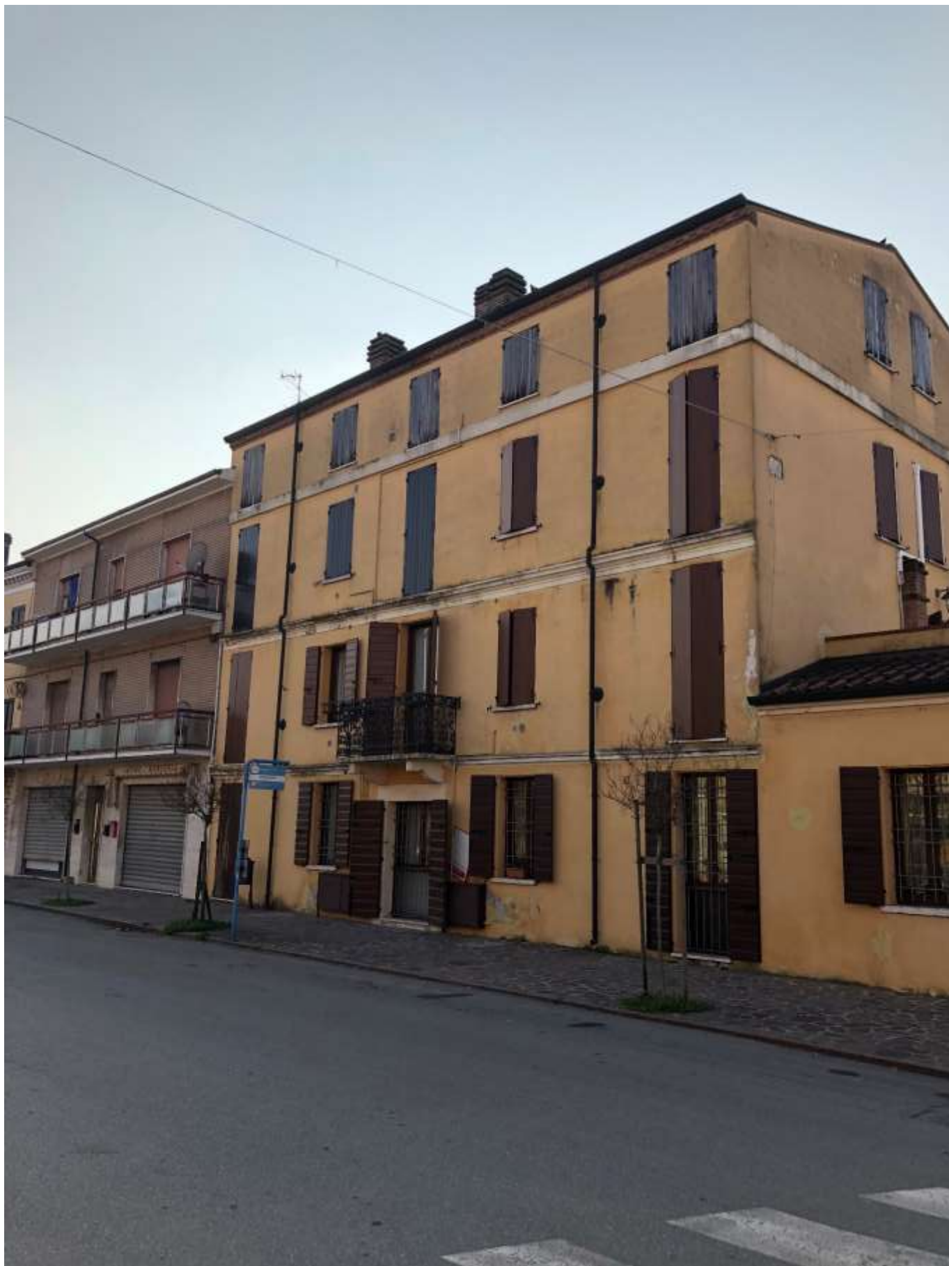
Foto 82: veduta del palazzo su via Cesare Battisti – appartamento quarto piano in oggetto