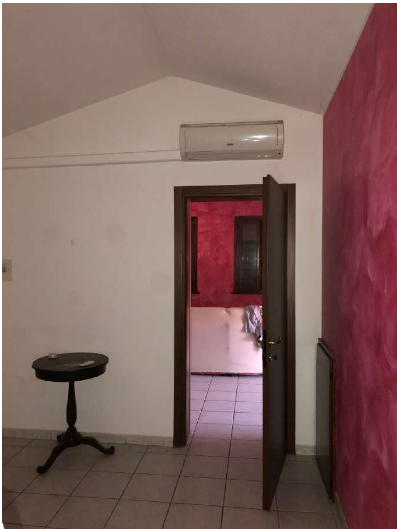
Foto 50: corridoio a servizio della zona notte con accesso dalla sala