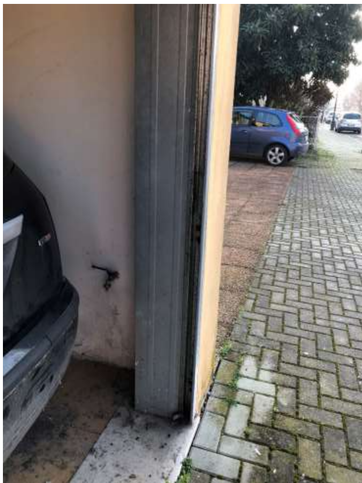
Foto 68 e 69: autorimessa con basculante in metallo e presa d'acqua interna al locale