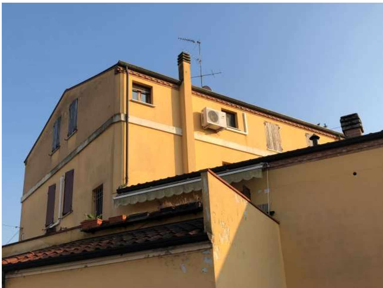
Foto 75 e 76: autorimesse a servizio degli appartamenti sul fronte ovest e veduta del quarto piano