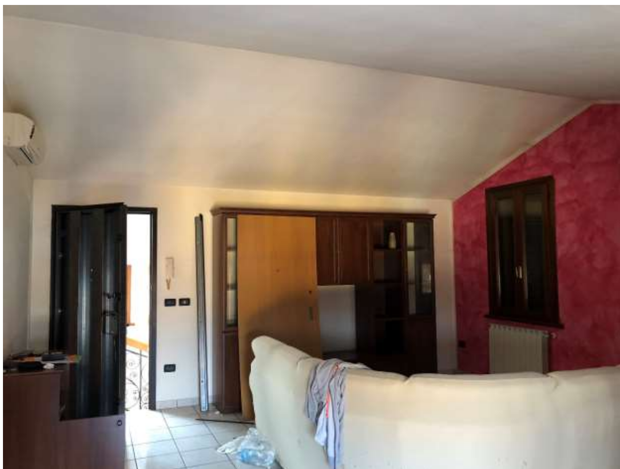
Foto 20 e 21: altre vedute della sala con tetto inclinato e portoncino di ingresso