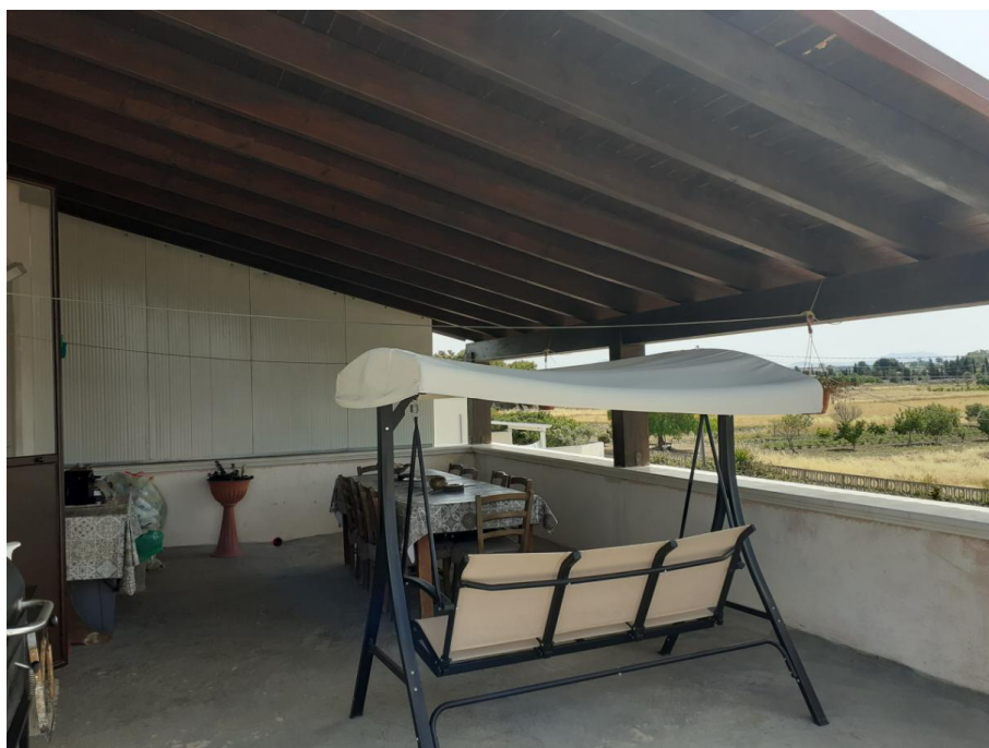
Foto n. 20 Vista della tettoia