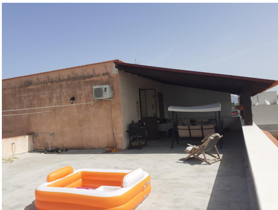
Foto n. 19 Vista della terrazza e della tettoia p.p.