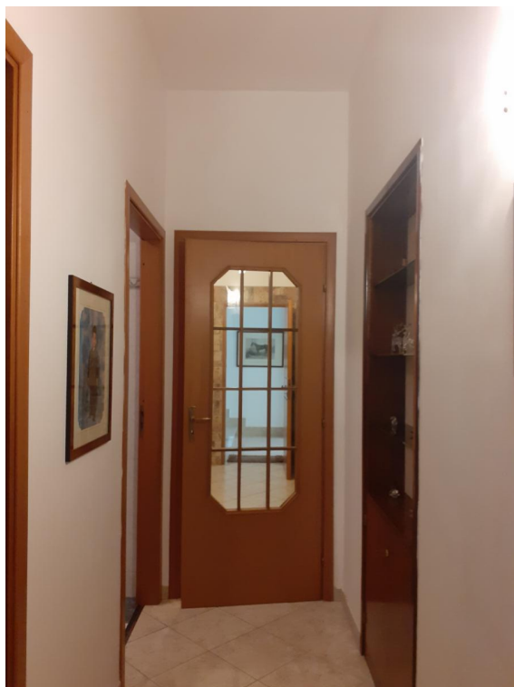
Foto n. 12 altra Vista corridoio p. t.