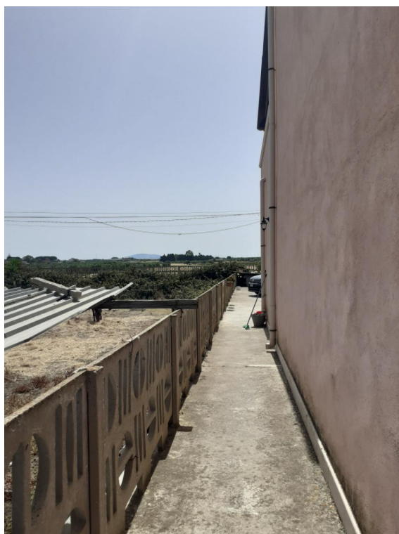
Foto n. 16 Vista aree di pertinenza p. t.