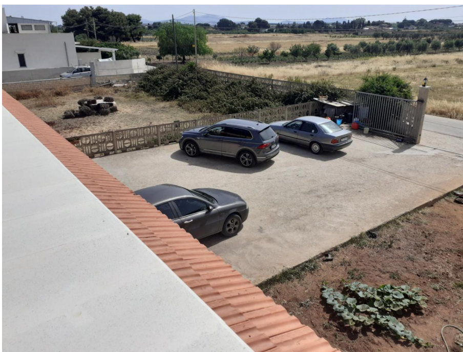
Foto n. 22 altra vista panoramica dalla terrazza