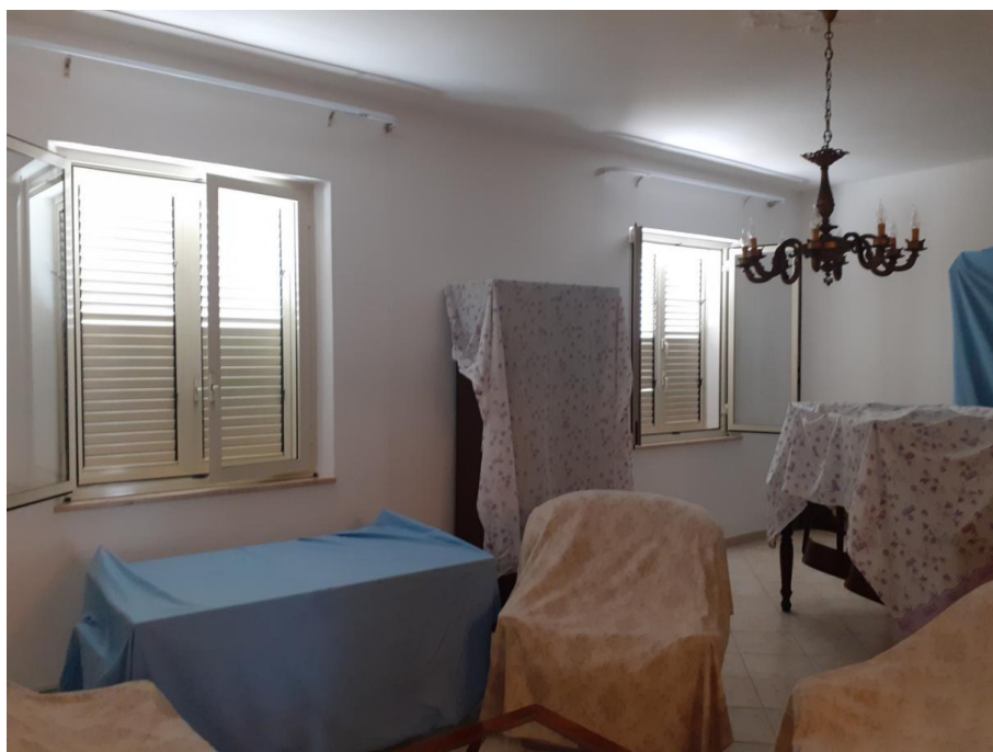
Foto n. 5 vista salone p.t.