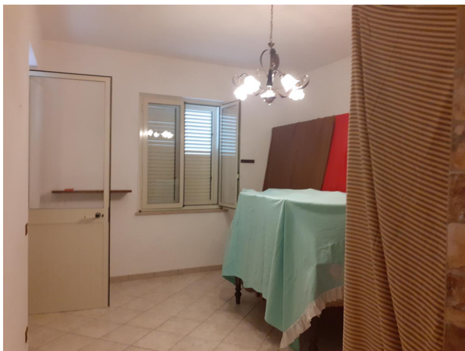
Foto n. 13 Vista cucina p. t.