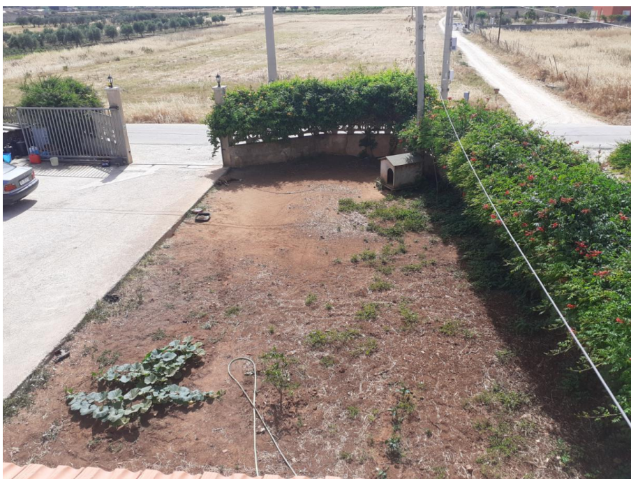
Foto n. 21 Vista panoramica dalla terrazza