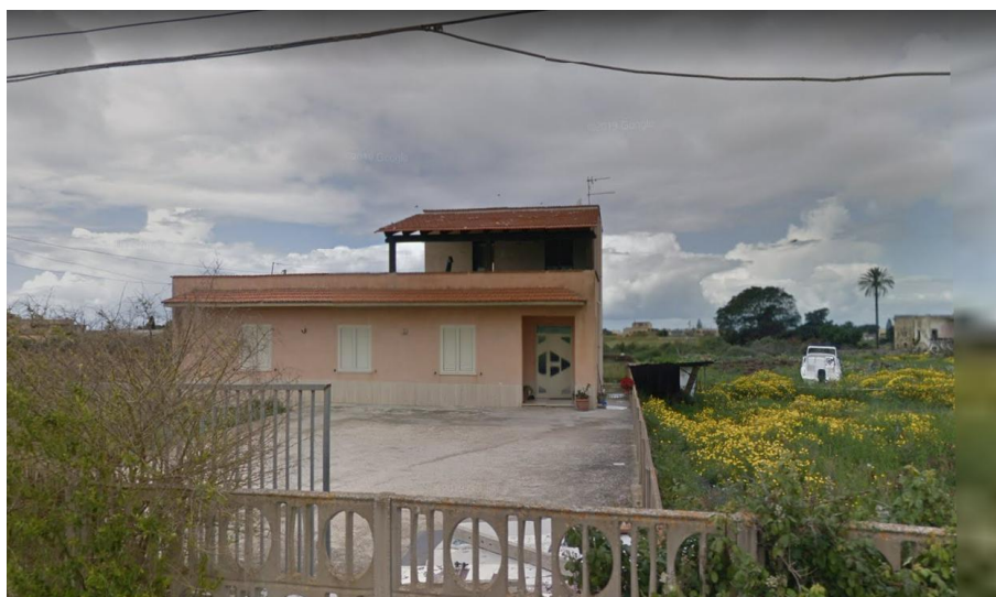
Foto n. 2 Vista immobile da strada Ballottella