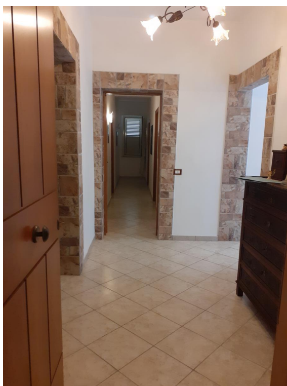
Foto n. 4 Vista ingresso piano terra