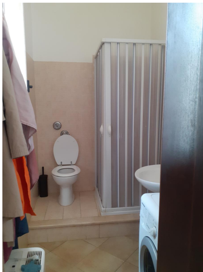
Foto n. 18 Vista wc p.p.