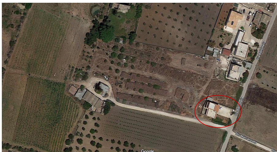
Foto n. 1 Vista dall'alto dell' immobile