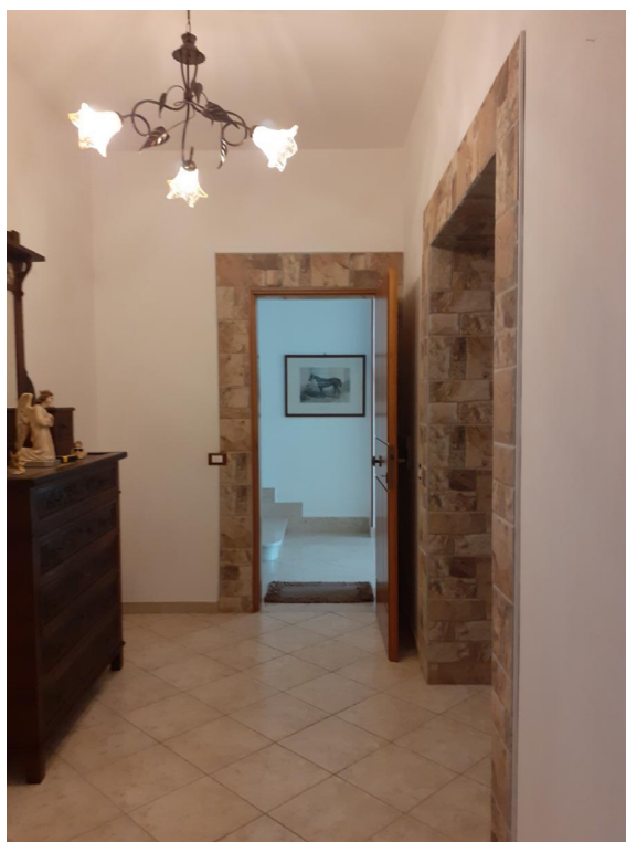
Foto n. 6 altra vista ingresso