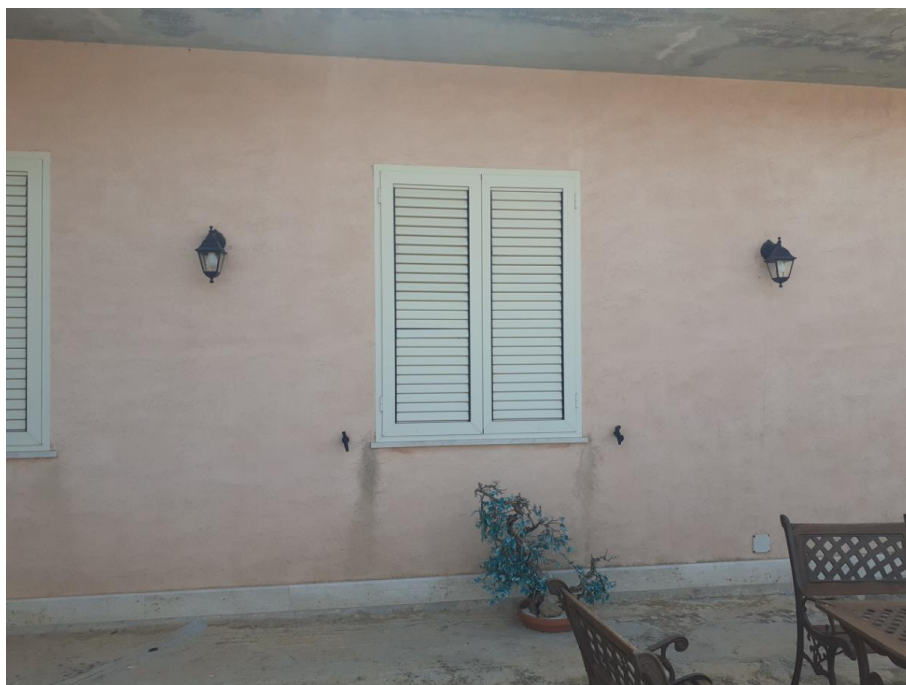
Foto n. 14 Vista veranda scoperta p. t.