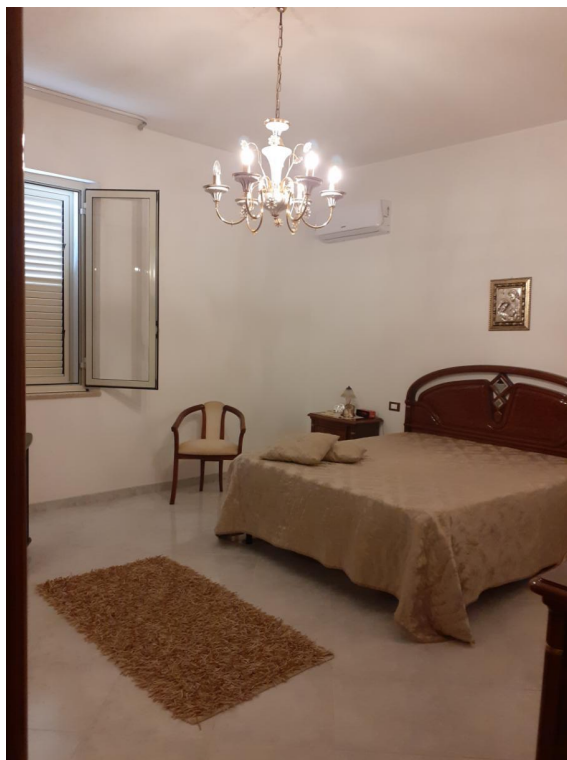
Foto n. 11 Vista camera matrimoniale p. t.