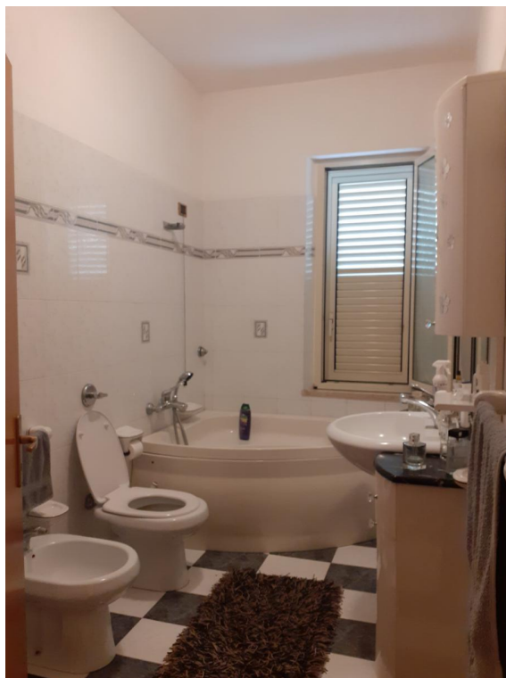
Foto n. 7 Vista bagno p. t.