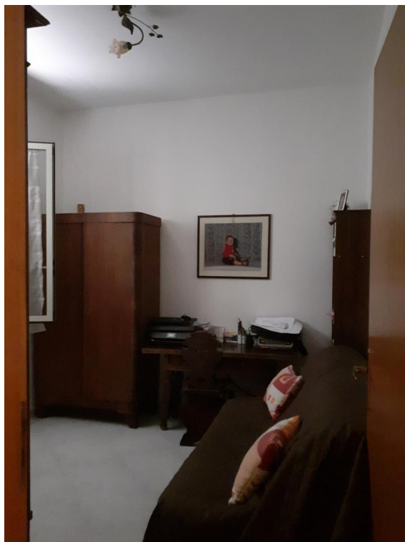
Foto n. 9 Vista studio p. t.