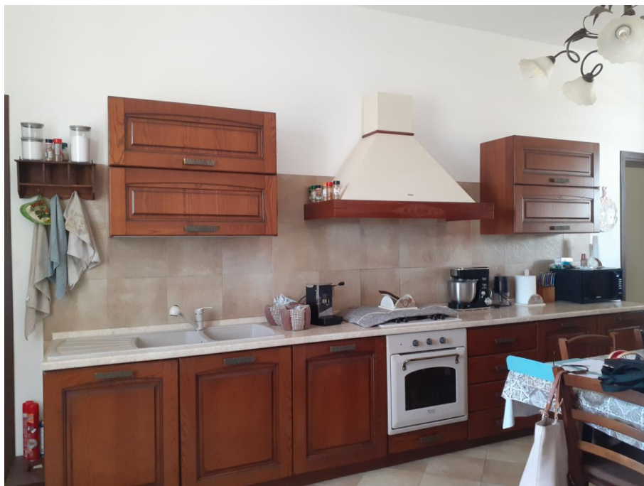
Foto n. 17 Vista cucina p.p.