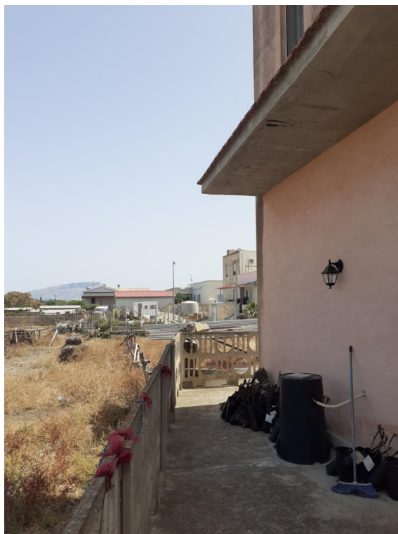
Foto n. 15 Vista aree di pertinenza p. t.