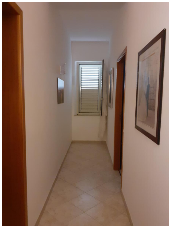
Foto n. 10 Vista corridoio p. t.