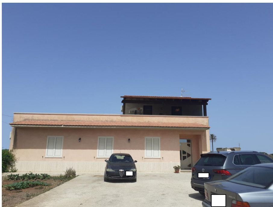
Foto n. 23 vista prospetto principale- veranda- area di pertinenza - area vincolata a parcheggio