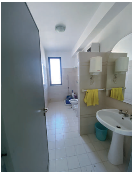
Foto 43. Porzione di piano terra adibita ad ufficio.