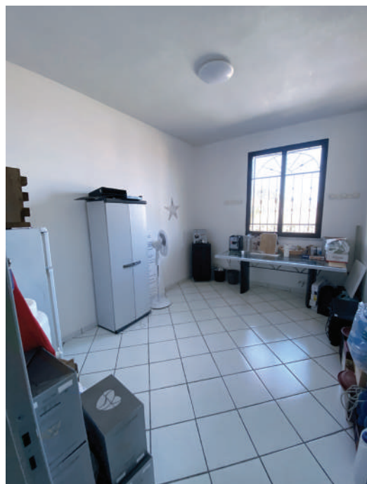
Foto 44. Porzione di piano terra adibita ad ufficio.