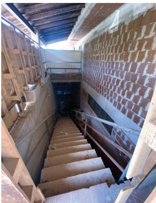
Foto 31. Scala di collegamento, tra piano seminterrato e piano terra, posta nell'intercapedine chiusa.