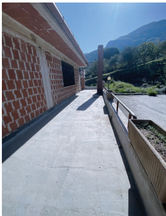
Foto 11. Terrazzo antistante la porzione di piano terra adibita a magazzino.