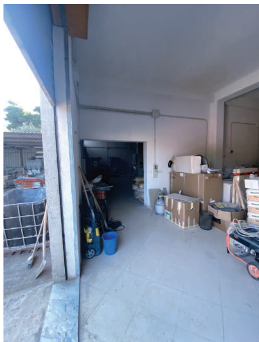
Foto 16. Piano seminterrato, Vano 2.