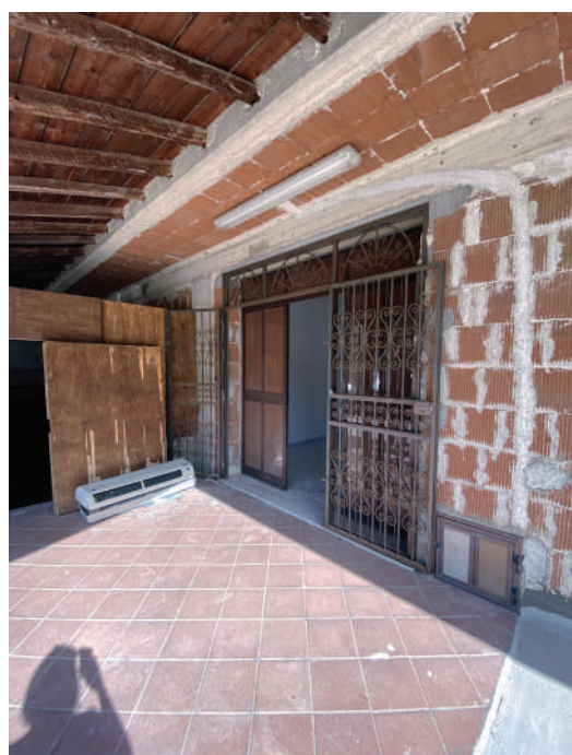
Foto 32. Accesso alla porzione di piano terra adibita a magazzino/artigianale.