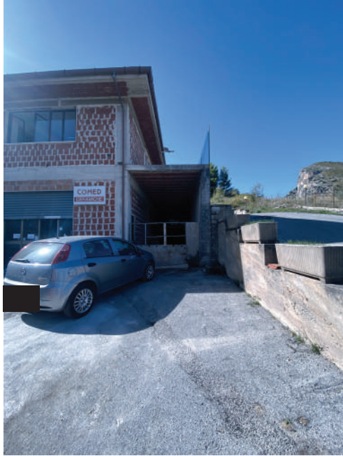
Foto 5. Piazzale piano seminterrato.

ALLEGATO A: DOCUMENTAZIONE FOTOGRAFICA LOTTO UNICO