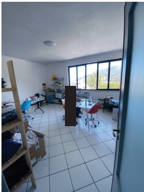
Foto 41. Porzione di piano terra adibita ad ufficio.

ALLEGATO A: DOCUMENTAZIONE FOTOGRAFICA LOTTO UNICO