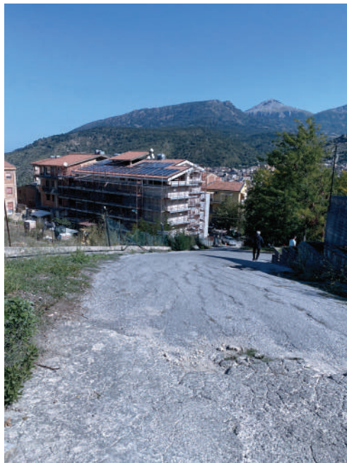
Foto 1. Strada di accesso al lotto.

ALLEGATO A: DOCUMENTAZIONE FOTOGRAFICA LOTTO UNICO