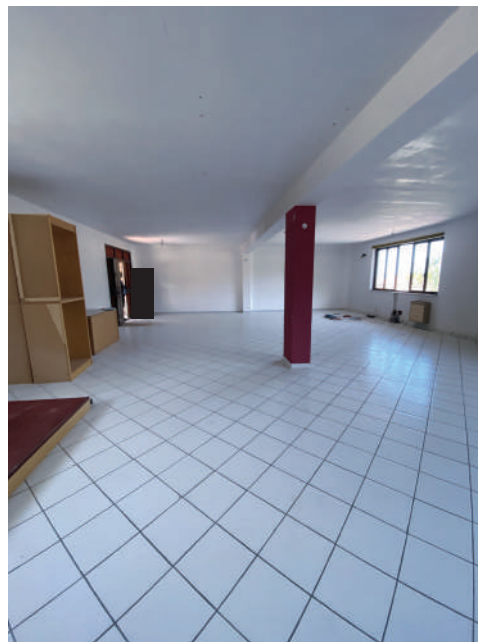
Foto 34. Porzione di piano terra adibita a magazzino/artigianale.