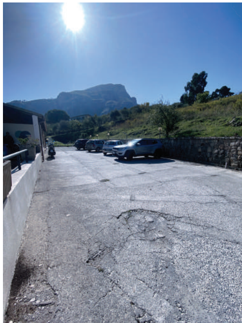
Foto 9. Piazzale piano terra.

ALLEGATO A: DOCUMENTAZIONE FOTOGRAFICA LOTTO UNICO