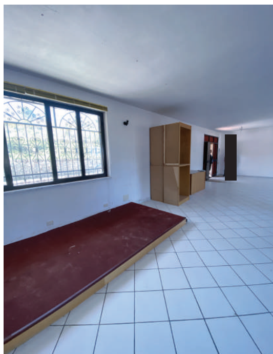
Foto 35. Porzione di piano terra adibita a magazzino/artigianale.