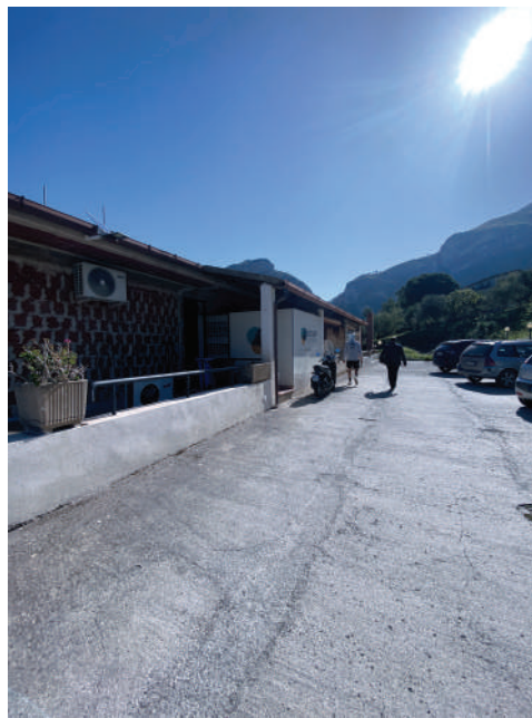
Foto 10. Piazzale piano terra.