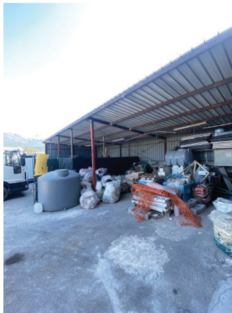
Foto 14. Tettoia.