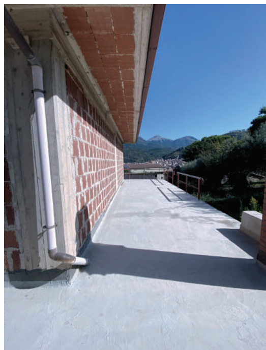
Foto 12. Terrazzo antistante la porzione di piano terra adibita a magazzino.