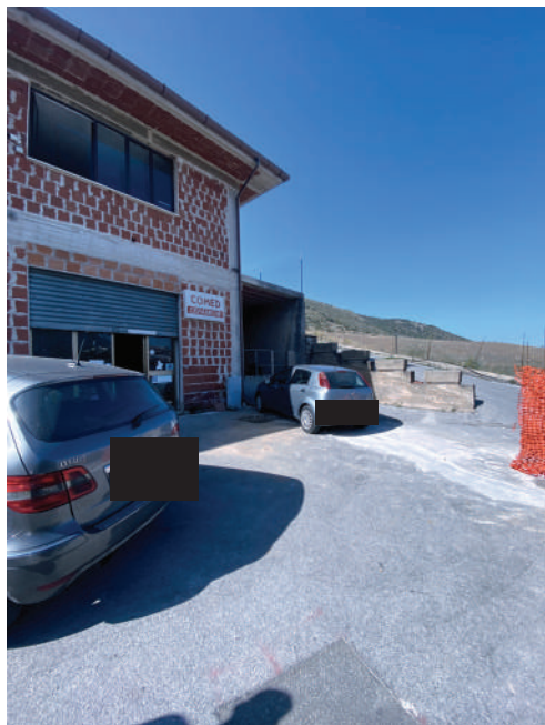
Foto 29. Piano seminterrato, piazzale.

ALLEGATO A: DOCUMENTAZIONE FOTOGRAFICA LOTTO UNICO