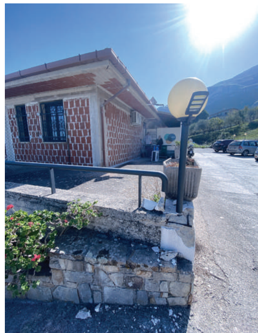
Foto 8. Prospetto laterale e piazzale piano terra.