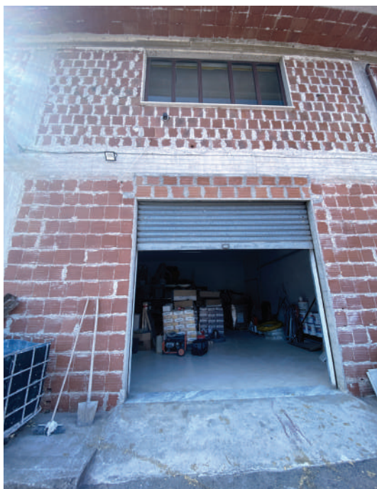
Foto 15. Accesso piano seminterrato.