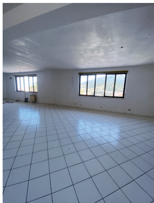
Foto 36. Porzione di piano terra adibita a magazzino/artigianale.