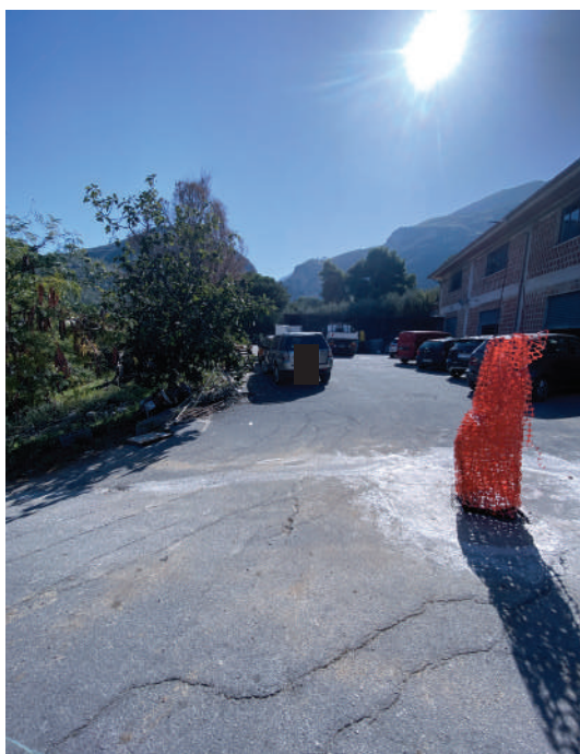
Foto 3. Strada di accesso al lotto e piazzale.