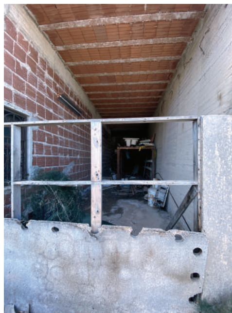
Foto 30. Piano seminterrato, porzione d'intercapedine chiusa.