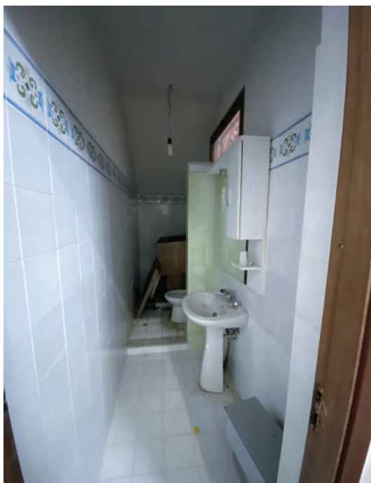
Foto 23. Piano seminterrato, Vano 2, wc.