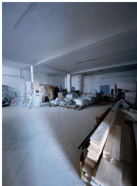
Foto 18. Piano seminterrato, Vano 1.