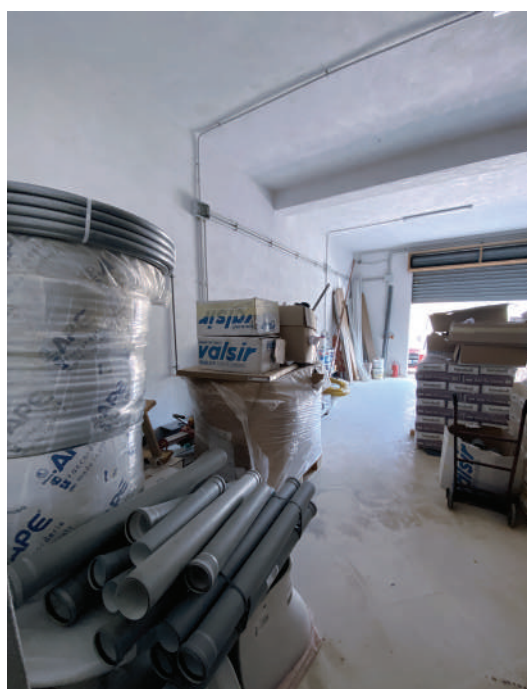
Foto 24. Piano seminterrato, Vano 2.