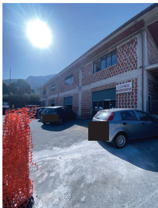
Foto 4. Piazzale piano seminterrato.