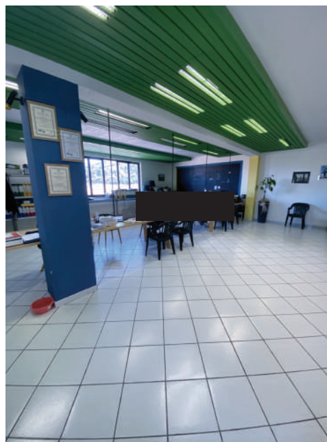
Foto 38. Porzione di piano terra adibita ad ufficio.