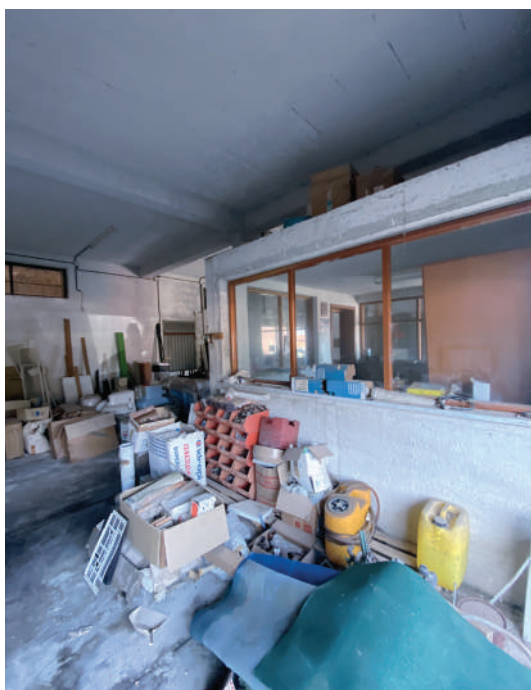
Foto 27. Piano seminterrato, Vano 3.