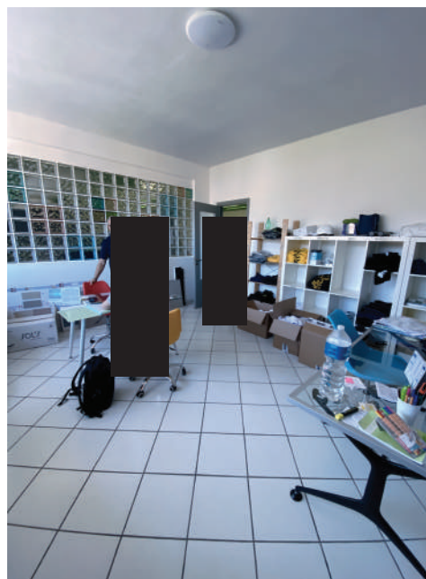
Foto 42. Porzione di piano terra adibita ad ufficio.