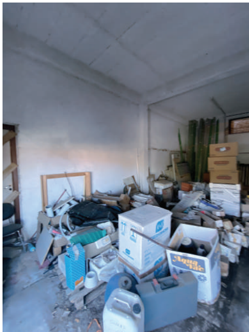
Foto 25. Piano seminterrato, Vano 3.

ALLEGATO A: DOCUMENTAZIONE FOTOGRAFICA LOTTO UNICO