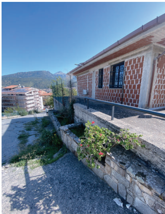
Foto 7. Prospetto laterale.