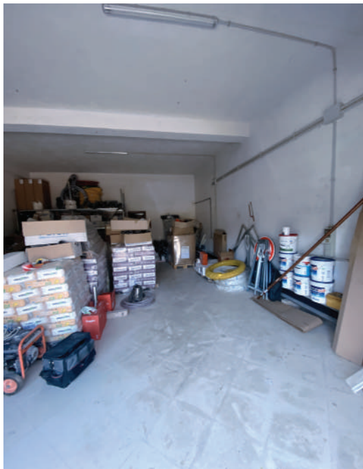
Foto 21. Piano seminterrato, Vano 2.

ALLEGATO A: DOCUMENTAZIONE FOTOGRAFICA LOTTO UNICO