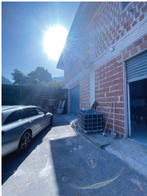
Foto 13. Accesso piano seminterrato.

ALLEGATO A: DOCUMENTAZIONE FOTOGRAFICA LOTTO UNICO