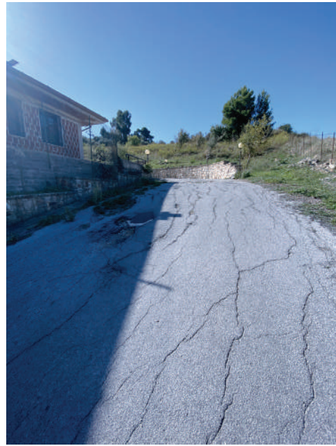
Foto 6. Strada di accesso al lotto.