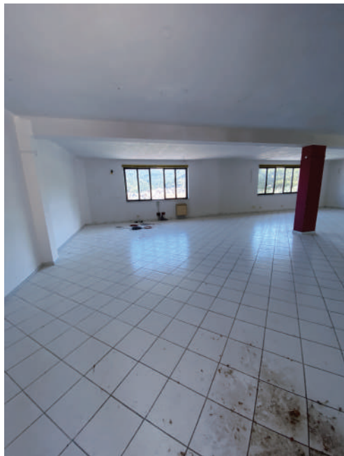
Foto 33. Porzione di piano terra adibita a magazzino/artigianale.

ALLEGATO A: DOCUMENTAZIONE FOTOGRAFICA LOTTO UNICO