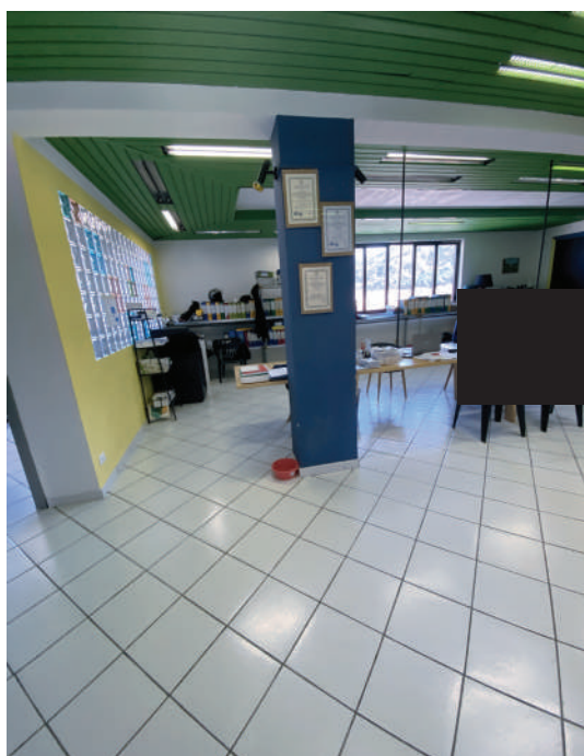
Foto 39. Porzione di piano terra adibita ad ufficio.