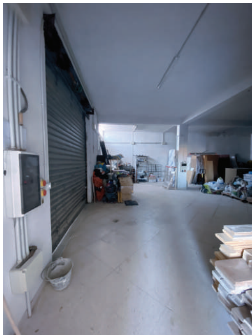
Foto 17. Piano seminterrato, Vano 1.

ALLEGATO A: DOCUMENTAZIONE FOTOGRAFICA LOTTO UNICO