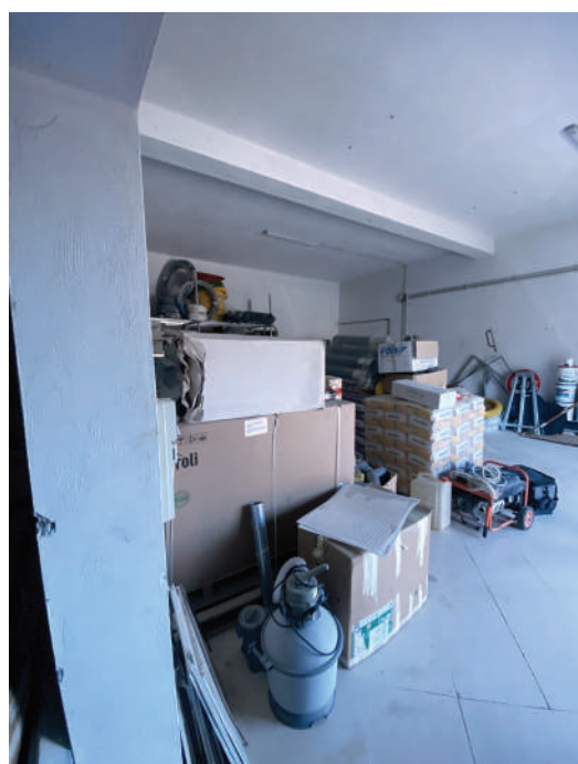
Foto 20. Piano seminterrato, Vano 2.