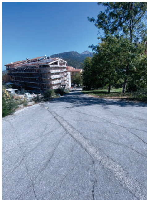
Foto 2. Strada di accesso al lotto.