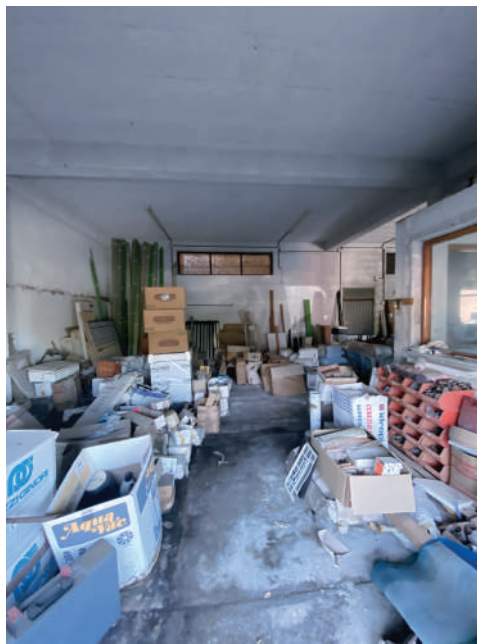
Foto 26. Piano seminterrato, Vano 3.