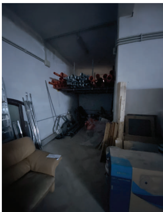
Foto 19. Piano seminterrato, Vano 1.