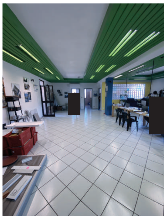
Foto 40. Porzione di piano terra adibita ad ufficio.