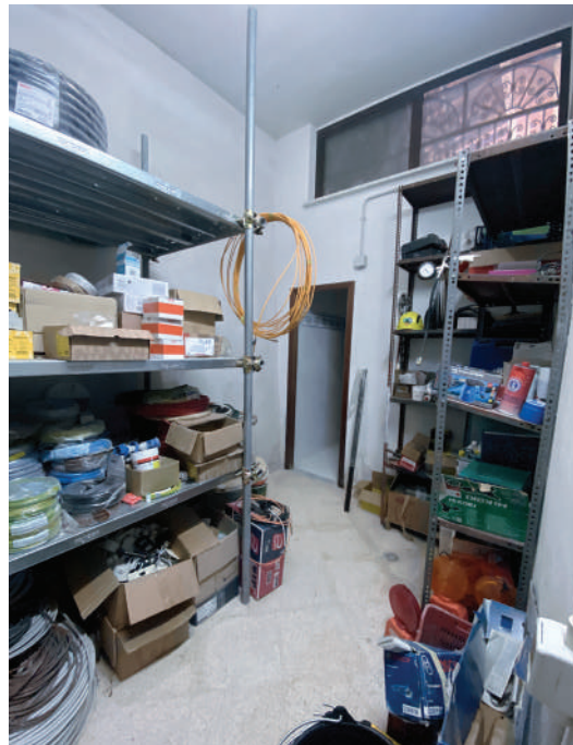
Foto 22. Piano seminterrato, Vano 2, accessori.