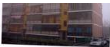
RIPRESA N. 4 Particolare alloggio in oggetto da Via Gamberi