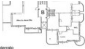
Pianta Piano Interrato n. 200