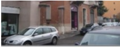
Entrata pedonale civico 16

il portale delle aste giudiziarie di case, auto e vendite fallimentari